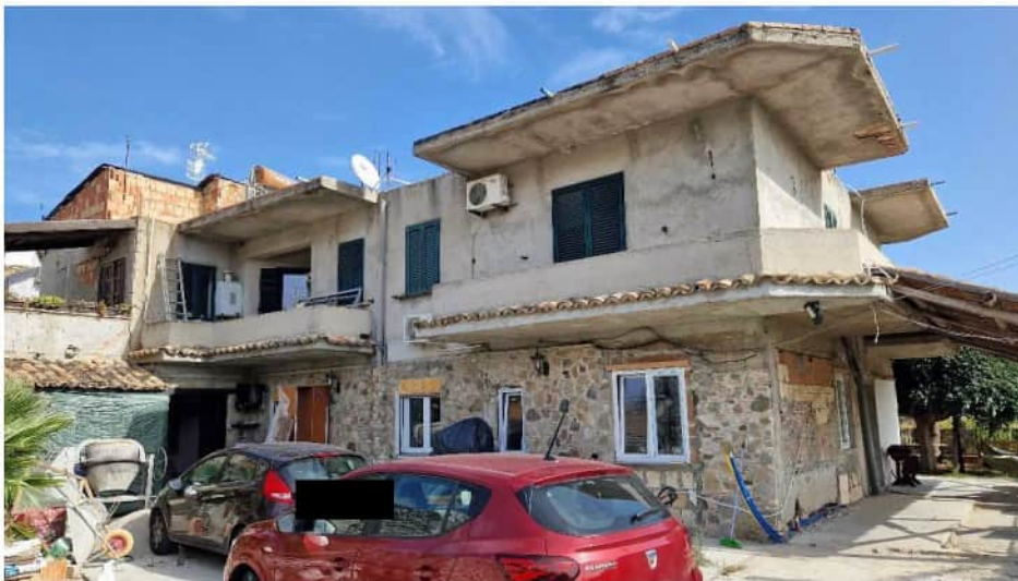
Foto n. 1 –prospetto lato sud fabbricato sede delle unità pignorate –

Le attuali condizioni degli immobili sono riprodotte nelle foto che seguono: