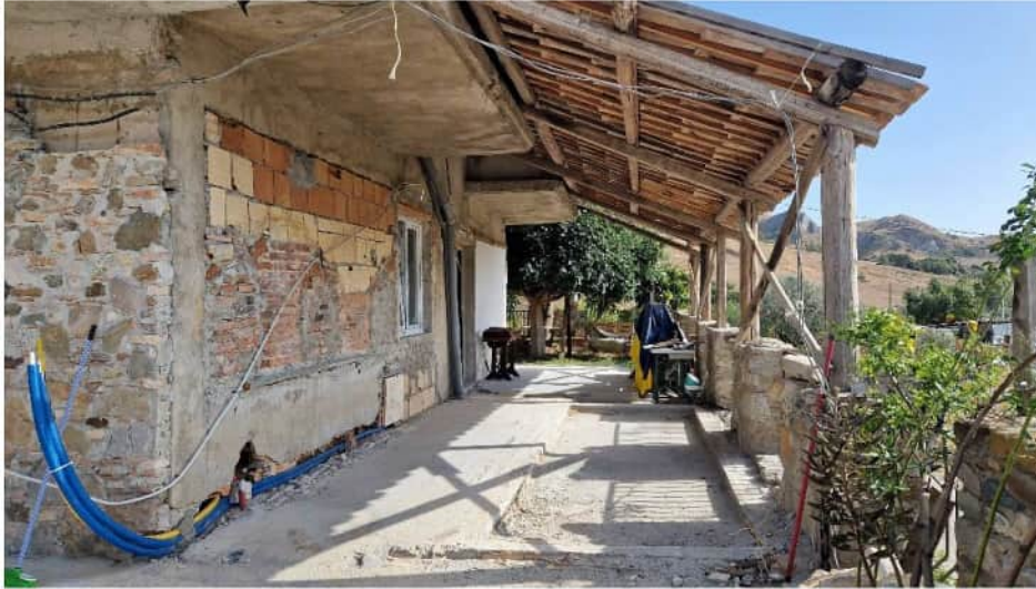
Foto n. 2 –prospetto lato sud fabbricato sede delle unità pignorate -