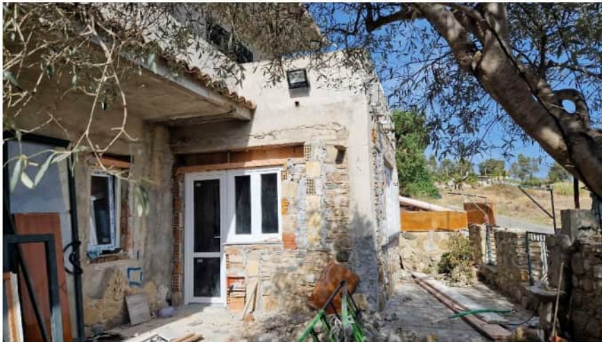
Foto n. 3 –prospetto lato est fabbricato sede delle unità pignorate –