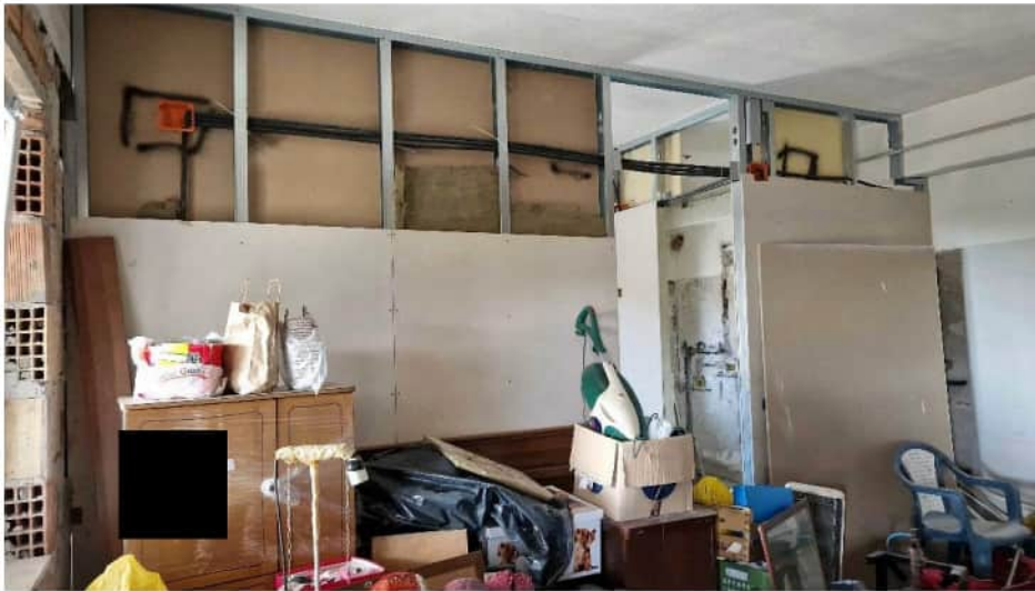
Foto n. 14 –interni porzione unità sub 10- tipologia pareti divisorie -