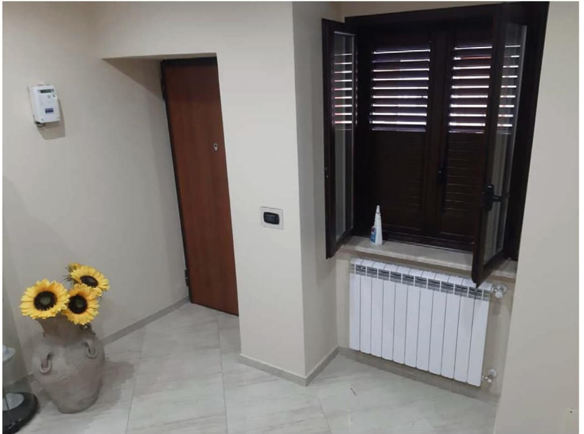
Foto n° 3 – Il vano d’ingresso – il portone, finestra e radiatore