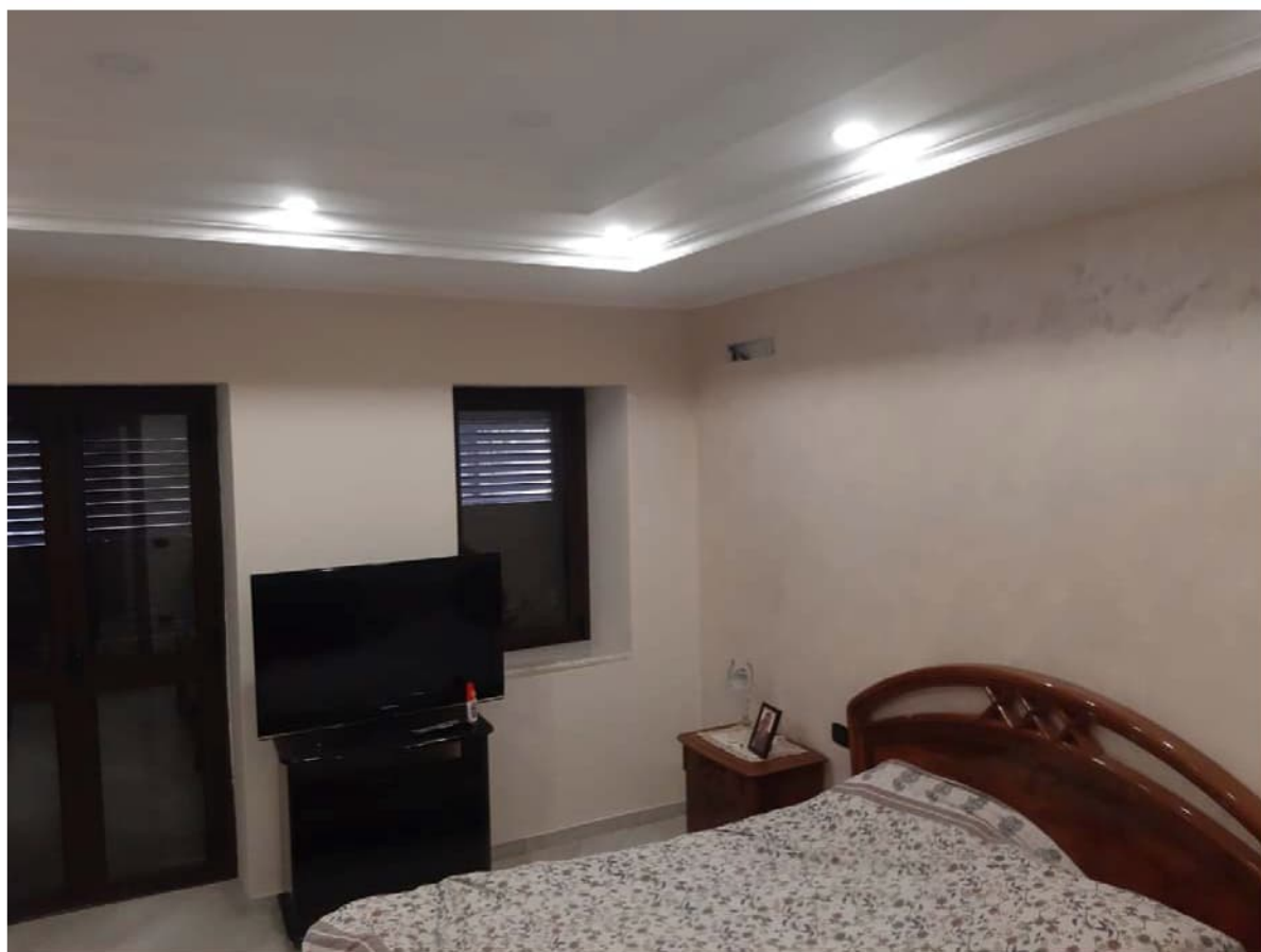
Foto n° 5 – La camera padronale al pian terreno, con le aperture esterne