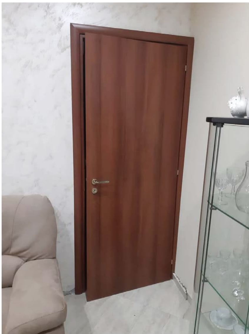
Foto n° 8 – La porta che serve l'accesso alle scale per i piani superiori