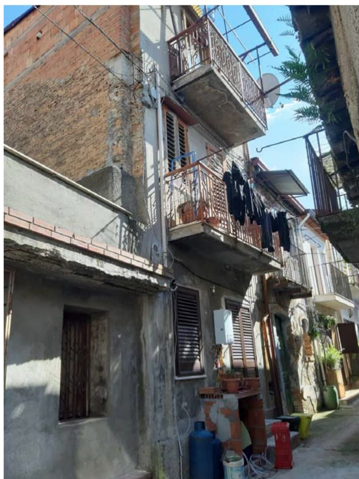
Foto n° 2 – Il fabbricato visto dal prospetto sul retro, in Vico Pesaro