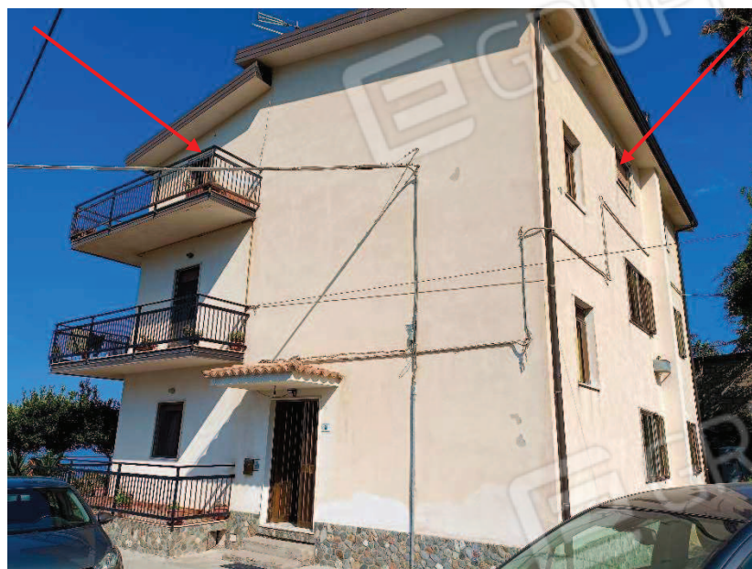
Foto n.1 – Fabbricato in cui insiste l'immobile oggetto di procedura.