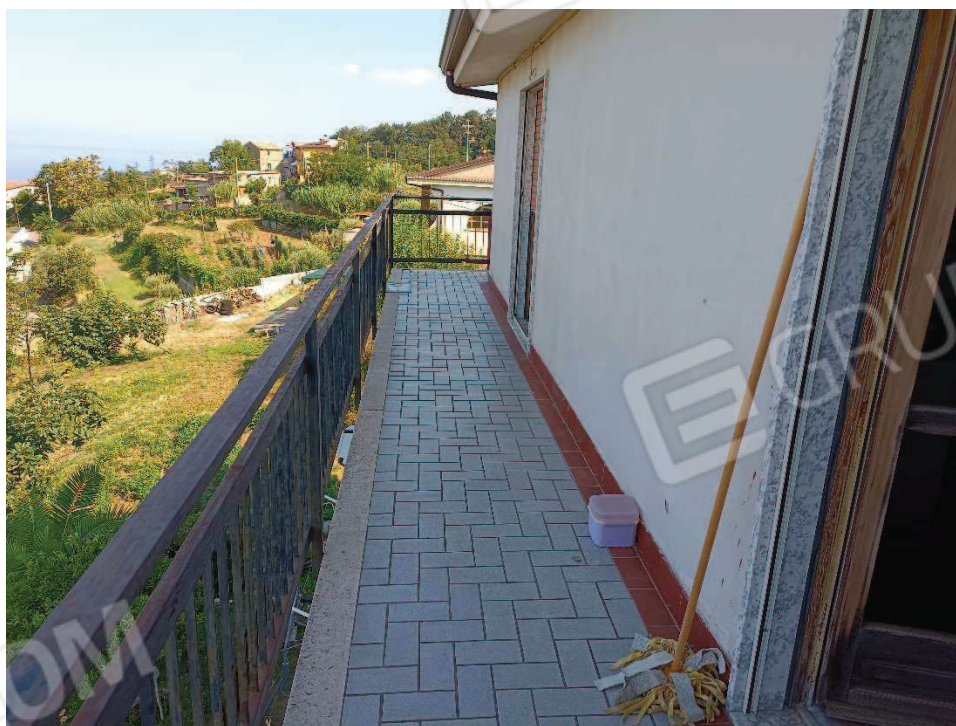
Foto n. 6 - Balcone