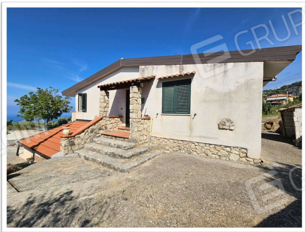
Foto 2 - Vista prospetto Sud