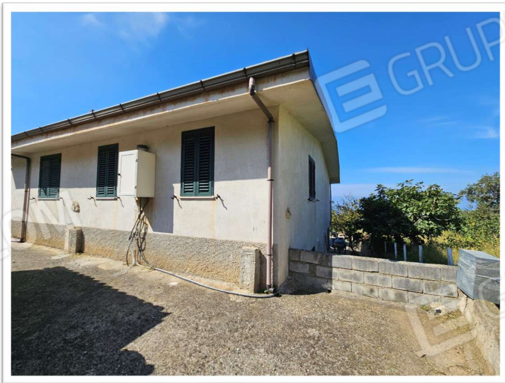
Foto 4 - Vista prospetto Nord/Est