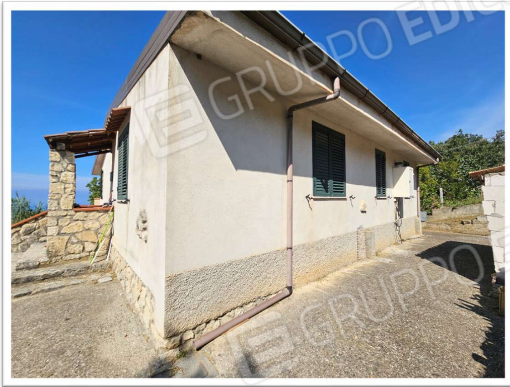
Foto 3 - Vista prospetto Est