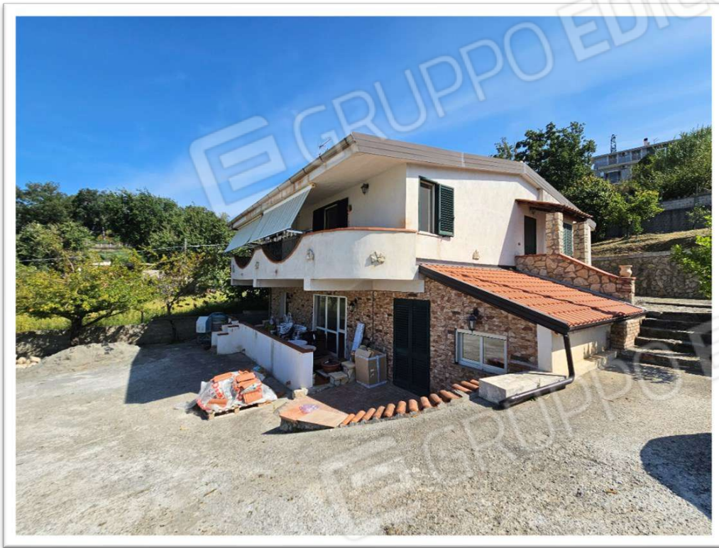
Foto 1 - Vista prospetto Sud/Ovest