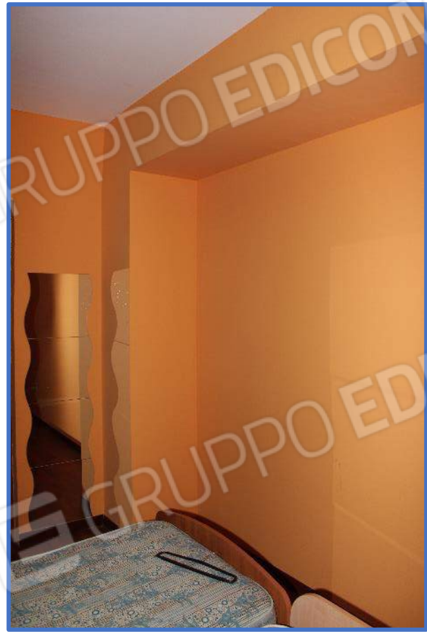
2.21, 2.22 – Sub 49 – presenza di letti e di armadio a muro, che mostrano un utilizzo improprio a camera letto