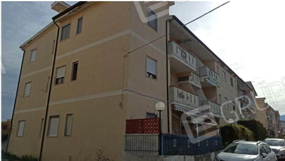
Foto n° 2 – Fabbricato in cui insiste l'immobile oggetto di perizia