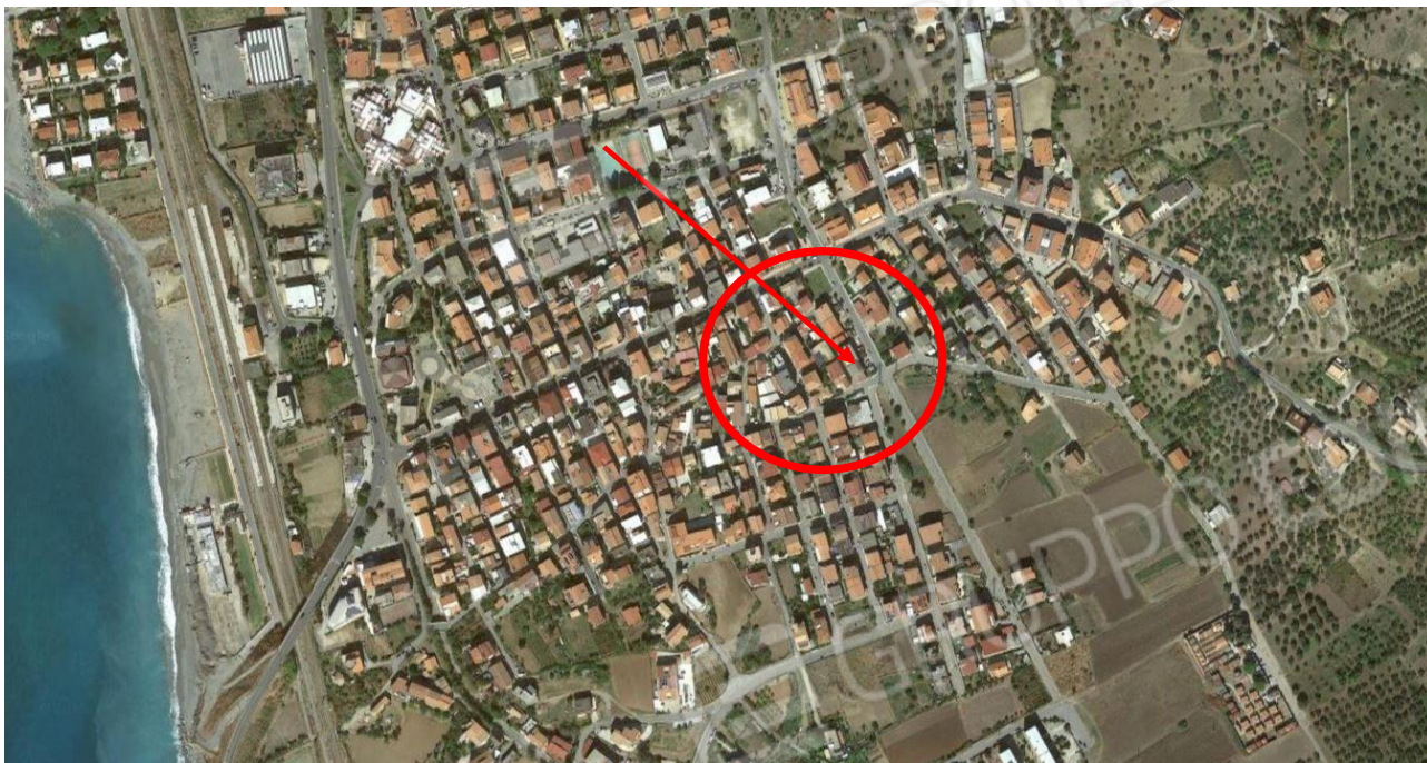
Immagine n.1: foto aerea con inquadramento dell'immobile di interesse