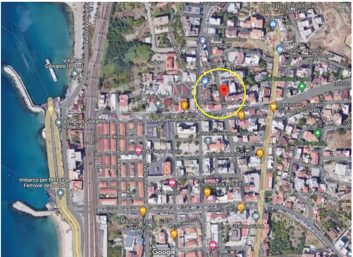
Foto 1: Inquadramento terr. condomino "Le Palme" Via Micene 58 Villa San Giovanni