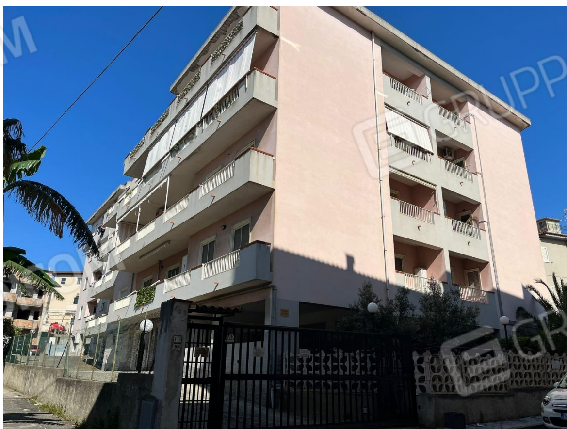
Foto 4: Vista condominio "Le Palme" Via Micene 58 Villa San Giovanni