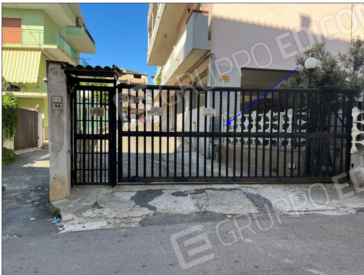
Foto 5: Vista ingresso condominio "Le Palme" Via Micene 58 Villa San Giovanni