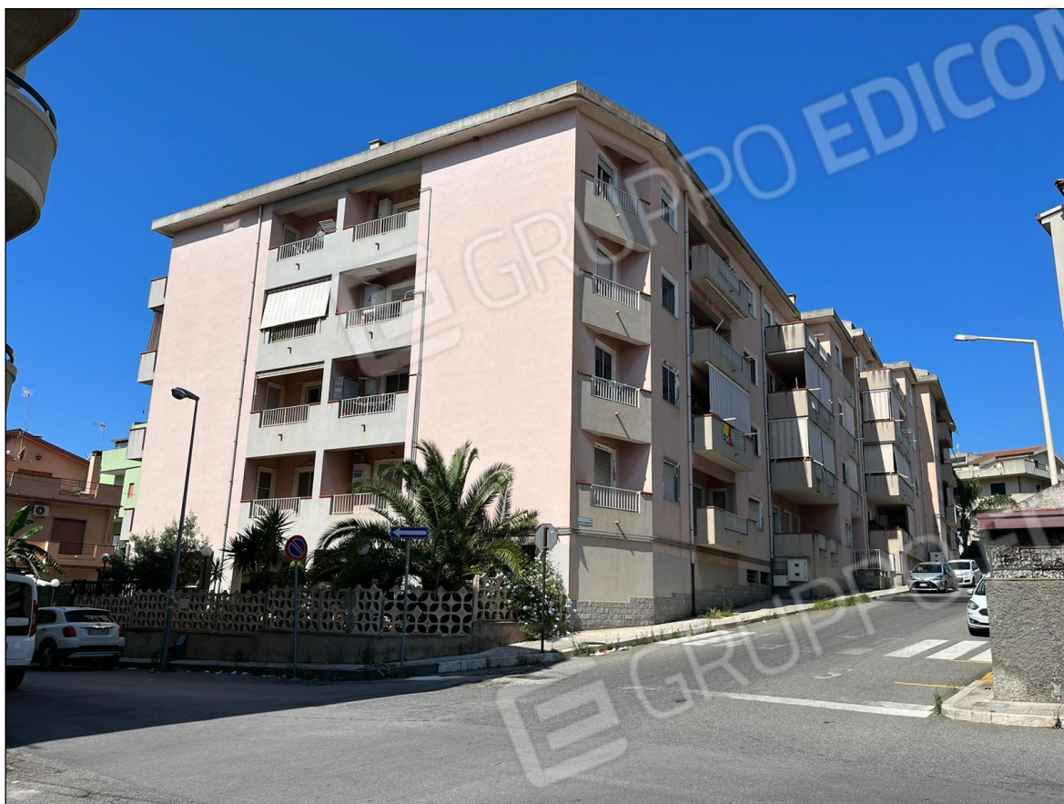
Foto 3: Vista condominio "Le Palme" Via Micene 58 Villa San Giovanni