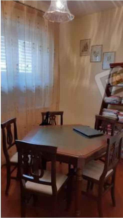
Zona studio al Piano Terra