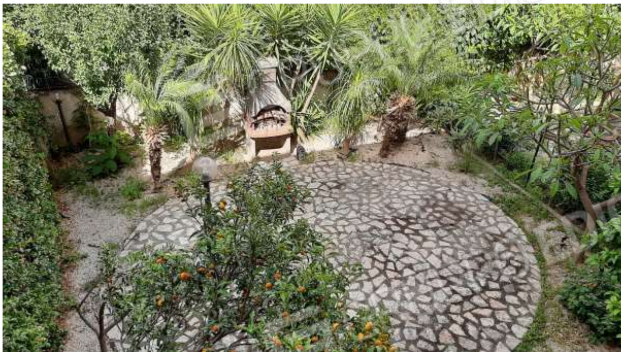
Cortile e giardino al piano terra