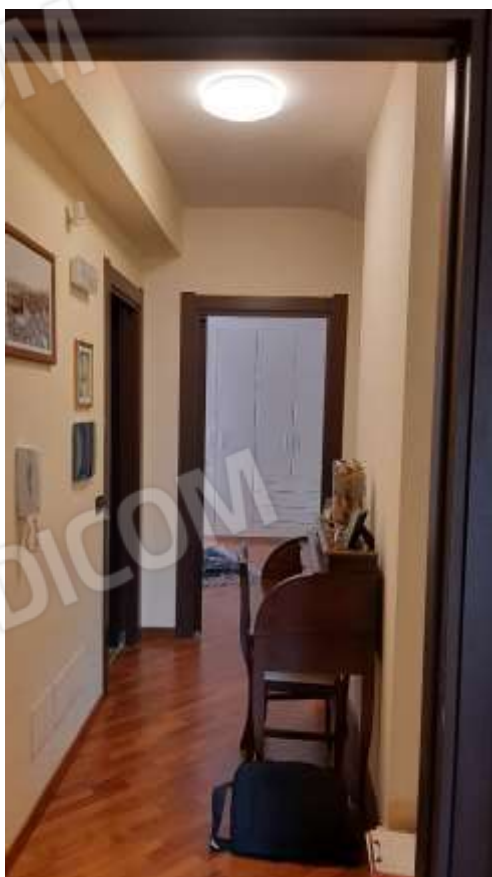
Disimpegno al Piano Primo