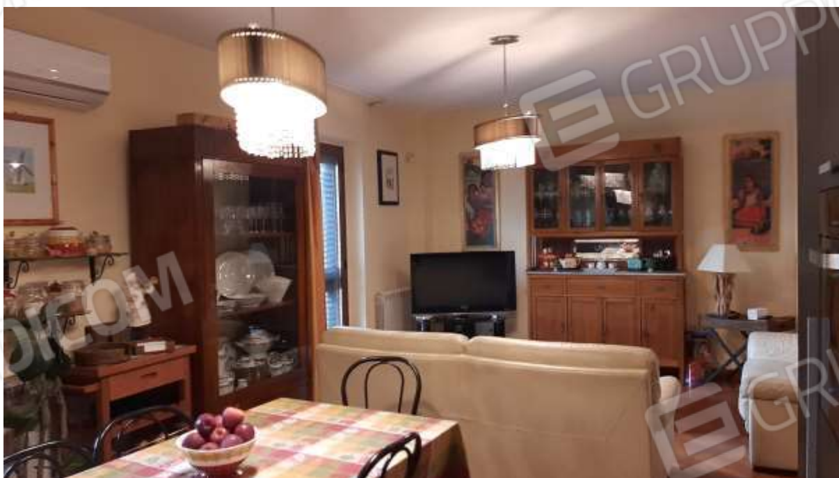
Vista del salotto dalla zona pranzo