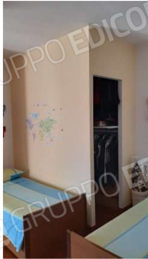
Struttura in cartongesso, uso guardaroba