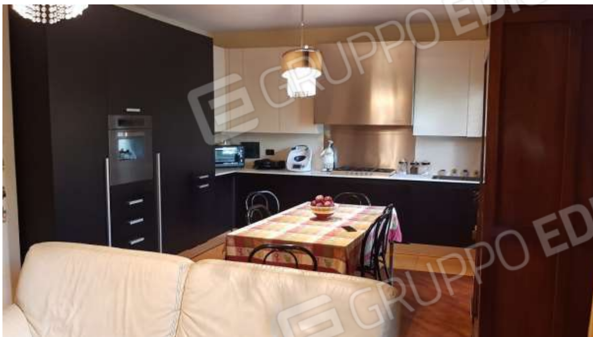
Cucina e zona pranzo viste dal salotto