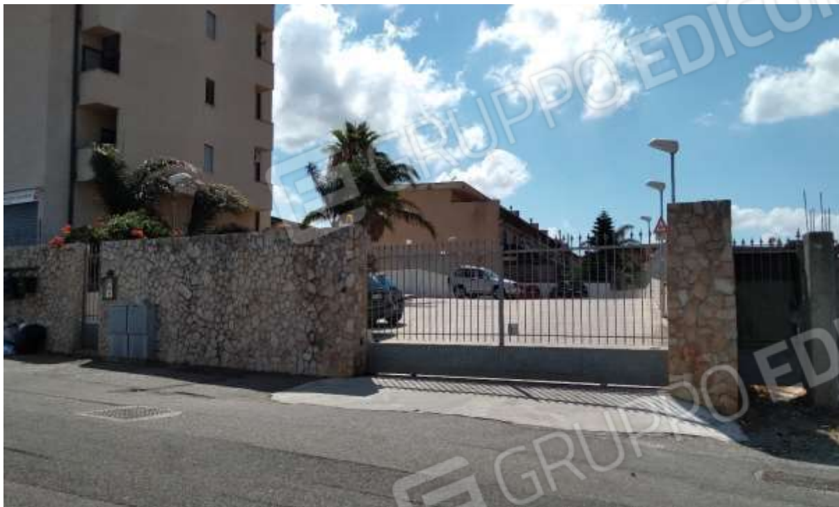
Ingresso carrabile al condominio da Via del Torrente