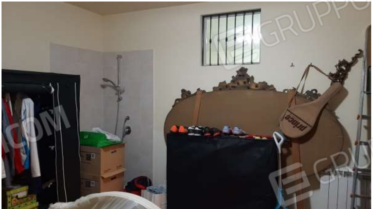
Cantina/deposito al piano seminterrato