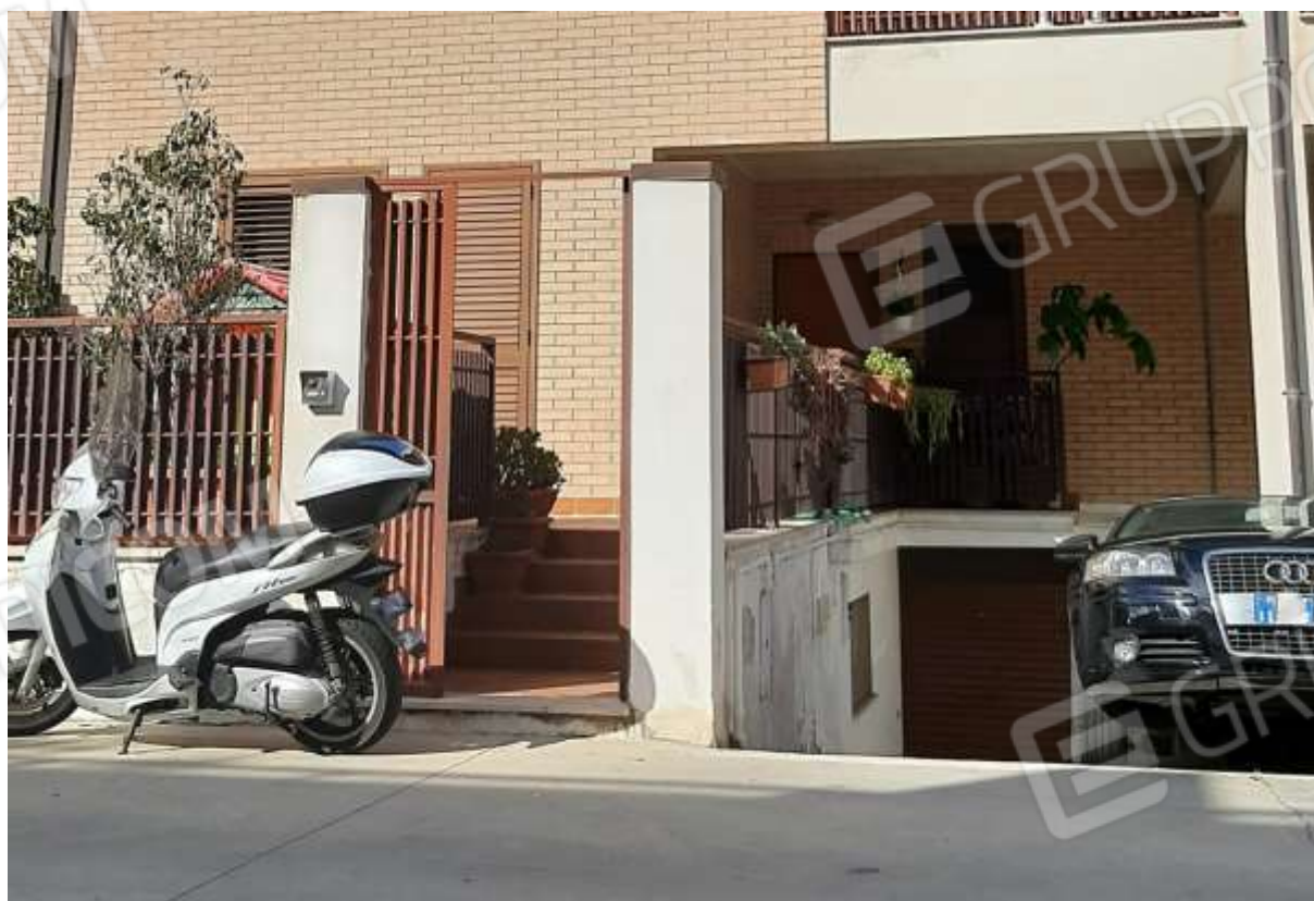
Particolare dell'ingresso e accesso al garage con rampa privata.