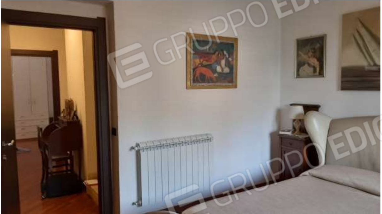
Camera matrimoniale al Piano Primo e disimpegno