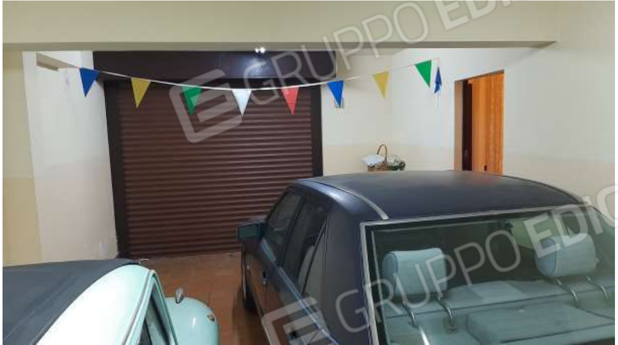
Garage al piano seminterrato con accesso da rampa esclusiva