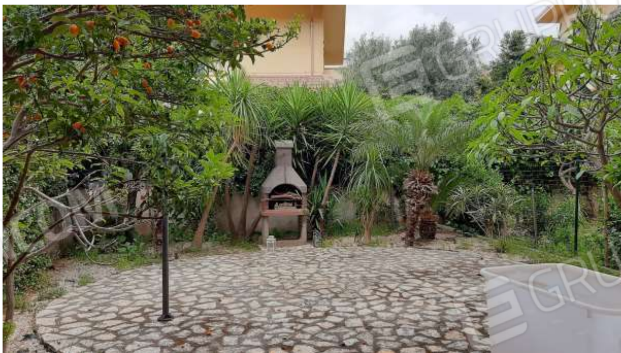
Cortile e giardino al piano terra