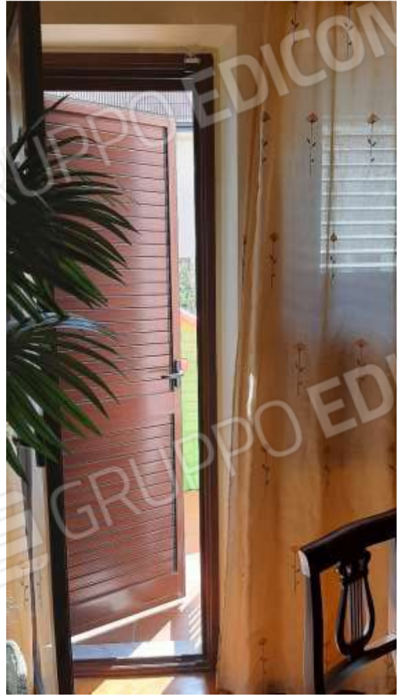
Uscita al terrazzino dallo studio.