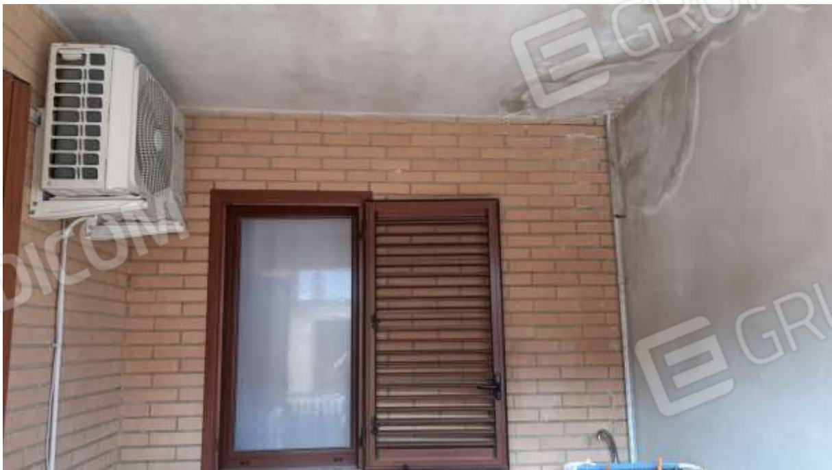
Infiltrazione di acque meteoriche nella veranda al piano primo, provenienti dal terrazzo.