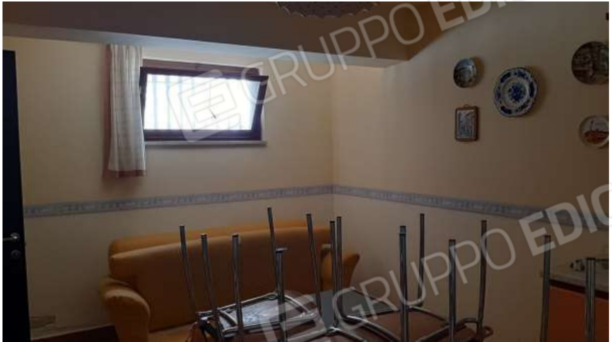
Cantina/tavernetta al piano seminterrato