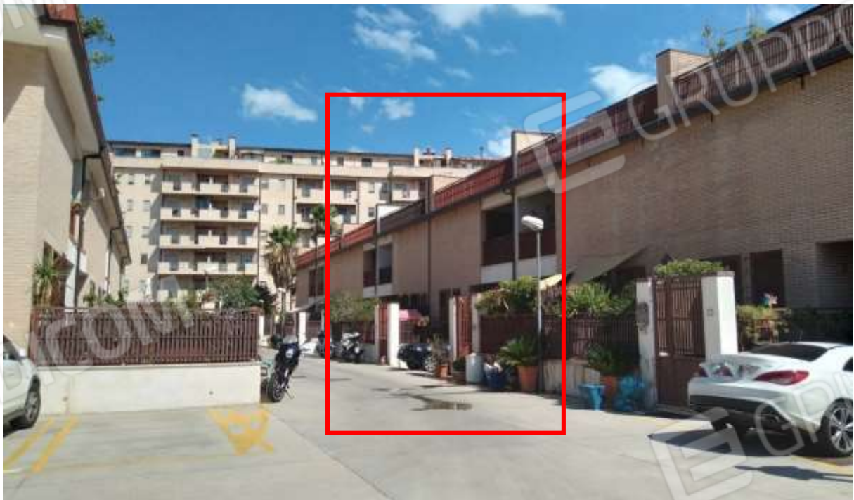
Corte condominiale e accesso agli immobili. Individuazione del cespite visto da Sud.