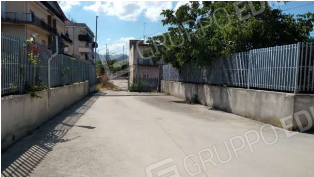
Ingresso al condominio da Via privata Marra (ingresso non utilizzato).