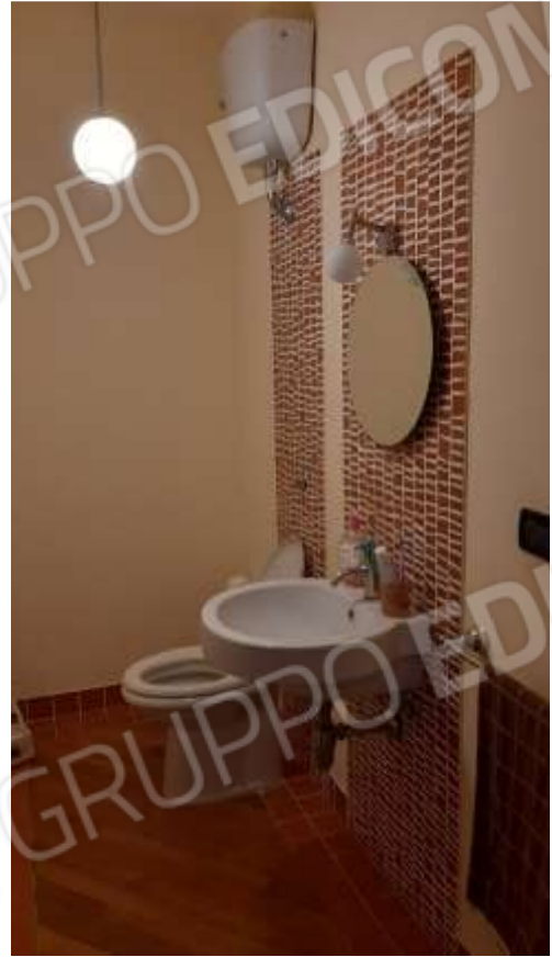
Wc di servizio al Piano Terra