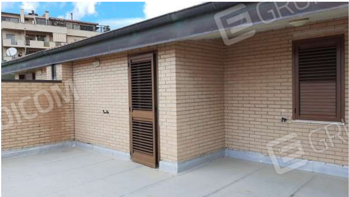
Terrazzo al piano secondo.