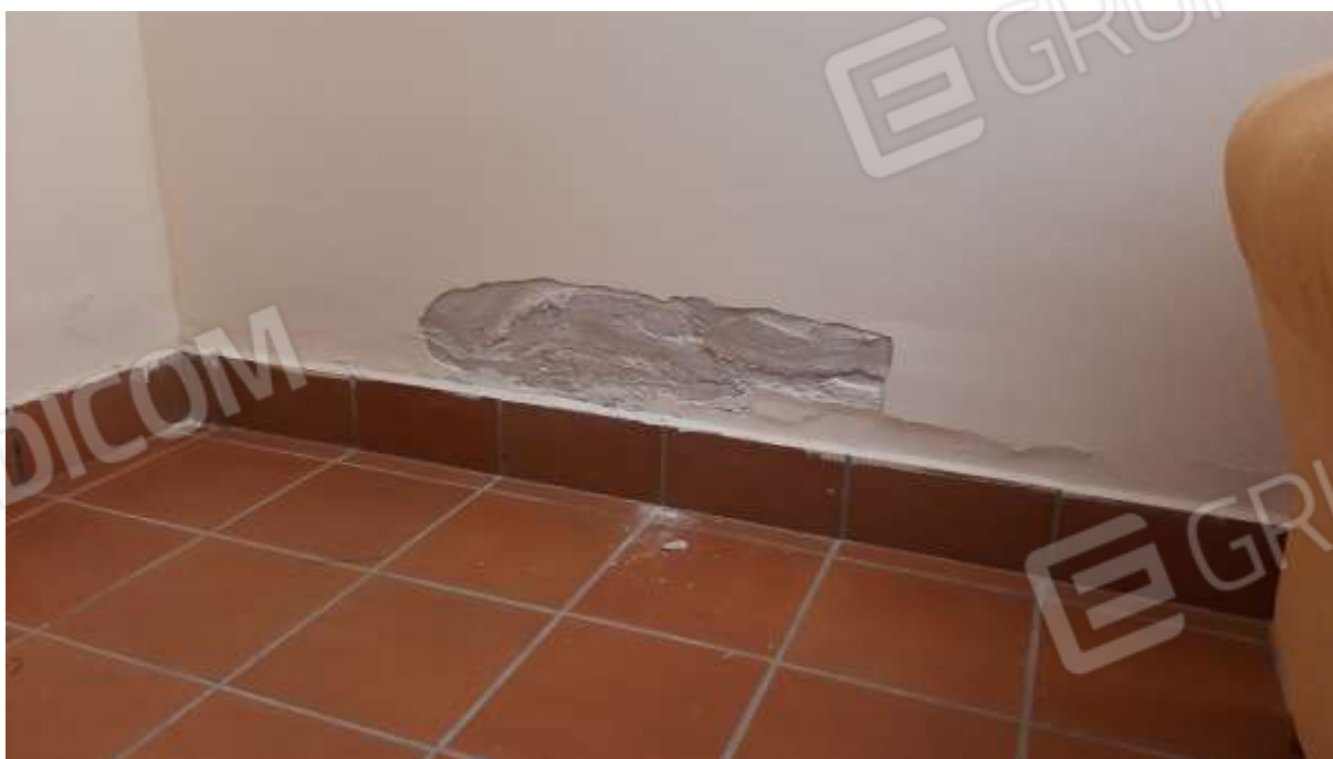
Presenza di umidità al piano seminterrato