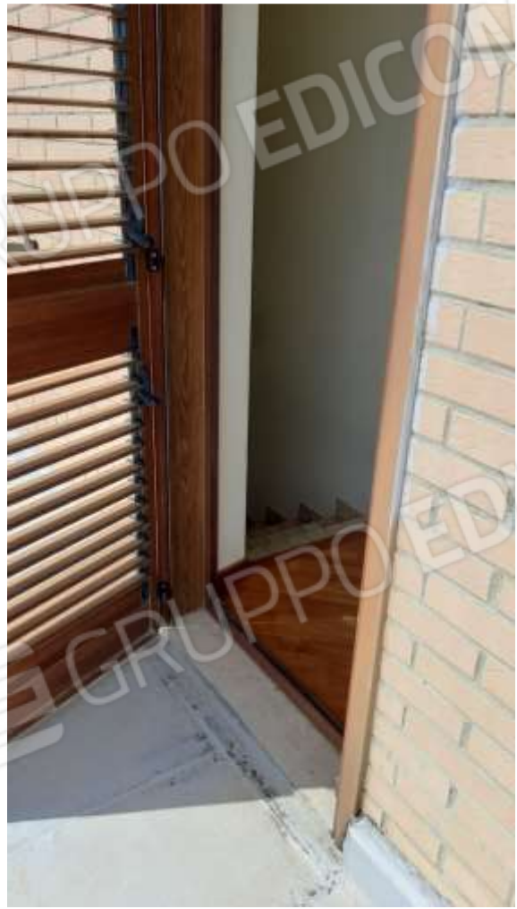
Infiltrazioni e umidità al piano secondo, proveniente dal terrazzo