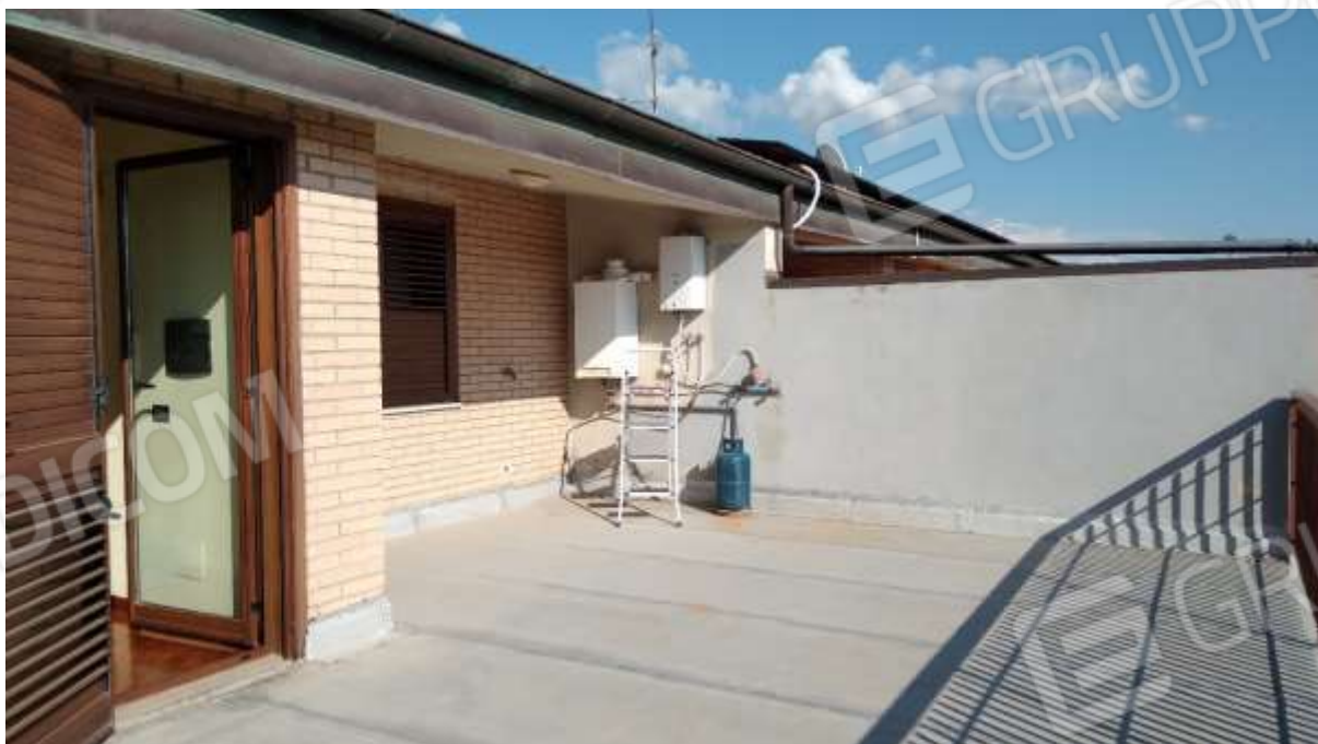
Terrazzo al Piano Secondo in cui sono presenti lavori di manutenzione per eliminare le infiltrazioni al piano sottostante.