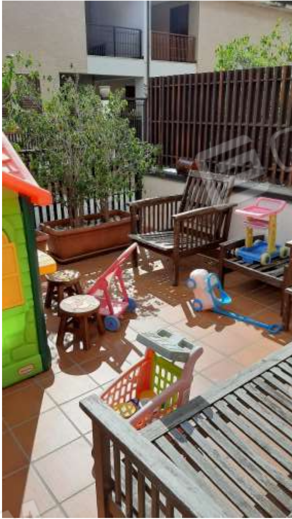
Terrazzino al Piano Terra