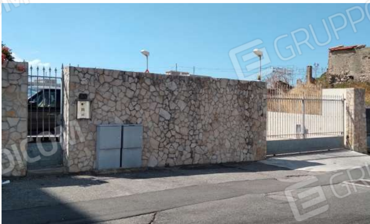
Ingresso pedonale al condominio dal Civico n. 53 di Via del Torrente.