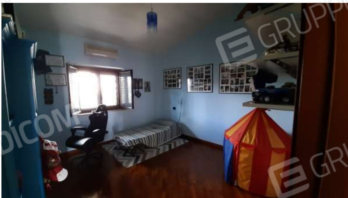
Stanza pluriuso al Piano Secondo