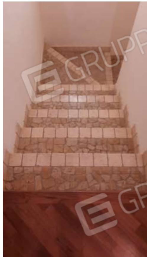
Corpo scala interno a 3 rampe per l'accesso ai piani.