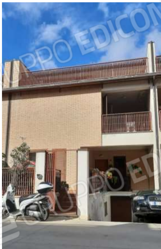
Fronte principale e ingresso al cespite.