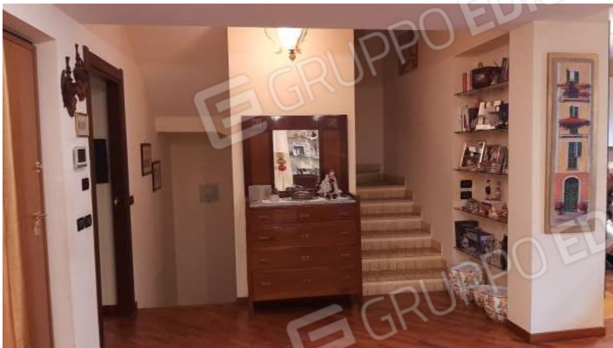
Ingresso al Piano Terra e vista del corpo scala per l'accesso ai piani superiori e al piano S1.