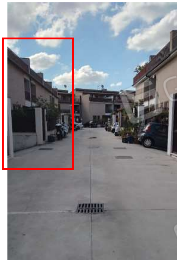
Corte condominiale vista da Nord