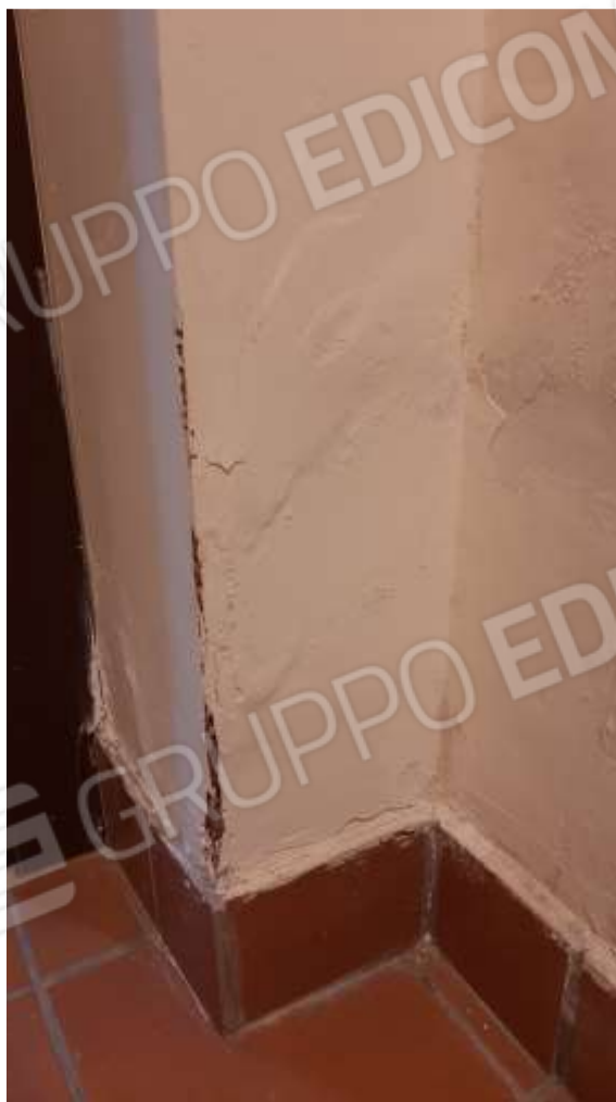
Segni di infiltrazioni al piano Seminterrato