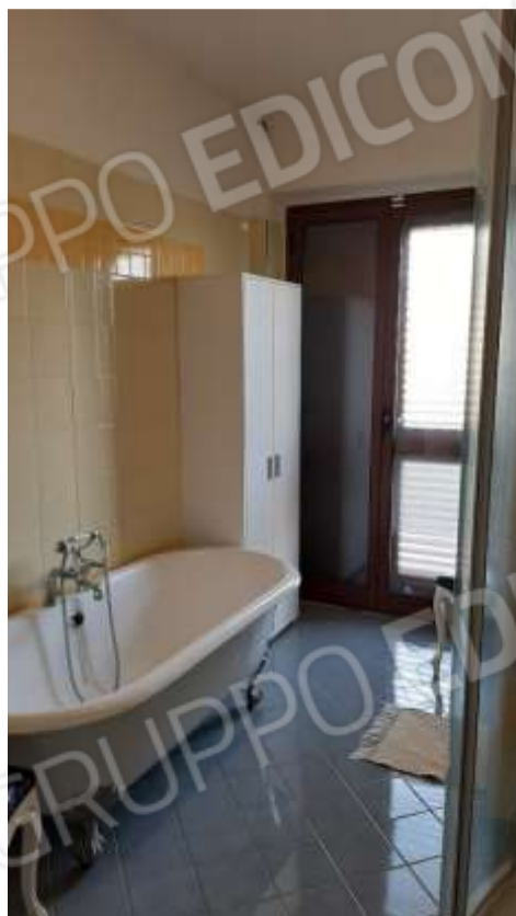
Viste del bagno interno alla camera matrimoniale