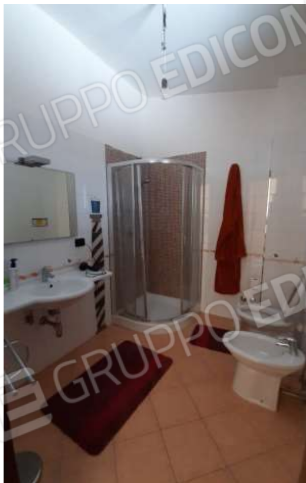
Bagno al Piano Secondo