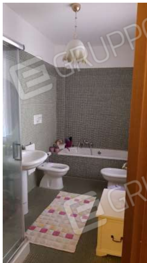
Bagno comune al Piano Primo