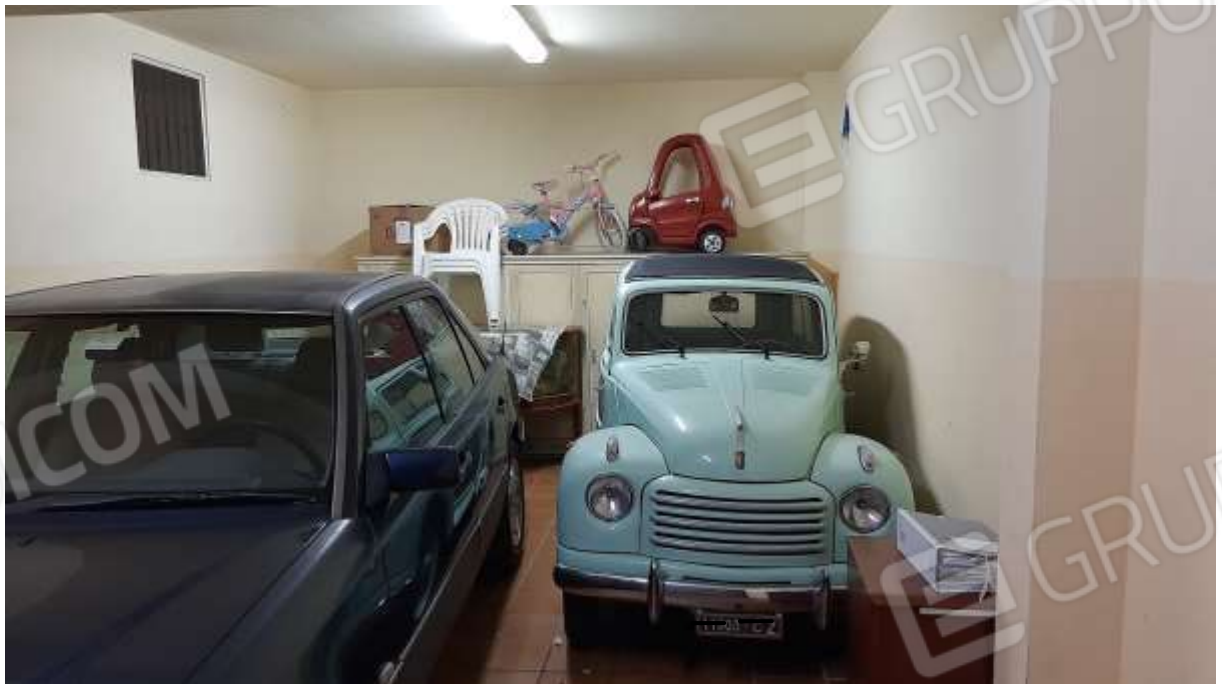
Garage al piano seminterrato