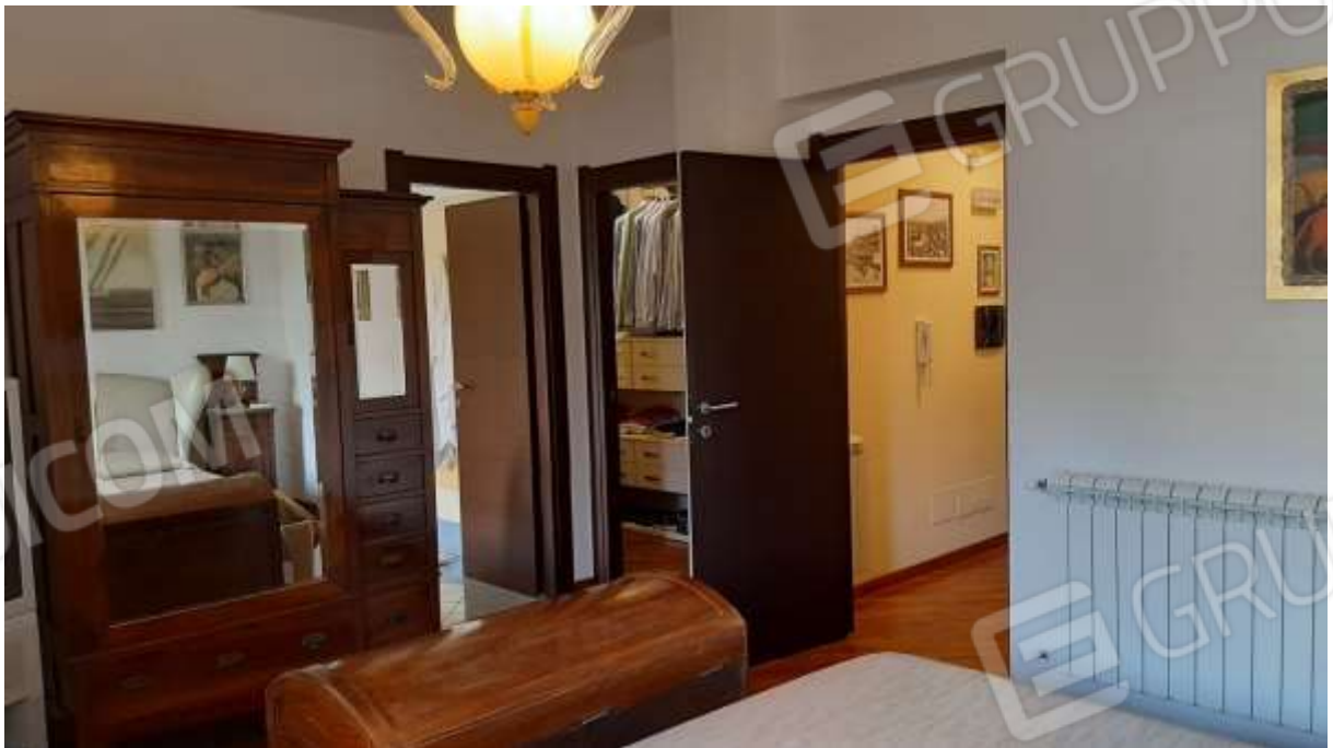
Vista degli accessi al bagno interno e alla cabina armadio