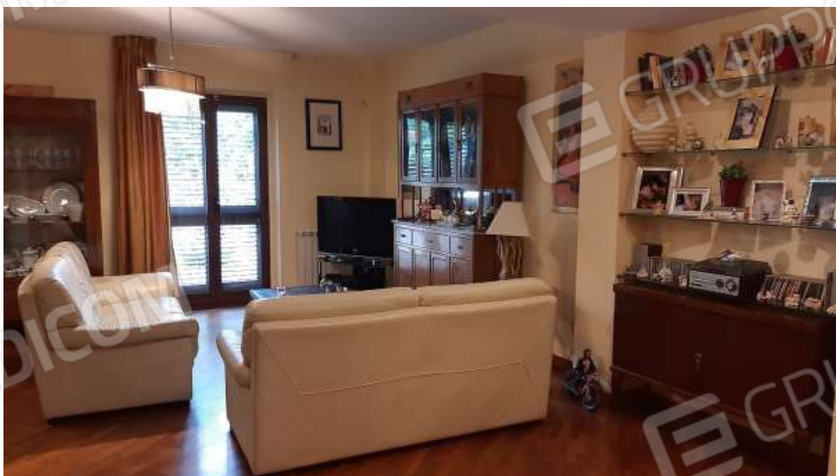
Zona giorno al Piano Terra e vista dall'ingresso sul salotto