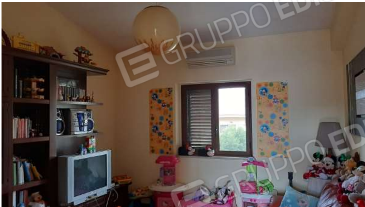
Stanza pluriuso al Piano Secondo