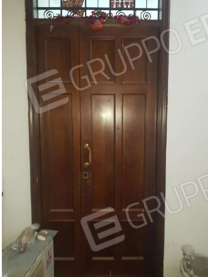
Foto n.4: accesso all'immobile identificato catastalmente al foglio n. 124 part.lla n.69 sub. 6 posto al piano primo