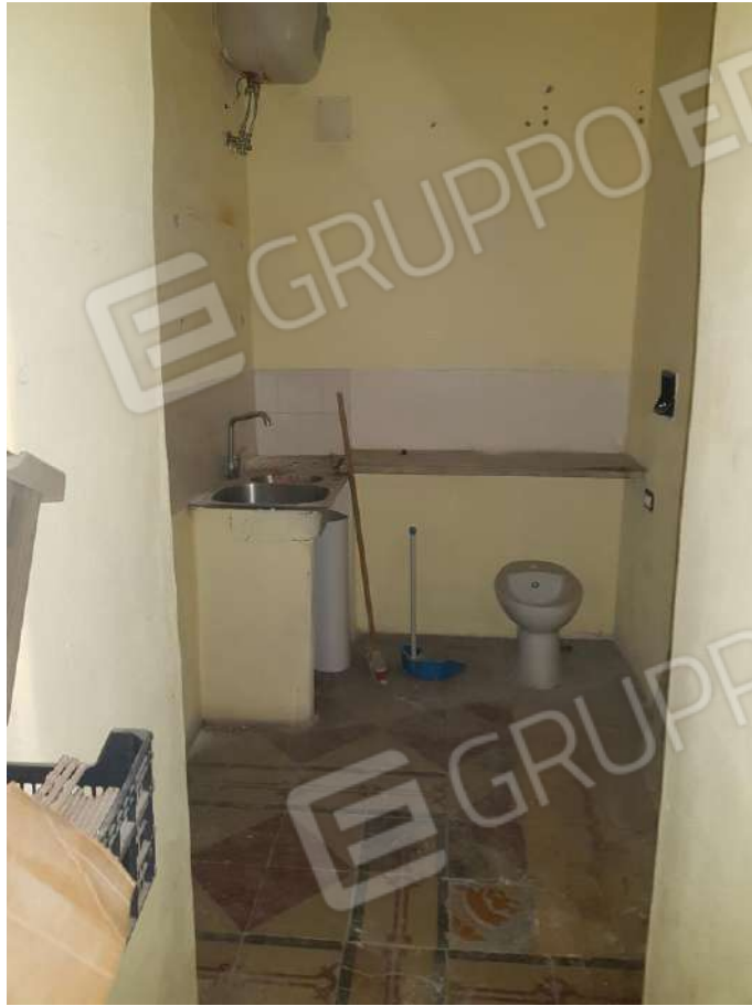
Foto n.20: disimpegno costituente l'immobile posto al piano seminterrato