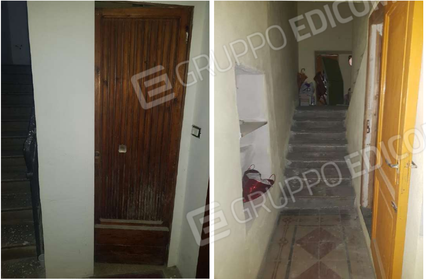
Foto n.18: accesso immobile al piano seminterrato identificato catastalmente al foglio n. 124 p.la 69 sub.9