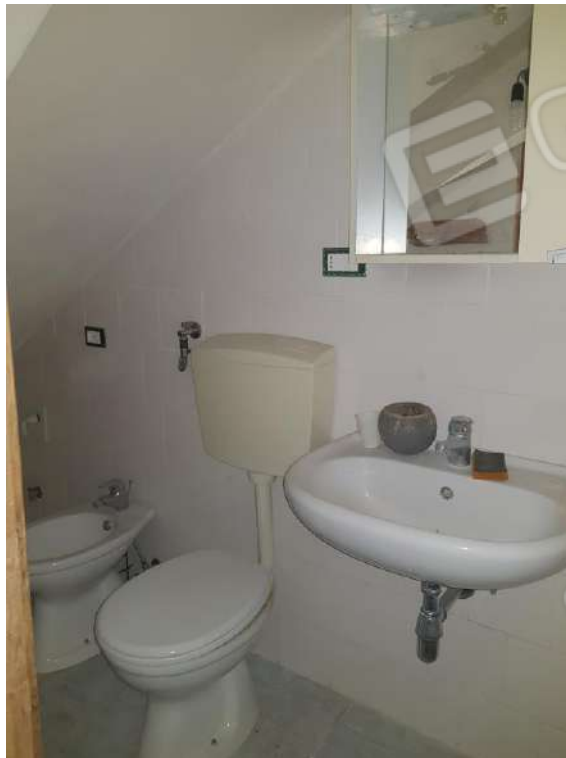
Foto n.19: bagno costituente l'immobile posto al piano seminterrato