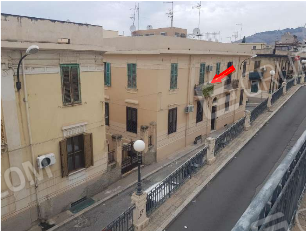
Foto n.1: fabbricato sito in Reggio Calabria via Aschenez n.8, comprendente gli immobili oggetto di pignoramento posti al piano primo e al piano seminterrato