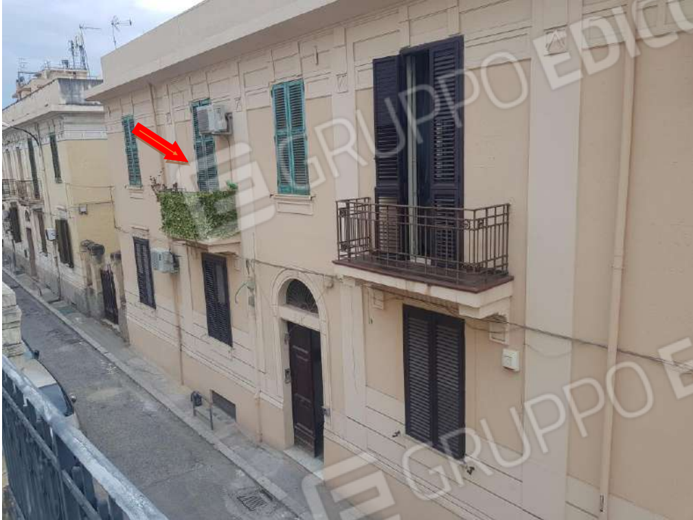
Foto n.2: fabbricato sito in Reggio Calabria via Aschenez n.8, comprendente gli immobili oggetto di pignoramento posti al piano primo e al piano seminterrato