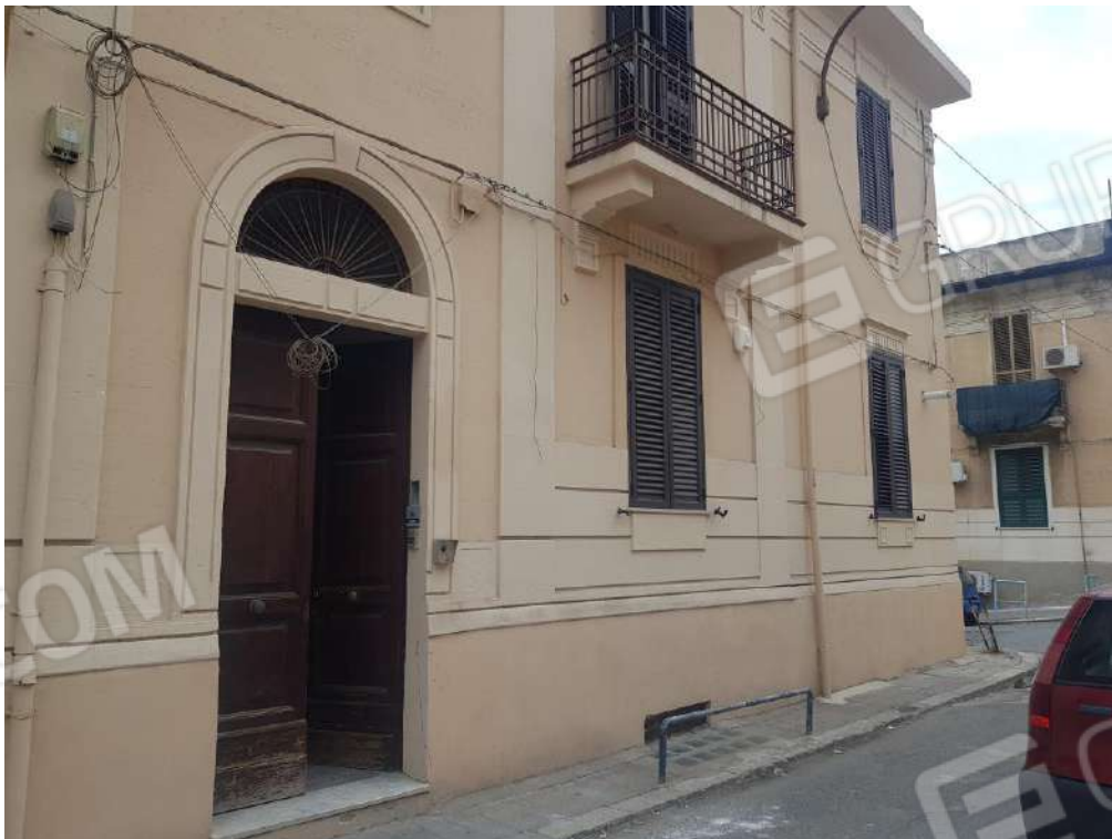
Foto n.3: accesso al fabbricato sito in Reggio Calabria via Aschenez n.8