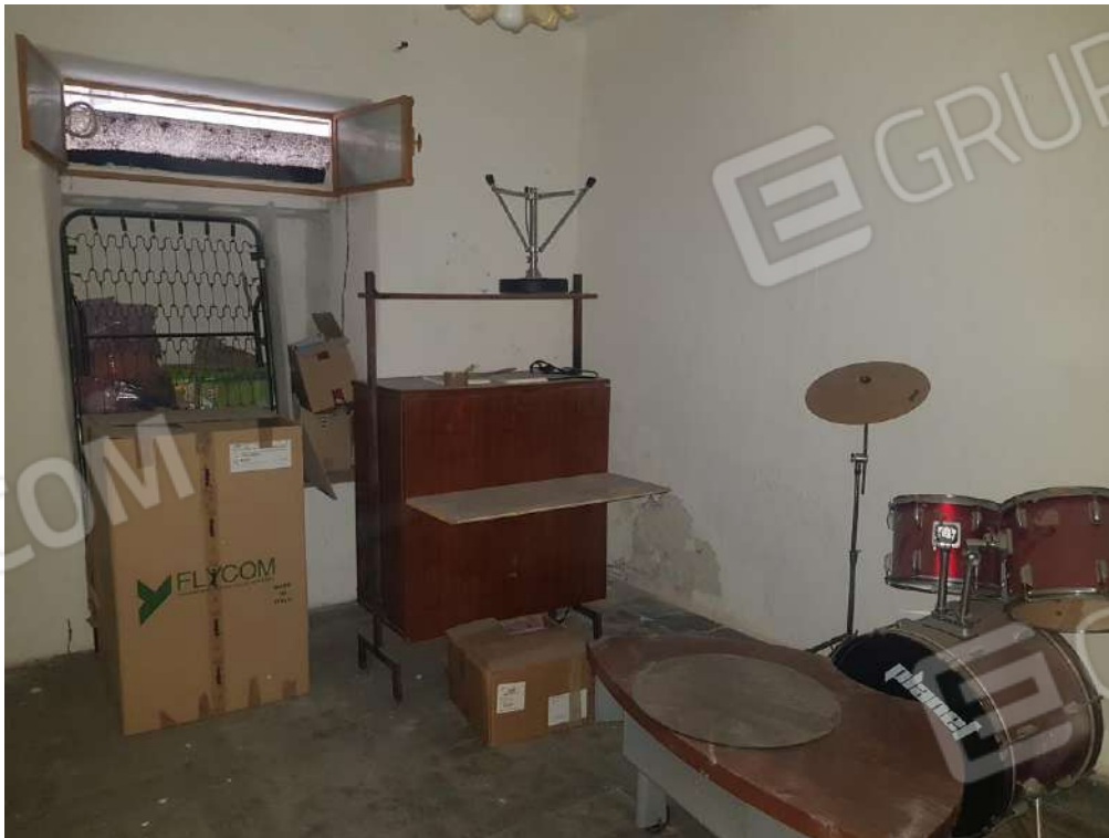
Foto n.21: locale deposito costituente l'immobile posto al piano seminterrato