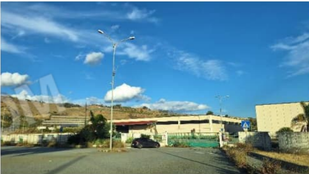
Piazzale prima dell'ingresso