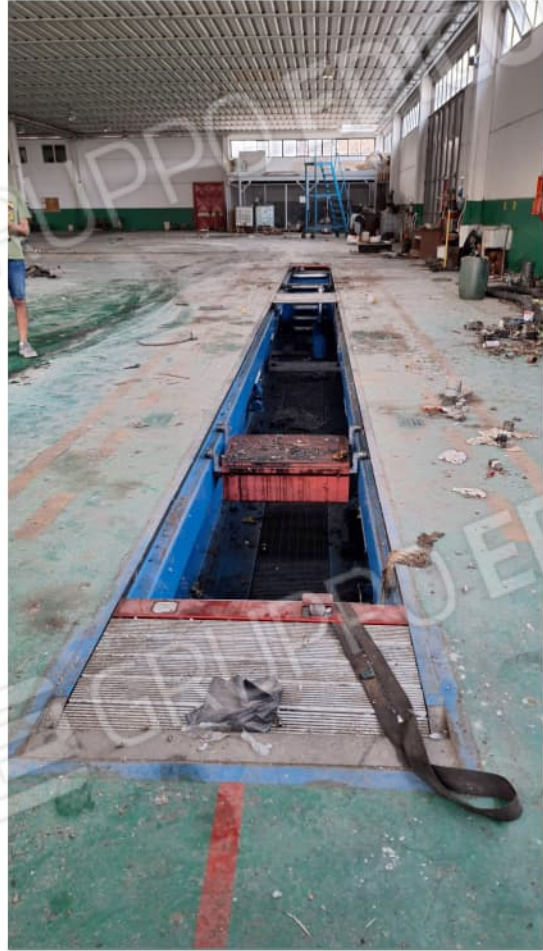
Vista del deposito (E) nel Capannone B