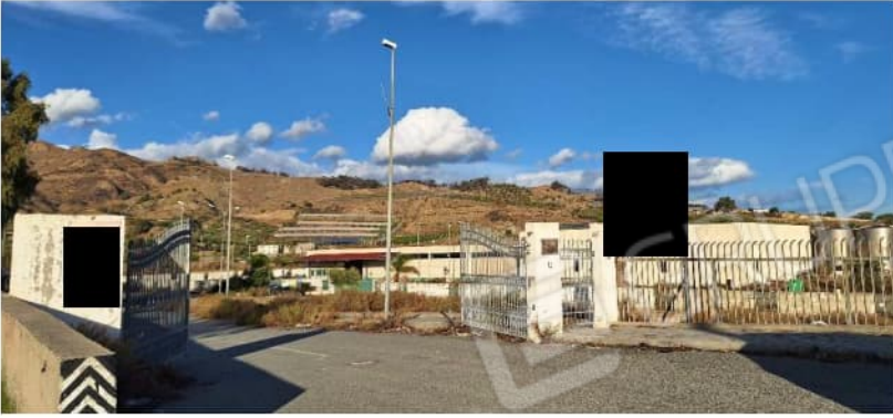
ingresso area P.I.P.