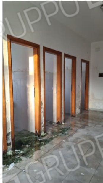
spogliatoi e bagni