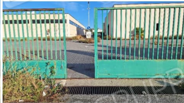
ingresso al complesso industriale – part. 264