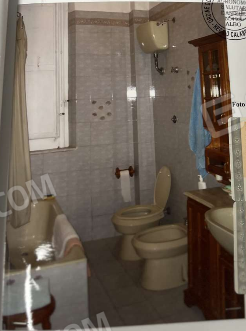
Foto 10- Ripresa del bagno