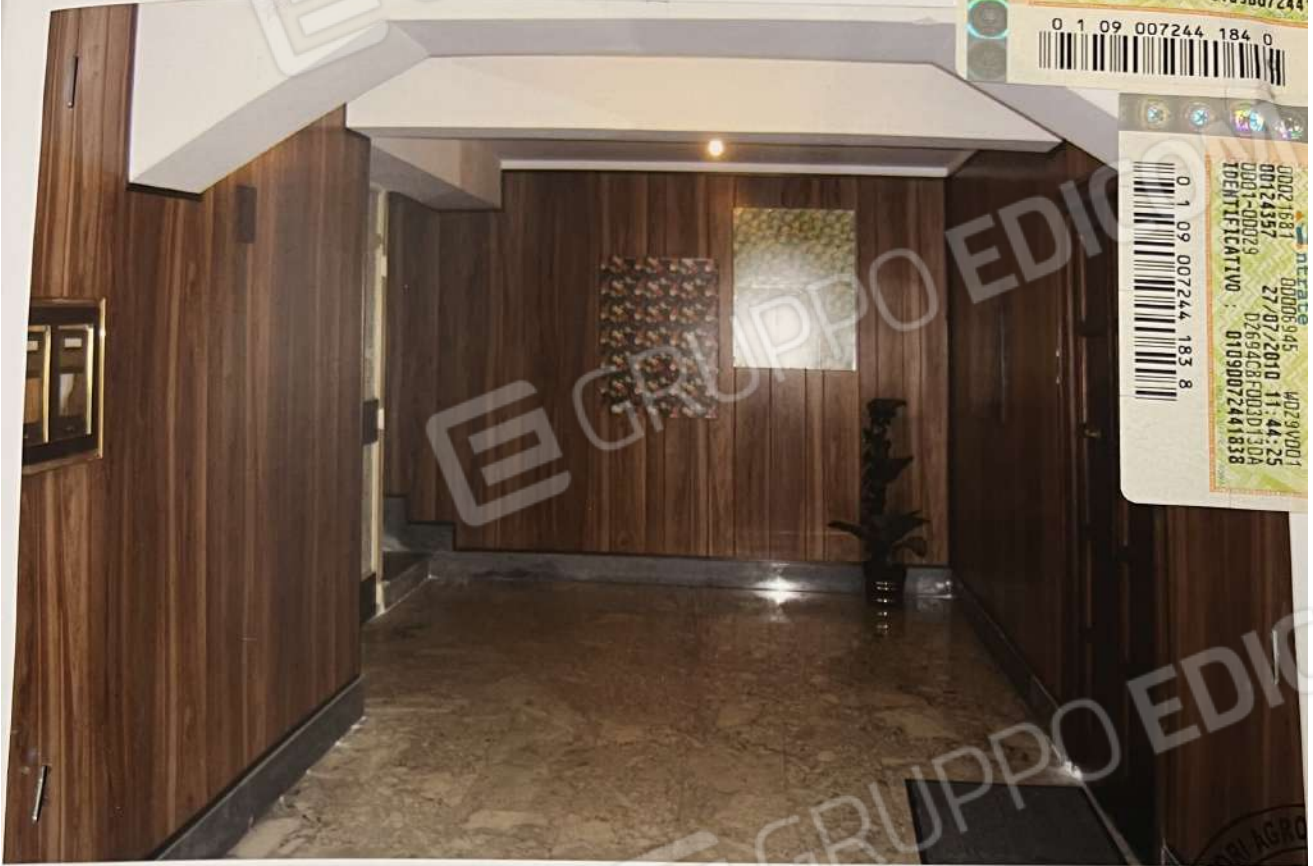
Foto 8- Ripresa del salone