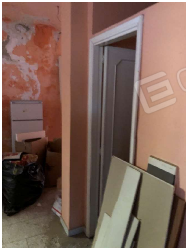
Figura 10 Corridoio - porta ingresso ripostiglio particella 112 sub 2