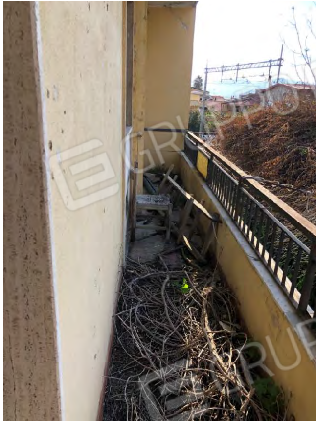
Figura 21 Balcone particella 112 sub 2