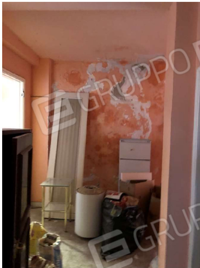
Figura 9 Corridoio particella 112 sub 2