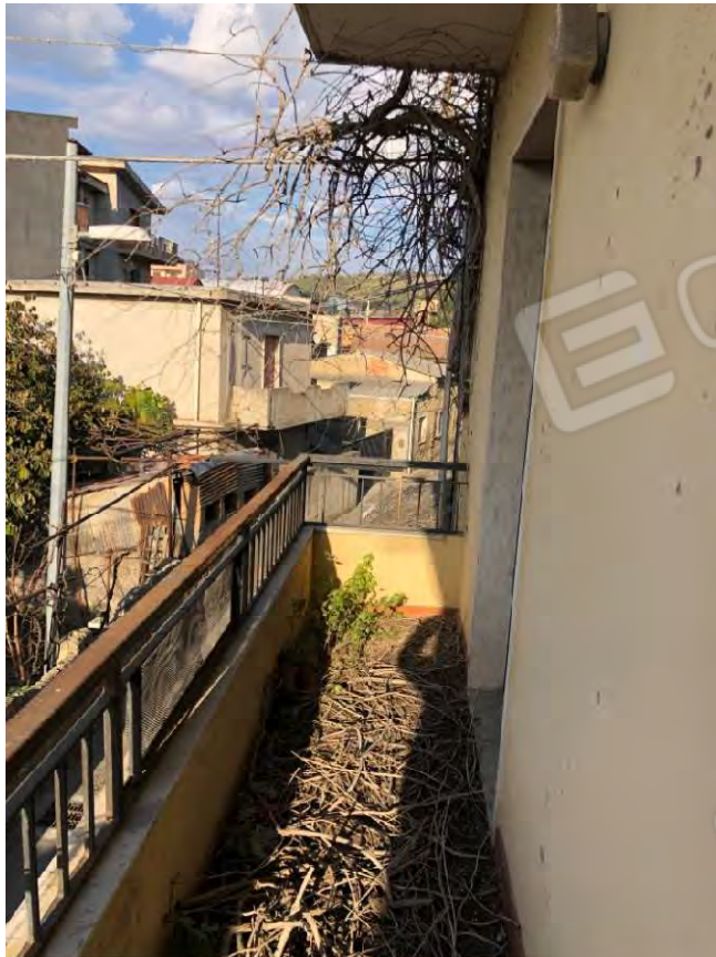
Figura 22 Balcone particella 112 sub 2