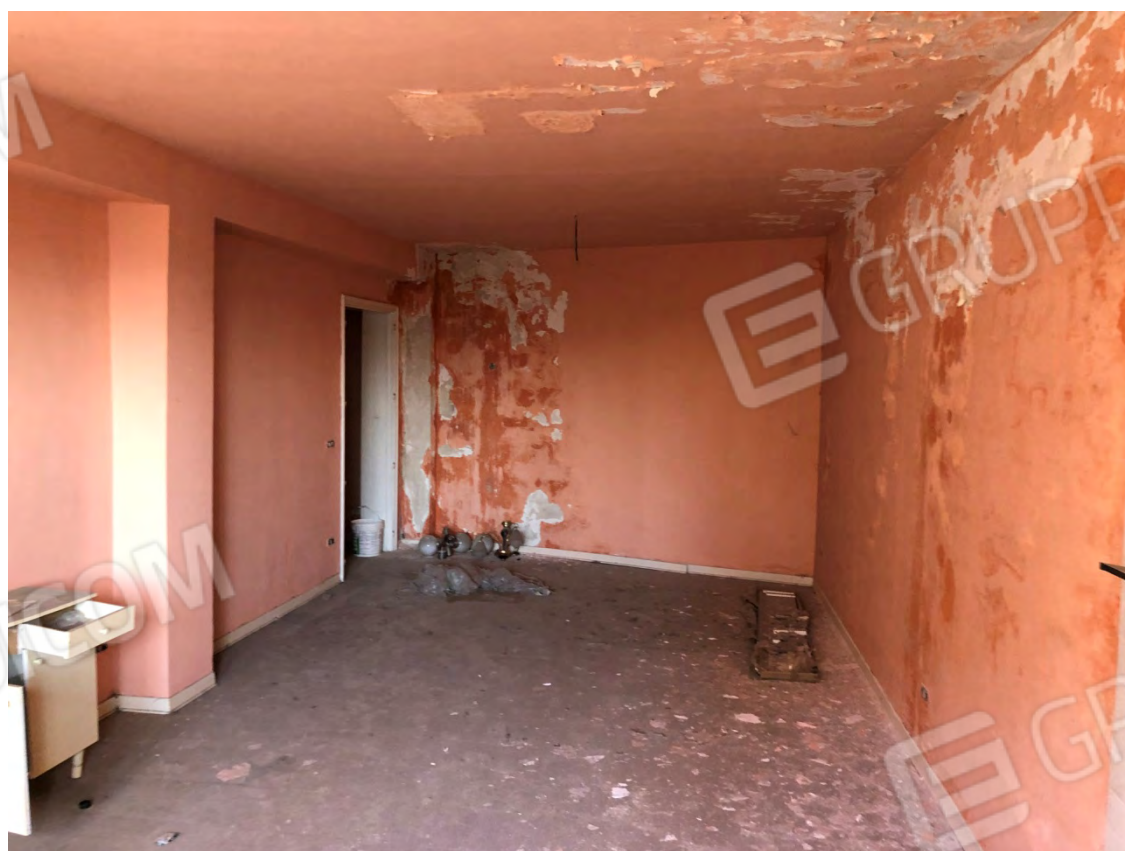
Figura 20 Cucina soggiorno particella 642 e 513