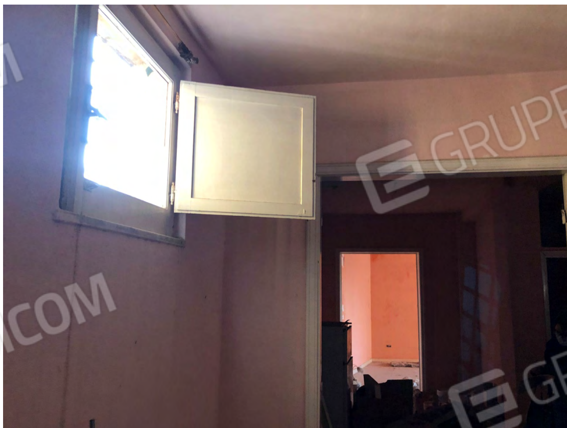
Figura 16 Camera 2 particella 112 sub 2