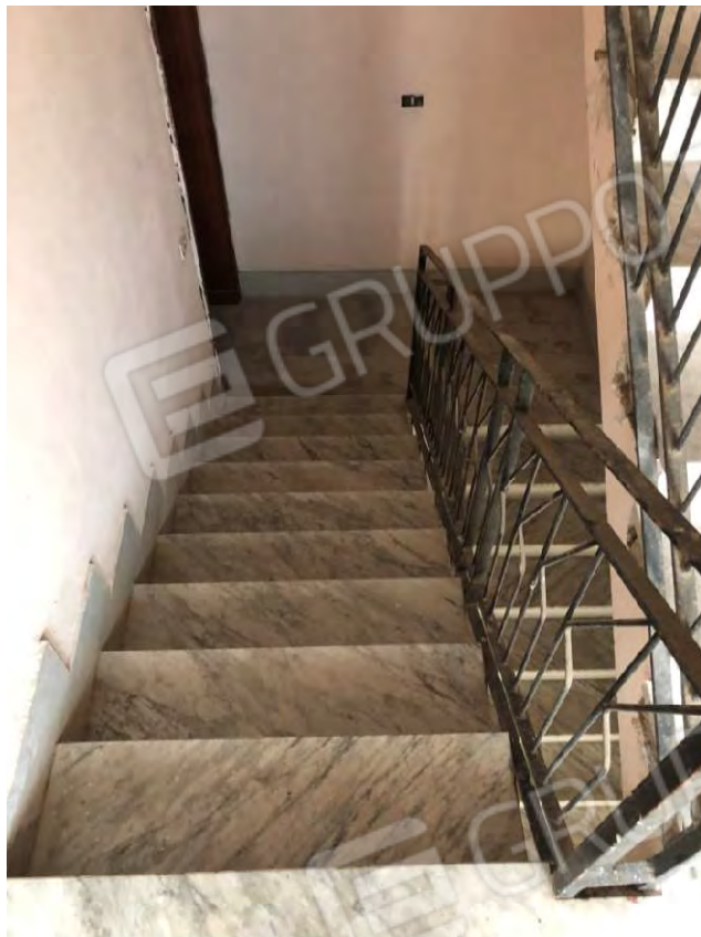
Figura 3 Pianerottolo accesso U.I. posta al 1° piano e scala di collegamento piani superiori