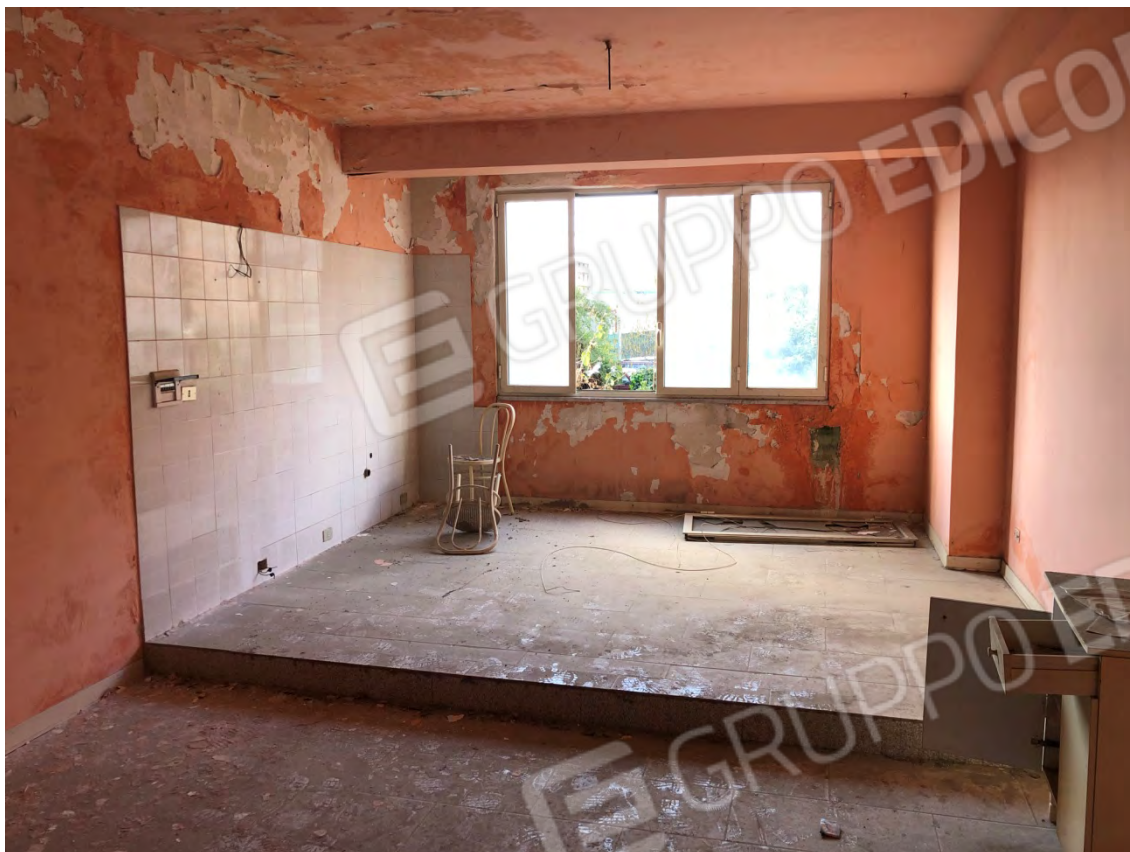
Figura 19 Cucina soggiorno particella 642 e 513