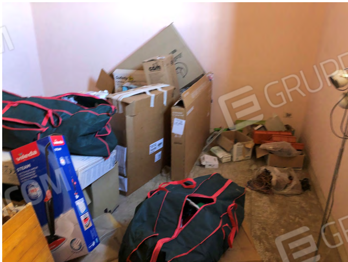
Figura 14 Camera 2 particella 112 sub 2