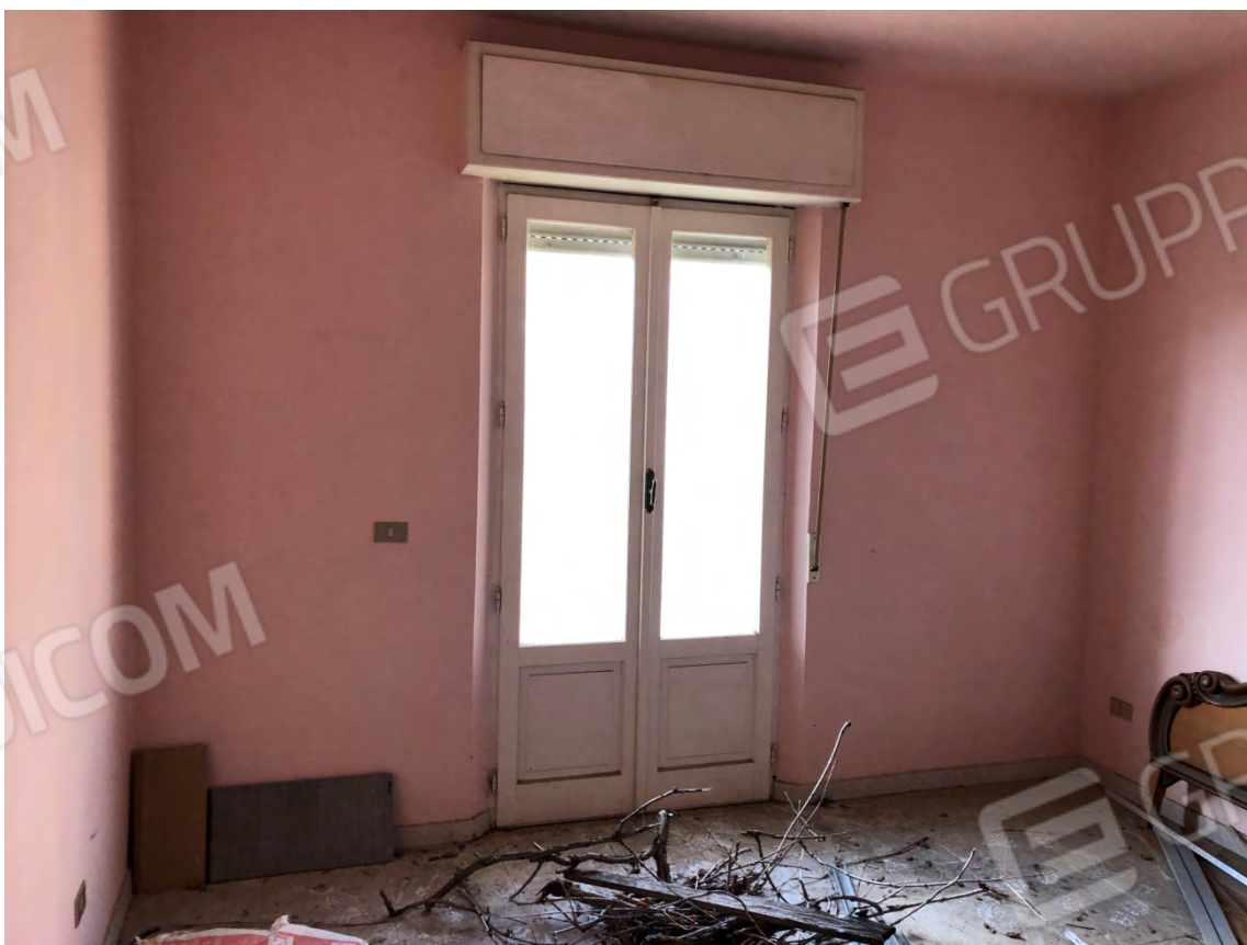
Figura 8 Camera 1 particella 112 sub 2