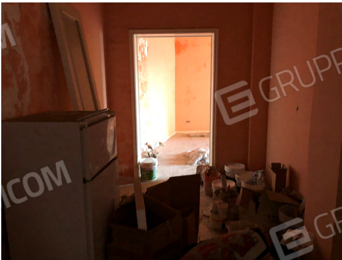
Figura 18 Corridoio ingresso Cucina soggiorno particella 642 e 513