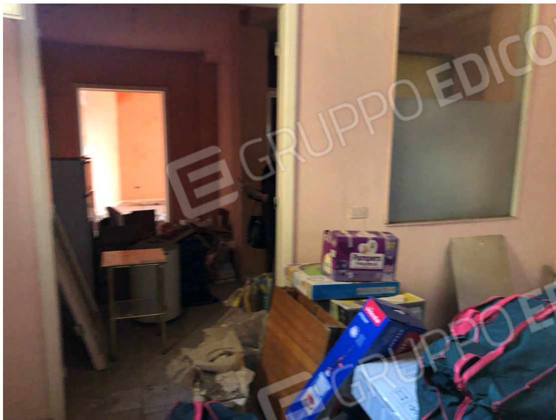
Figura 15 Camera 2 particella 112 sub 2