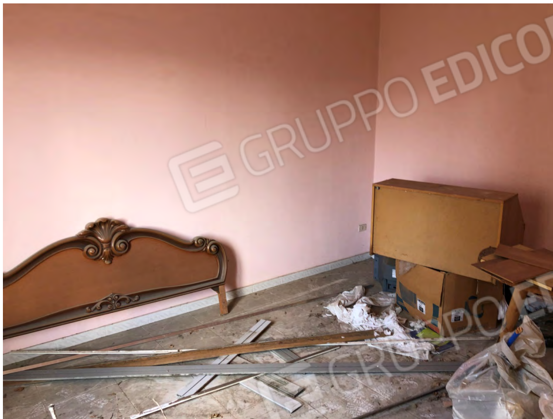
Figura 7 Camera 1 particella 112 sub 2