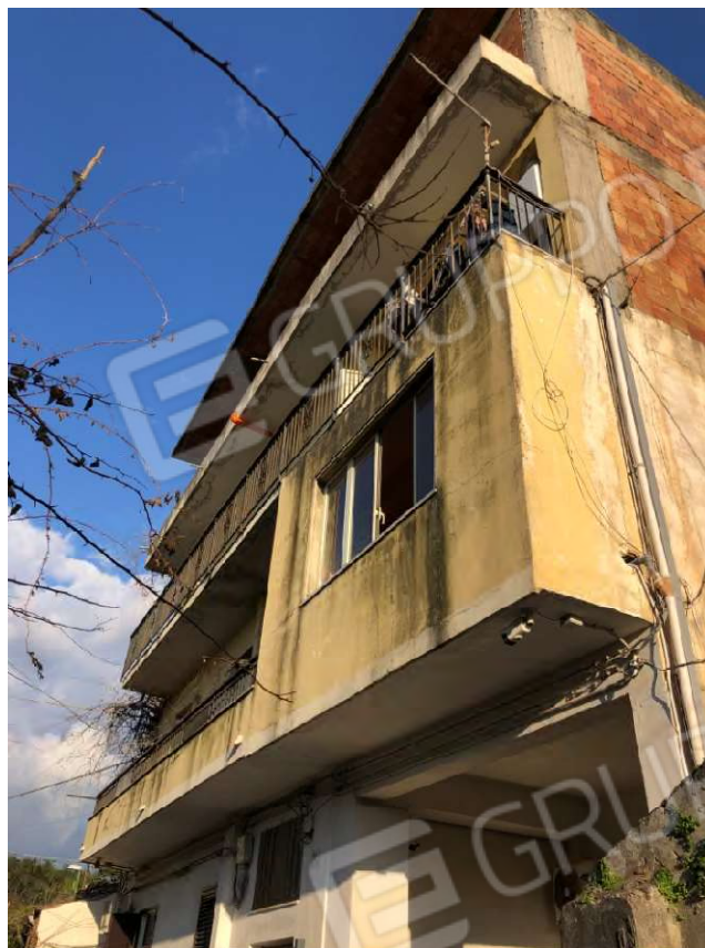
Figura 1 Appartamento posto al piano 1