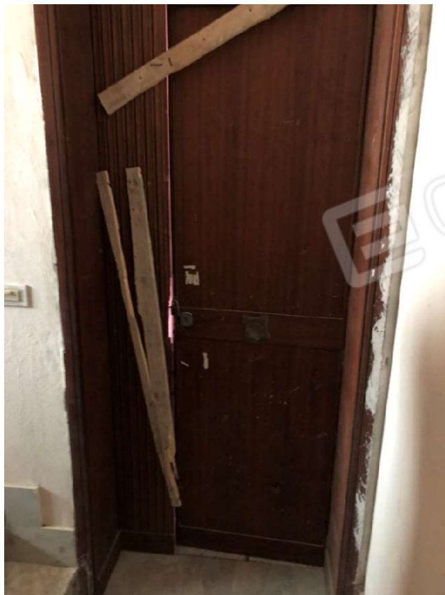
Figura 4 Porta d'ingresso unità immobiliare posta al piano 1° particella 112 sub 2