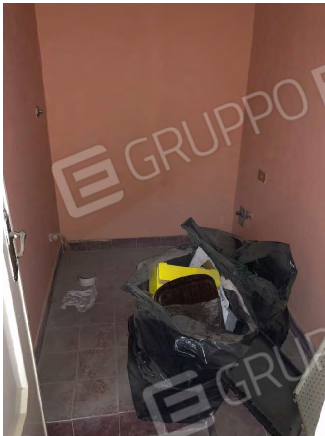
Figura 11 Ripostiglio particella 112 sub 2