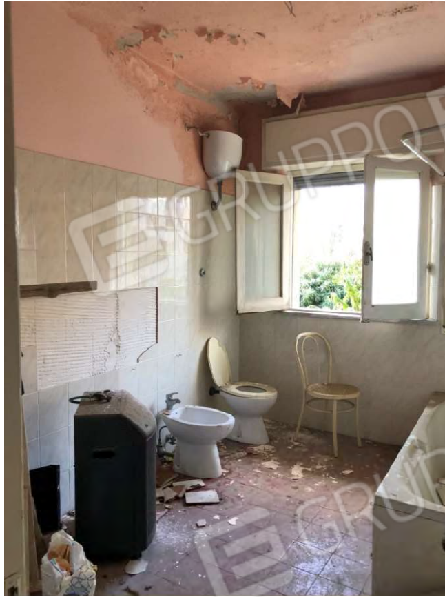
Figura 5 Bagno particella 112 sub 2