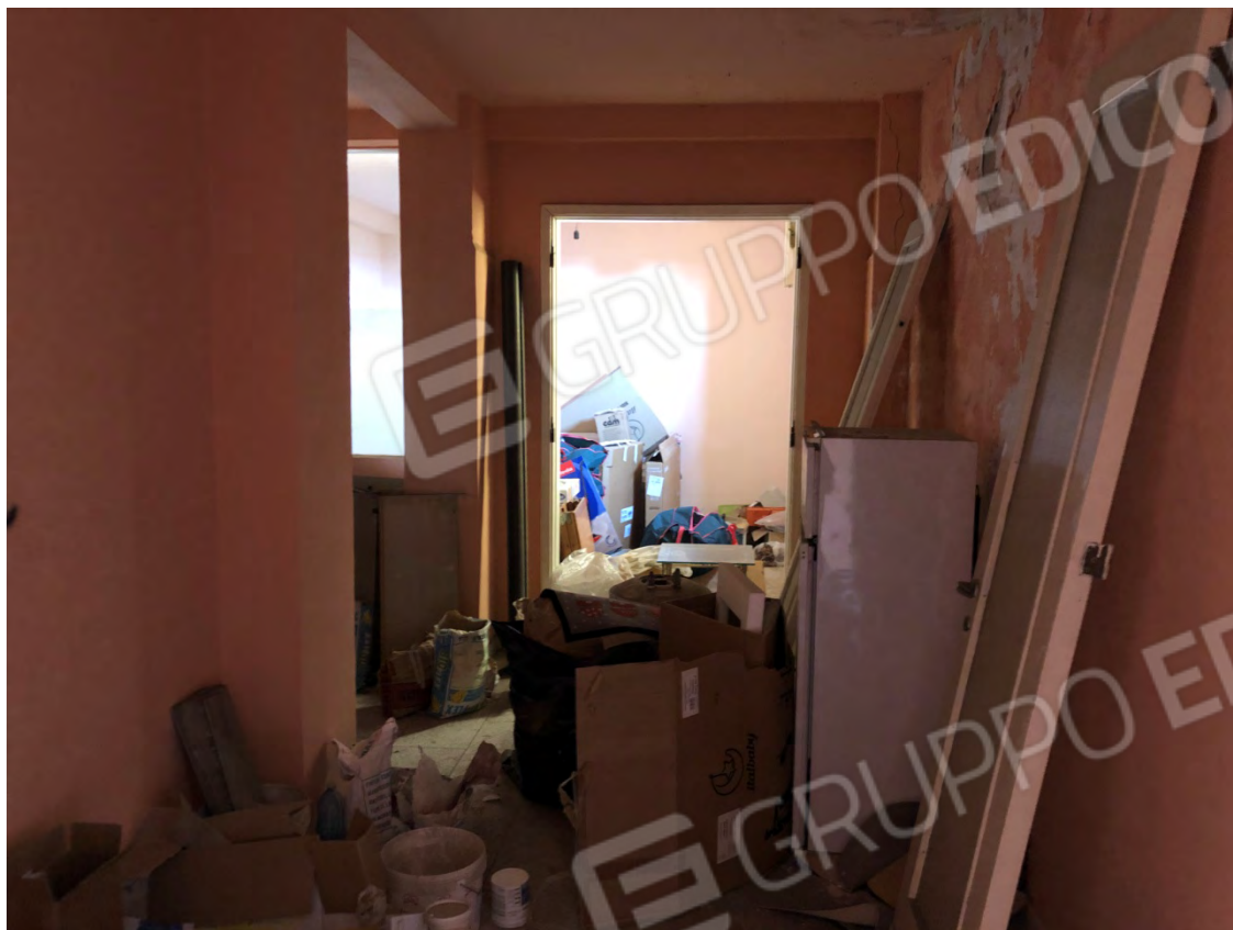
Figura 17 Corridoio ingresso camera 2 particella 112 sub 2