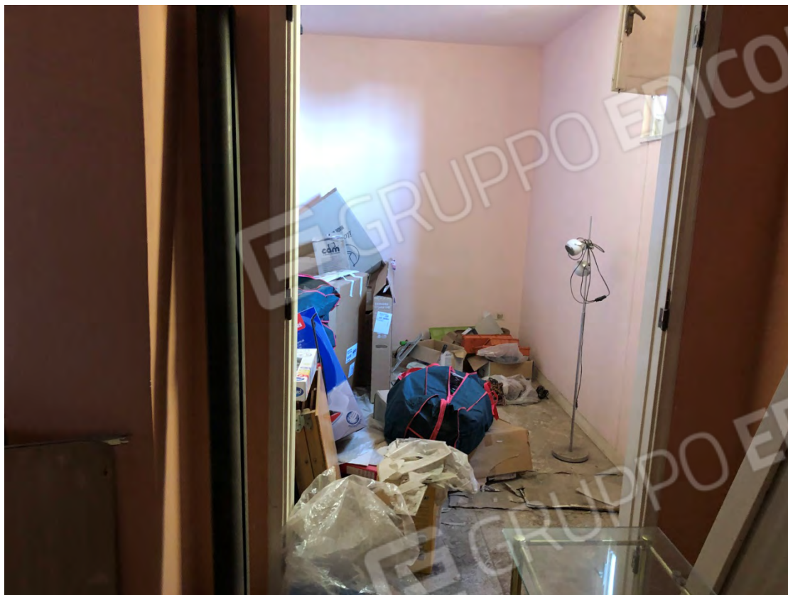
Figura 13 Camera 2 particella 112 sub 2