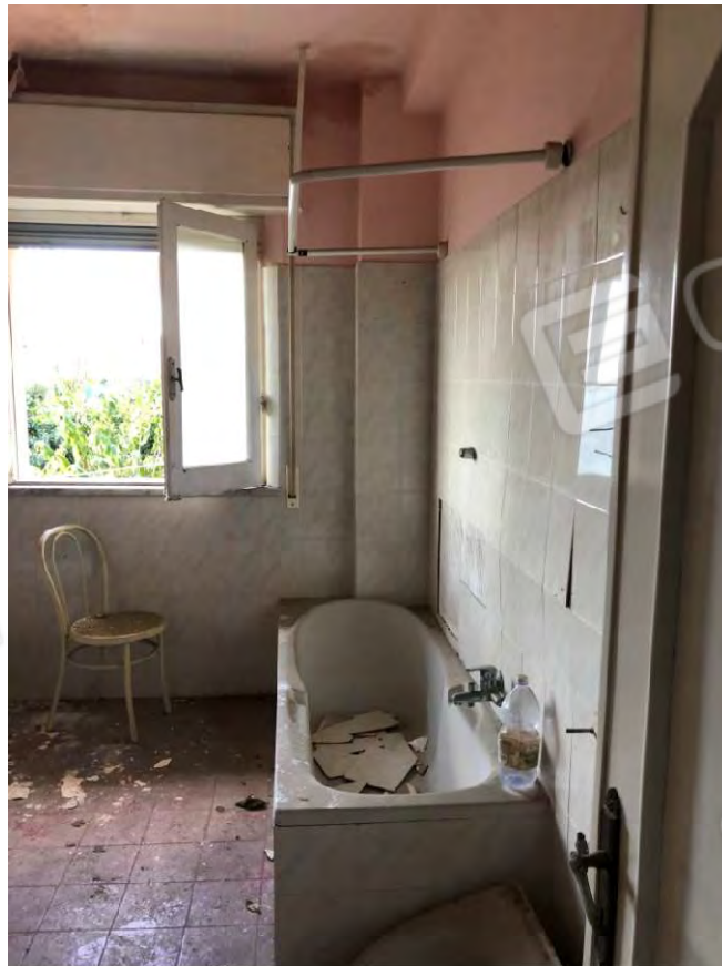
Figura 6 Bagno particella 112 sub 2