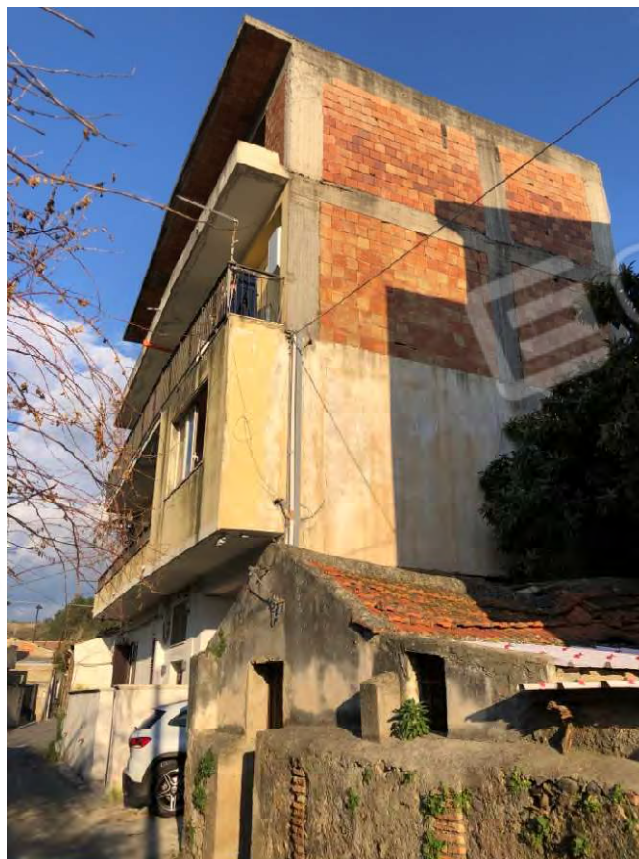
Figura 2 Esterno fabbricato