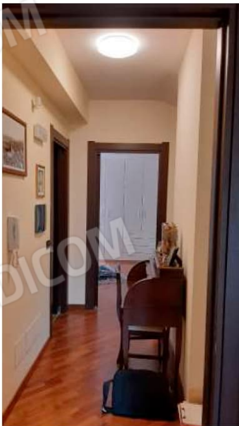
Disimpegno al Piano Primo