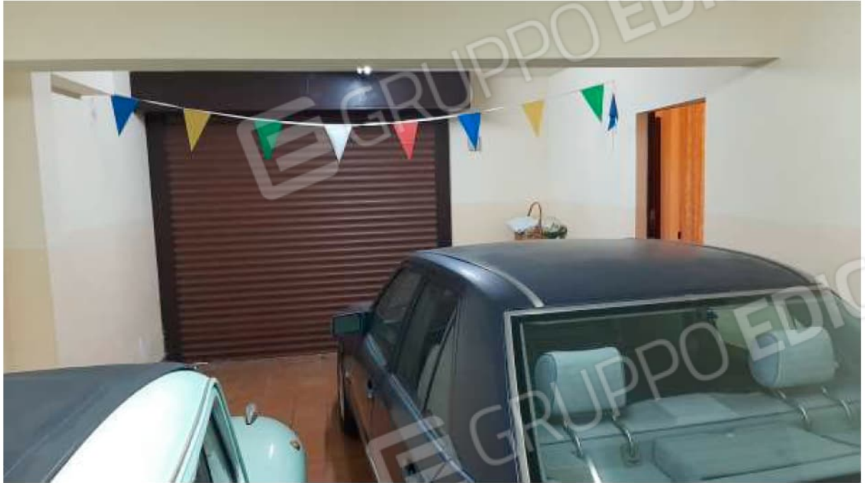
Garage al piano seminterrato con accesso da rampa esclusiva