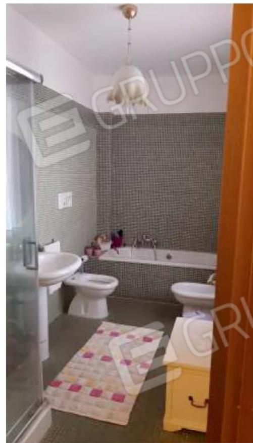
Bagno comune al Piano Primo