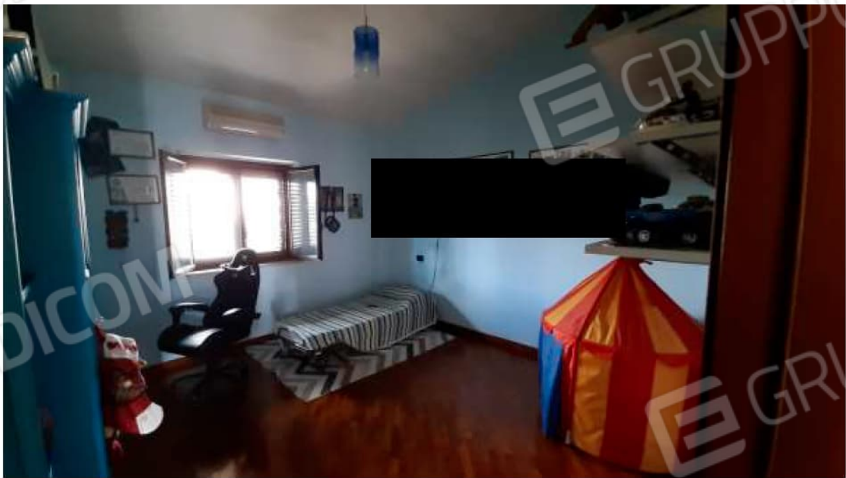
Stanza pluriuso al Piano Secondo