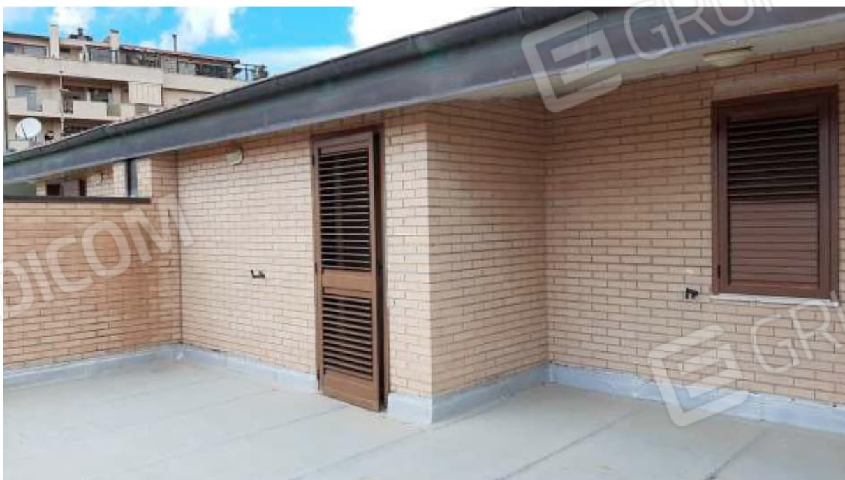
Terrazzo al piano secondo.