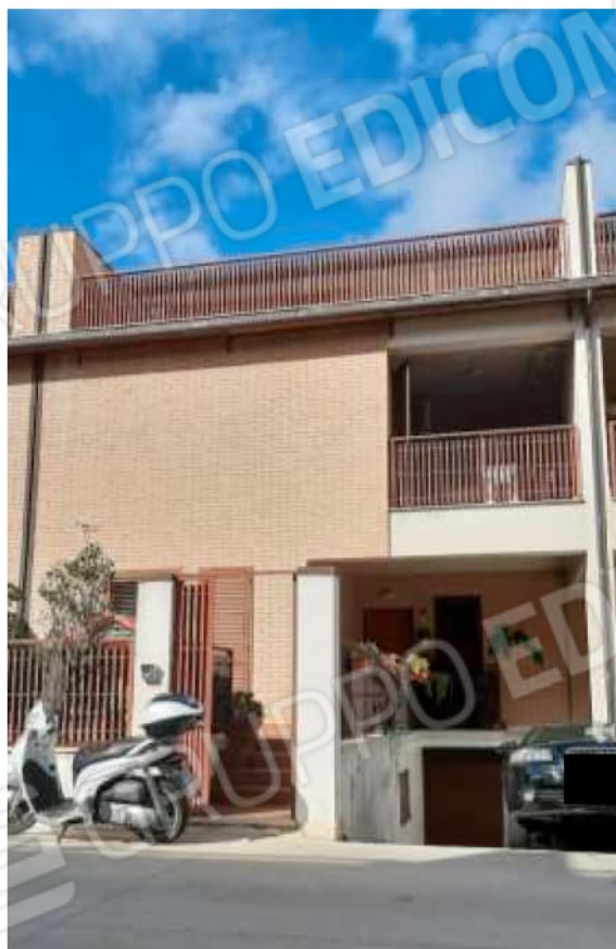
Fronte principale e ingresso al cespite.