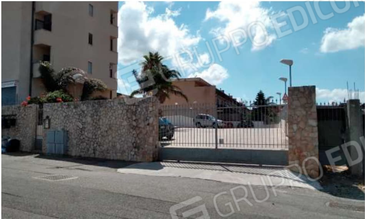
Ingresso carrabile al condominio da Via del Torrente