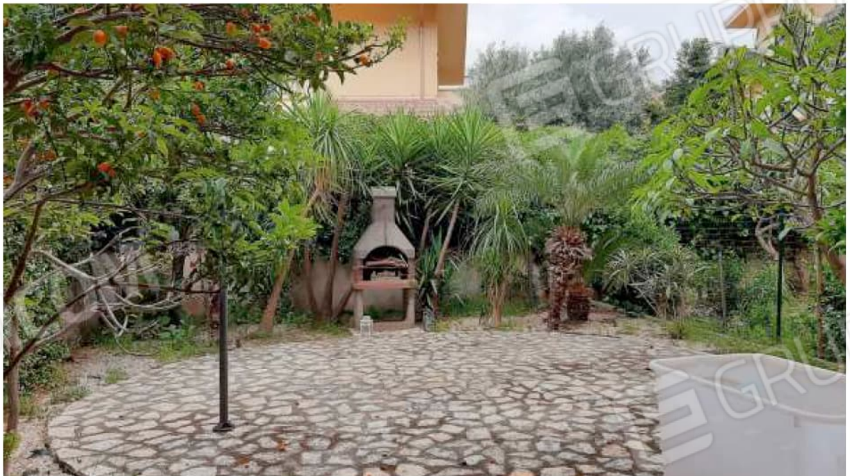
Cortile e giardino al piano terra