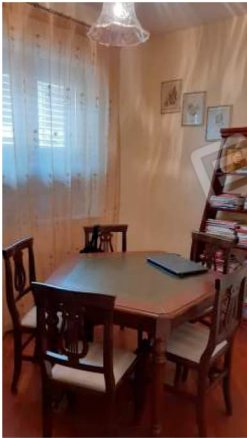
Zona studio al Piano Terra