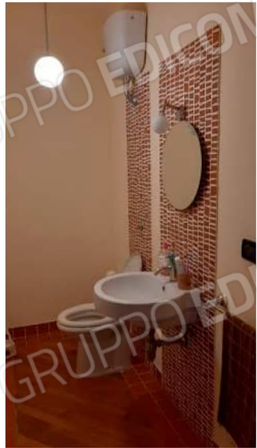
Wc di servizio al Piano Terra