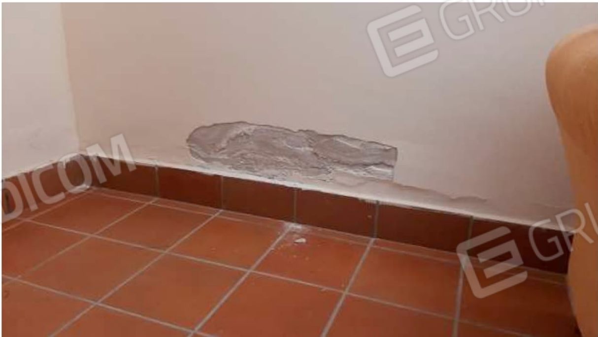
Presenza di umidità al piano seminterrato