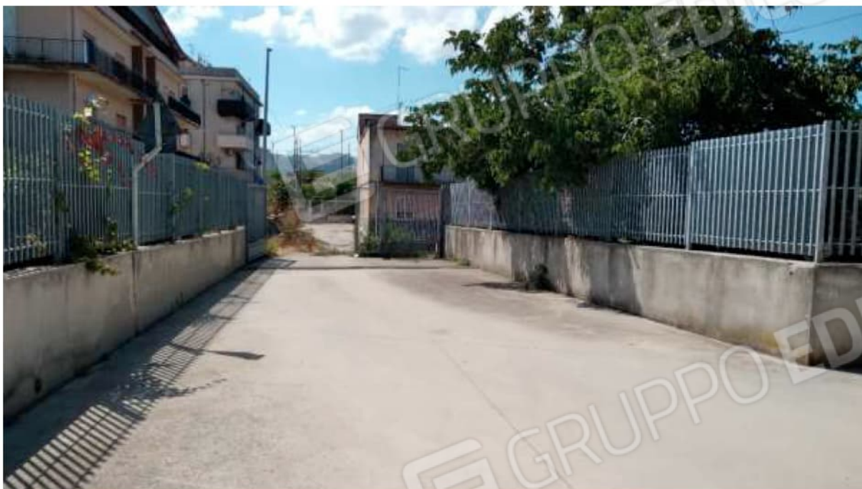
Ingresso al condominio da Via privata Marra (ingresso non utilizzato).