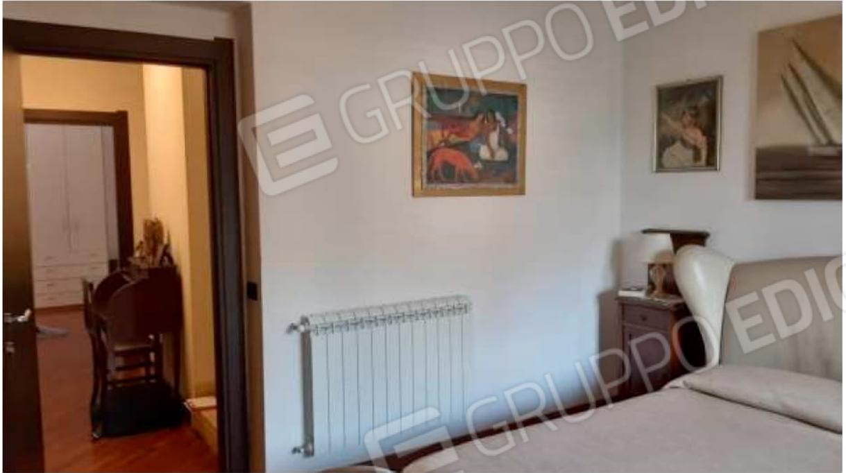
Camera matrimoniale al Piano Primo e disimpegno