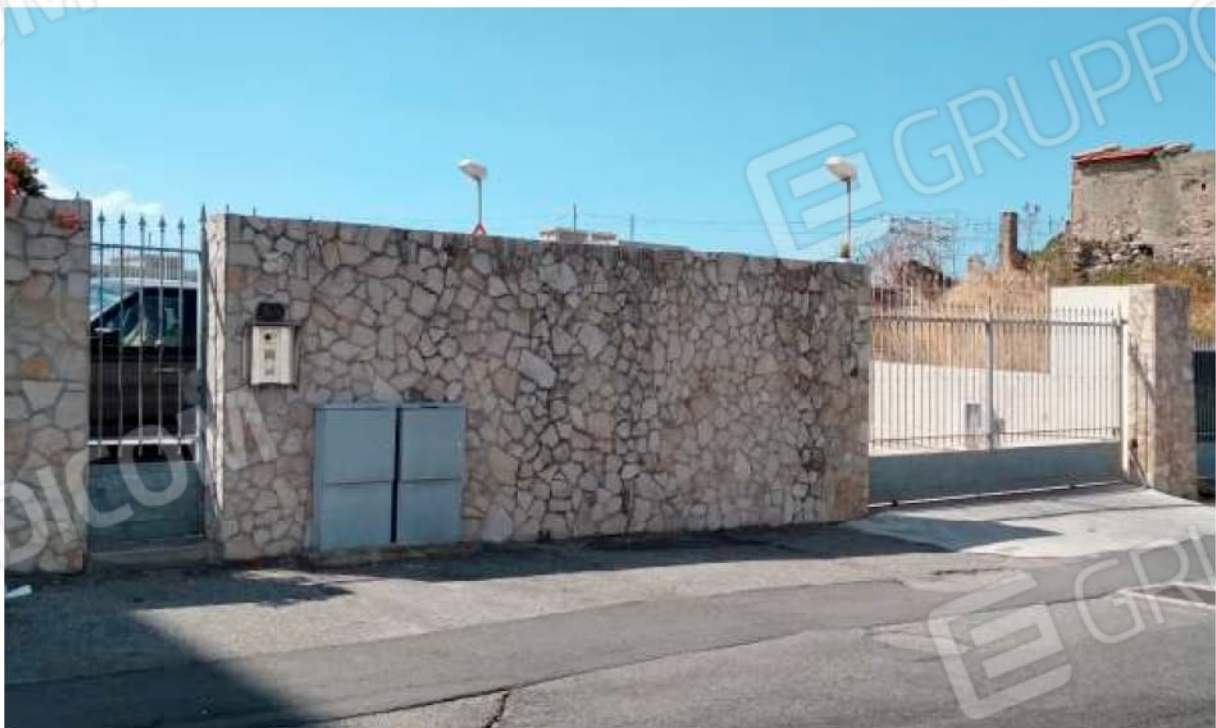
Ingresso pedonale al condominio dal Civico n. 53 di Via del Torrente.