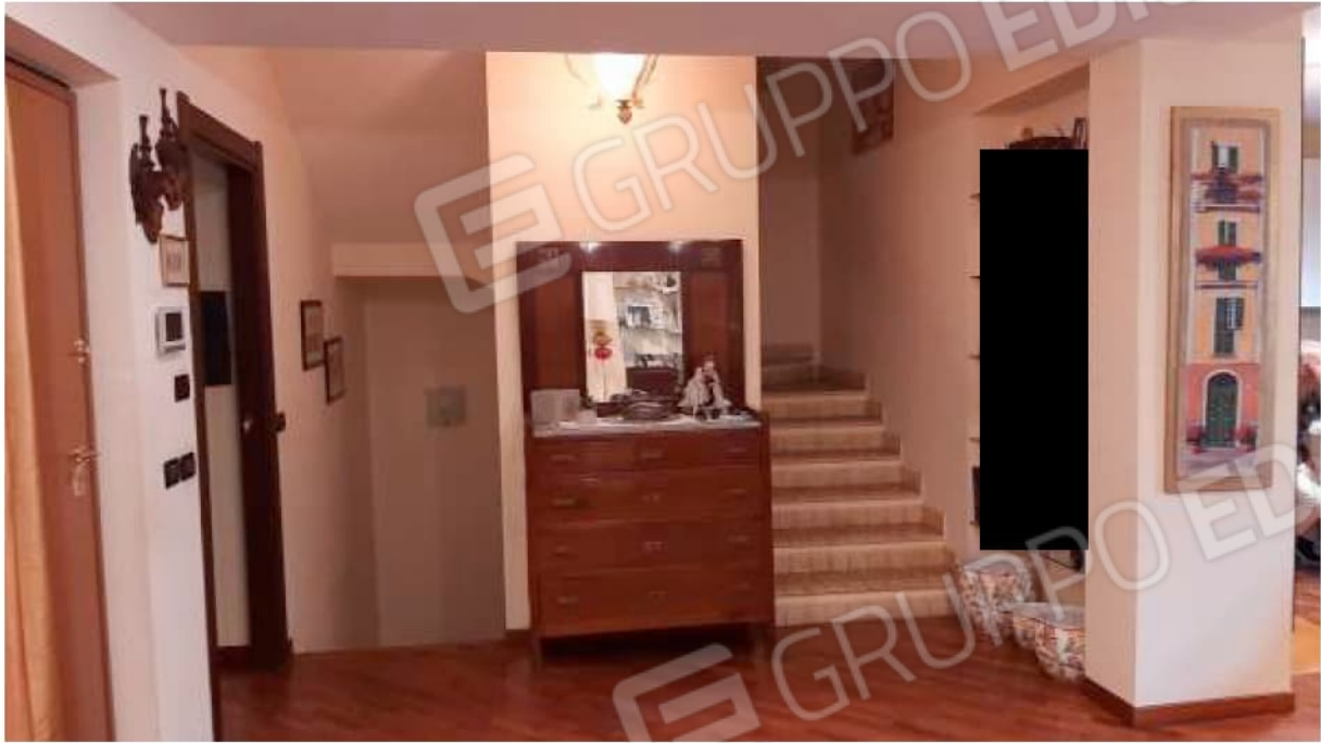
Ingresso al Piano Terra e vista del corpo scala per l'accesso ai piani superiori e al piano S1.