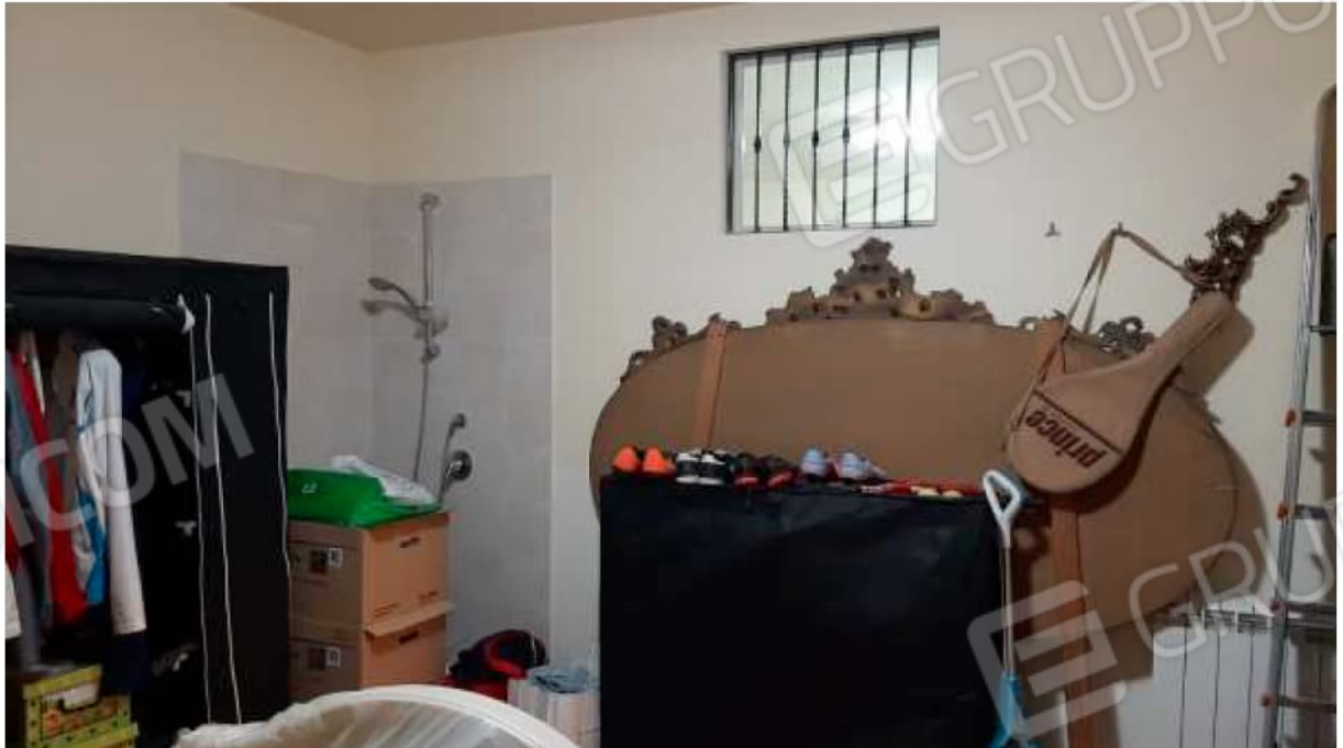
Cantina/deposito al piano seminterrato