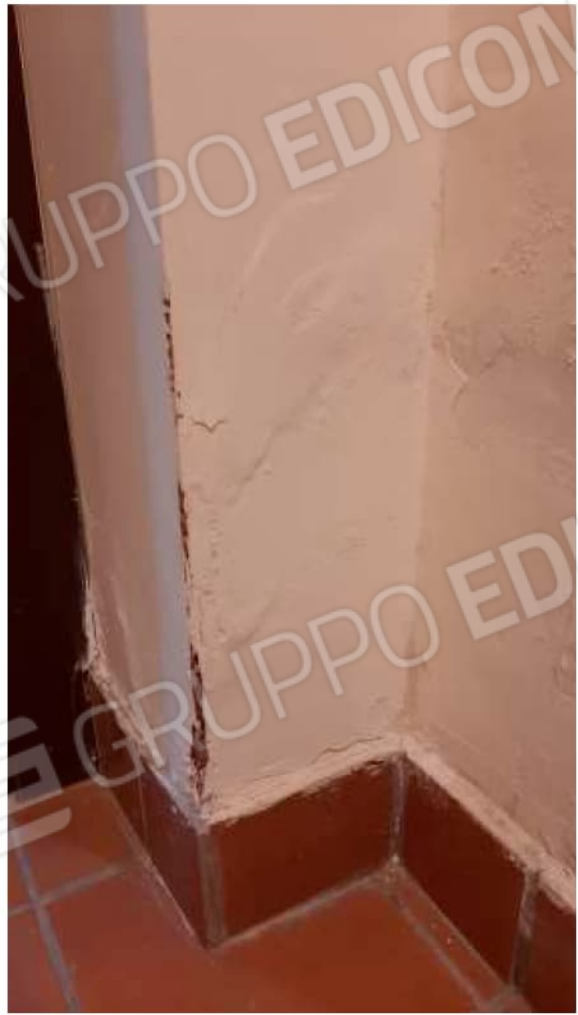
Segni di infiltrazioni al piano Seminterrato