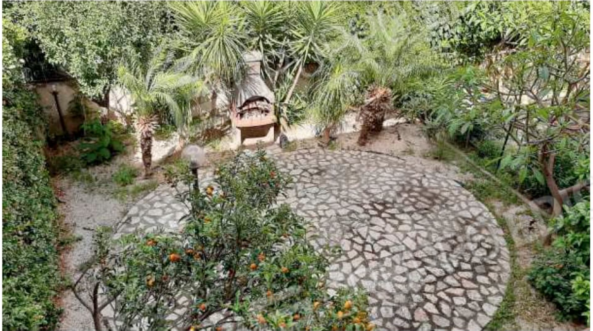
Cortile e giardino al piano terra