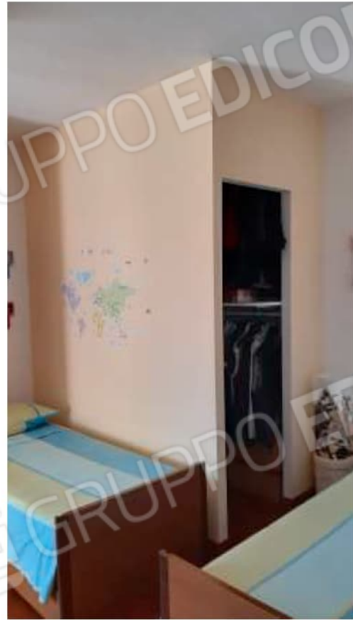
Struttura in cartongesso, uso guardaroba