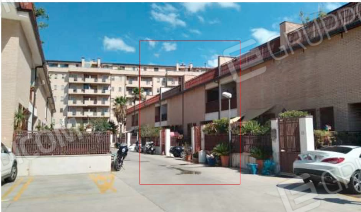
Corte condominiale e accesso agli immobili. Individuazione del cespite visto da Sud.