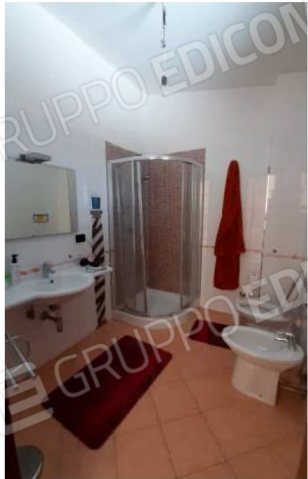
Bagno al Piano Secondo