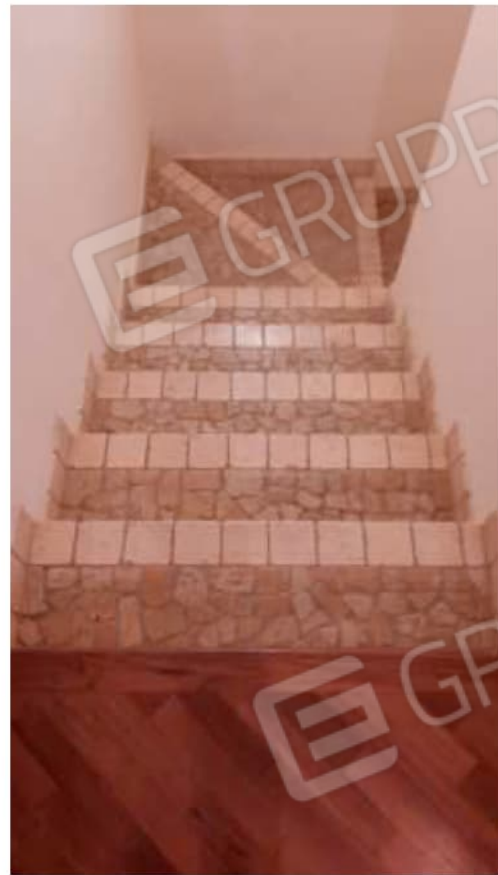
Corpo scala interno a 3 rampe per l'accesso ai piani.