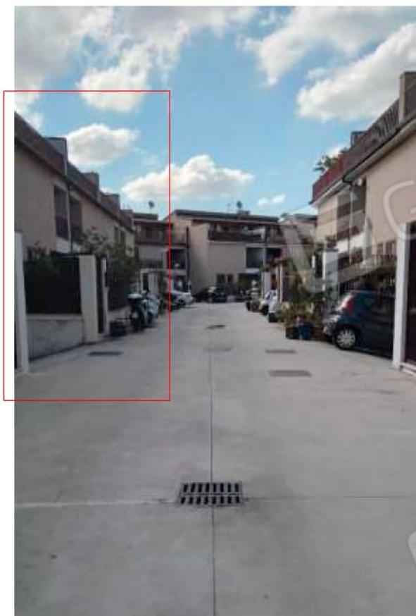
Corte condominiale vista da Nord