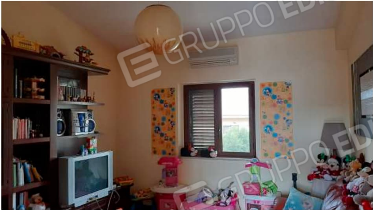
Stanza pluriuso al Piano Secondo