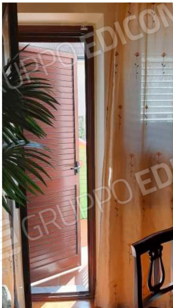
Uscita al terrazzino dallo studio.