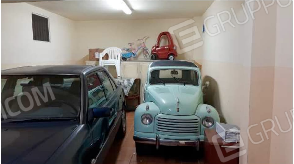
Garage al piano seminterrato