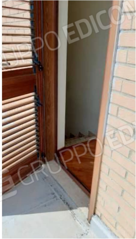
Infiltrazioni e umidità al piano secondo, proveniente dal terrazzo