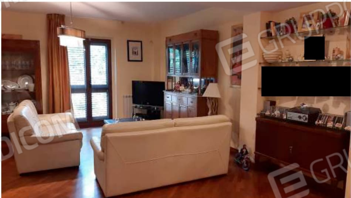
Zona giorno al Piano Terra e vista dall'ingresso sul salotto