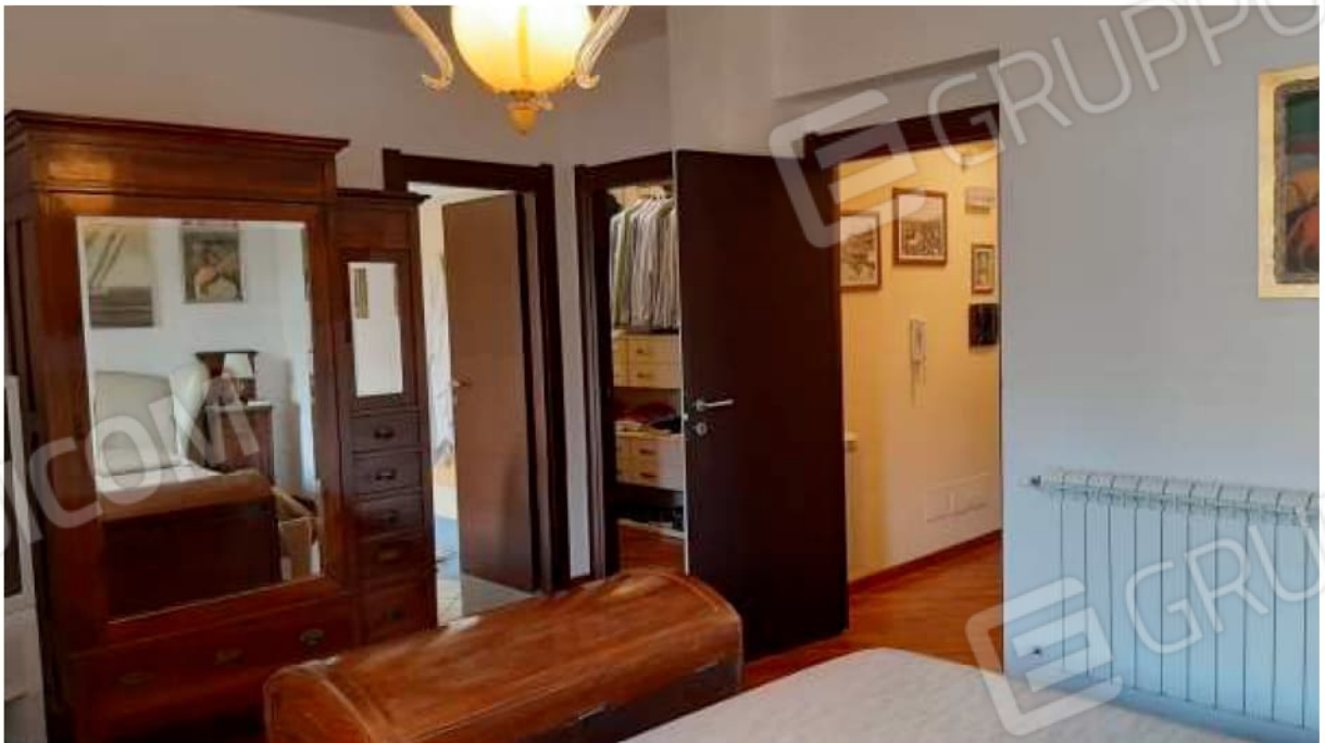
Vista degli accessi al bagno interno e alla cabina armadio