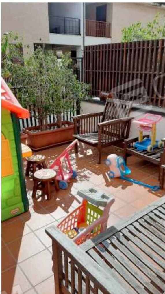
Terrazzino al Piano Terra