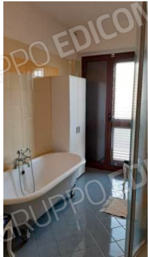
Viste del bagno interno alla camera matrimoniale