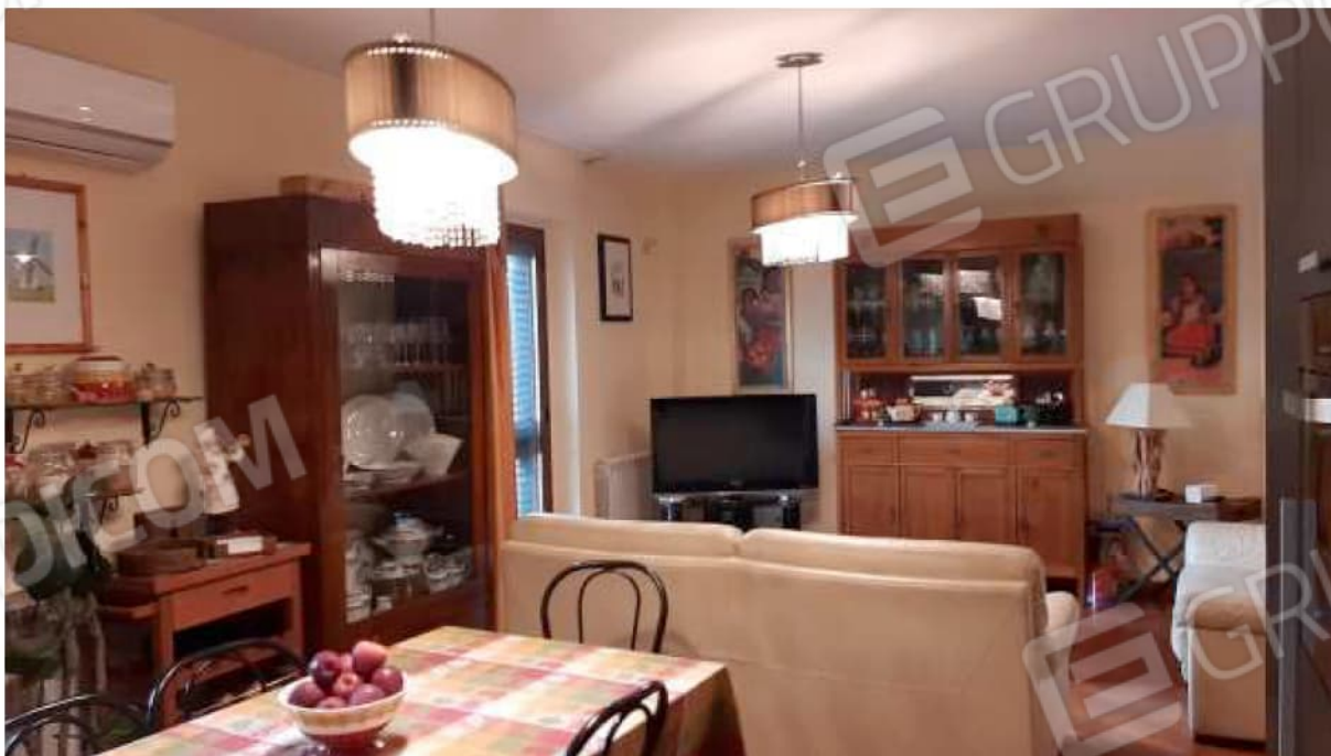
Vista del salotto dalla zona pranzo