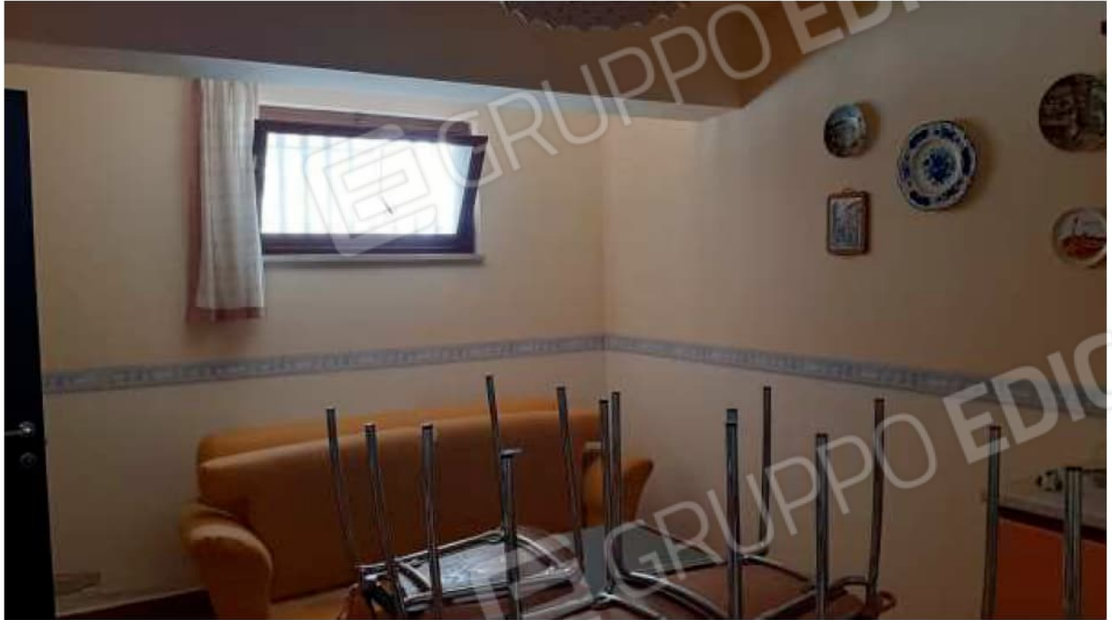
Cantina/tavernetta al piano seminterrato