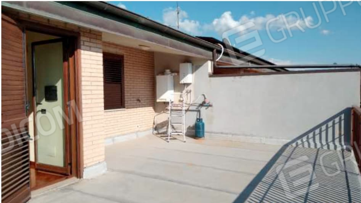
Terrazzo al Piano Secondo in cui sono presenti lavori di manutenzione per eliminare le infiltrazioni al piano sottostante.