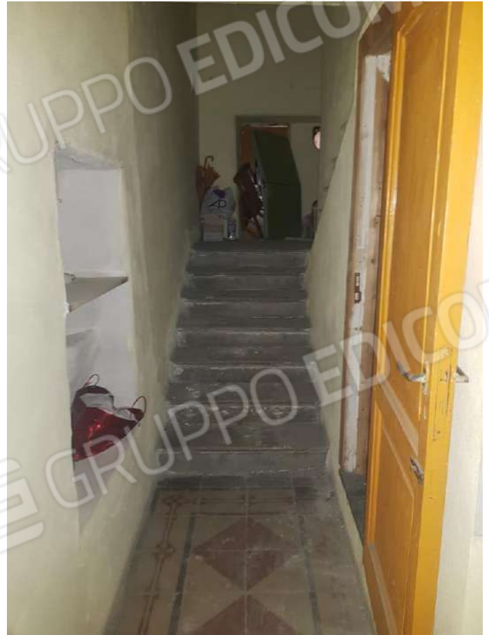
Foto n.18: accesso immobile al piano seminterrato identificato catastalmente al foglio n. 124 p.lla 69 sub.9