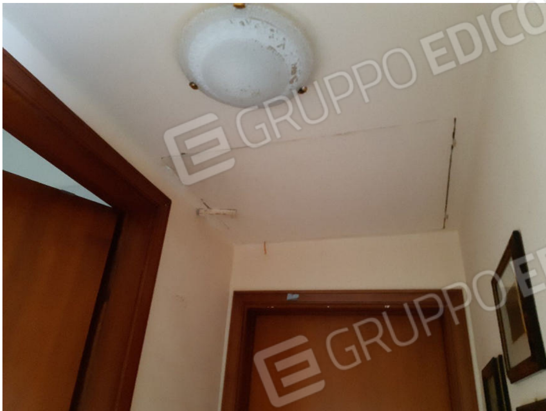
Figura 27: cono ottico 27 – Corridoio