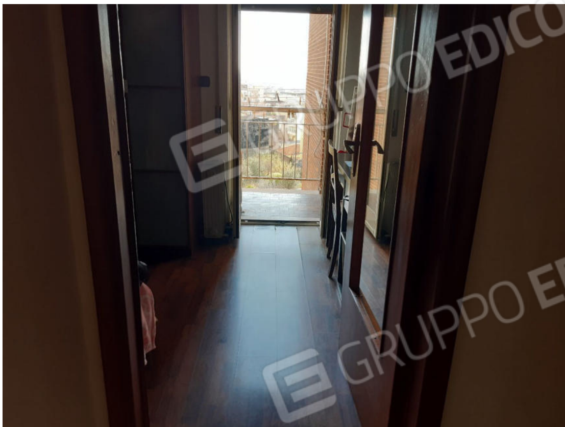
Figura 31: cono ottico 31 – Camera 1