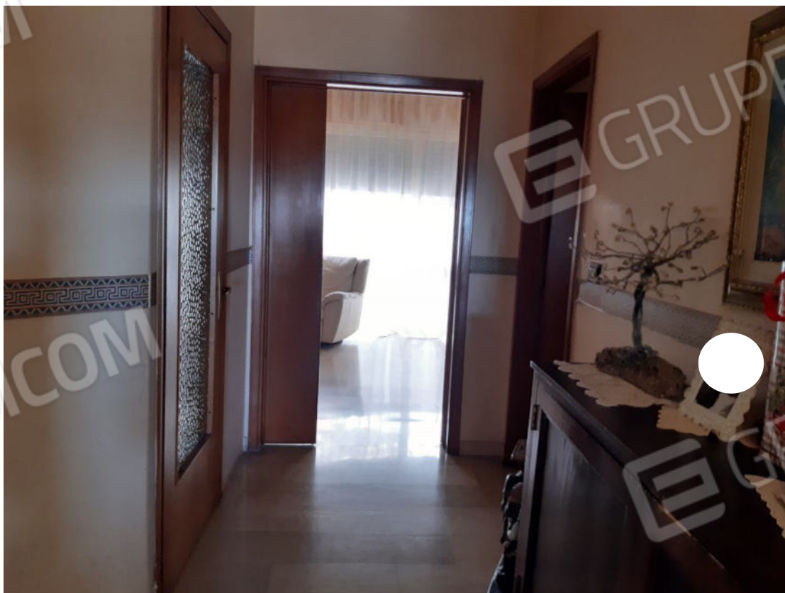
Figura 4: cono ottico 4 – Ingresso