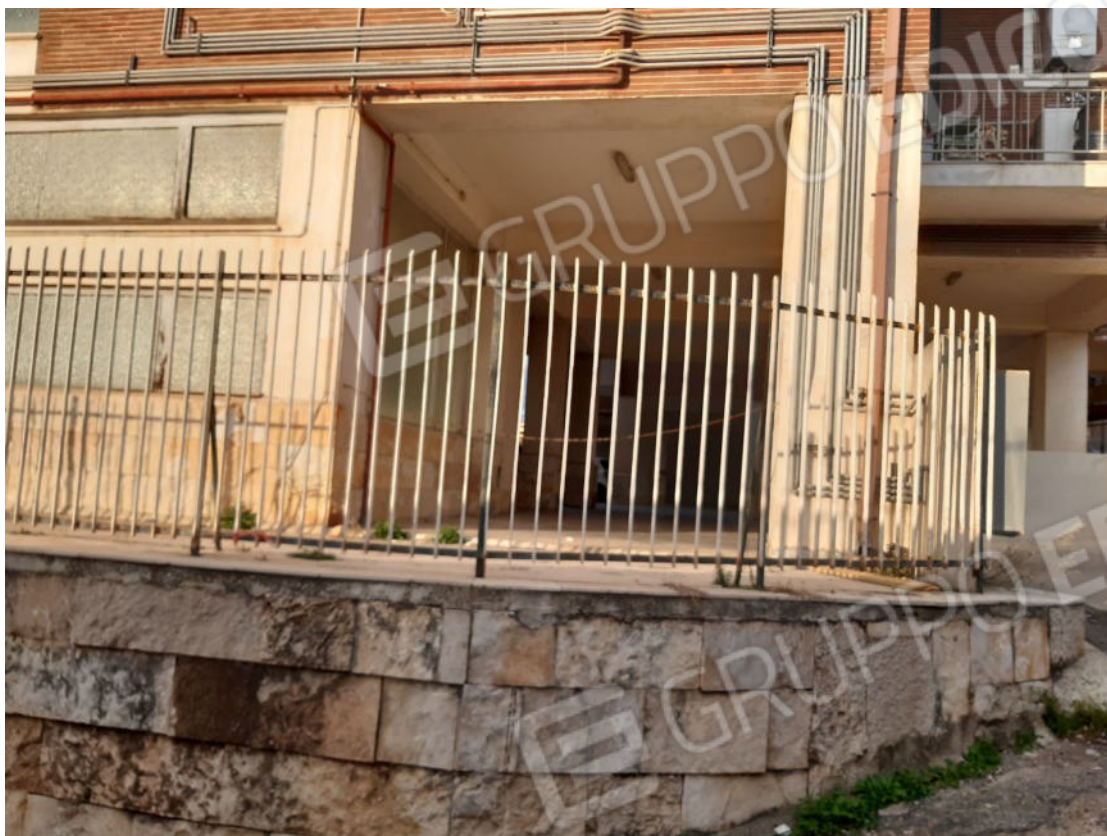
Figura 75: Prospetti esterni del fabbricato e recinzione