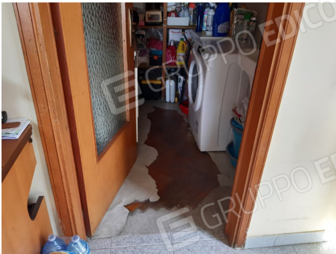
Figura 21: cono ottico 21 – Ripostiglio 2