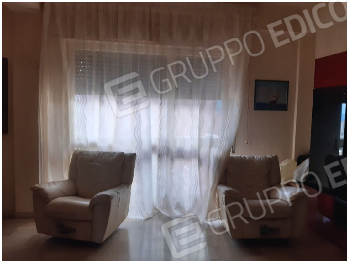
Figura 7: cono ottico 7 – Soggiorno