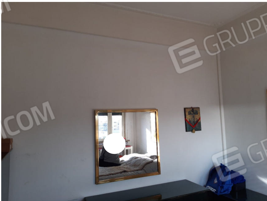
Figura 42: cono ottico 42 – Camera 2