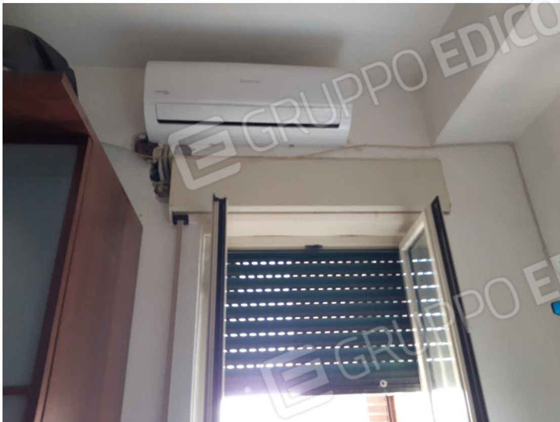
Figura 35: cono ottico 35 – Camera 1