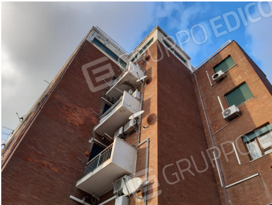
Figura 71: Prospetti esterni del fabbricato