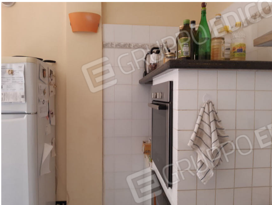
Figura 15: cono ottico 15 – Cucina