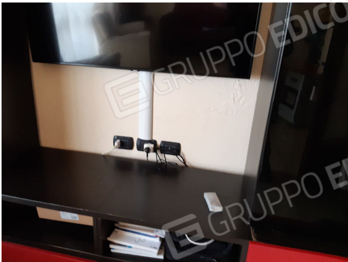
Figura 9: cono ottico 9 – Soggiorno