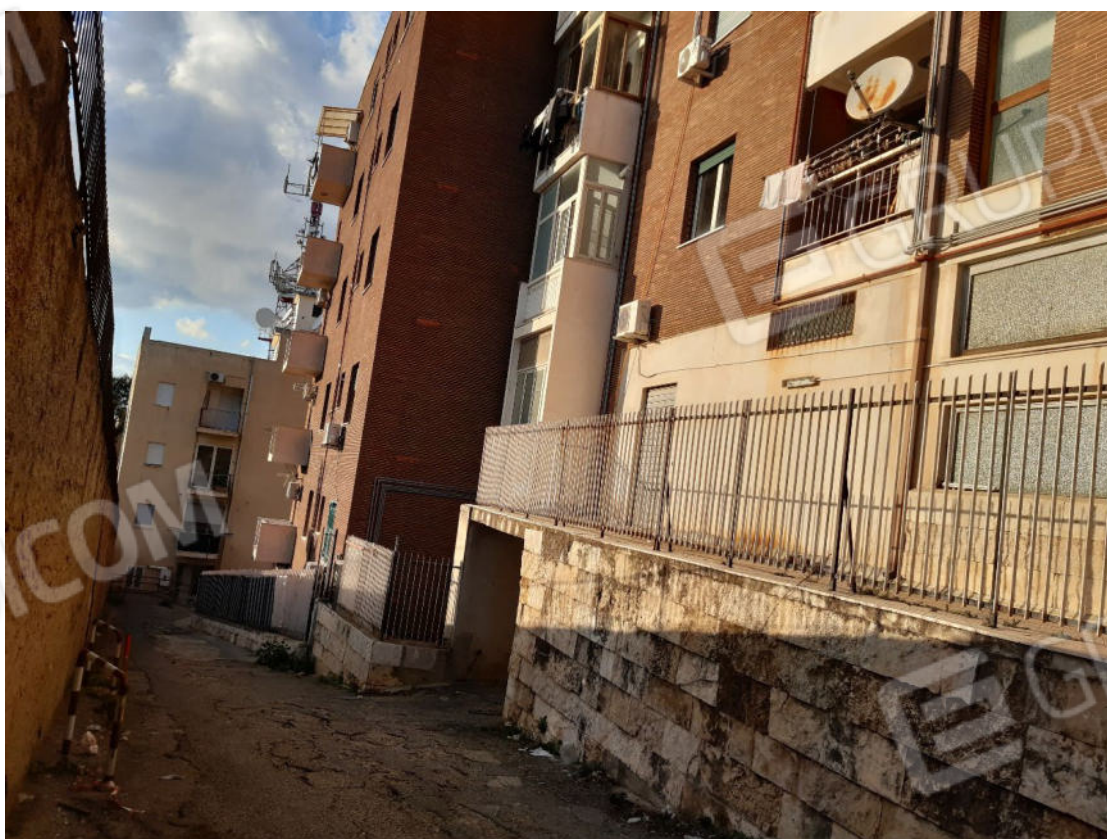
Figura 74: Prospetti esterni del fabbricato e recinzione