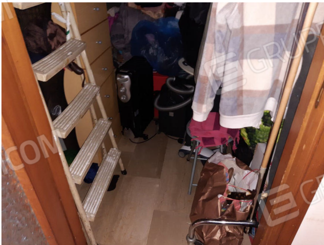
Figura 6: cono ottico 6 – Ripostiglio 1