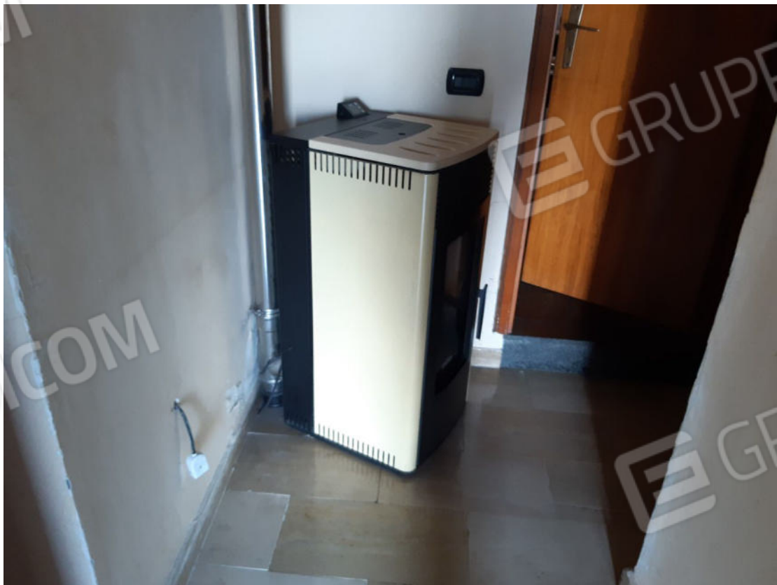
Figura 30: cono ottico 30 – Corridoio