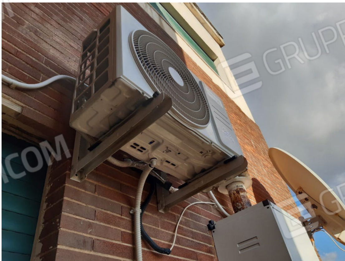
Figura 24: cono ottico 24 – Balcone 2