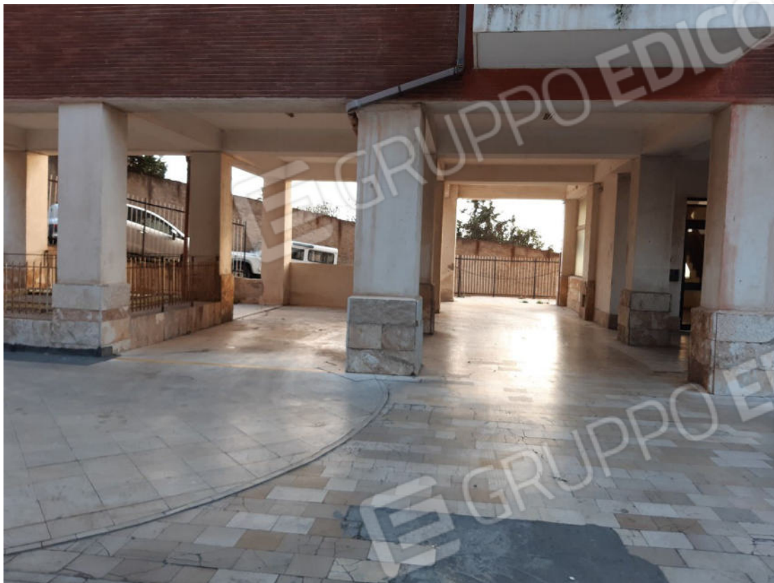
Figura 67: Area esterna comune (cortile piano terra)