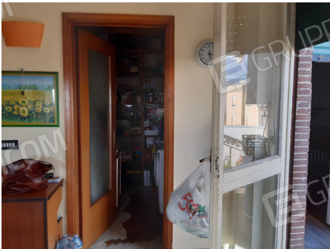
Figura 20: cono ottico 20 – Ripostiglio 2