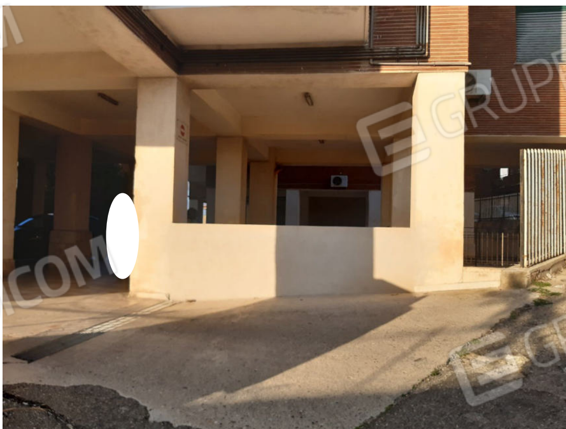
Figura 76: Prospetti esterni del fabbricato e recinzione