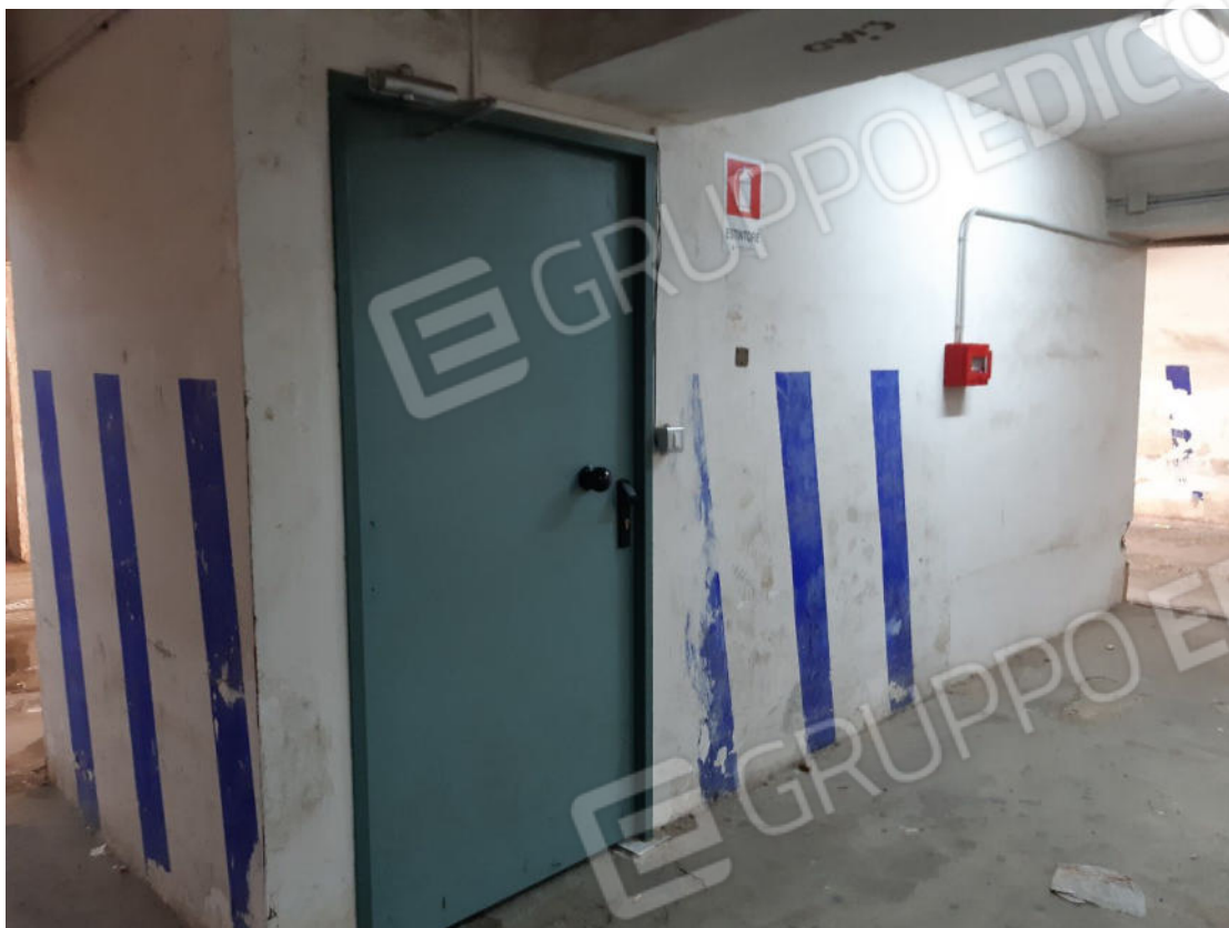
Figura 59: Accesso al piano primo sottostrada