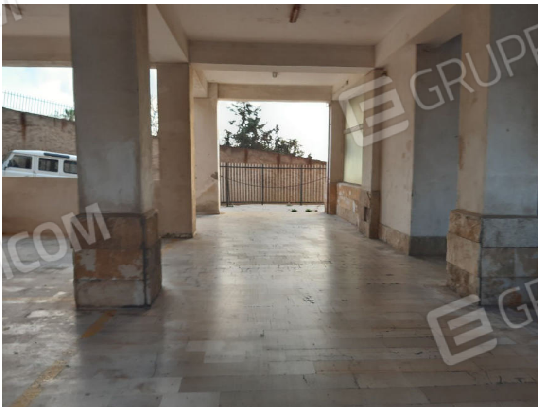
Figura 68: Area esterna comune (cortile piano terra)