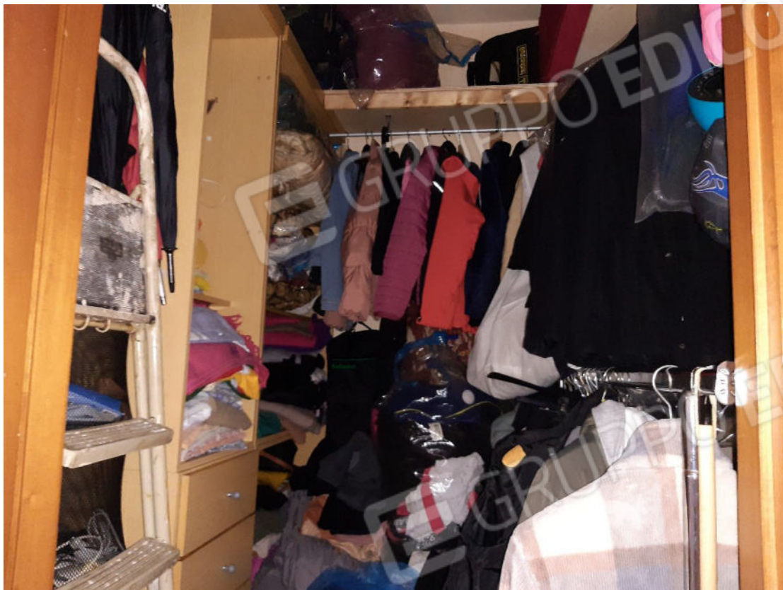
Figura 5: cono ottico 5 – Ripostiglio 1