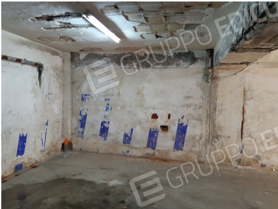
Figura 47: cono ottico 47 – Garage