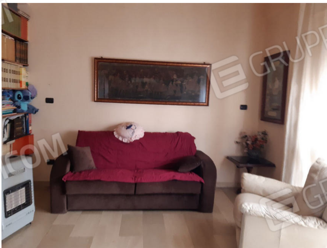
Figura 10: cono ottico 10 – Soggiorno