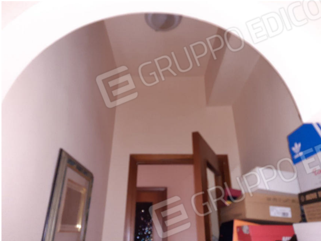
Figura 29: cono ottico 29 – Corridoio