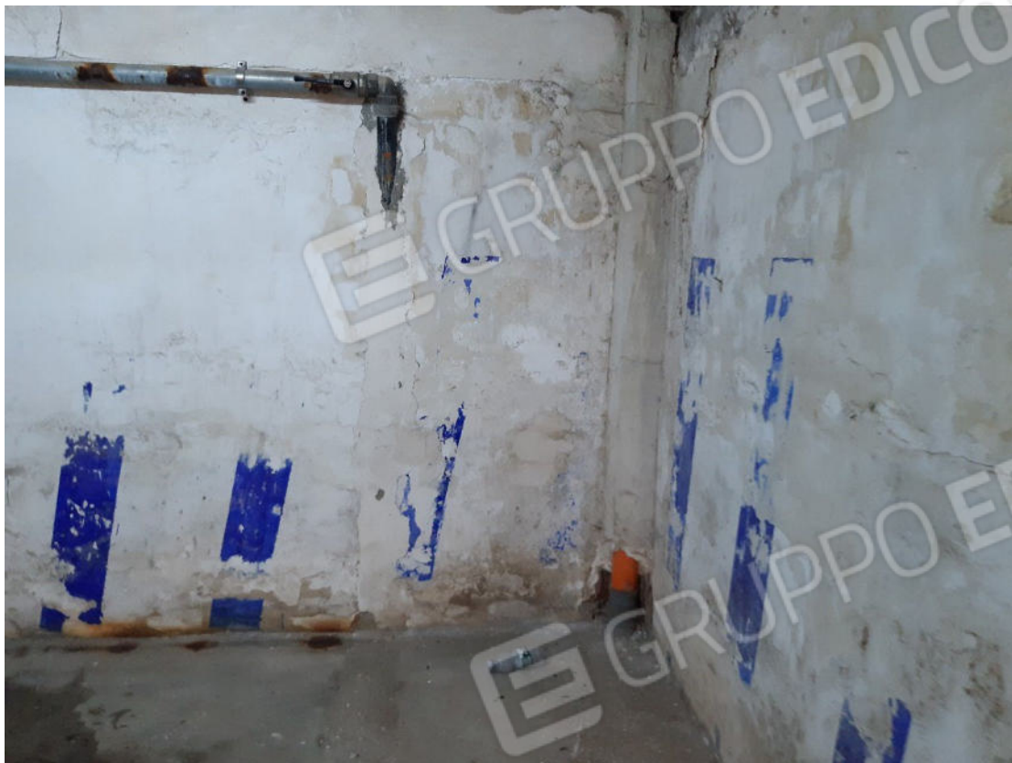
Figura 51: cono ottico 51 – Garage