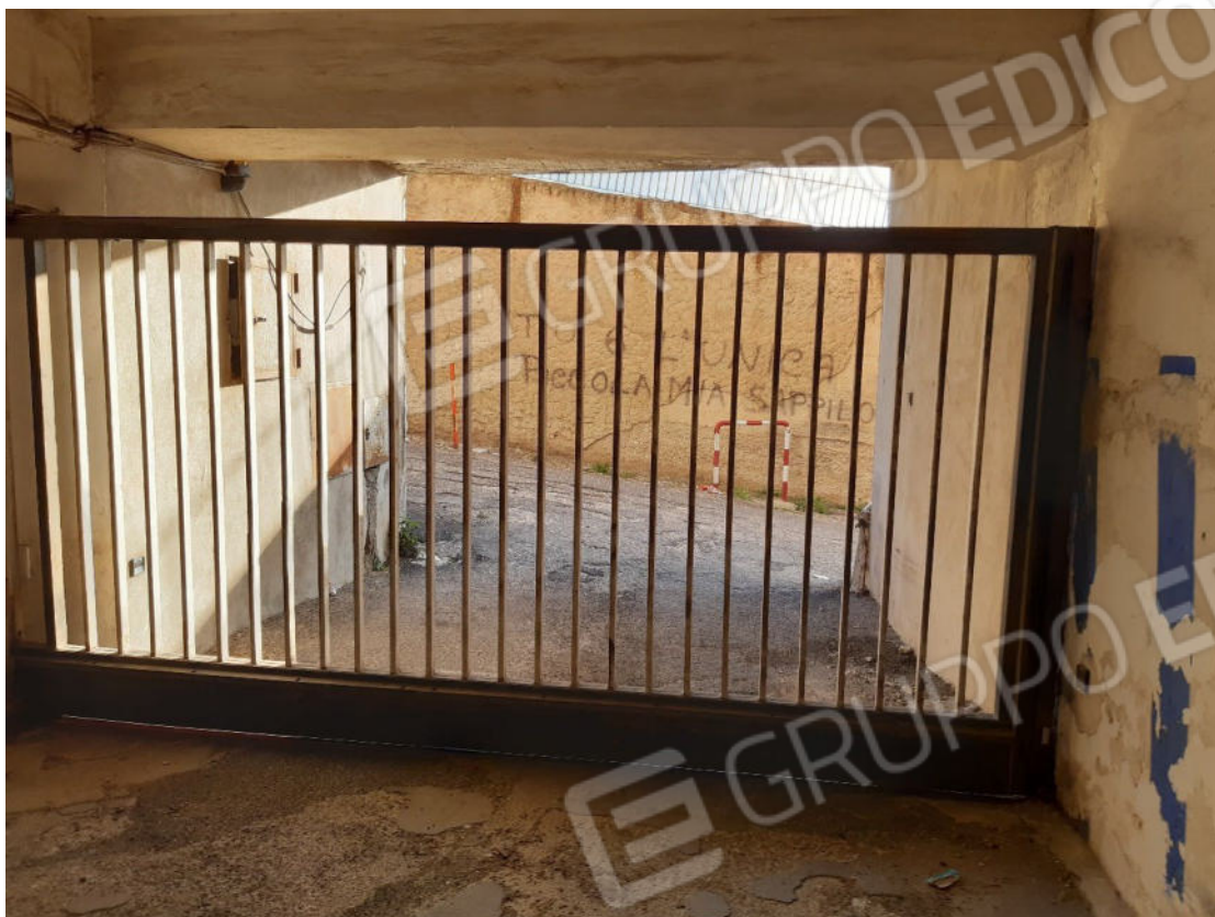
Figura 57: Accesso al piano primo sottostrada