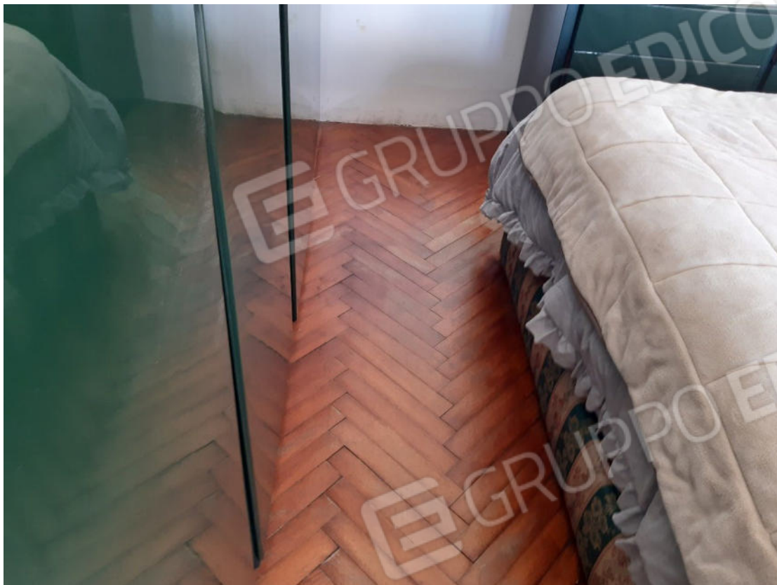
Figura 43: cono ottico 43 – Camera 2