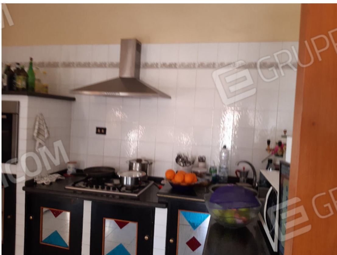
Figura 16: cono ottico 16 – Cucina