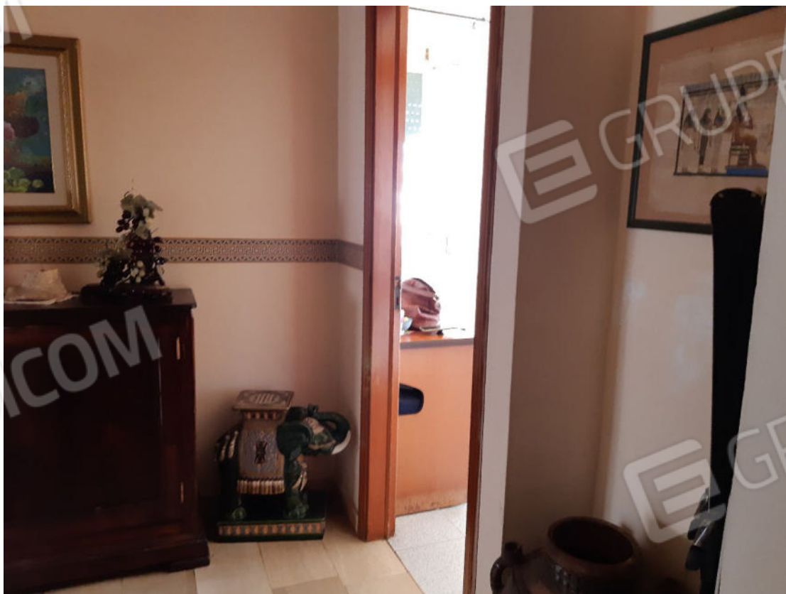
Figura 2: cono ottico 2 – Ingresso