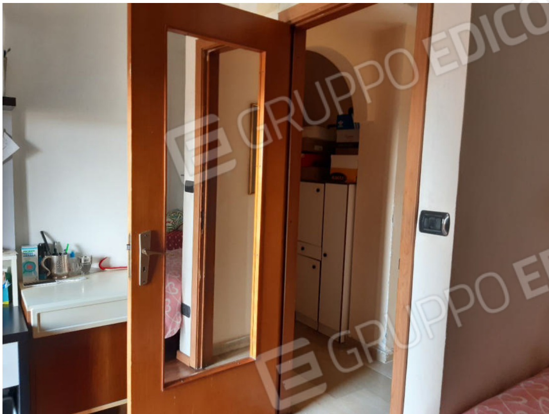
Figura 33: cono ottico 33 – Camera 1