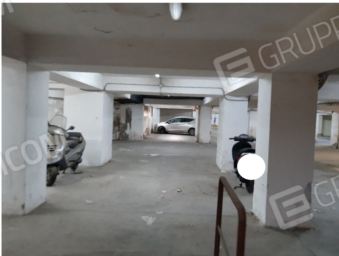
Figura 56: Area comune ed area di manovra piano primo sottostrada