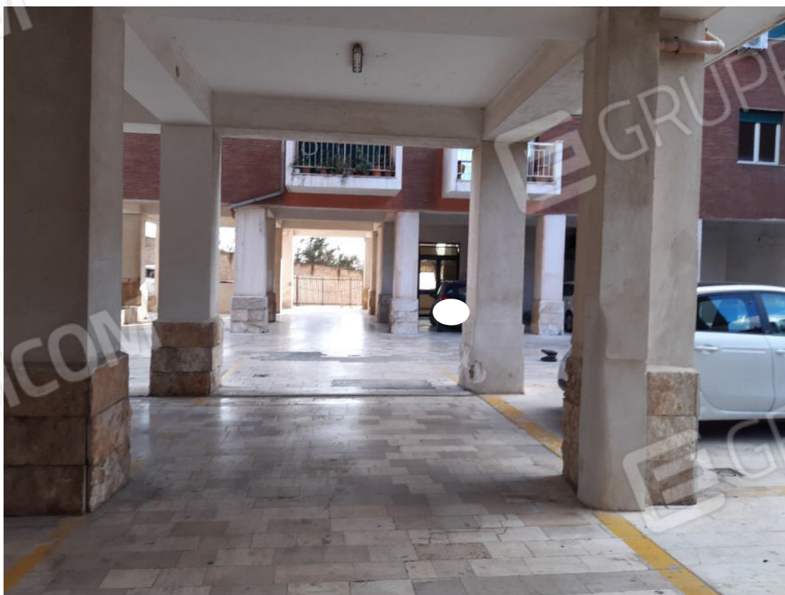
Figura 66: Area esterna comune (cortile piano terra)