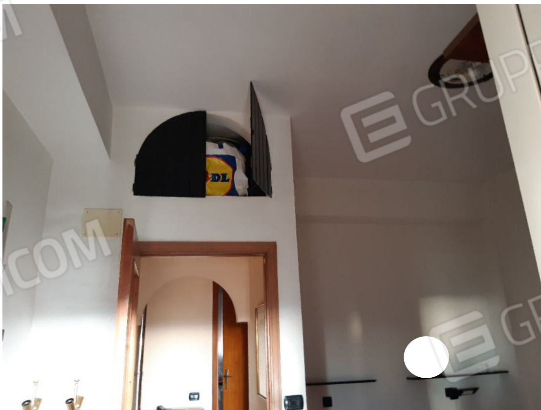
Figura 36: cono ottico 36 – Camera 1