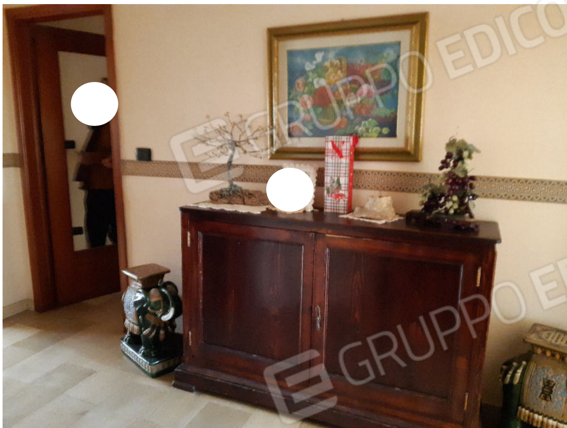
Figura 3: cono ottico 3 – Ingresso