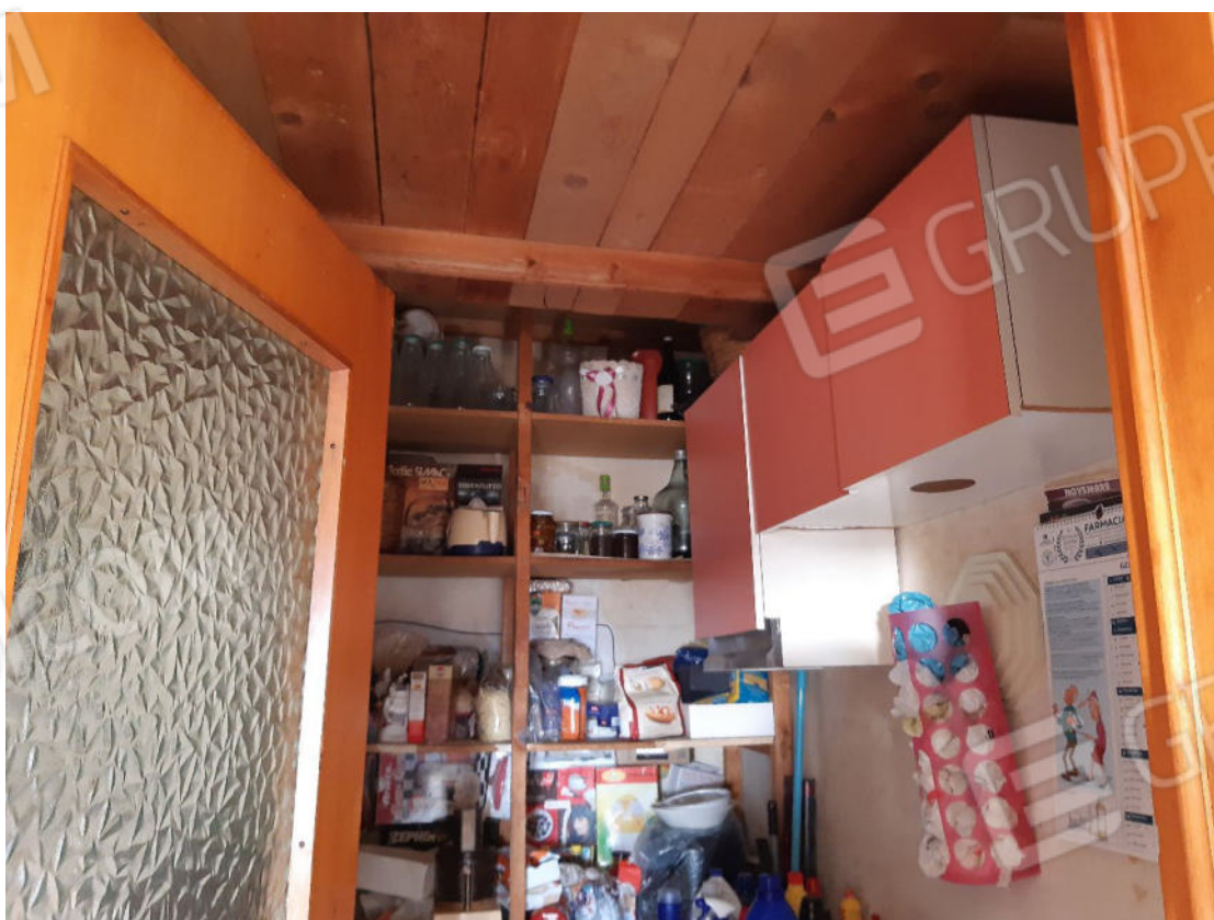
Figura 22: cono ottico 22 – Ripostiglio 2