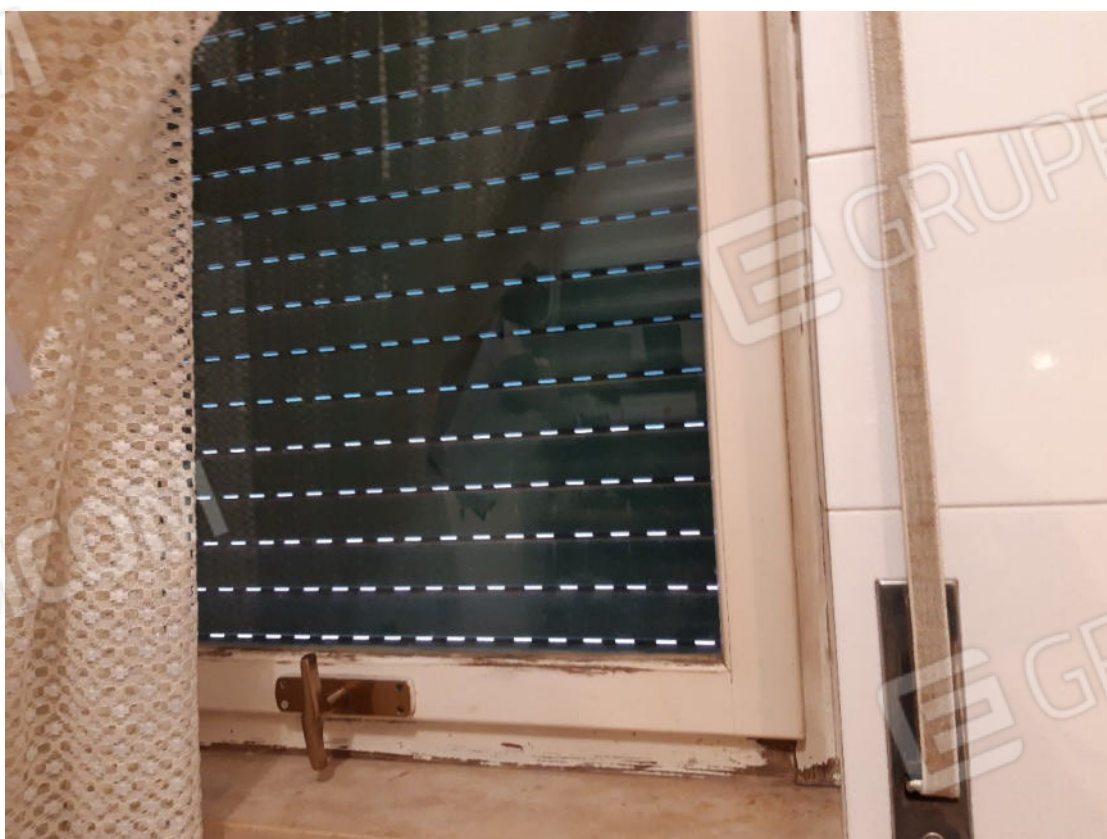
Figura 46: cono ottico 46 – W.C. 2