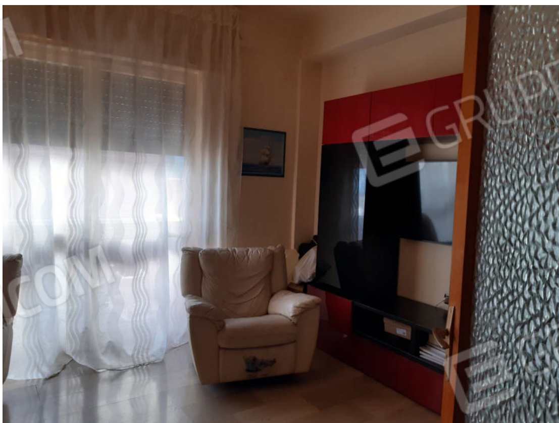
Figura 8: cono ottico 8 – Soggiorno