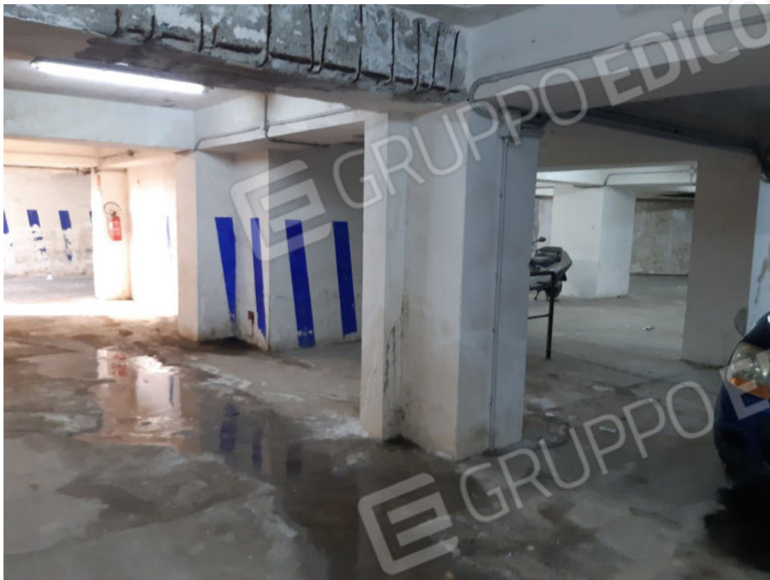
Figura 53: Area comune ed area di manovra piano primo sottostrada