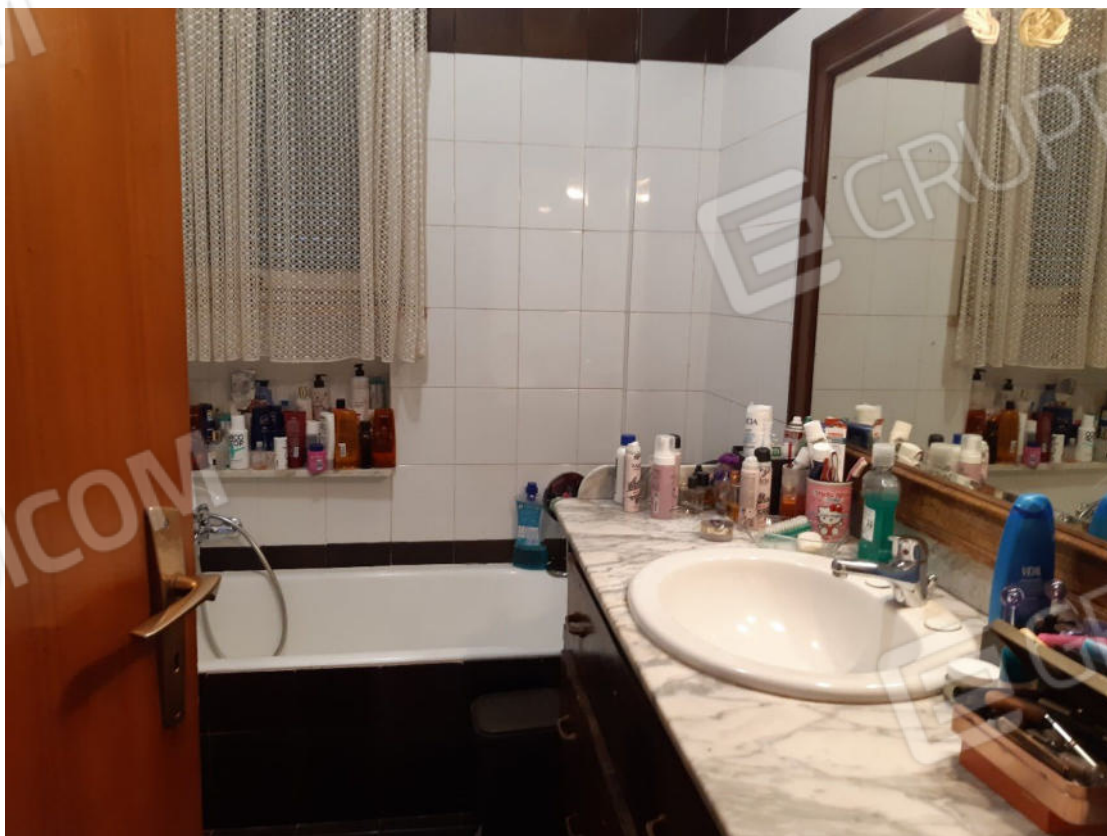
Figura 44: cono ottico 44 – W.C. 2