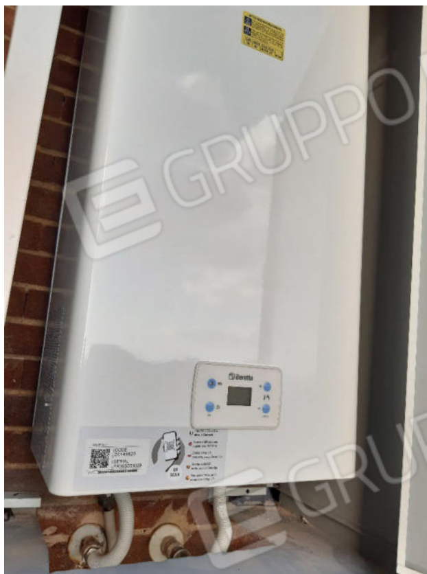
Figura 25: cono ottico 25 – Balcone 2