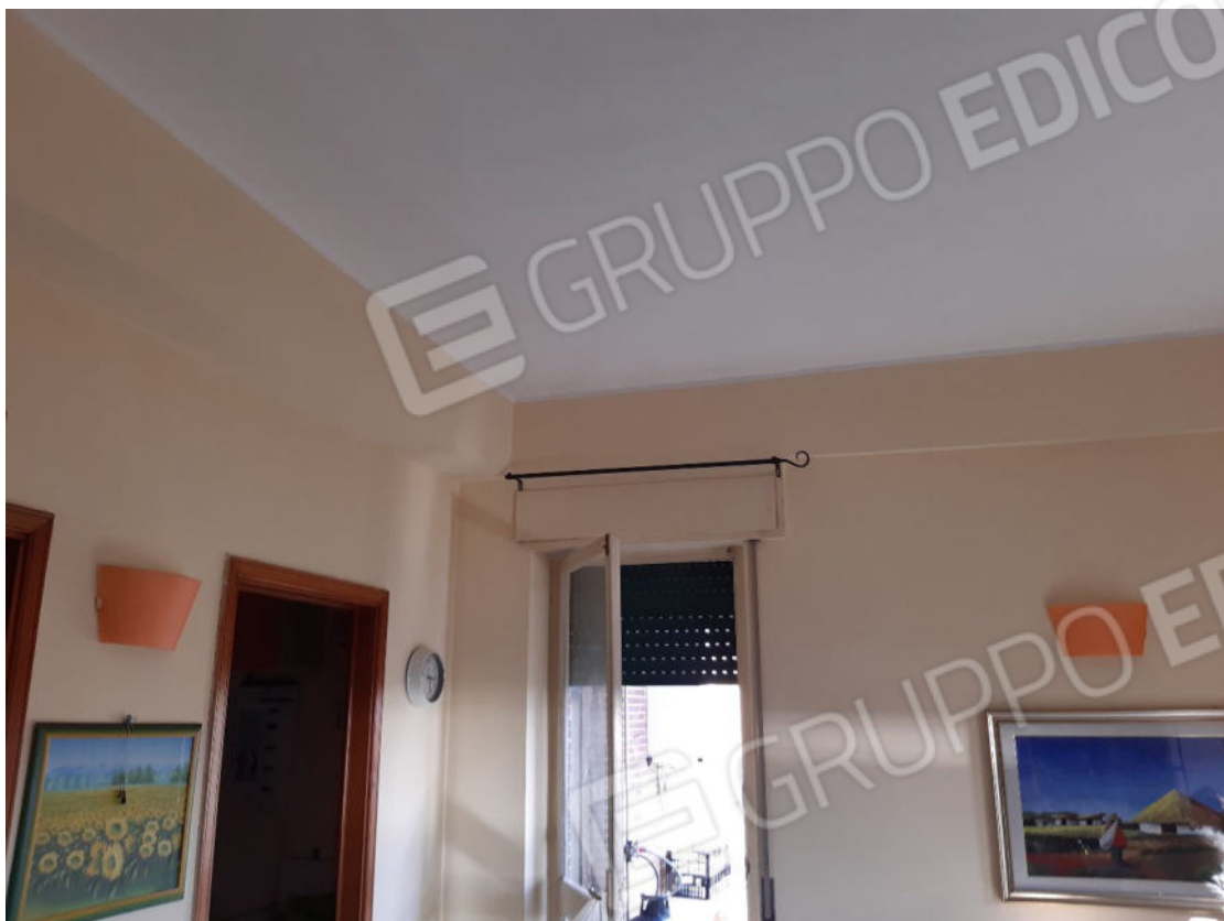
Figura 17: cono ottico 17 – Cucina