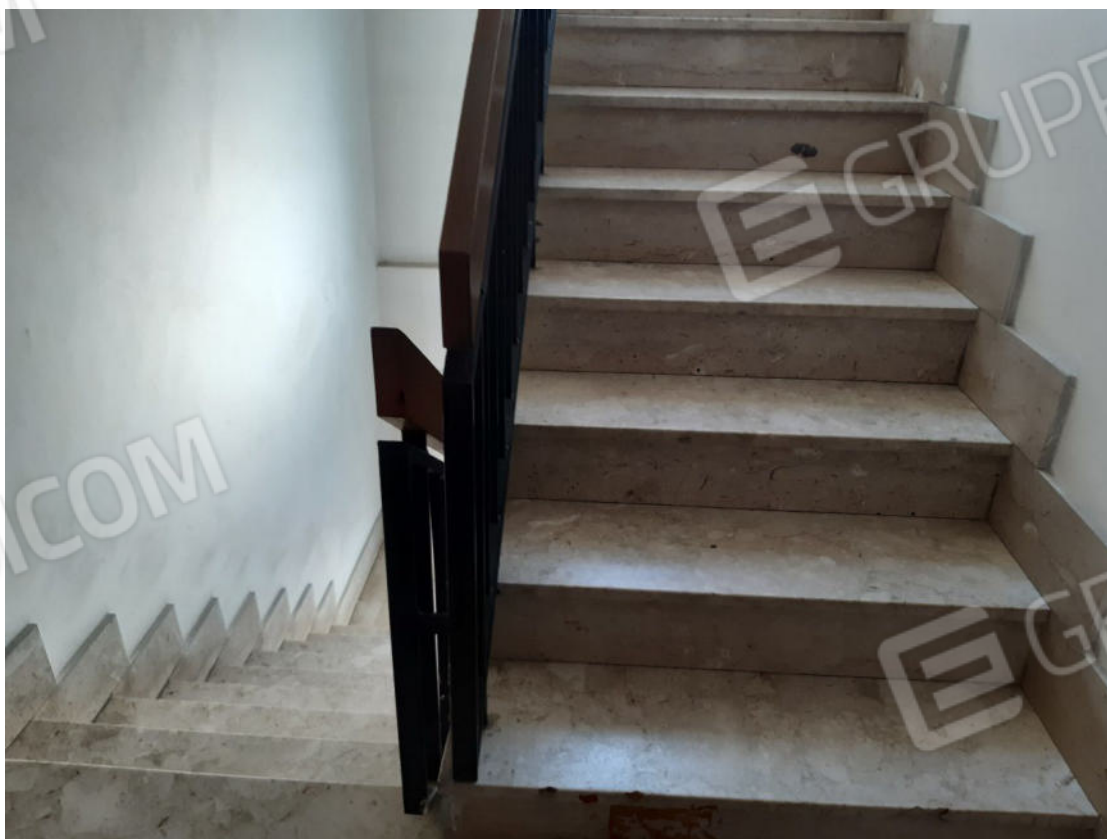
Figura 62: Vano scala comune