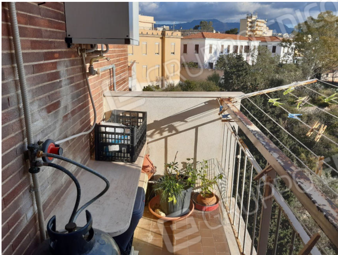
Figura 23: cono ottico 23 – Balcone 2