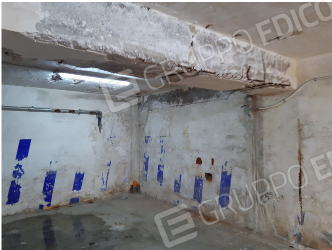
Figura 49: cono ottico 49 – Garage