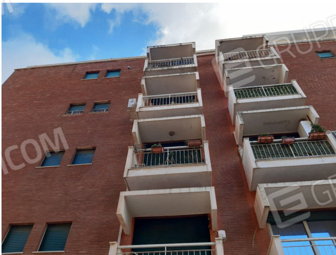
Figura 72: Prospetti esterni del fabbricato