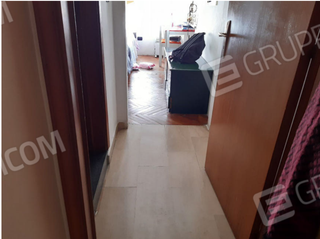
Figura 40: cono ottico 40 – Disimpegno