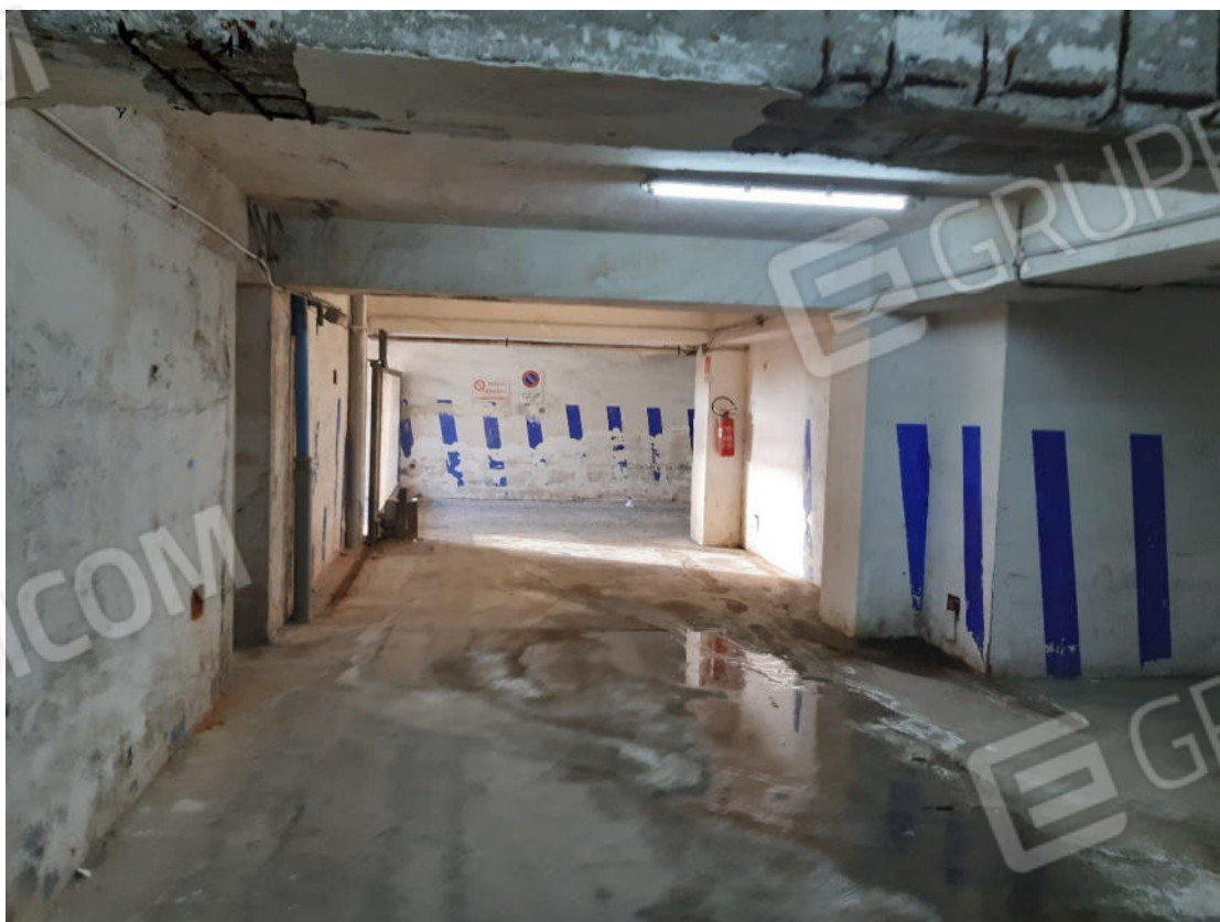
Figura 54: Area comune ed area di manovra piano primo sottostrada