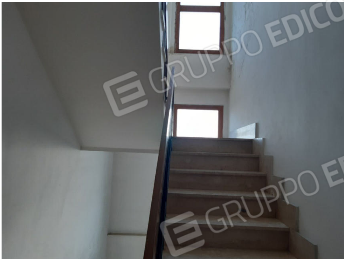
Figura 63: Vano scala comune