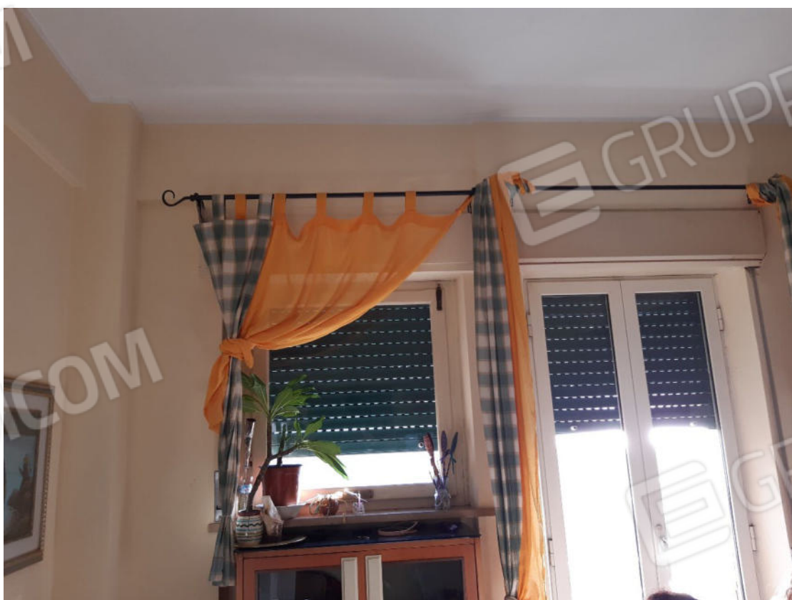
Figura 18: cono ottico 18 – Cucina