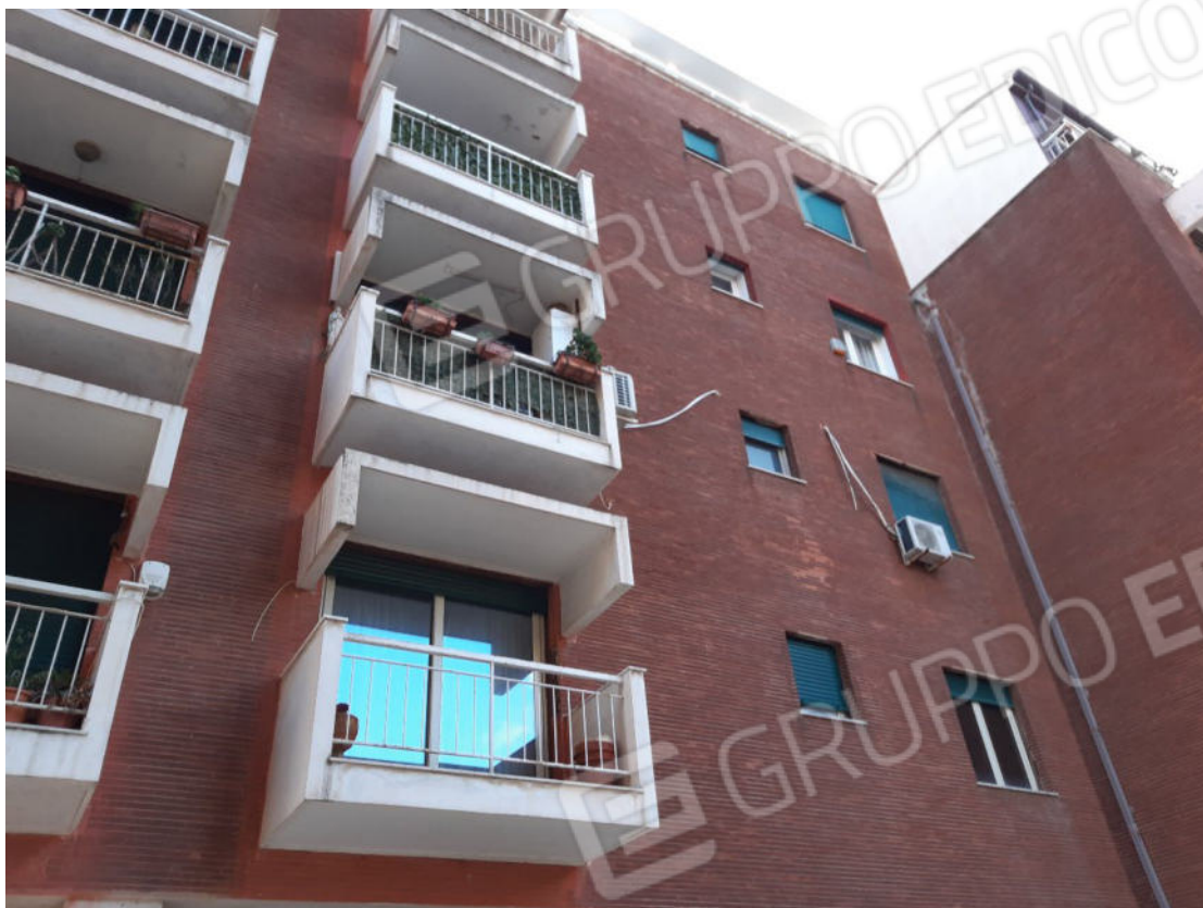
Figura 73: Prospetti esterni del fabbricato