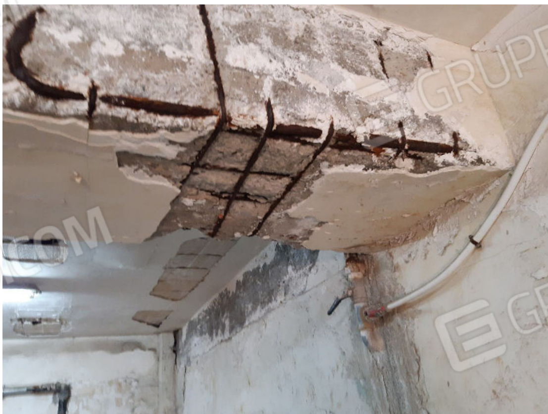
Figura 52: cono ottico 52 – Garage