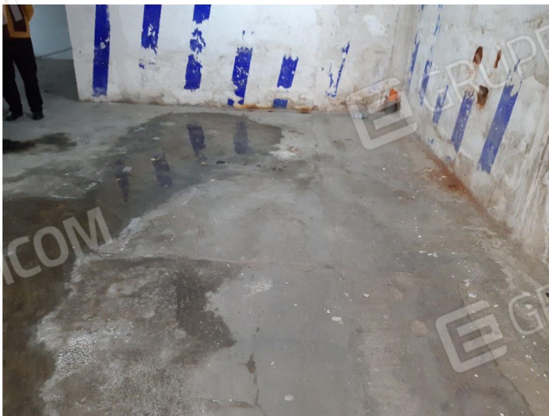
Figura 50: cono ottico 50 – Garage