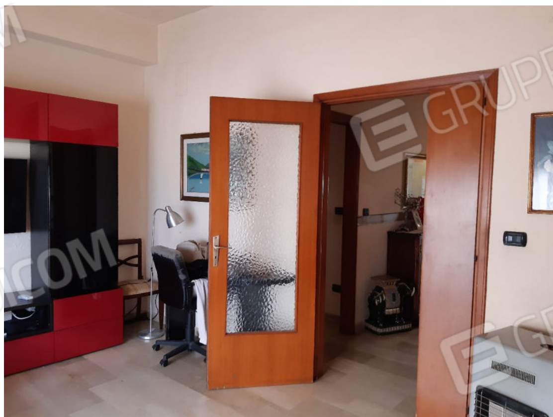
Figura 12: cono ottico 12 – Soggiorno