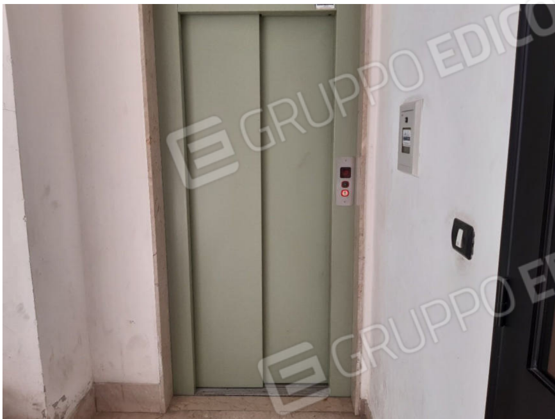
Figura 61: Vano scala comune