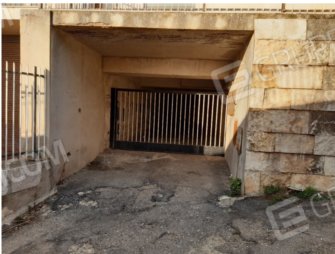
Figura 58: Accesso al piano primo sottostrada