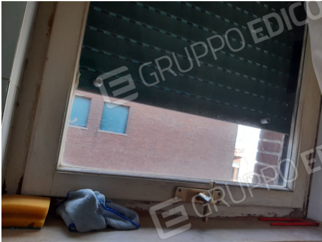
Figura 39: cono ottico 39 – W.C. 1