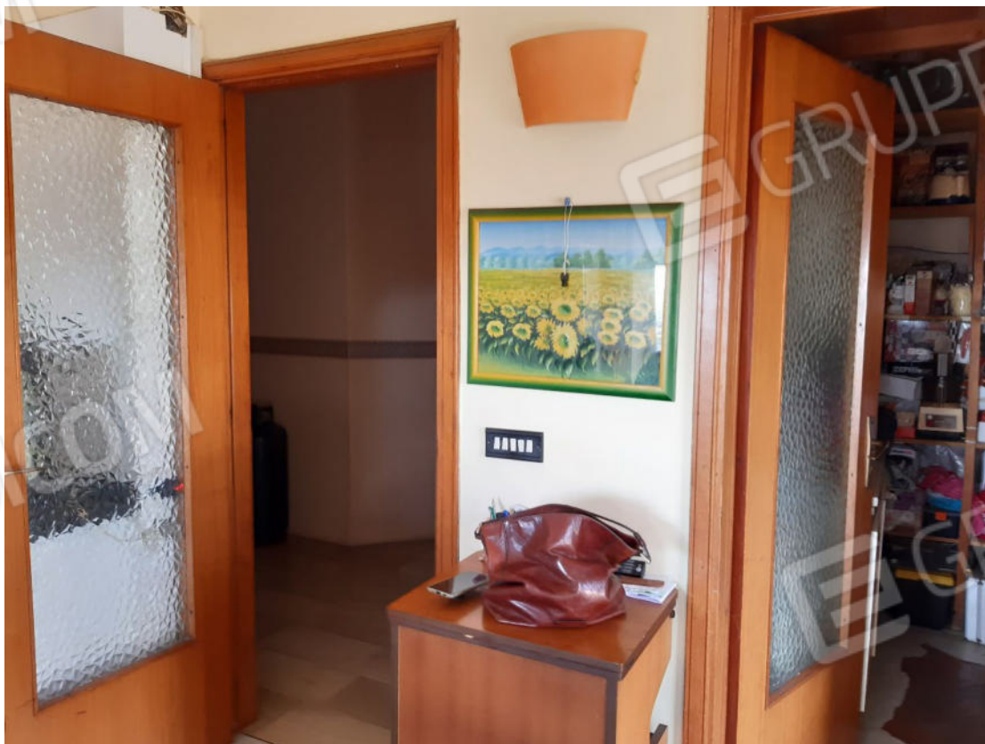
Figura 14: cono ottico 14 – Cucina