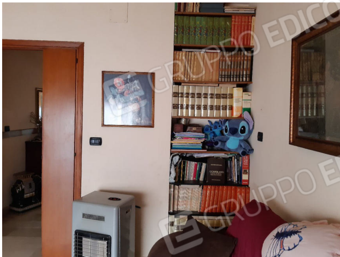
Figura 11: cono ottico 11 – Soggiorno