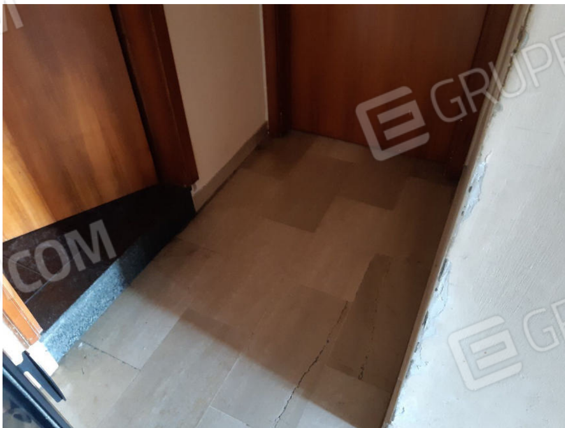
Figura 26: cono ottico 26 – Corridoio