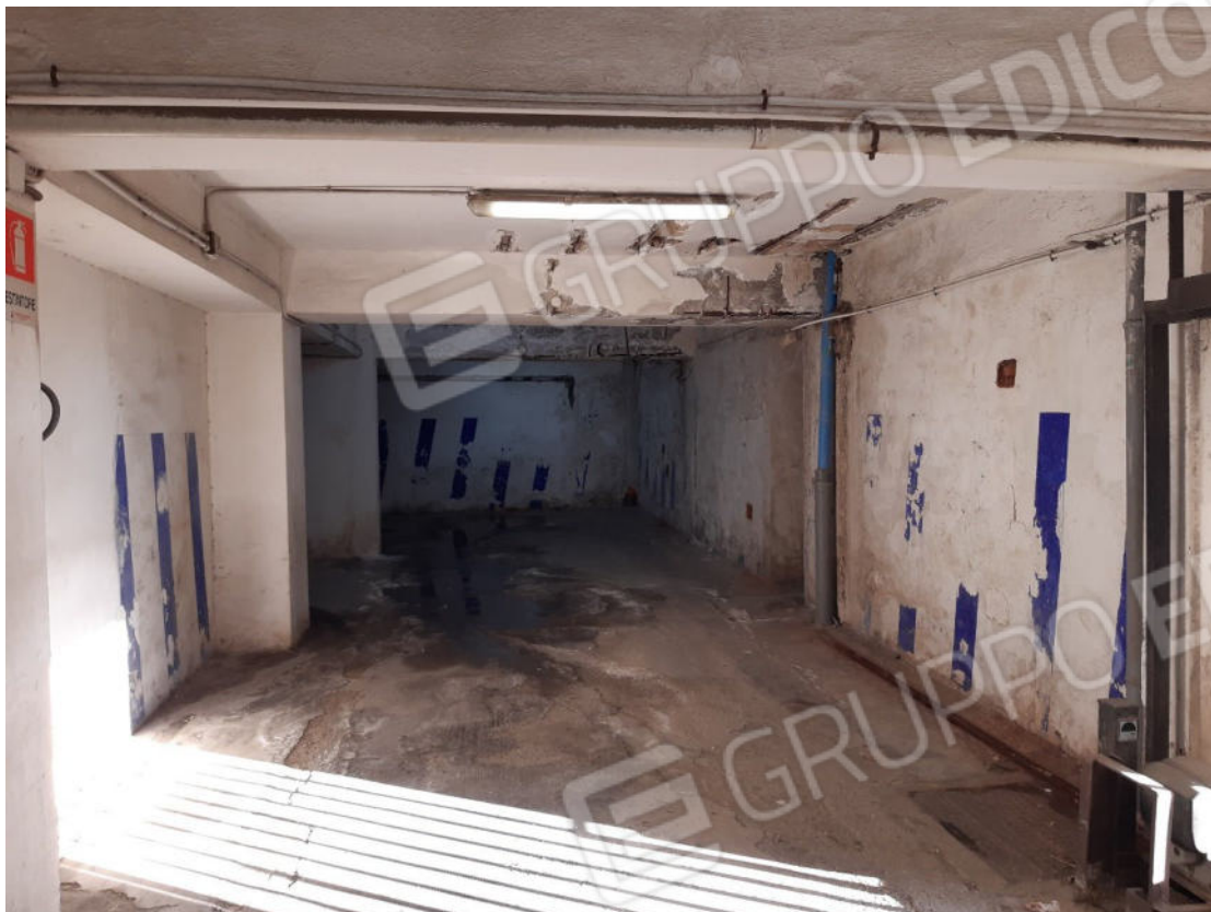
Figura 55: Area comune ed area di manovra piano primo sottostrada