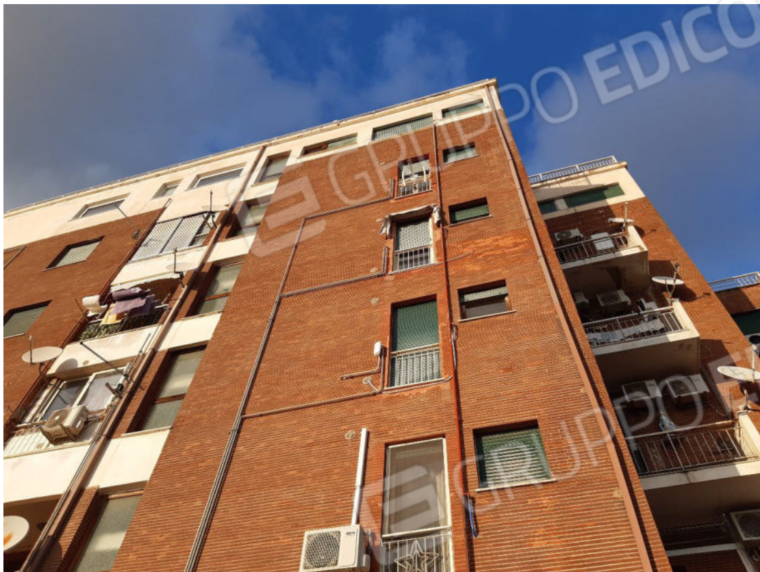
Figura 69: Prospetti esterni del fabbricato