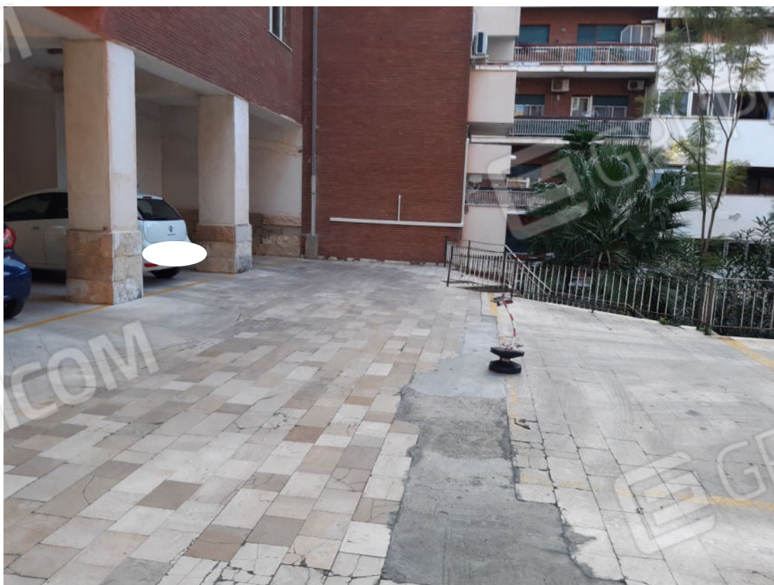
Figura 64: Area esterna comune (cortile piano terra)