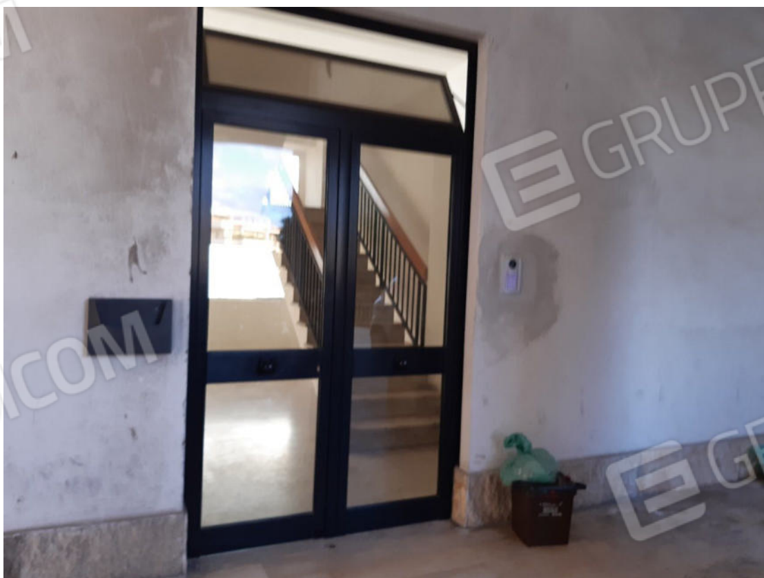
Figura 60: Accesso al vano scala comune