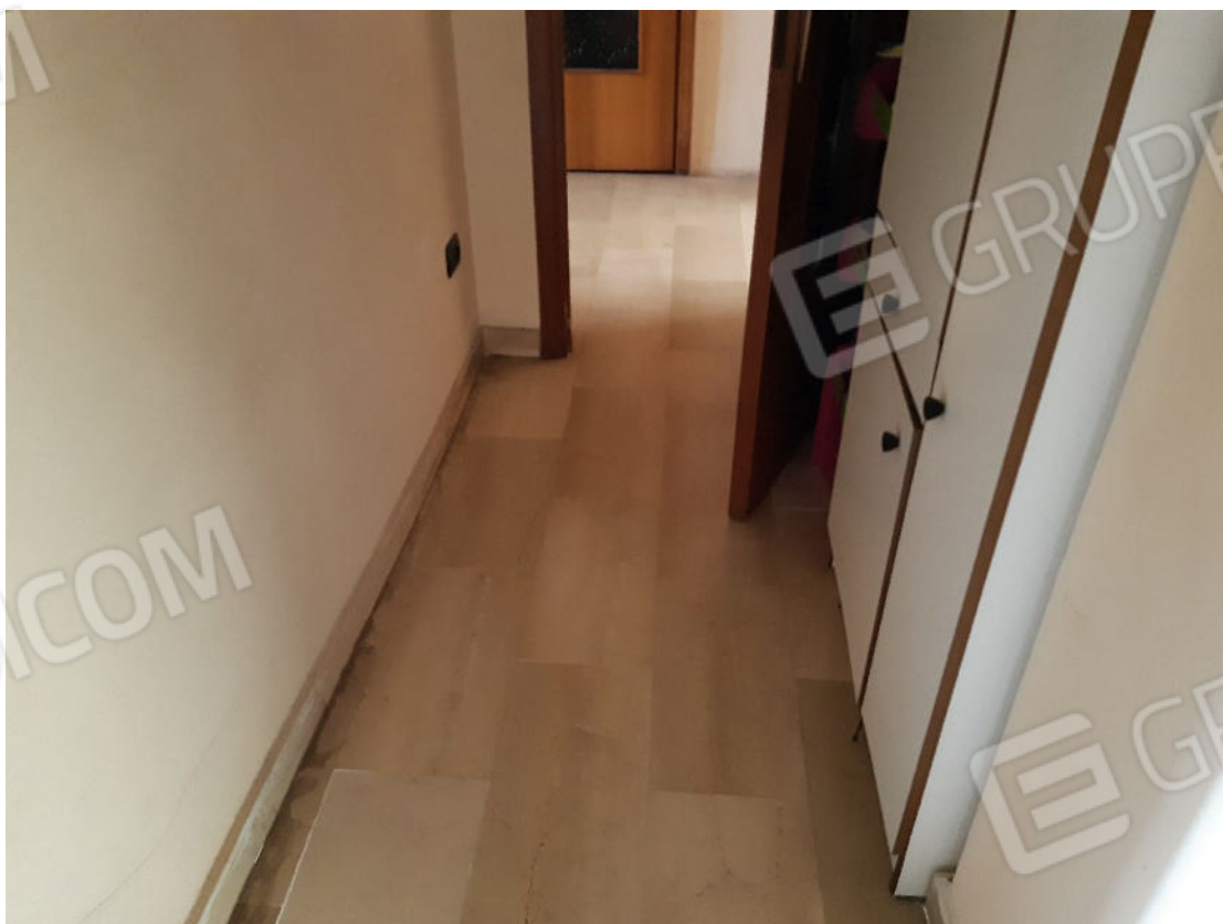
Figura 28: cono ottico 28 – Corridoio