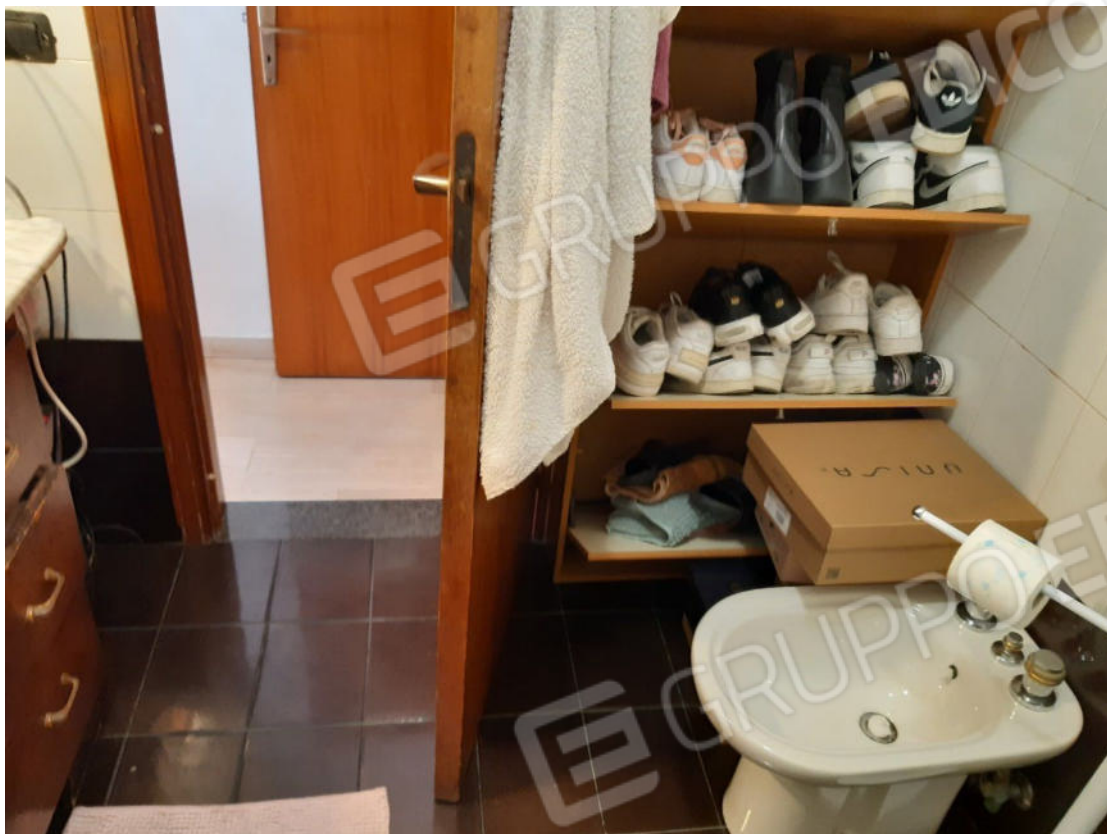
Figura 45: cono ottico 45 – W.C. 2