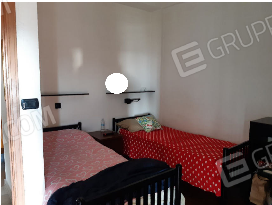
Figura 34: cono ottico 34 – Camera 1