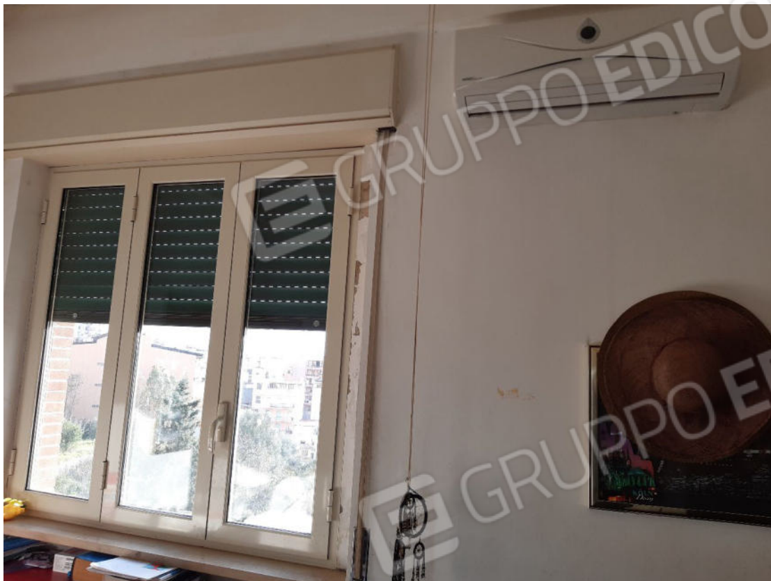
Figura 41: cono ottico 41 – Camera 2