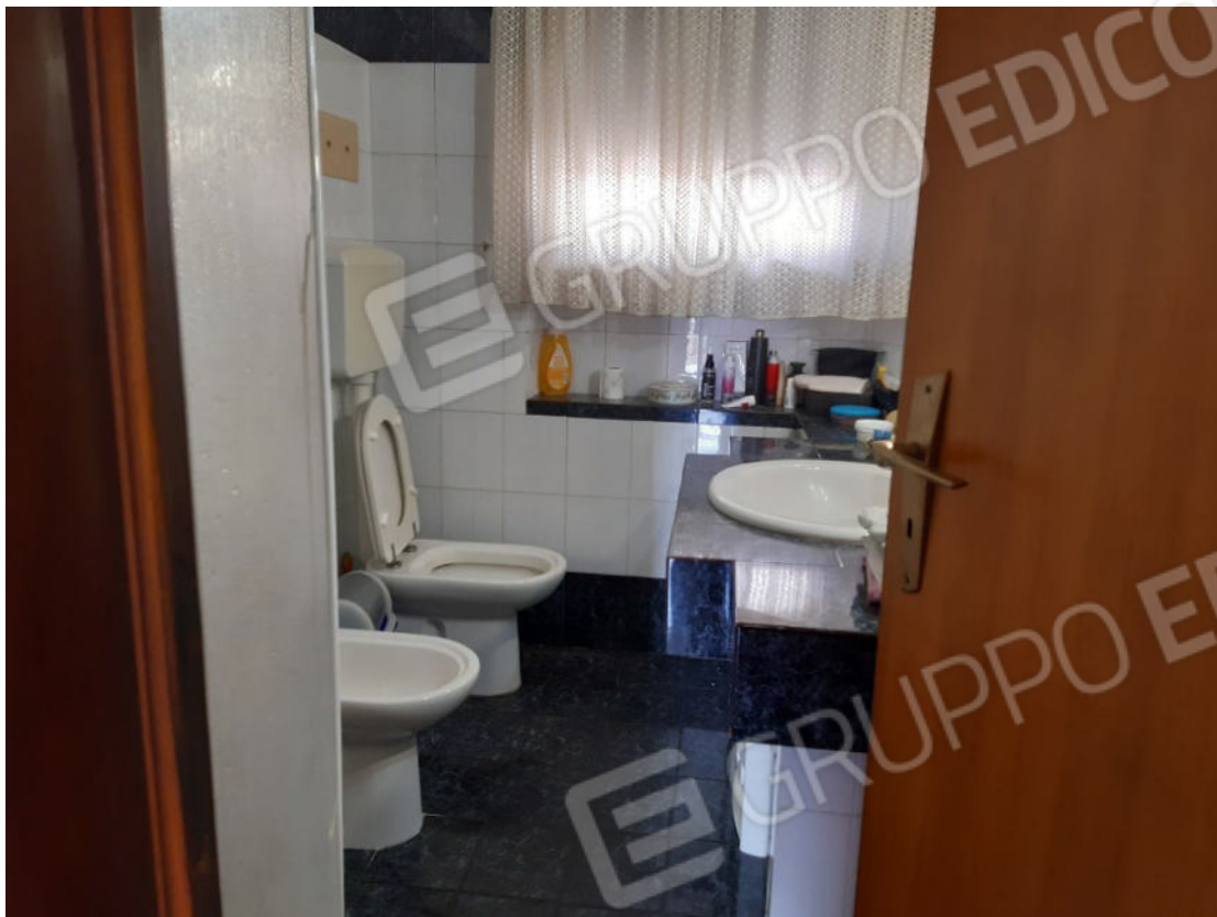
Figura 37: cono ottico 37 – W.C. 1