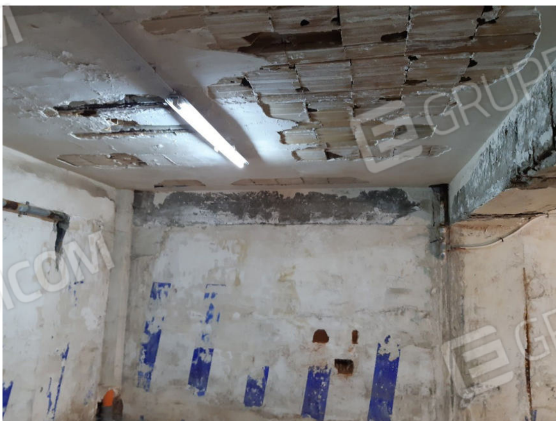
Figura 48: cono ottico 48 – Garage