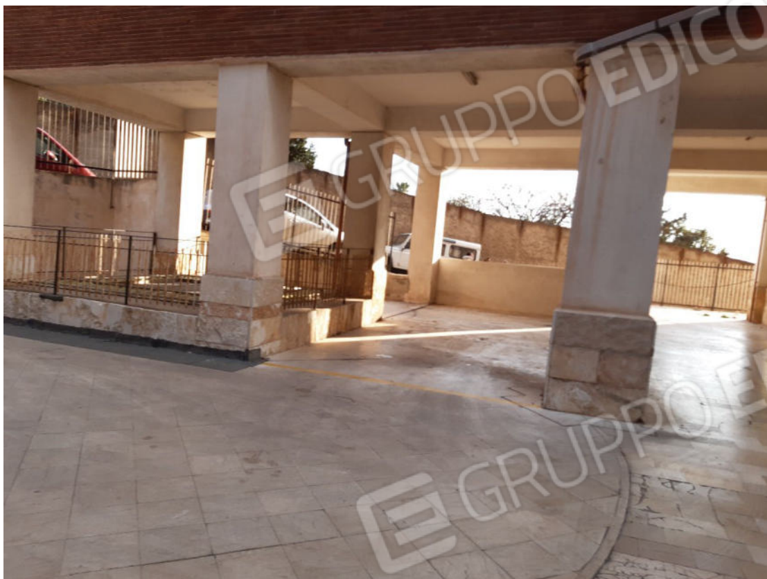
Figura 65: Area esterna comune (cortile piano terra)