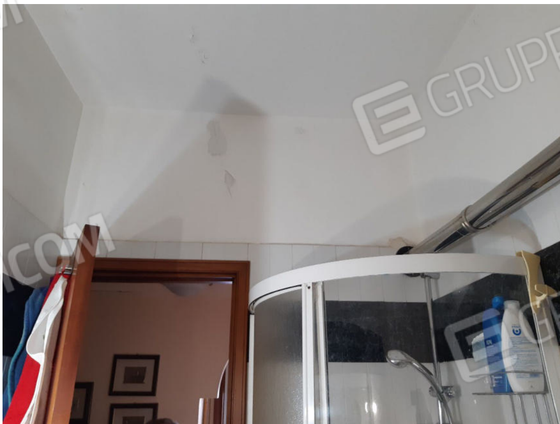
Figura 38: cono ottico 38 – W.C. 1