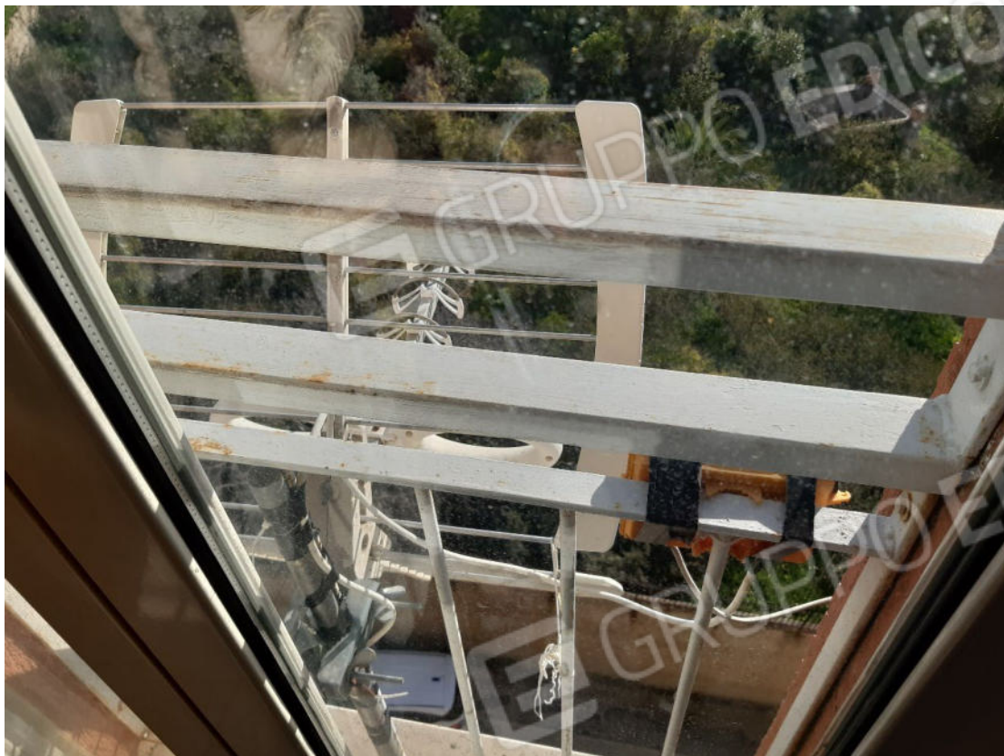
Figura 19: cono ottico 19 – Cucina