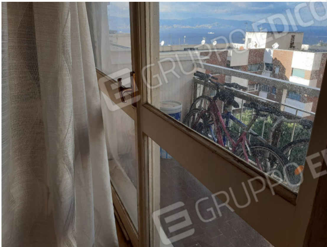
Figura 13: cono ottico 13 – Balcone 1