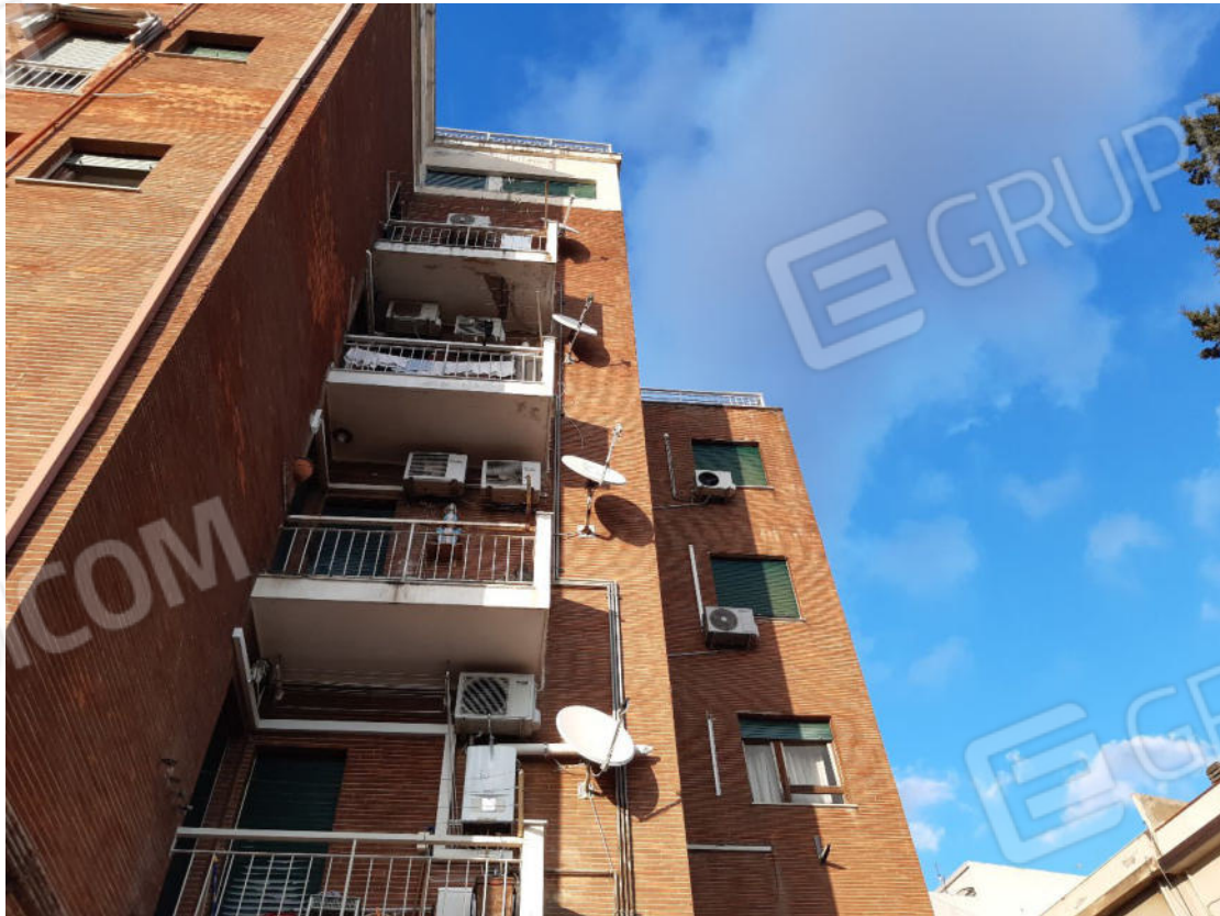
Figura 70: Prospetti esterni del fabbricato