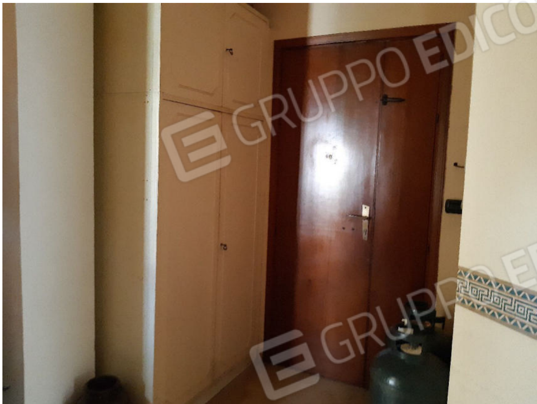
Figura 1: cono ottico 1 – Ingresso