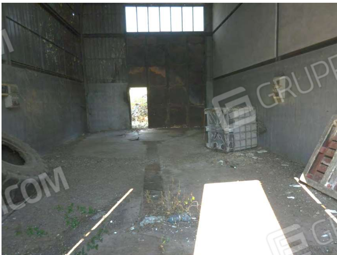
Foto 14 deposito fg. 18 - p.lla 201 NTC Fg. 7 p.lla 1121