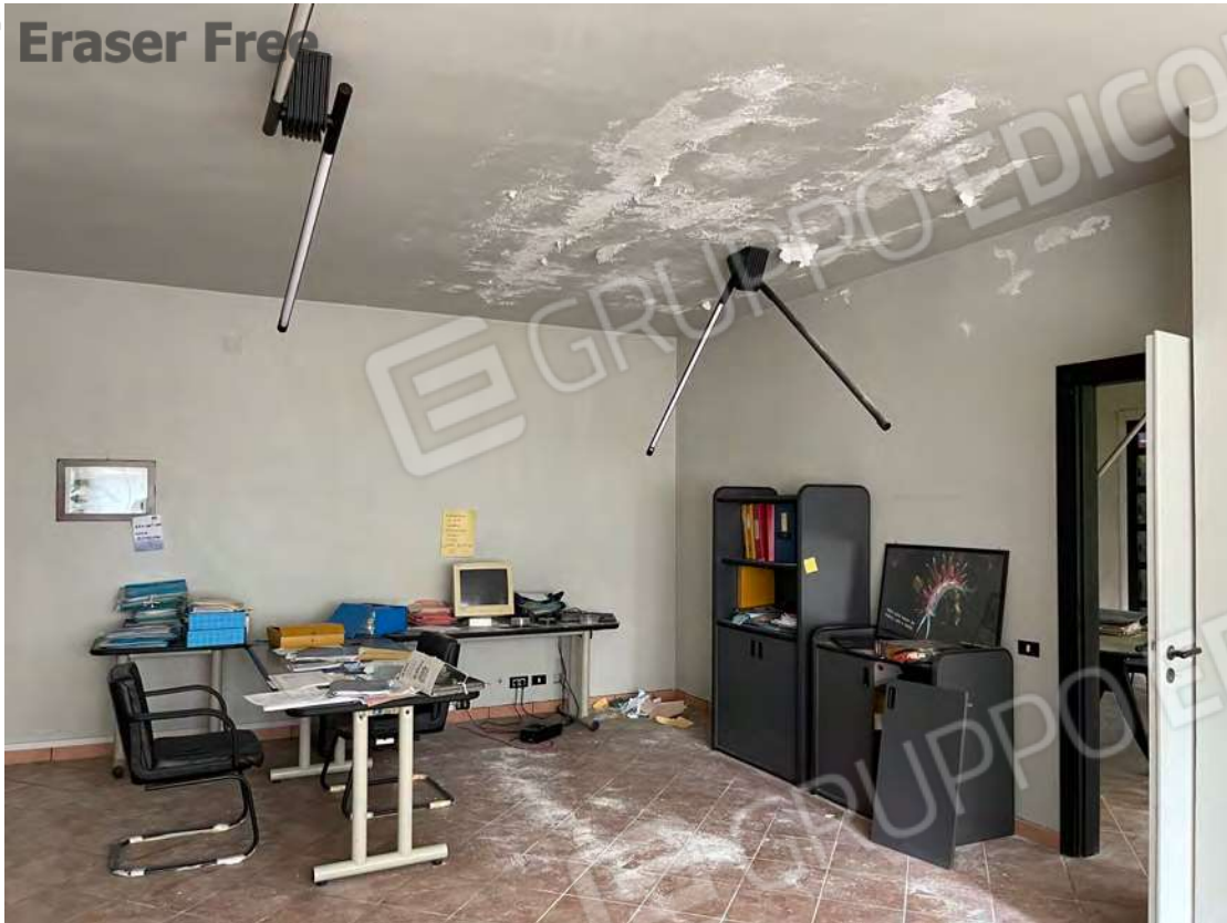
Foto 21 uffici P.T.-rialzato fg. 18 - p.lla 201 NTC Fg. 7 p.lla 1121