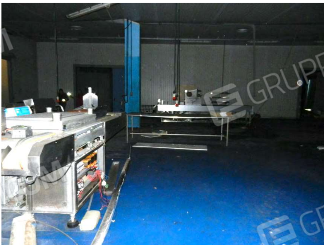
Foto 8 zona lavorazione fg. 18 - p.lla 201 NTC Fg. 7 p.lla 1121