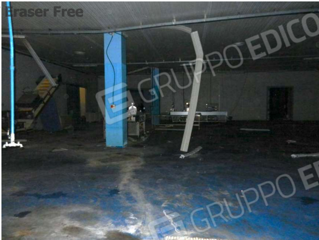
Foto 7 zona lavorazione fg. 18 - p.lla 201 NTC Fg. 7 p.lla 1121