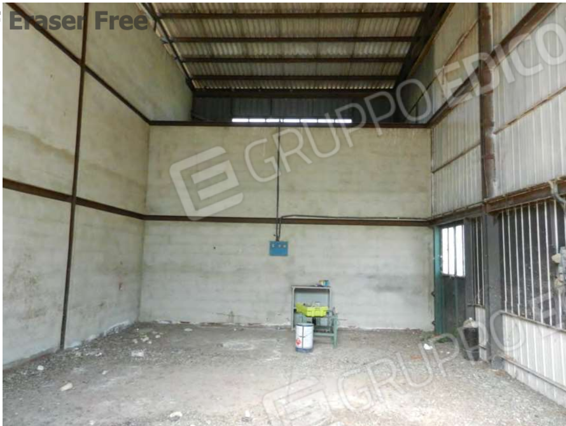
Foto 13 deposito fg. 18 - p.lla 201 NTC Fg. 7 p.lla 1121