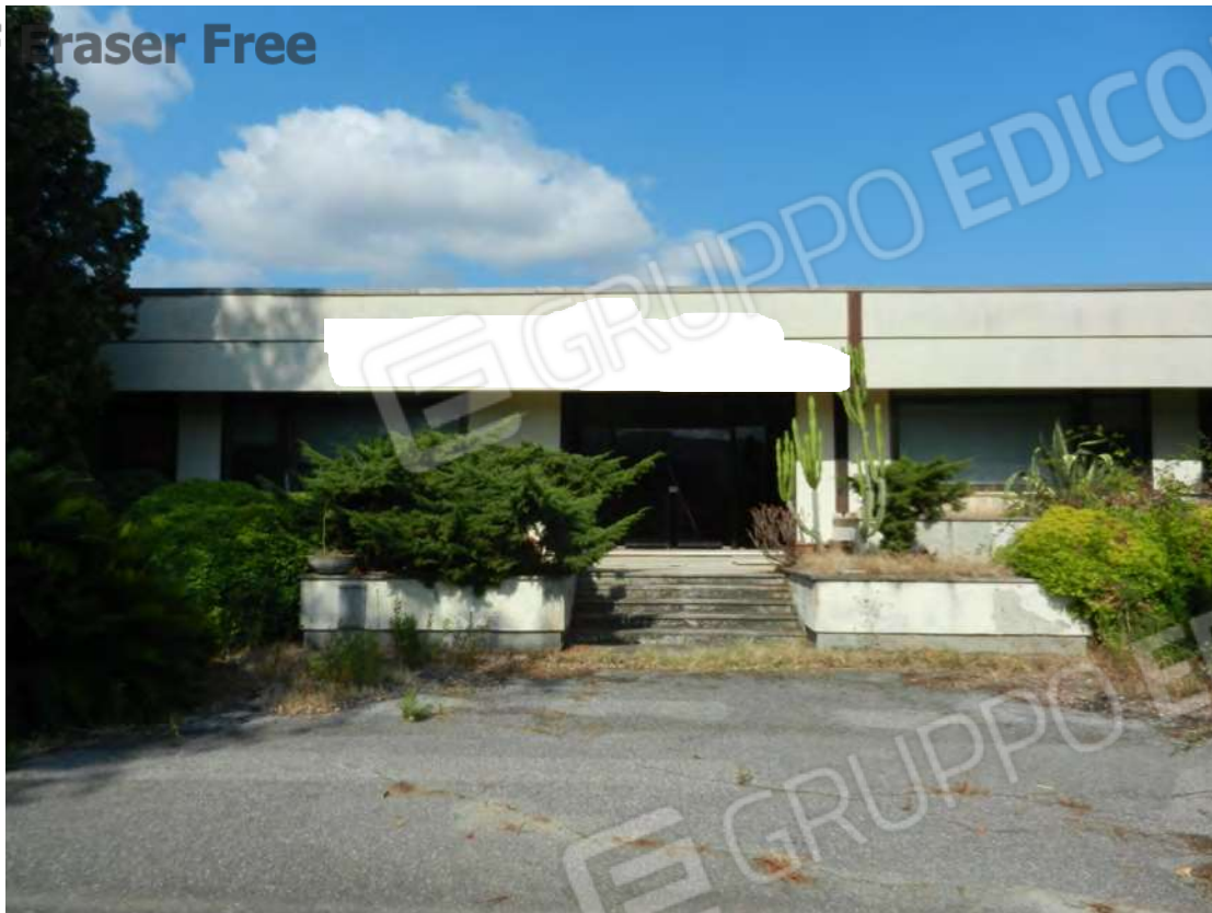
Foto 3 ingresso uffici - fg. 18 - p.lla 201 NTC Fg. 7 p.lla 1121