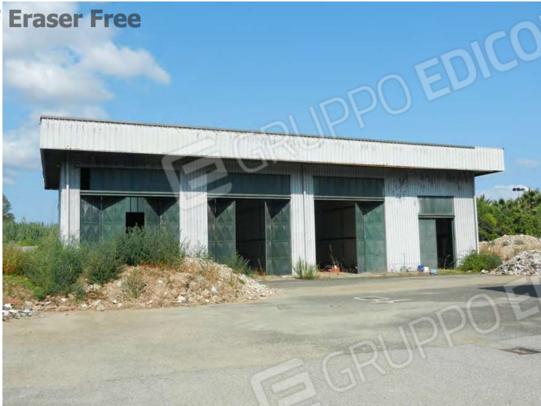
Foto 5 deposito fg. 18 - p.lla 201 NTC Fg. 7 p.lla 1121