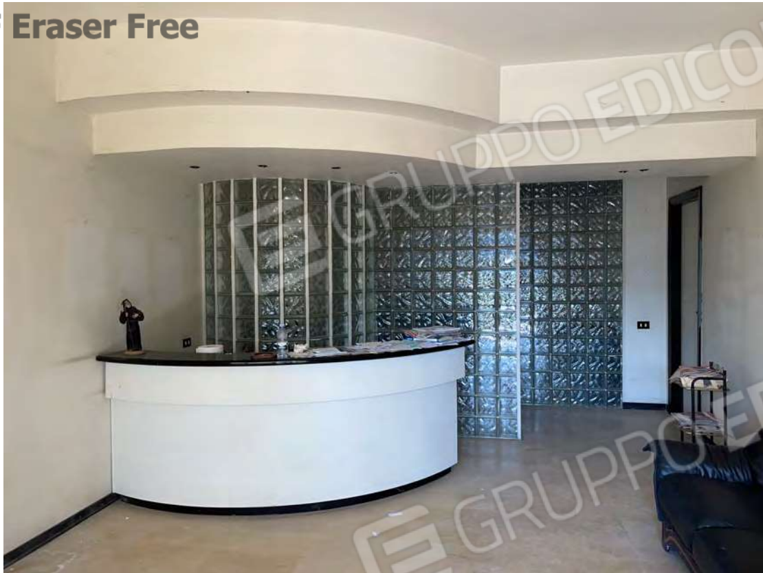
Foto 19 ingresso uffici P.T.-rialzato – fg. 18 - p.lla 201 NTC Fg. 7 p.lla 1121