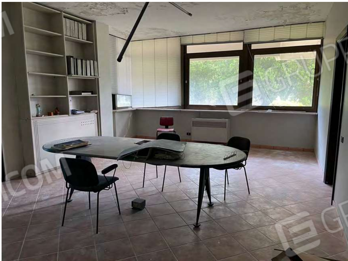
Foto 20 uffici P.T.-rialzato fg. 18 - p.lla 201 NTC Fg. 7 p.lla 1121