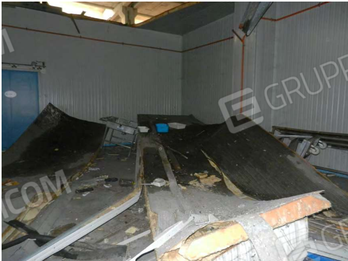
Foto 10 detriti copertura crollata fg. 18 - p.lla 201 NTC Fg. 7 p.lla 1121