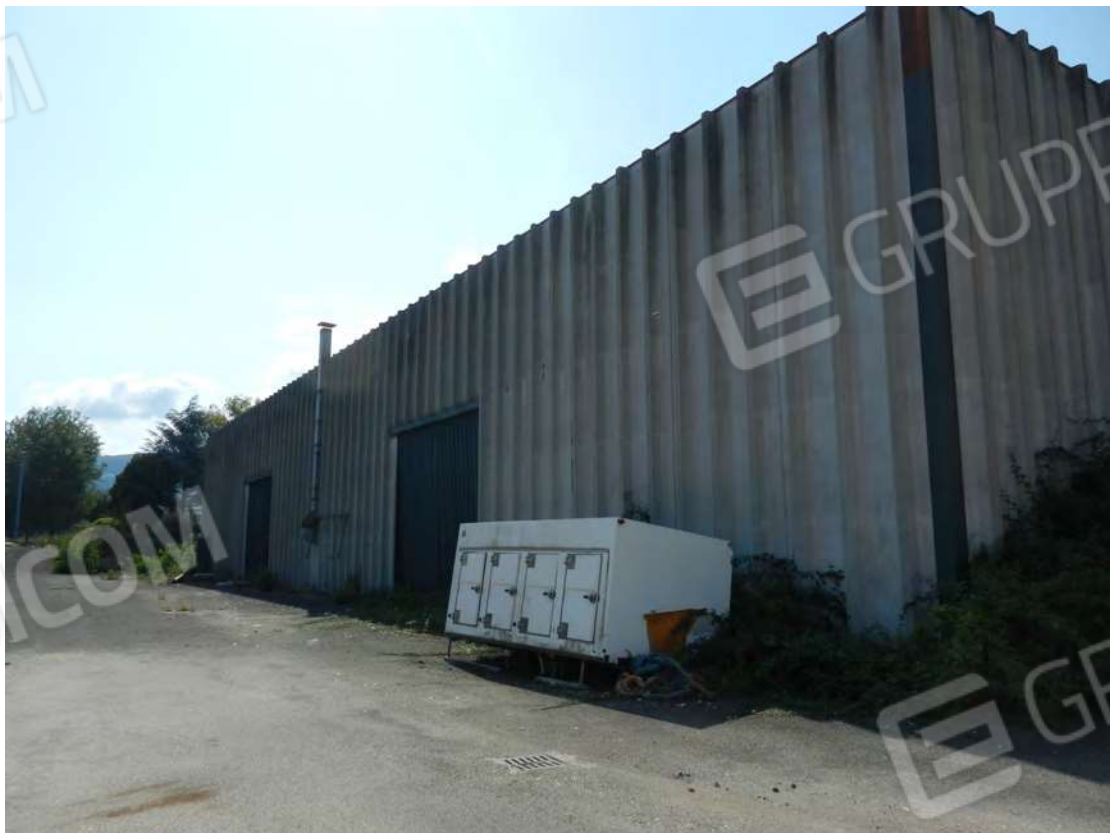
Foto 6 capannone fg. 18 - p.lla 201 NTC Fg. 7 p.lla 1121