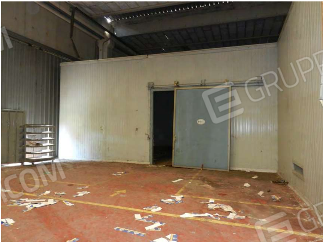
Foto 12 celle di conservazione prodotti fg. 18 - p.lla 201 NTC Fg. 7 p.lla 1121