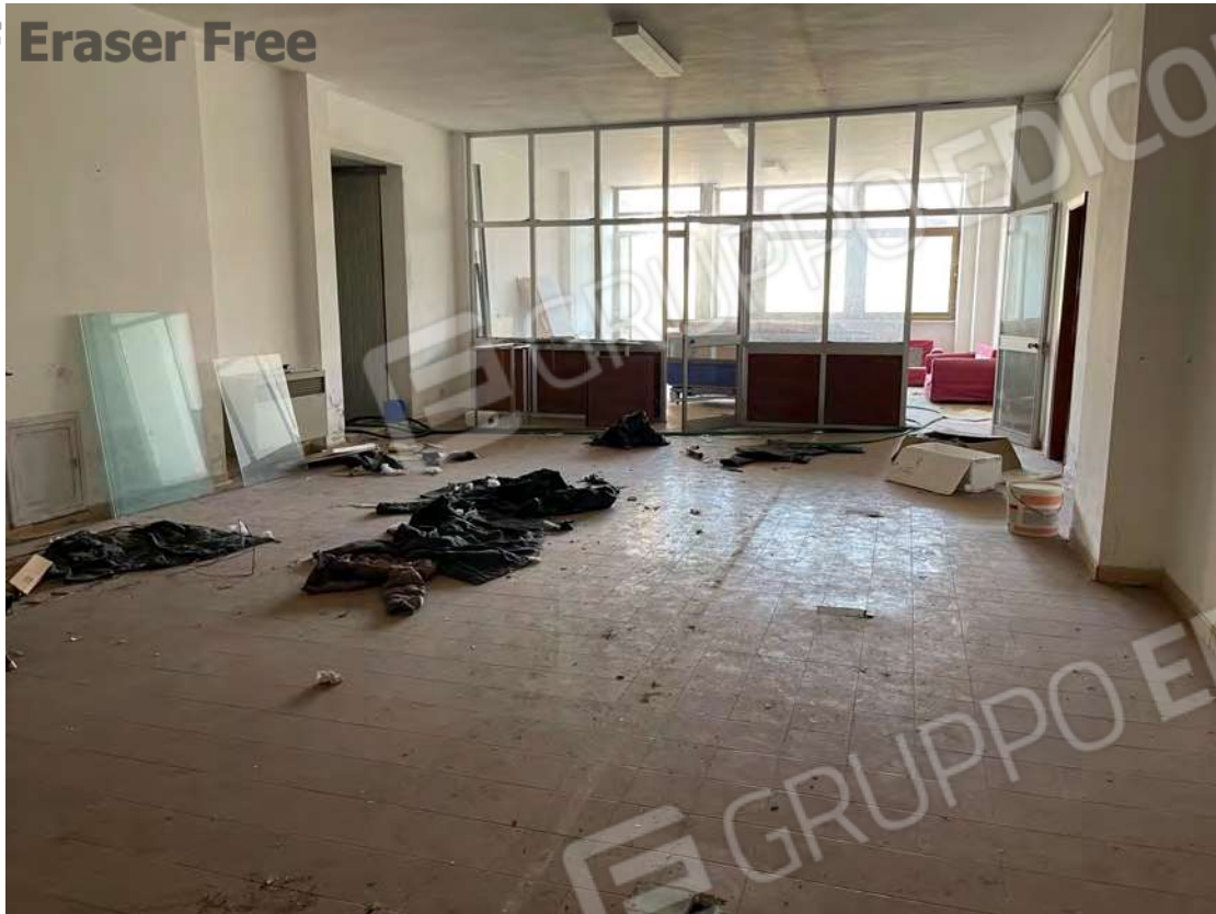
Foto 15 uffici piano terra fg. 18 - p.lla 201 NTC Fg. 7 p.lla 1121