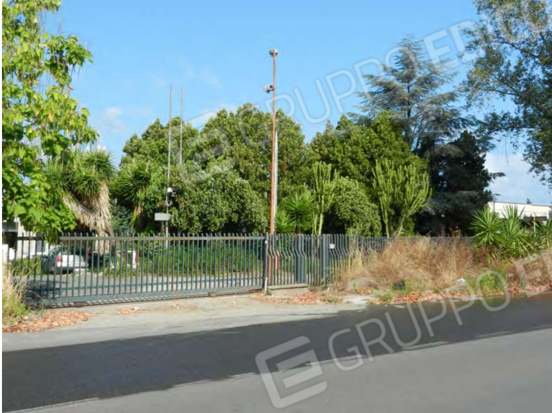
Foto 1 corte – ingresso area fg. 18 - p.lla 201 NTC Fg. 7 p.lla 1121