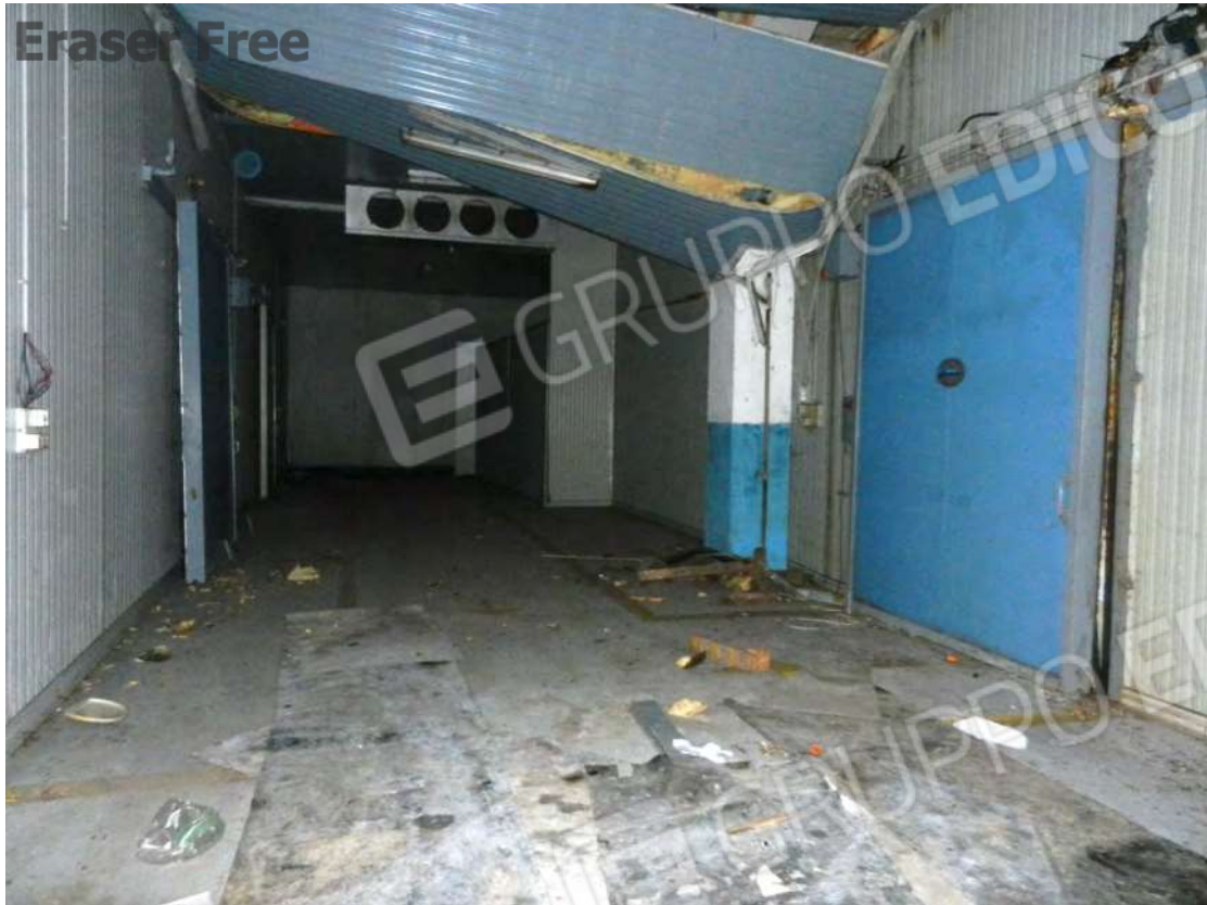
Foto 9 celle frigorifere fg. 18 - p.lla 201 NTC Fg. 7 p.lla 1121