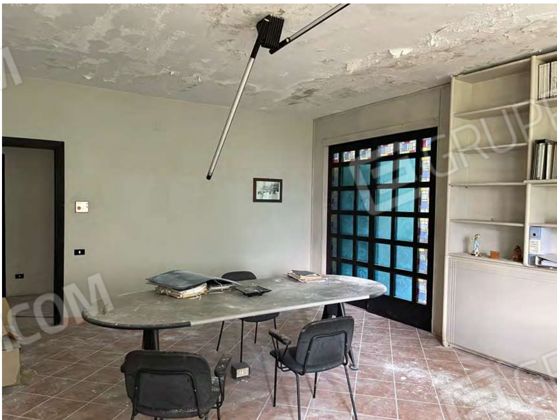
Foto 22 uffici P.T.-rialzato fg. 18 - p.lla 201 NTC Fg. 7 p.lla 1121