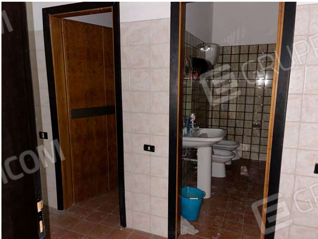
Foto 26 WC P.T.-rialzato fg. 18 - p.lla 201 NTC Fg. 7 p.lla 1121