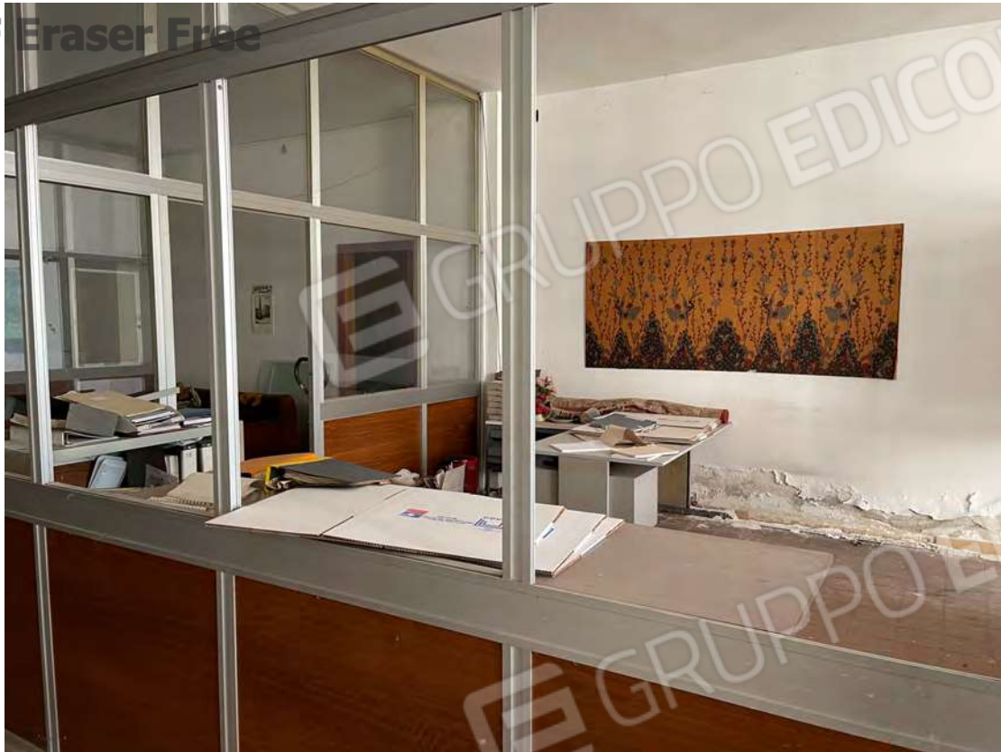
Foto 17 uffici piano terra fg. 18 - p.lla 201 NTC Fg. 7 p.lla 1121