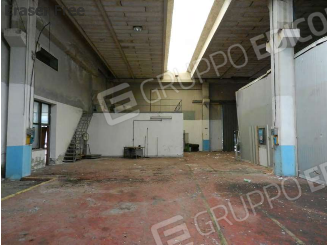
Foto 11 zona carico e scarico merci fg. 18 - p.lla 201 NTC Fg. 7 p.lla 1121