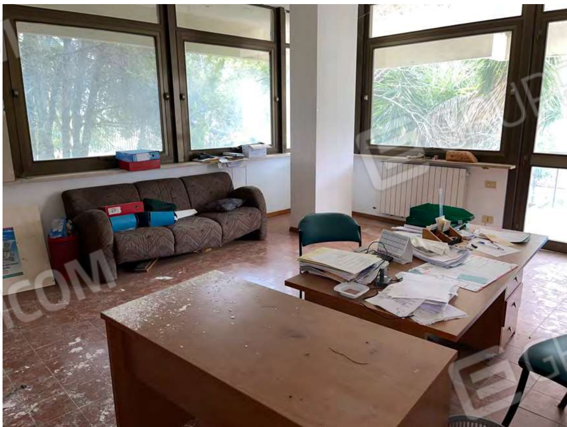
Foto 24 uffici P.T.-rialzato fg. 18 - p.lla 201 NTC Fg. 7 p.lla 1121