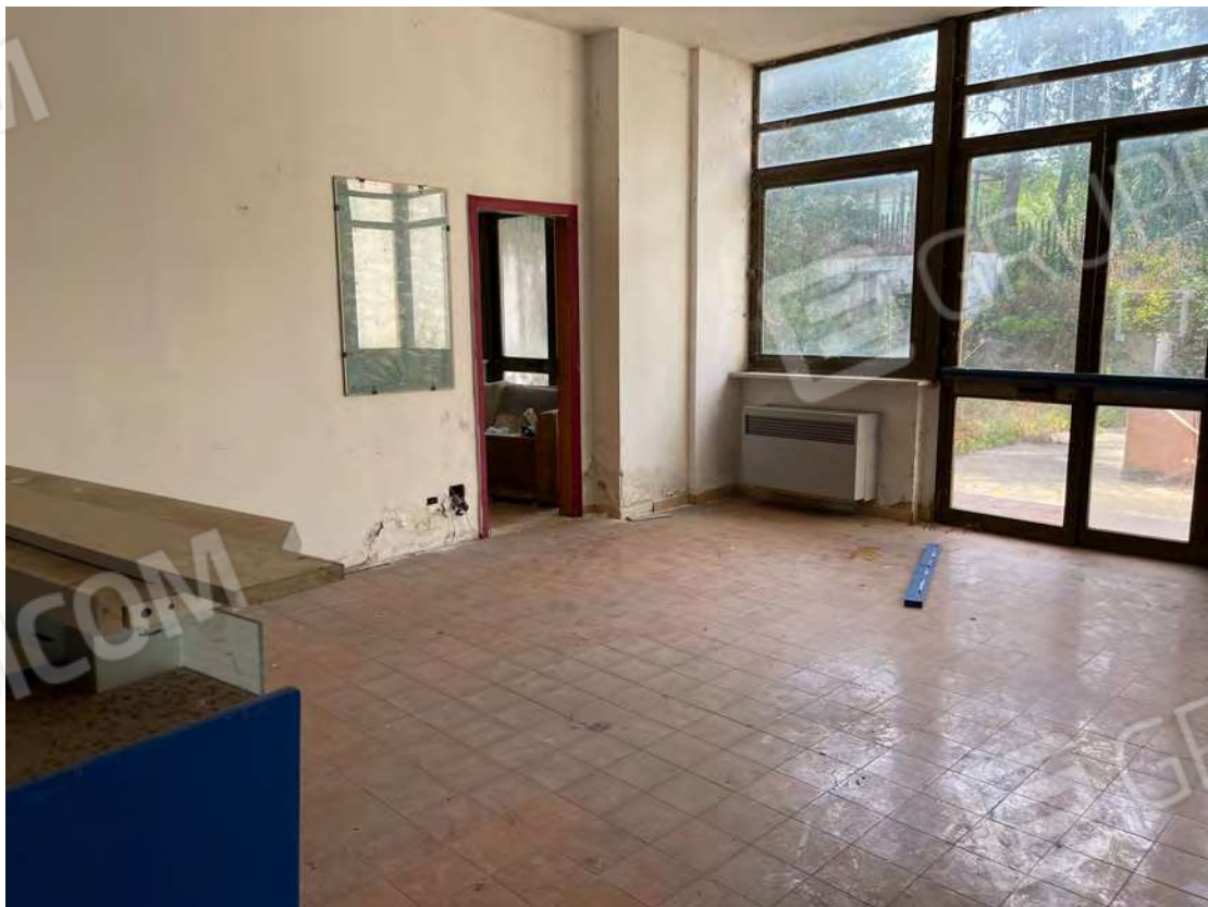
Foto 16 uffici piano terra fg. 18 - p.lla 201 NTC Fg. 7 p.lla 1121