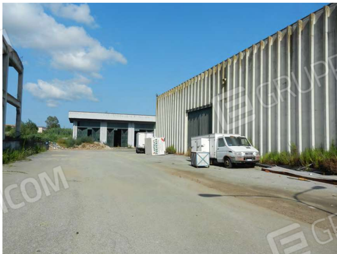
Foto 4 area interna-capannone-deposito fg. 18 p.lla 201 NCT Fg. 7 p.lla 1121