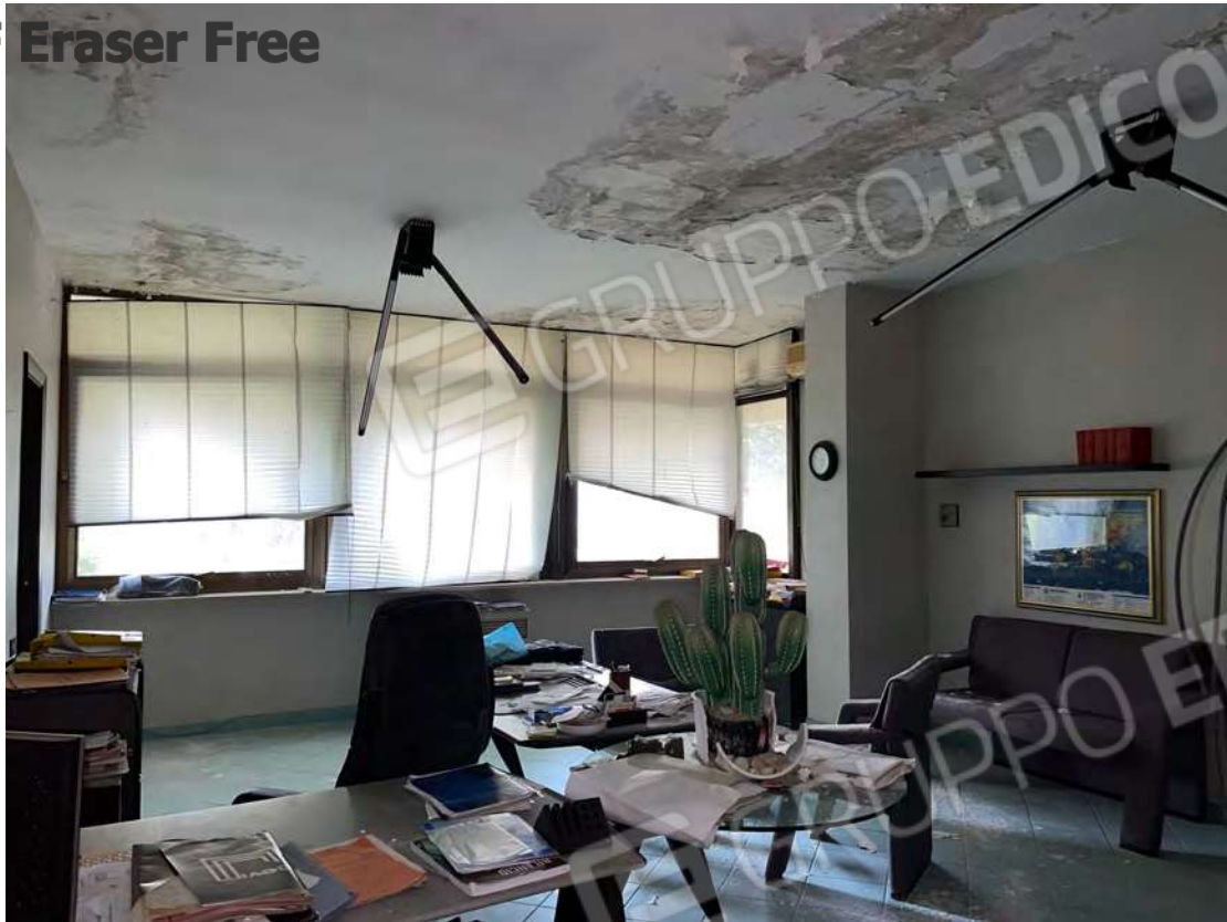
Foto 25 uffici fg. 18 - p.lla 201 NTC Fg. 7 p.lla 1121