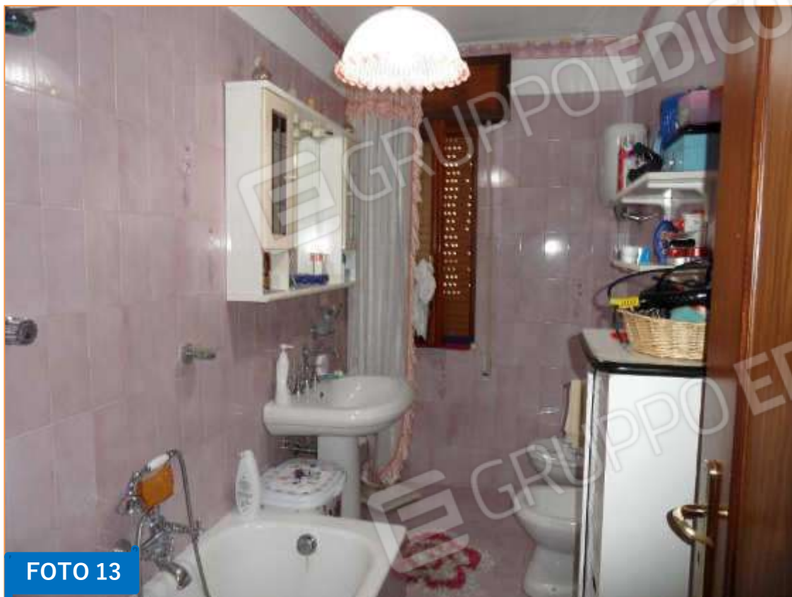
Interno del bagno, posto sul versante orientale del piano.