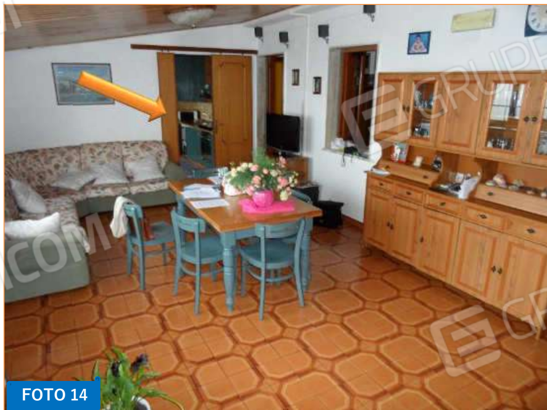
Vista del soggiorno, disposto sul lato Sud del barricato.