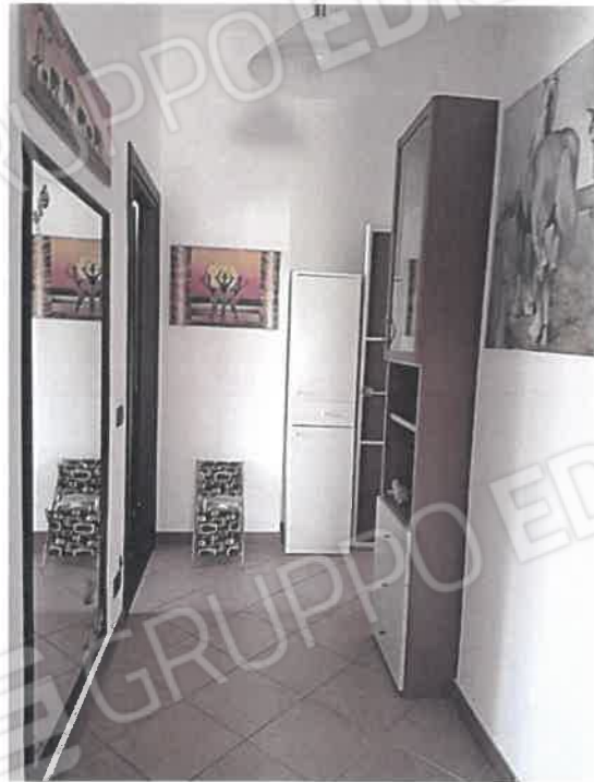
foto n. 8 - veduta disimpegno