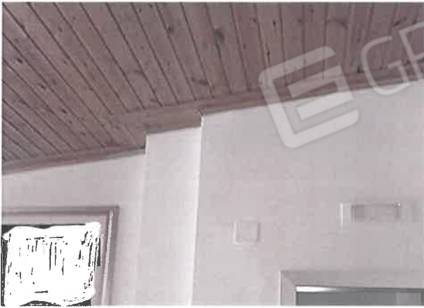
foto n. 15 - particolare soffitto