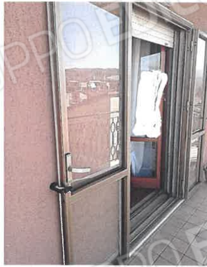
foto n. 16 - particolare infissi