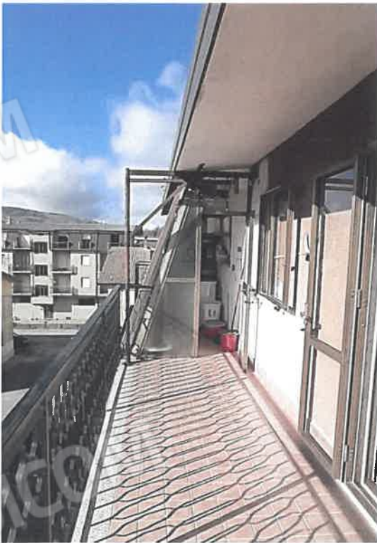
foto n. 17 - vista balcone - fronte sud