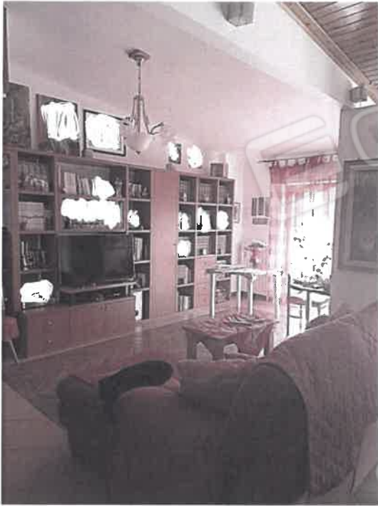
foto n. 5 - veduta interna