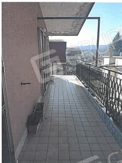
foto n. 22 - vista balcone