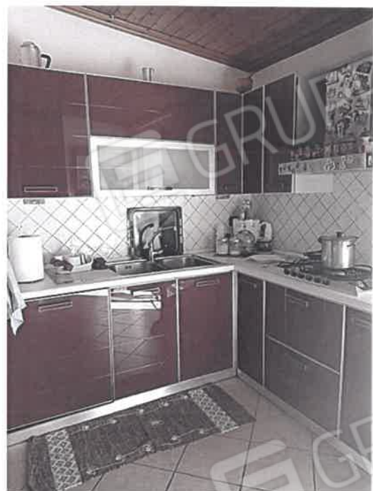
foto n. 8 - veduta cucina