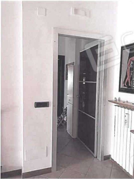
foto n. 7 - veduta interna