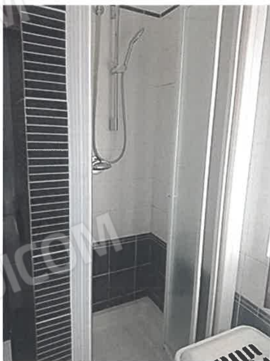
foto n. 13 - particolare box doccia