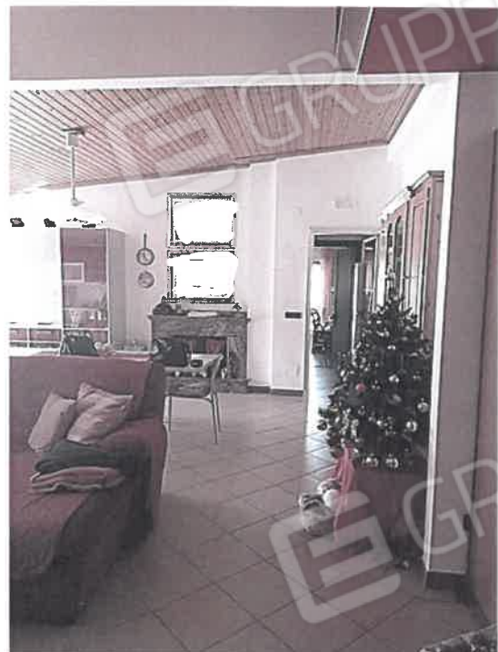
foto n.4 - veduta interna