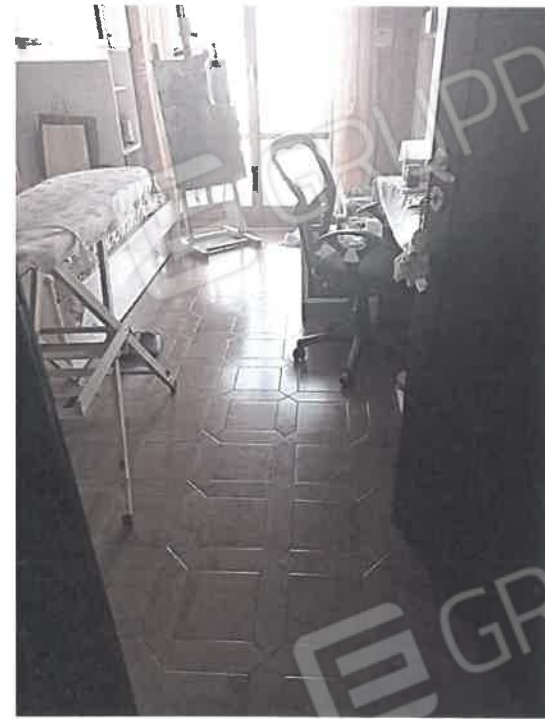
foto n. 10 - veduta camera