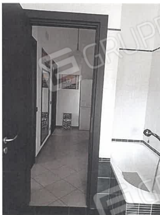
foto n. 14 - particolare vasca