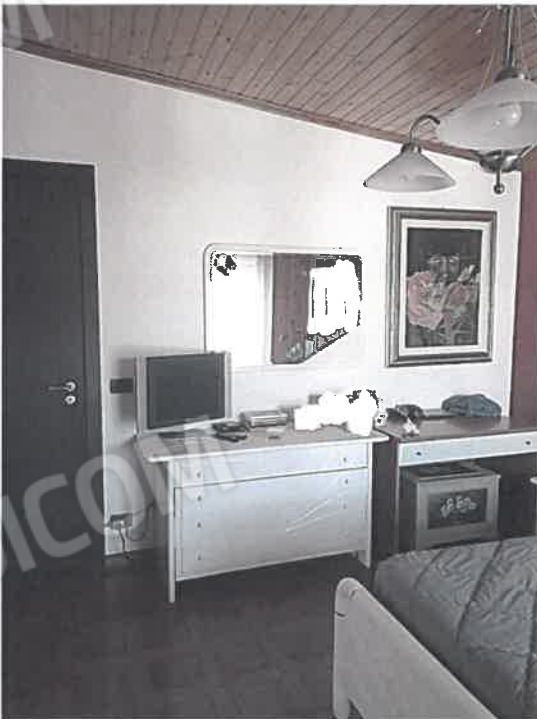
foto n. 9 - veduta camera