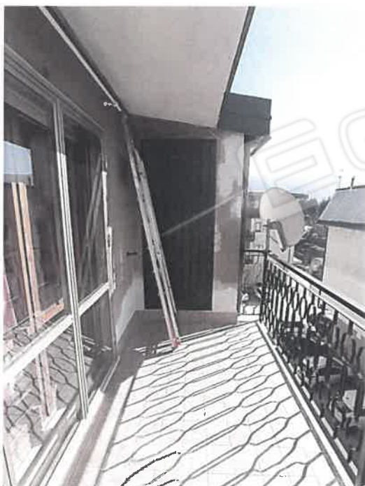
foto n. 19 - vista balcone - fronte sud