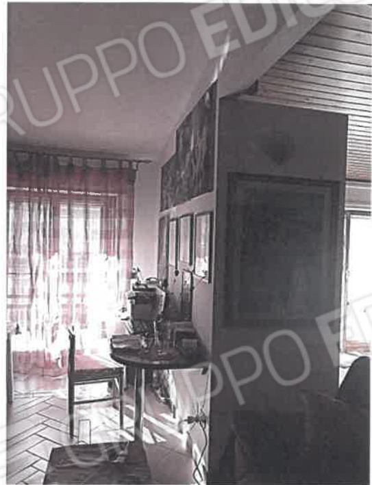
foto n. 6 - veduta interna