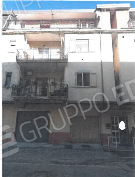
foto n. 2 -prospetto ingresso Località La Prisa - fronte sud