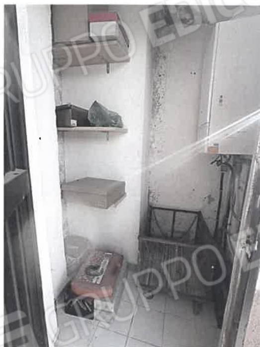
foto n. 20 - veduta vano caldaia