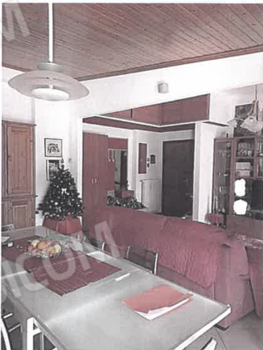
foto n. 7 - veduta interna