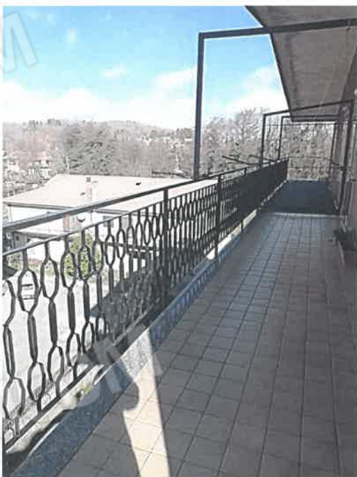
foto n. 21 - vista balcone - fronte ovest