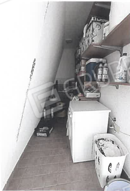
foto n. 18 - veduta ripostiglio