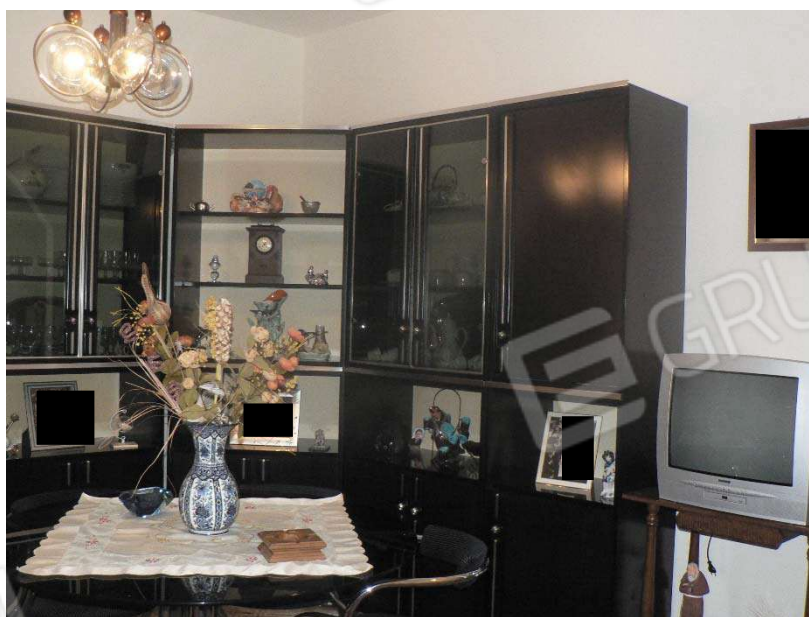
Foto 5 e 6 - Vista Soggiorno