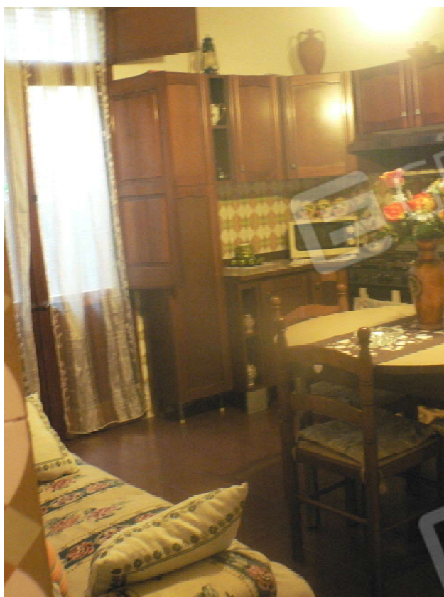
Foto 7 e 8 - Vista cucina - pranzo