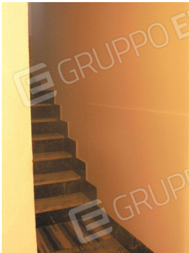
Foto 11 - Vista scala di collegamento al primo piano