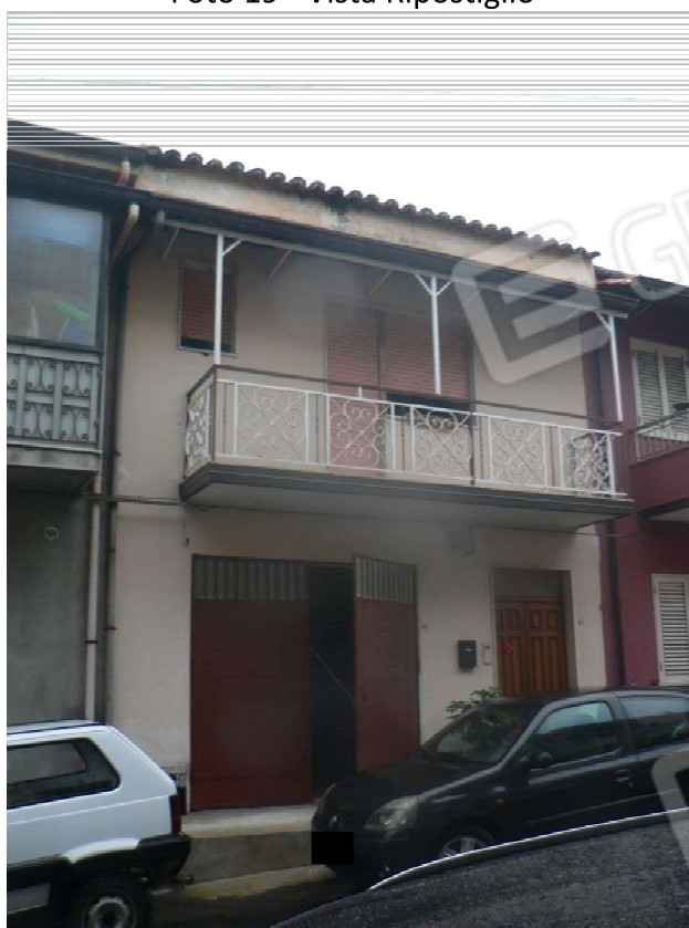
Foto 20 - Vista Balcone