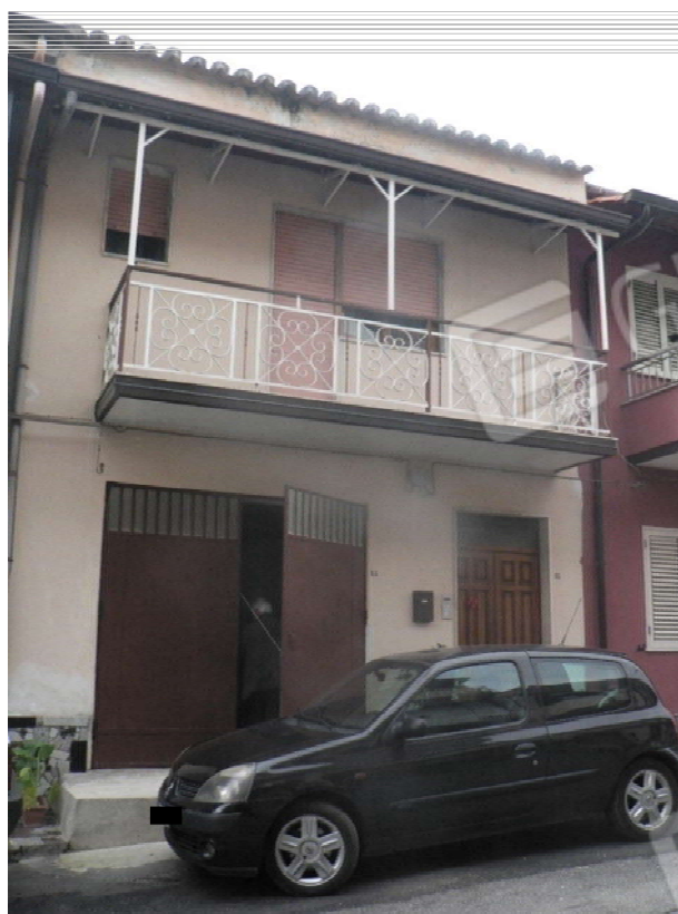
Foto 1 e 2 - Viste del Fabbricato su due piani fuori terra