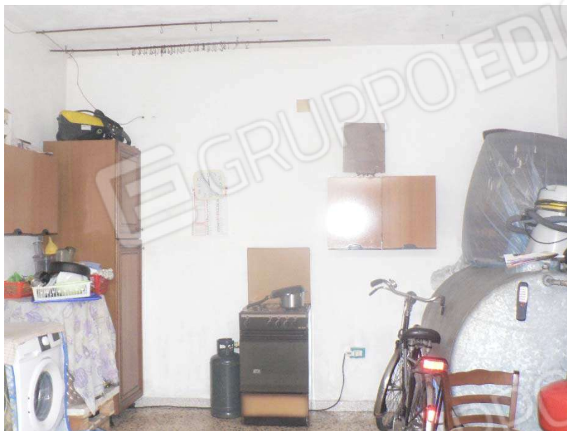
Foto 3 - Vista del bene lato Strada Pubblica