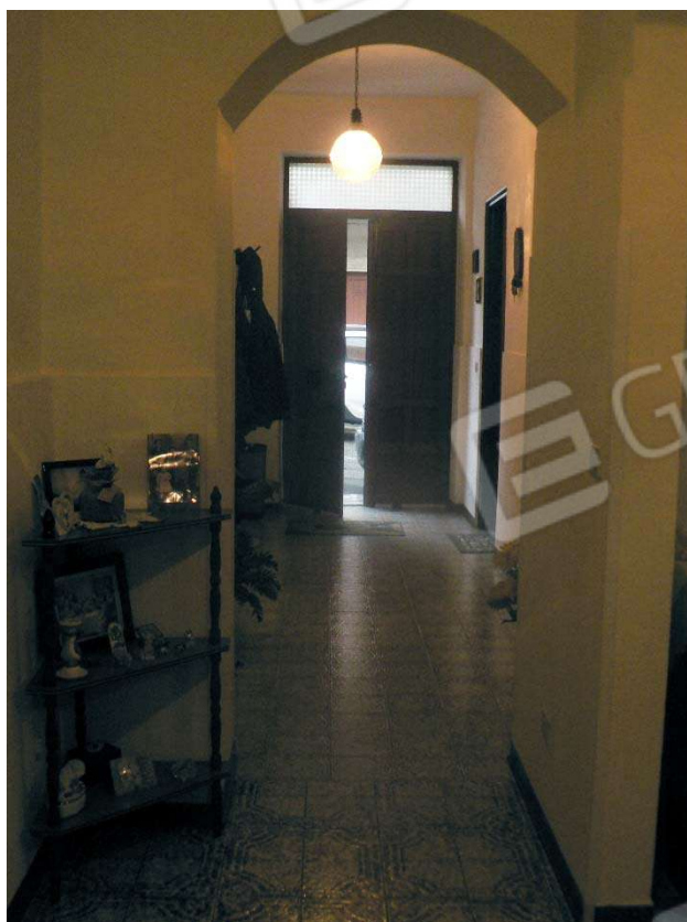
Foto 4 - Vista ingresso Appartamento