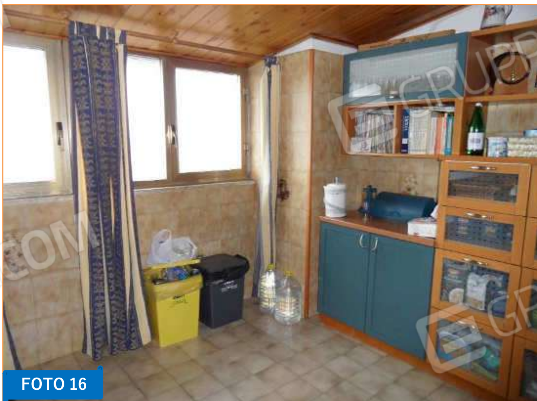
Ulteriore vista della cucina.