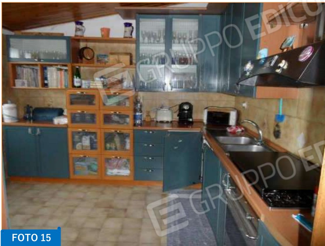
Interno della cucina, zona Sud – Ovest del piano.