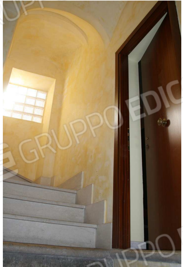
Foto 4-5_ Accesso da scala comune