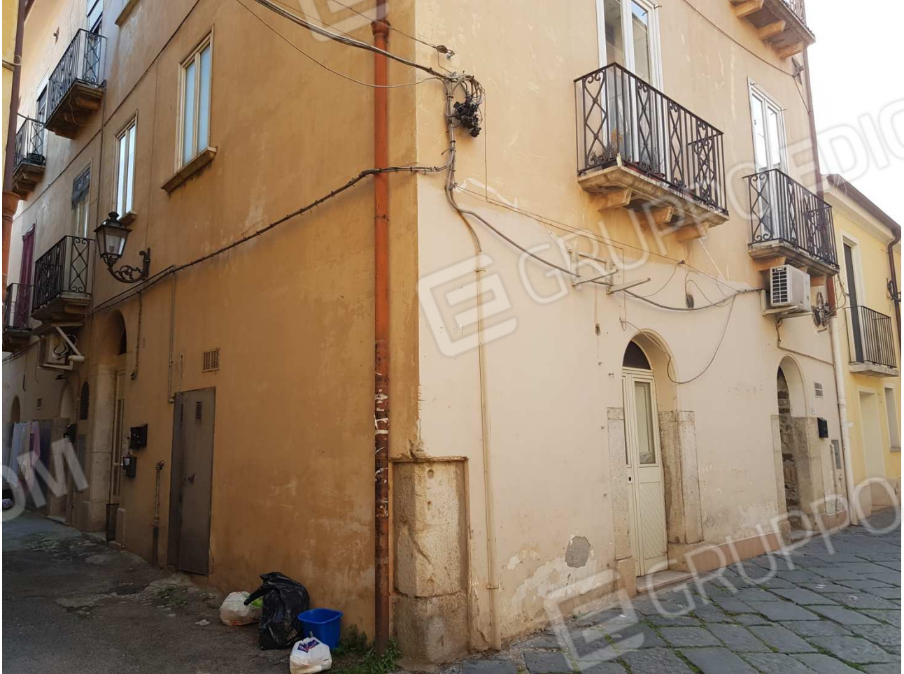
Foto 1_ Individuazione dell'unità immobiliare (balconi e finestre al piano 1), angolo del fabbricato tra via Port'Arsa e Traversa II via Port'Arsa