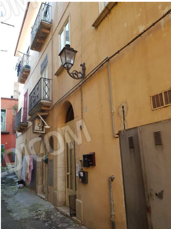
Foto 3_ Portone comune di accesso e affacci (piano 1) su Traversa II via Port'Arsa