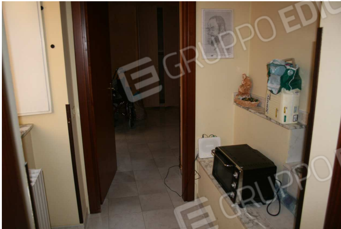
Foto 13_ Disimpegno e accesso piccolo ripostiglio sopra scale