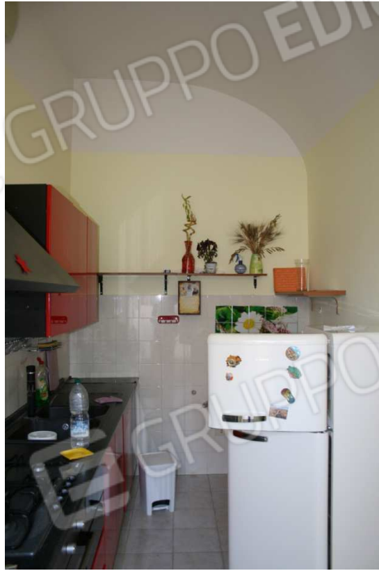
Foto 9-10_ Cucina e ripostiglio