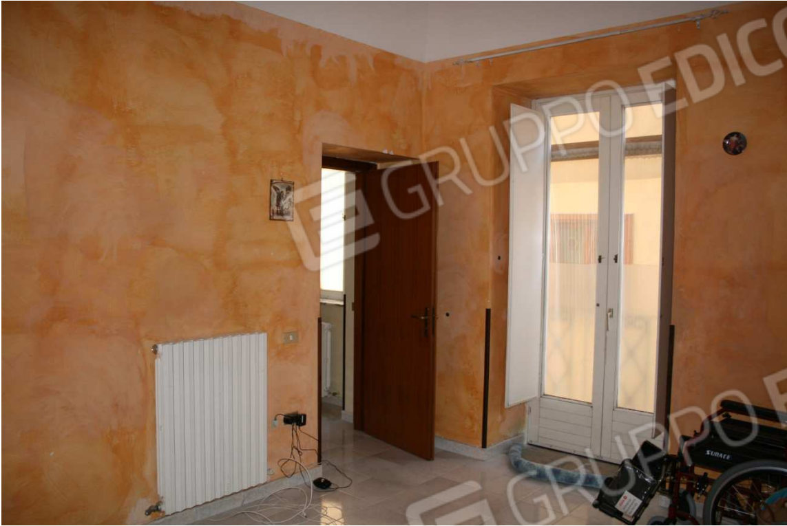
Foto 16_ Camera