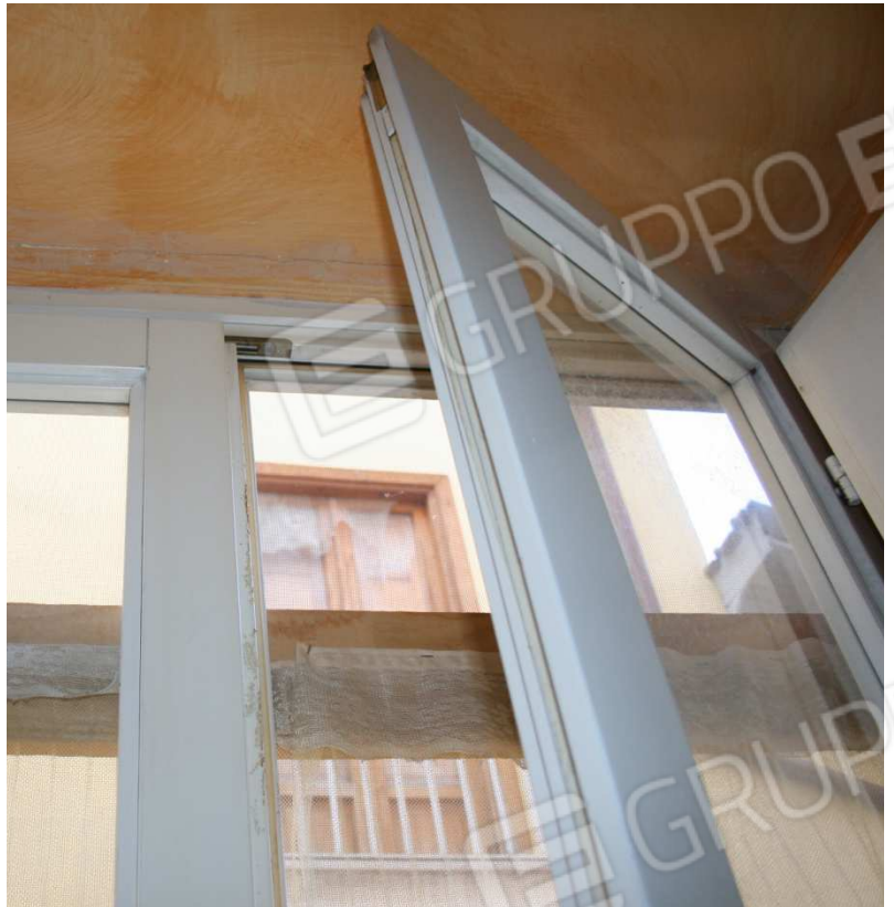
Foto 17-18_ Particolari degli infissi