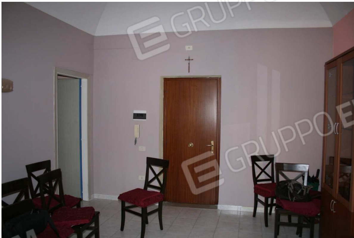
Foto 6_ Soggiorno ed ingresso