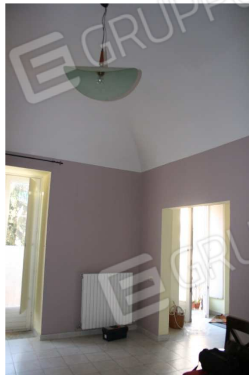
Foto 7-8_ Soggiorno ed ingresso - vista verso balconi ed accesso cucina