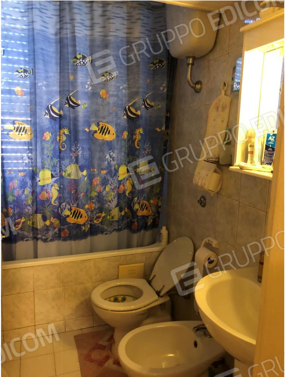
Foto n.13: Foto del bagno dell'appartamento in Benevento NCEU al foglio 93 particella 102 sub 11.