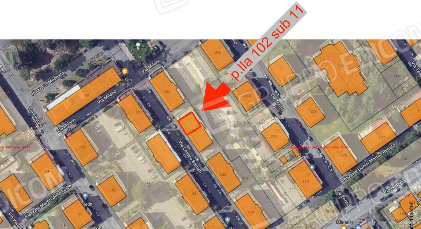
Foto n.3: Estratto di Mappa NCEU del palazzo dove insiste al 3 piano l'appartamento in Via Cesare Battisti n. 6 a Benevento NCEU al foglio 93 particella 102 sub 11.