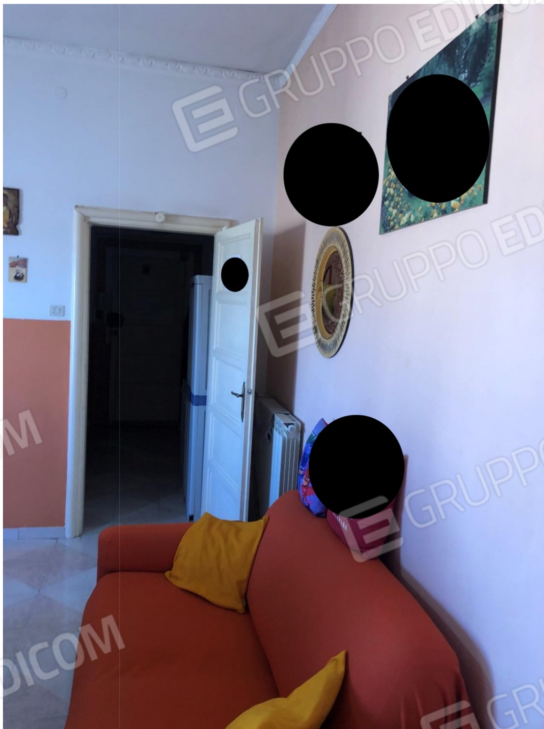
Foto n.8: Foto della cucina soggiorno dell'appartamento in Benevento NCEU al foglio 93 particella 102 sub 11.