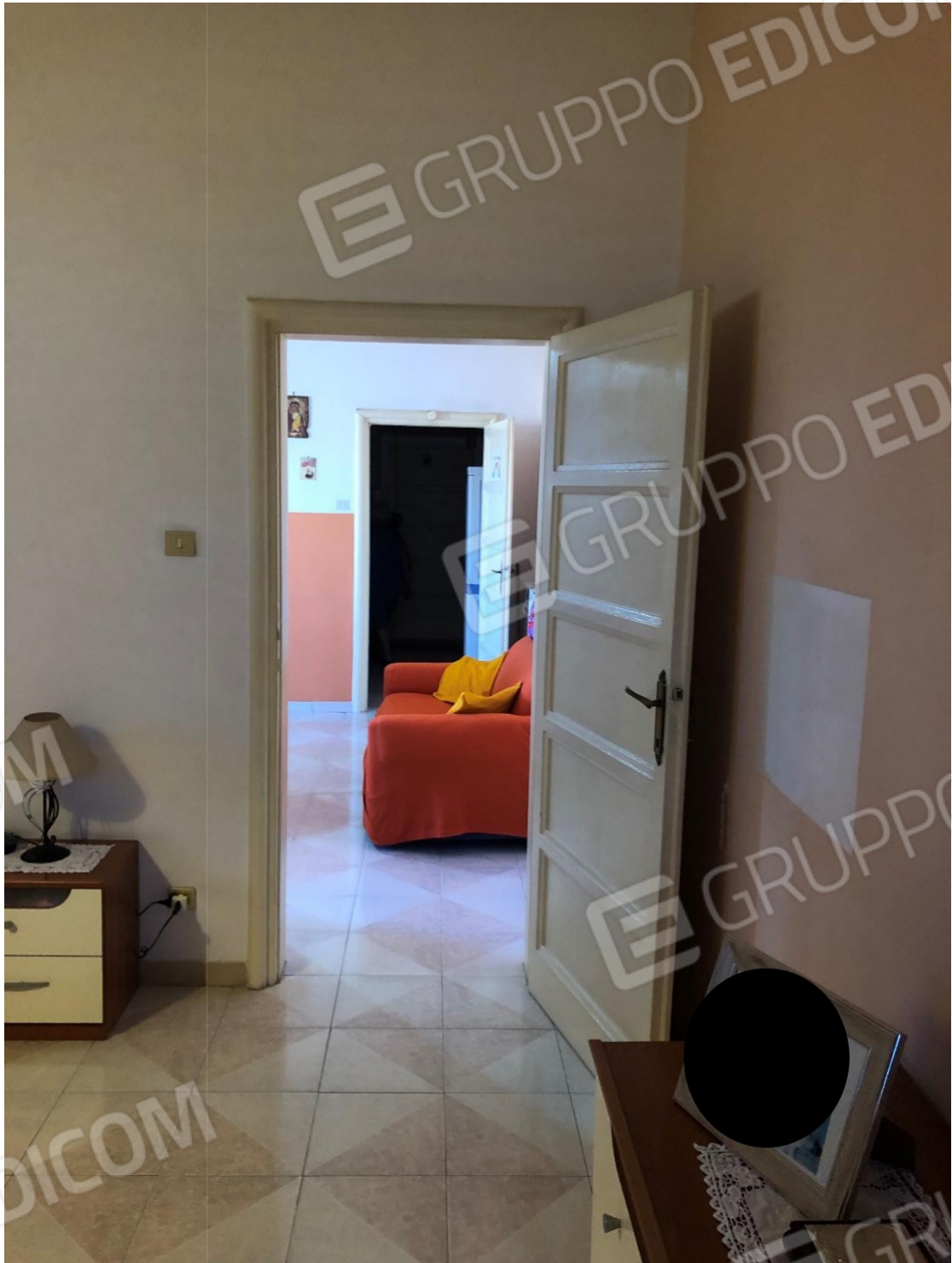
Foto n.7: Foto dell'appartamento in Benevento NCEU al foglio 93 particella 102 sub 11.