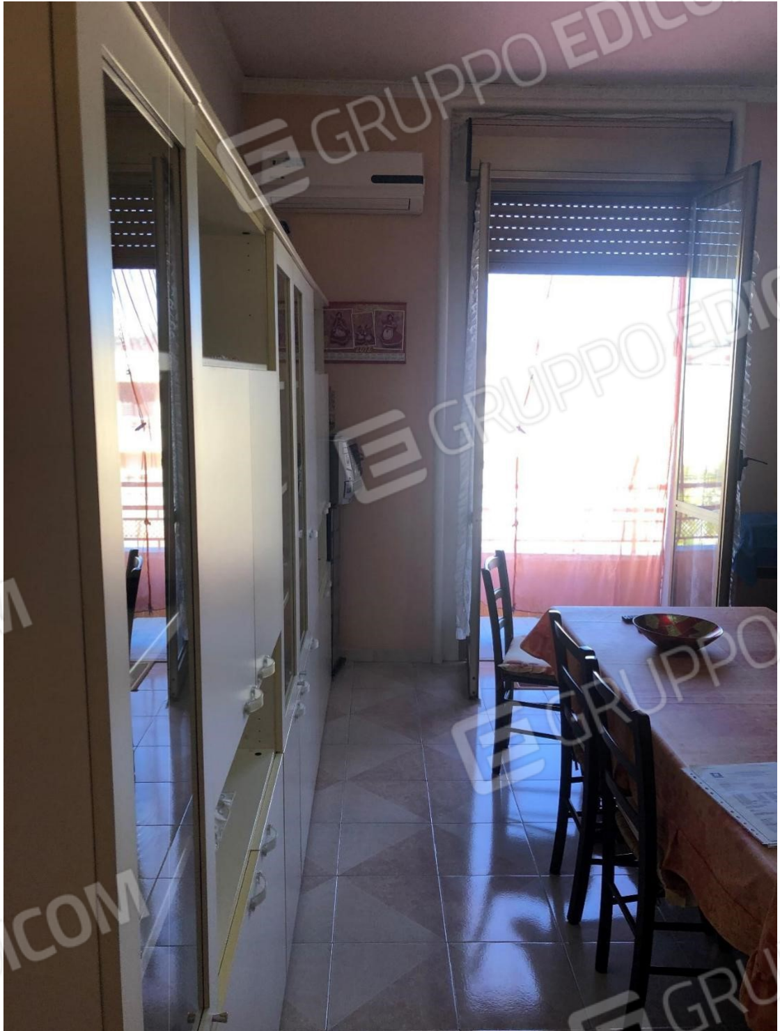
Foto n.10: Foto della cucina pranzo dell'appartamento in Benevento NCEU al foglio 93 particella 102 sub 11.