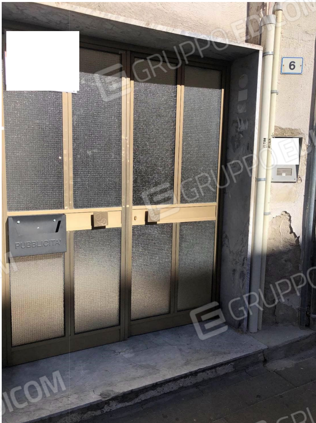
Foto n.5: Foto dell'accesso del palazzo dove insiste al 3 piano l'appartamento in Via Cesare Battisti n. 6 a Benevento NCEU al foglio 93 particella 102 sub 11.