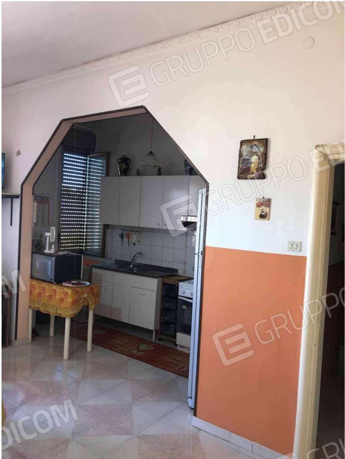
Foto n.9: Foto della cucina dell'appartamento in Benevento NCEU al foglio 93 particella 102 sub 11.