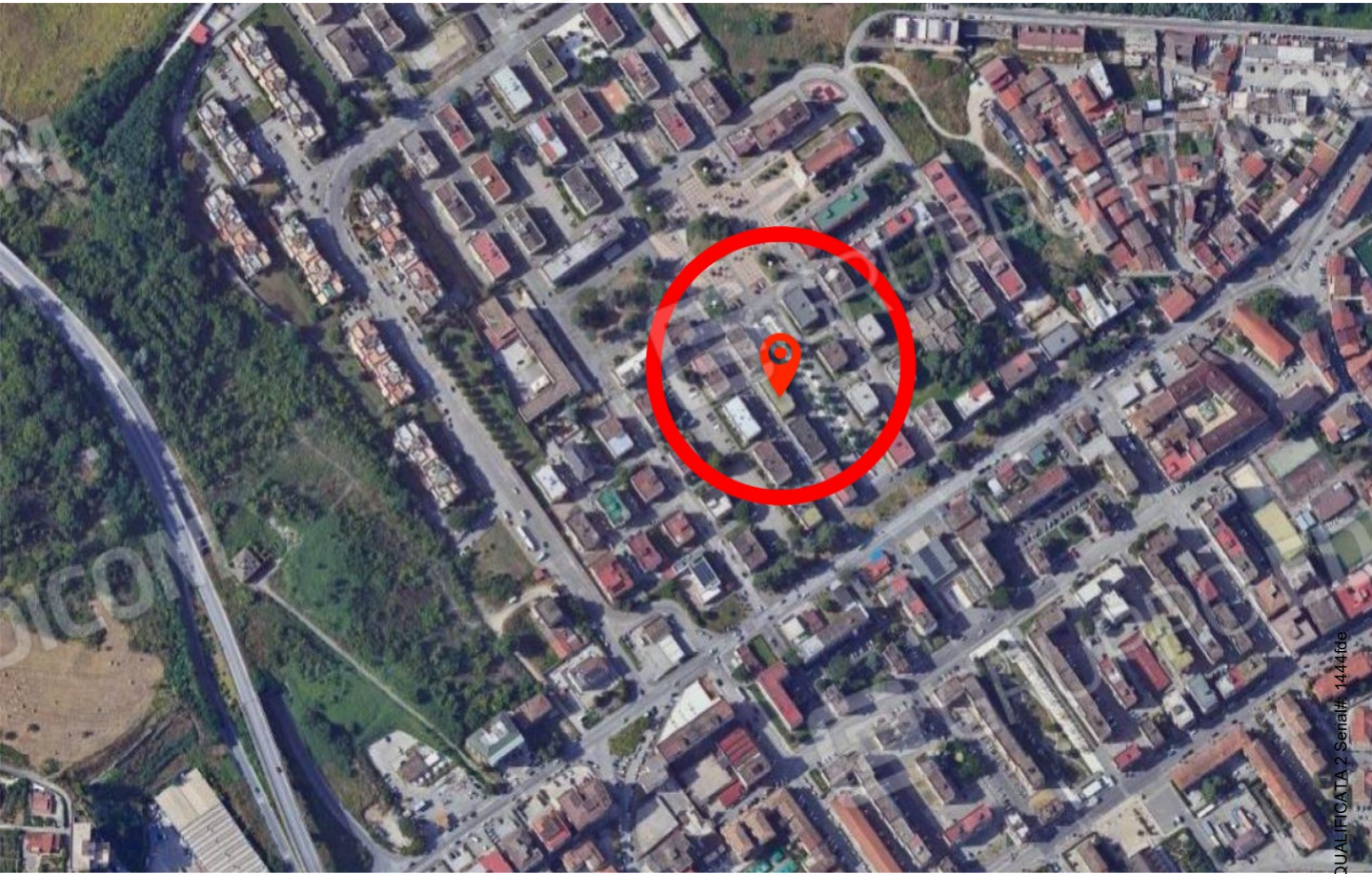
Foto n.1: Aerofoto del palazzo dove insiste al 3 piano l'appartamento in Via Cesare Battisti n. 6 a Benevento NCEU al foglio 93 particella 102 sub 11.