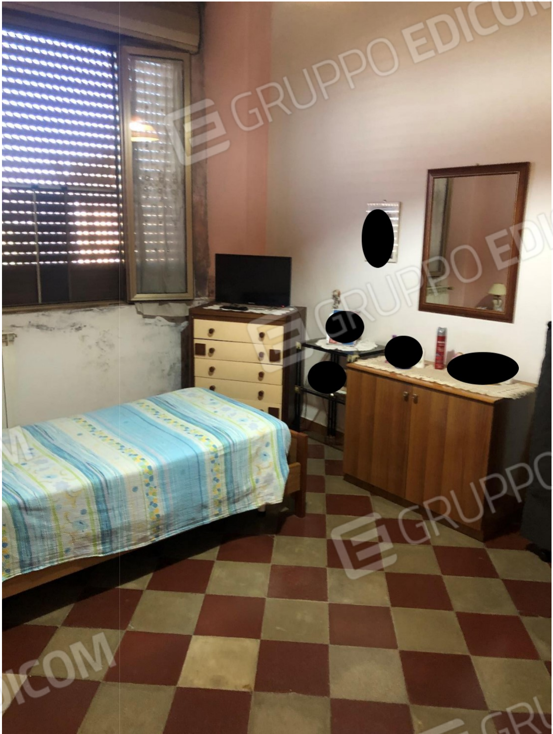
Foto n.12: Foto della stanza singola dell'appartamento in Benevento NCEU al foglio 93 particella 102 sub 11.