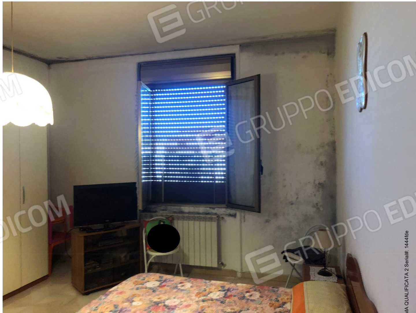
Foto n.11: Foto della stanza matrimoniale dell'appartamento in Benevento NCEU al foglio 93 particella 102 sub 11.