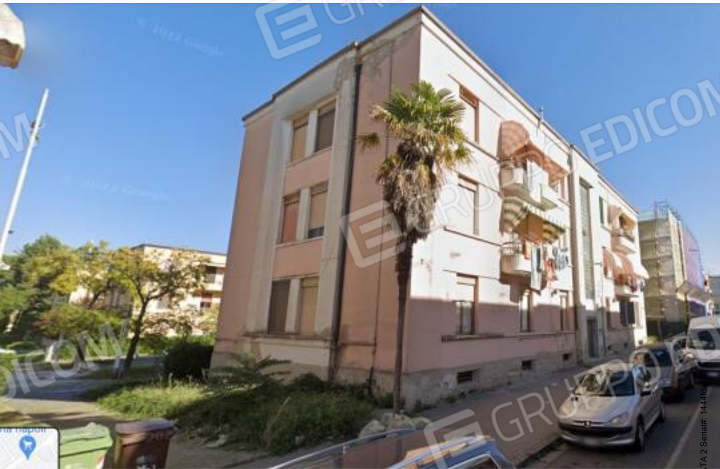
Foto n.4: Foto del palazzo dove insiste al 3 piano l' appartamento in Via Cesare Battisti n. 6 a Benevento NCEU al foglio 93 particella 102 sub 11.