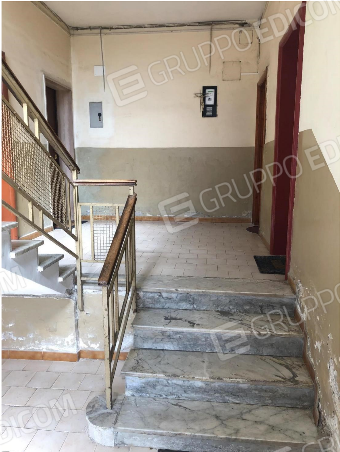
Foto n.6: Foto dell'ingresso alle scale dell'appartamento in Via Cesare Battisti n. 6 a Benevento NCEU al foglio 93 particella 102 sub 11.