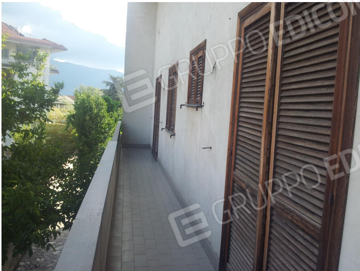
VISTA del BALCONE accessibile dalla camera Letto1 e Letto 2 (mentre dal Bagno 1 vi è solo l'affaccio)