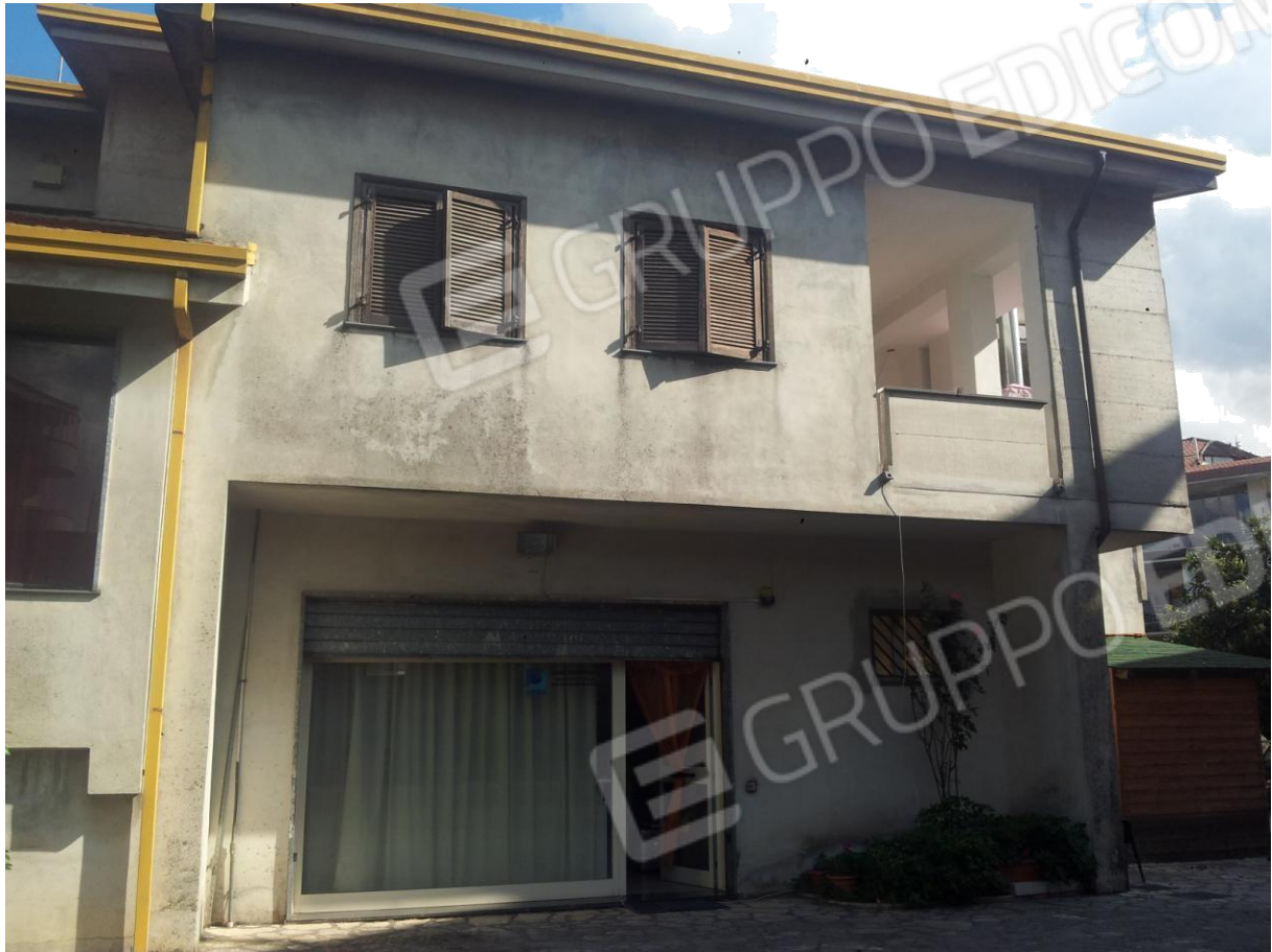
Vista Laterale – Al Piano Terra vista Ingresso Ufficio (riportato catastalmente come garage)