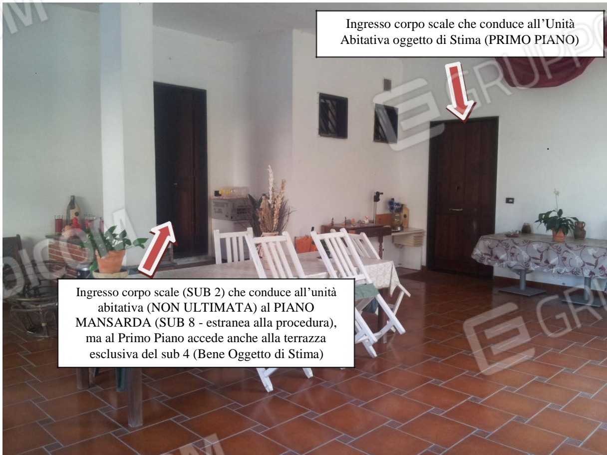
Ingresso corpo scale che conduce all'Unità Abitativa oggetto di Stima (PRIMO PIANO)