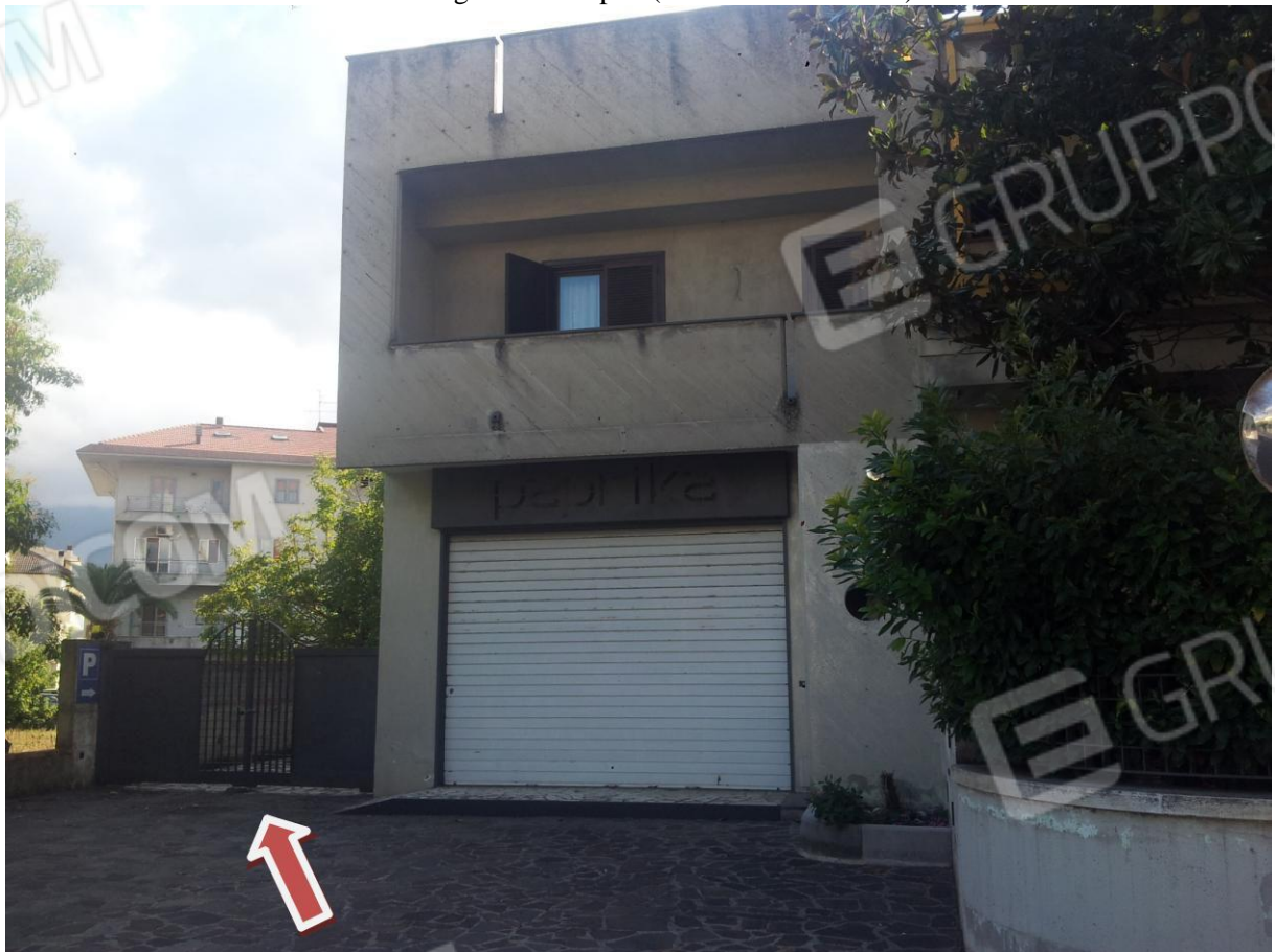
VISTA Secondo Ingresso e/o Uscita (Carrabile)