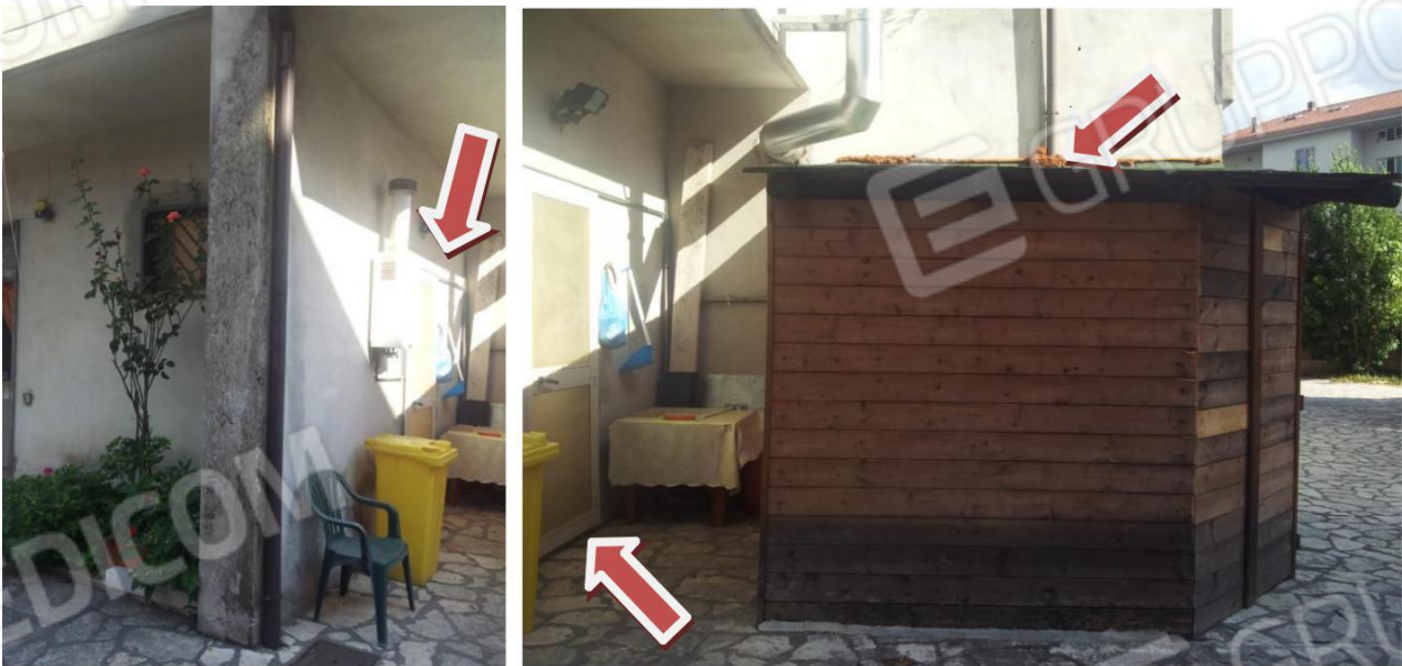
Vista Ingresso Deposito/Ripostiglio al PIANO TERRA e Struttura in legno (NON autorizzata) insistente sulla corte comune ed usata come deposito.