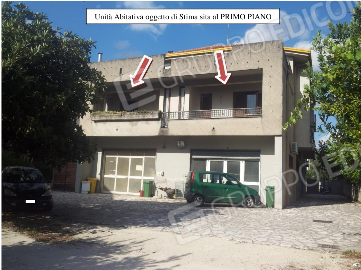
Unità Abitativa oggetto di Stima sita al PRIMO PIANO