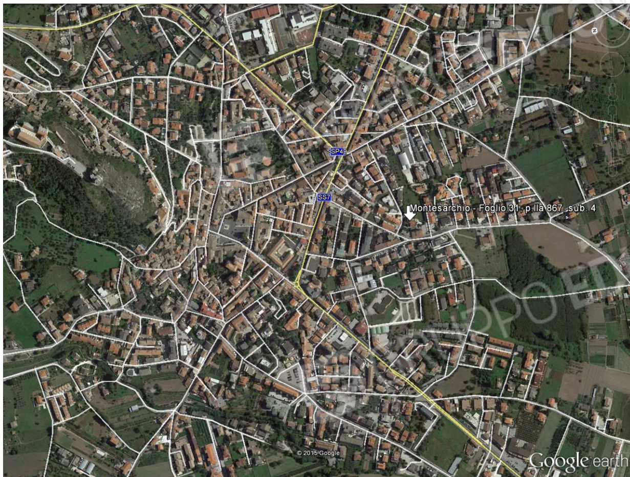
UNICO LOTTO PER LA VENDITA – MONTESARCHIO, Foglio 31, p.lla 867, sub 4.