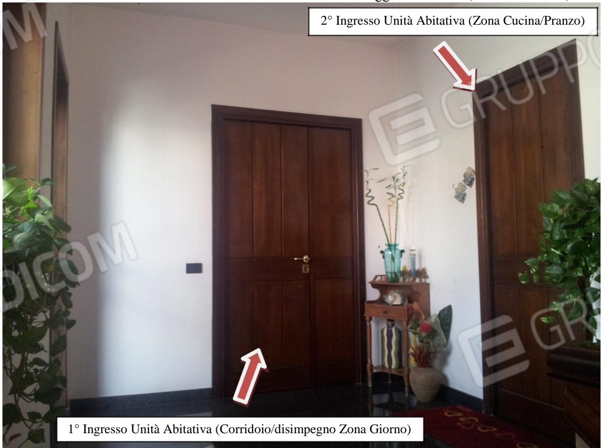
2° Ingresso Unità Abitativa (Zona Cucina/Pranzo)