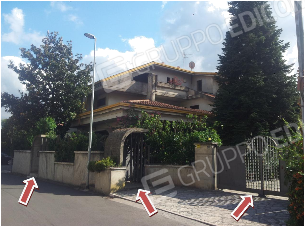
VISTA Ingressi Principali (Pedonale e Carrabile)