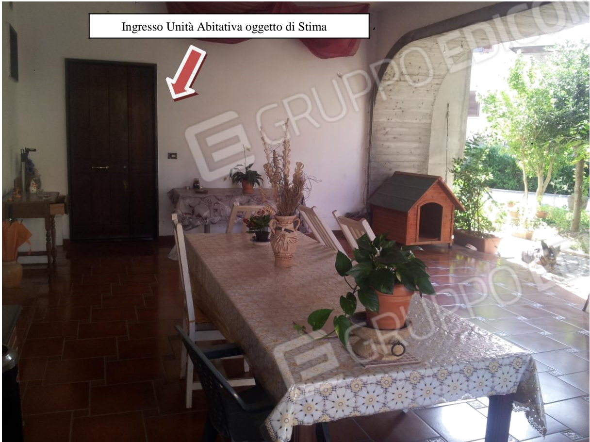
Vista del portico d'ingresso all'unità abitativa

Ingresso Unità Abitativa oggetto di Stima