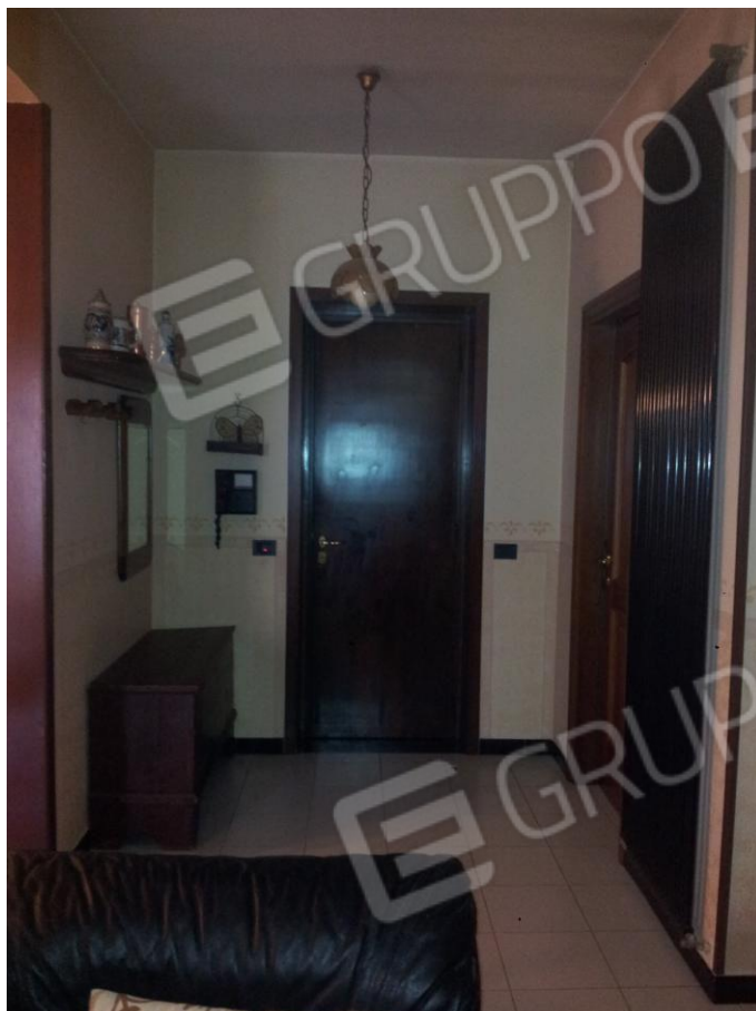
Vista interna del 2° Ingresso (Cucina/Pranzo) dell'Unità Abitativa