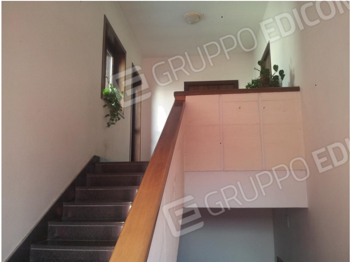
VISTA CORPO SCALE che conduce all'Unità Abitativa oggetto di Stima (PRIMO PIANO)