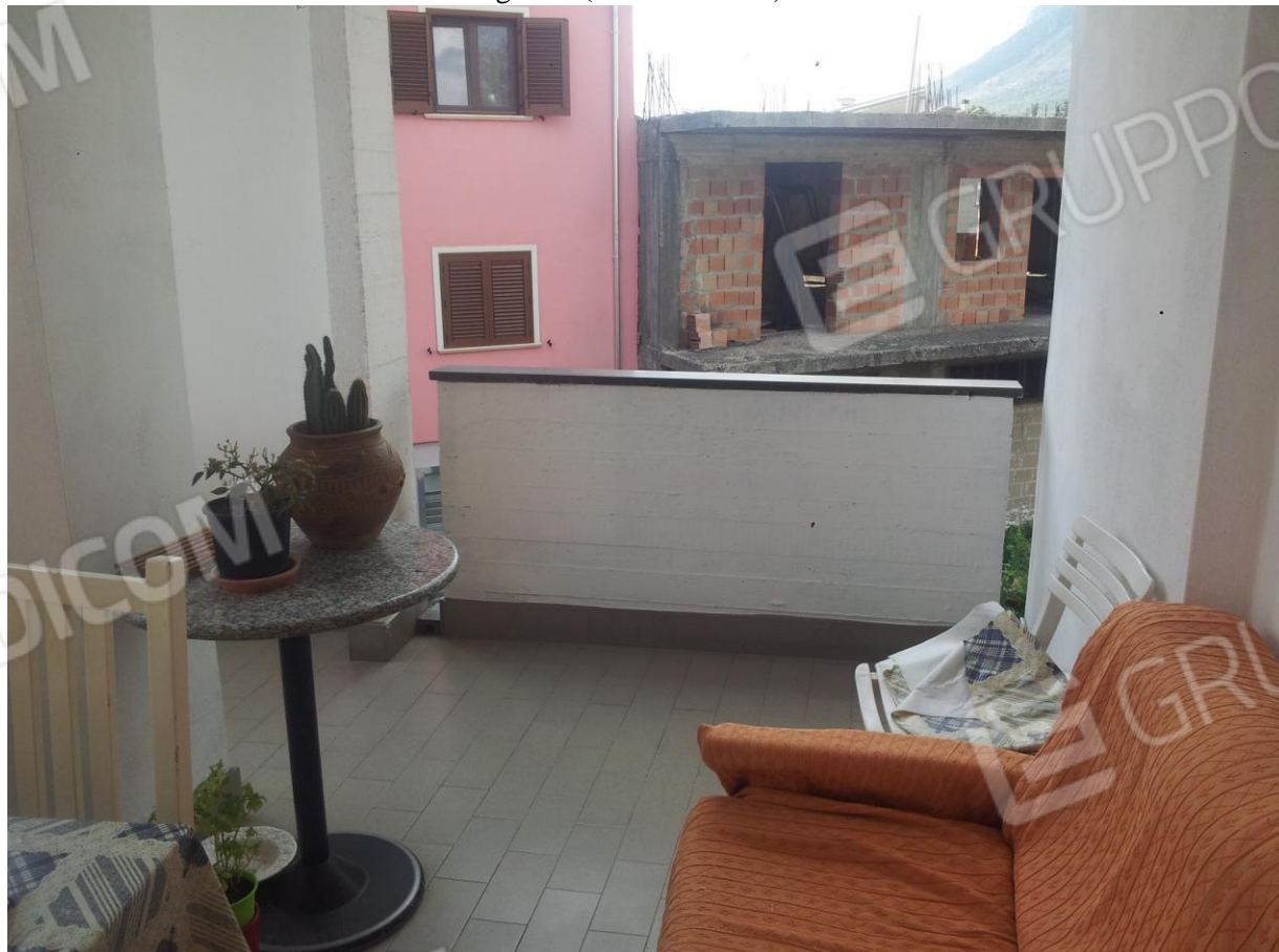
VISTA parziale del TERRAZZO/BALCONE accessibile solo dalla CUCINA/PRANZO