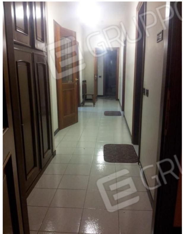
VISTA FRONTE-RETRO del SECONDO CORRIDOIO/DISIMPEGNO (Zona NOTTE)