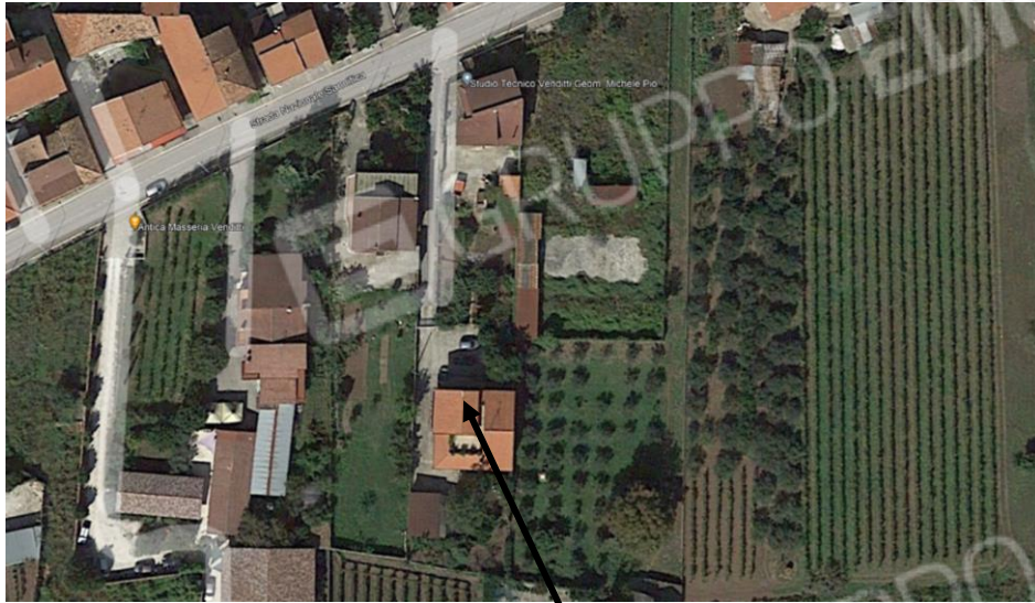
FABBRICATO OGGETTO DELLA PROCEDURA