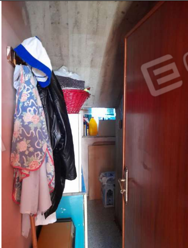
PIANO TERRA RIPOSTIGLIO