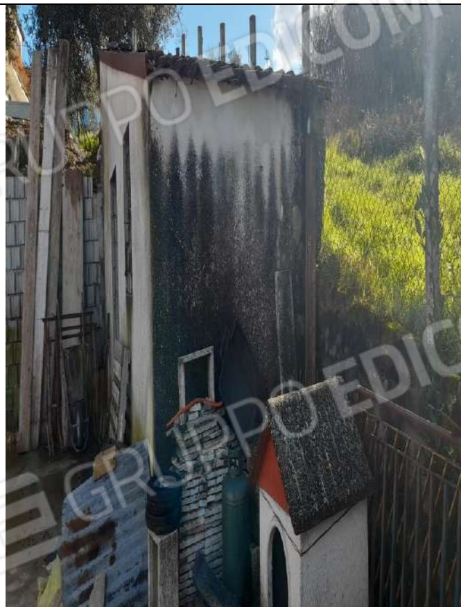
PIANO TERRA LEGNAIA SUB 5 LATO DX