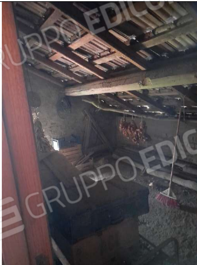
PIANO PRIMO VANO SOTTOTETTO 1