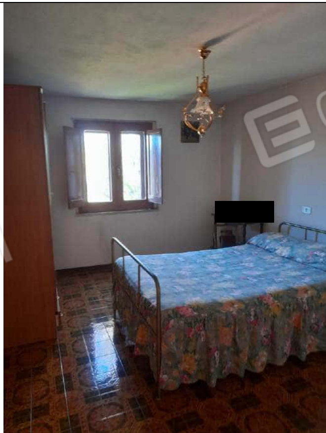
PIANO PRIMO LETTO 3