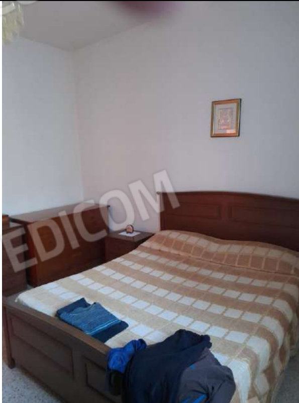
PIANO TERRA LETTO 2