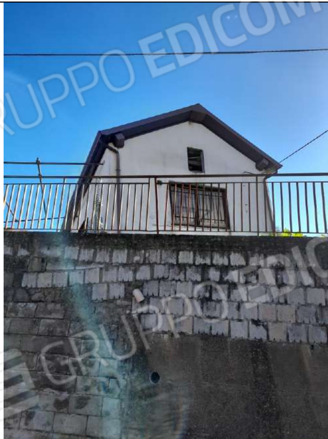
PIANO TERRA DEPOSITO SUB 3 LATO DX