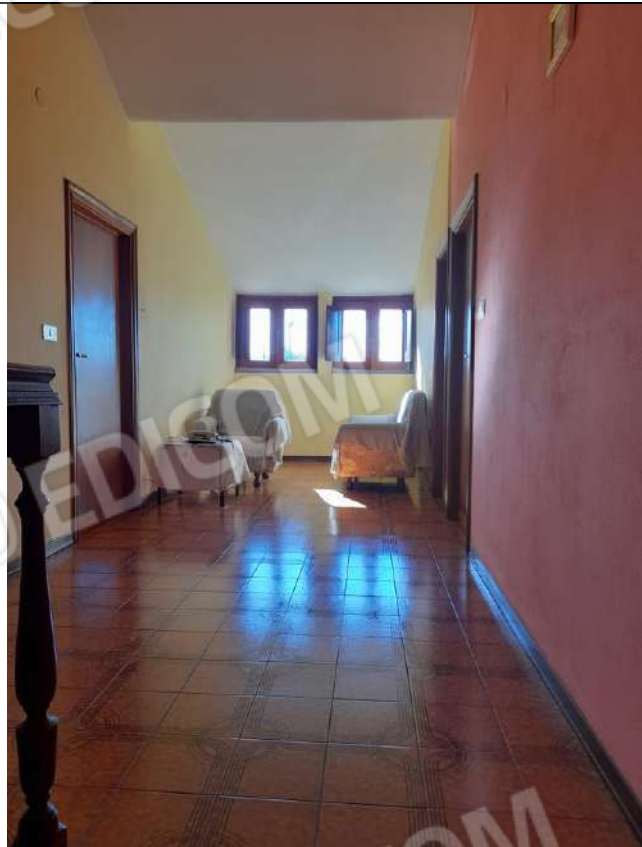
PIANO PRIMO DISIMPEGNO