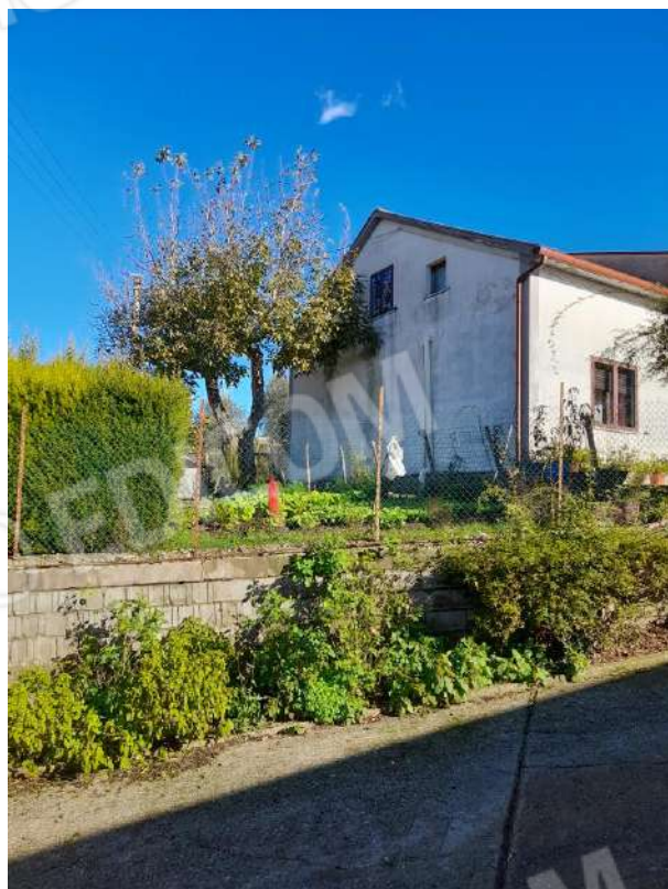
PROSPETTO LATERALE DALLA STRADA