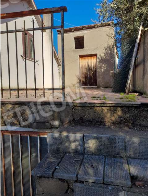
PIANO PRIMO DEPOSITO SUB 2