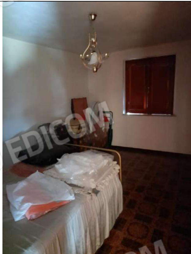
PIANO PRIMO LETTO 4