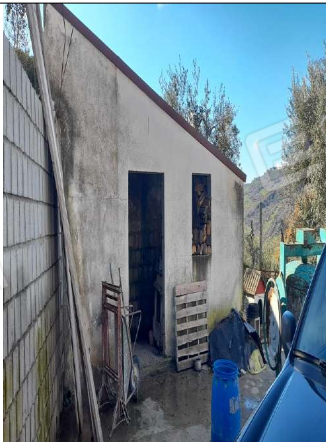
PIANO TERRA LEGNAIA SUB 5