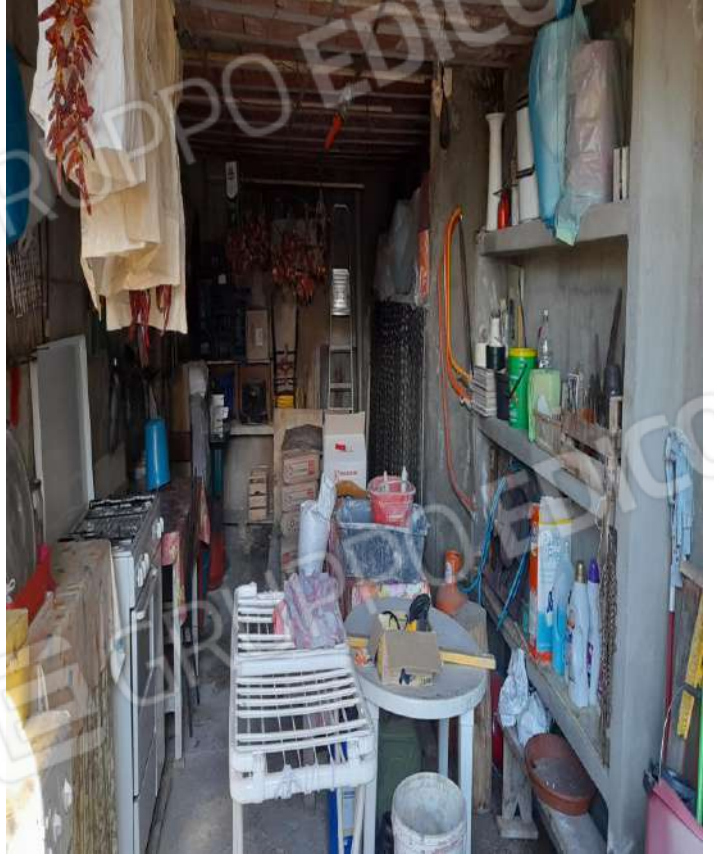
PIANO TERRA GARAGE