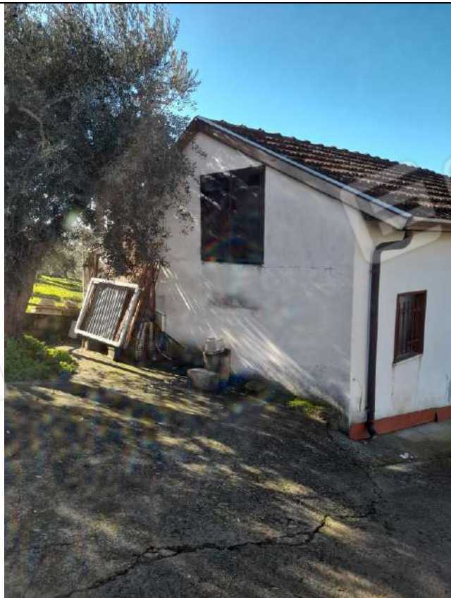
PIANO TERRA DEPOSITO SUB 3 LATO SX