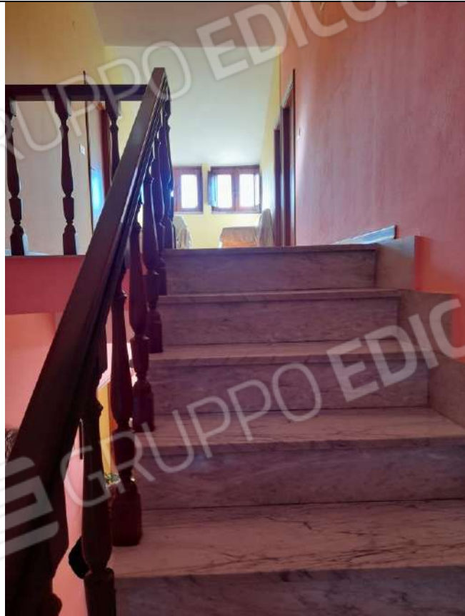
PIANO TERRA VANO SCALA