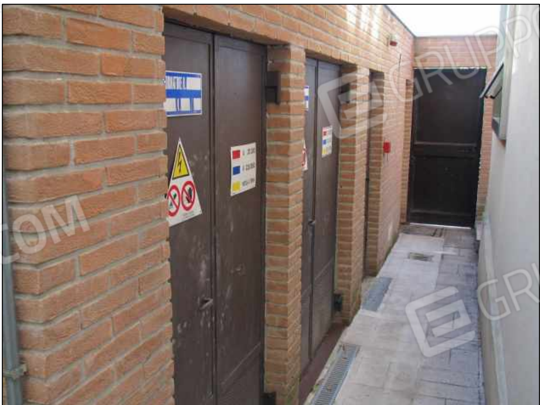
41. Spazi esterni al fabbricato in Benevento, via Avellino n. 48 (fg. 101 p.lla 397).