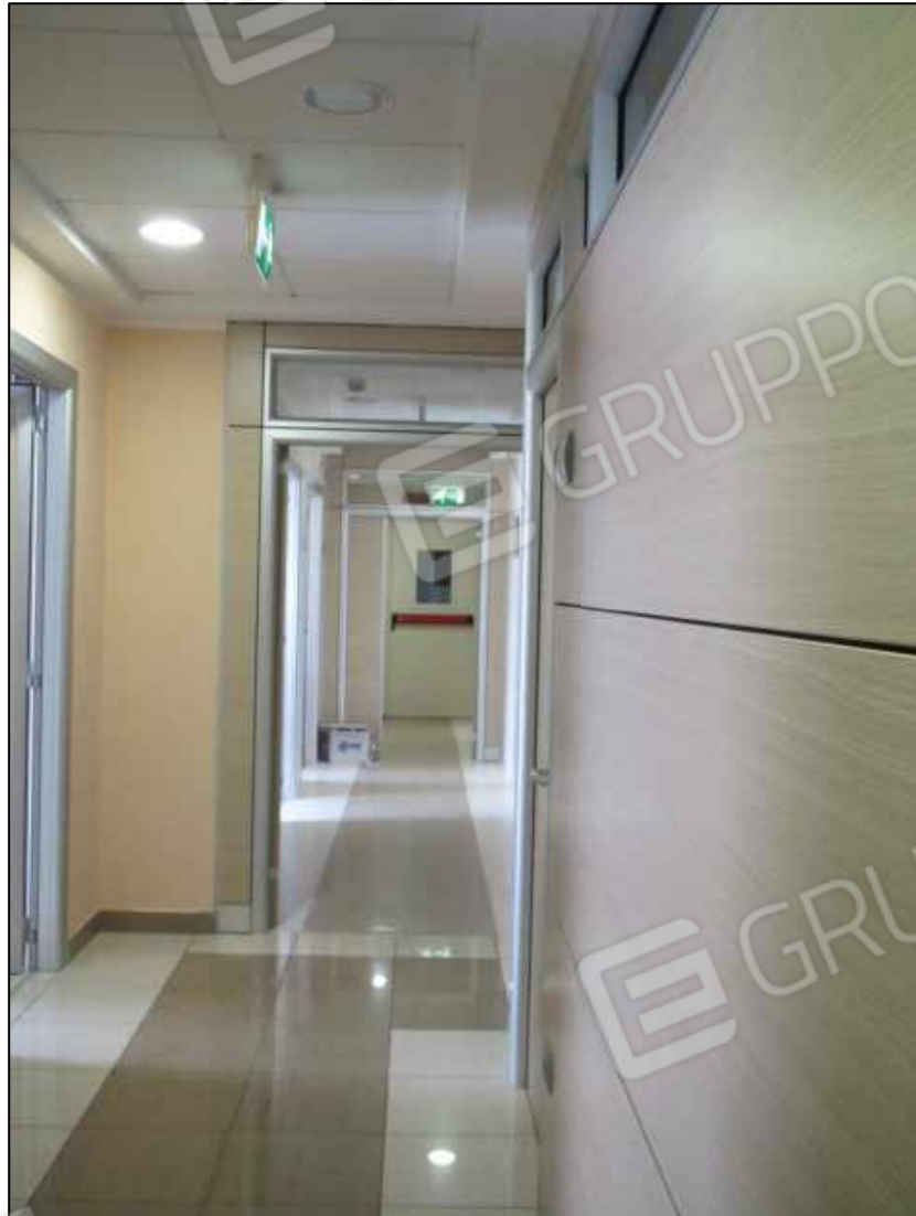
14. Corridoio al primo piano del Centro diagnostico G.B. Morgagni a Benevento (fg. 101 p.lla 397 sub 32).