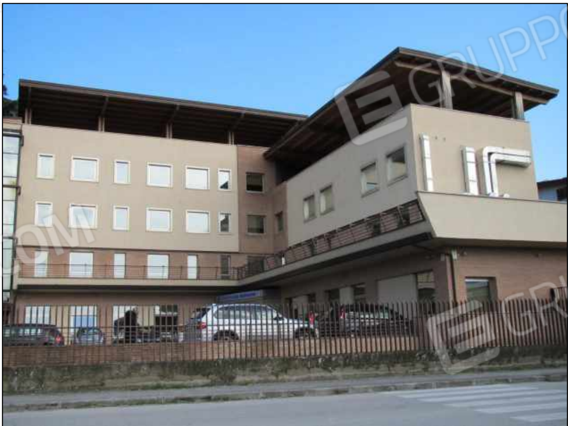
4. Fabbricato a Benevento, via Avellino n. 48. In Catasto fg. 101 p.lla 397.