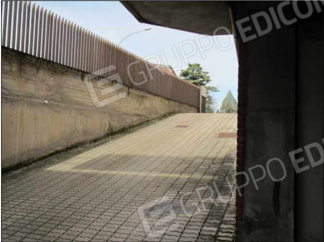
43. Rampa d'accesso al piano interrato del fabbricato in Benevento, via Avellino n. 48.