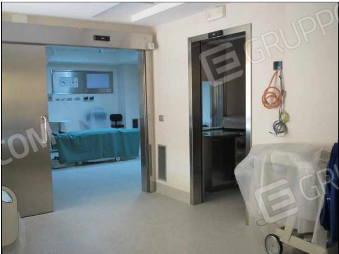
25. Sala operatoria al secondo piano del Centro diagnostico G.B. Morgagni.