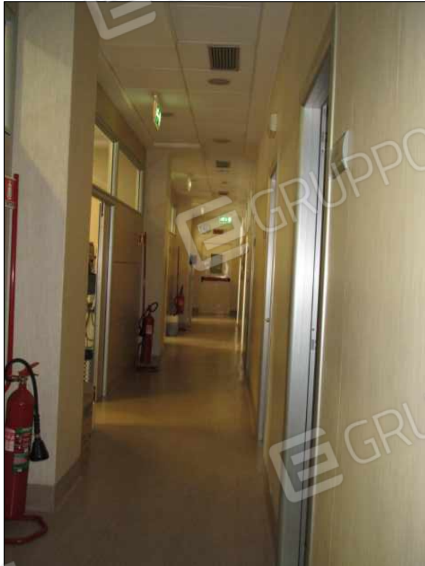
7. Corridoio al piano terra del Centro diagnostico G.B. Morgagni a Benevento, via Avellino n. 48. In Catasto fg. 101 p.lla 397 sub 31.