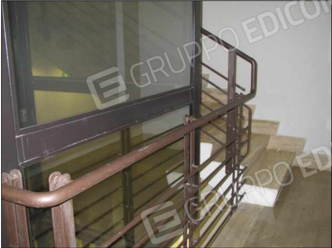
20. Pianerottolo al primo piano e scala interna di collegamento tra i livelli del fabbricato a Benevento, via Avellino n. 48.