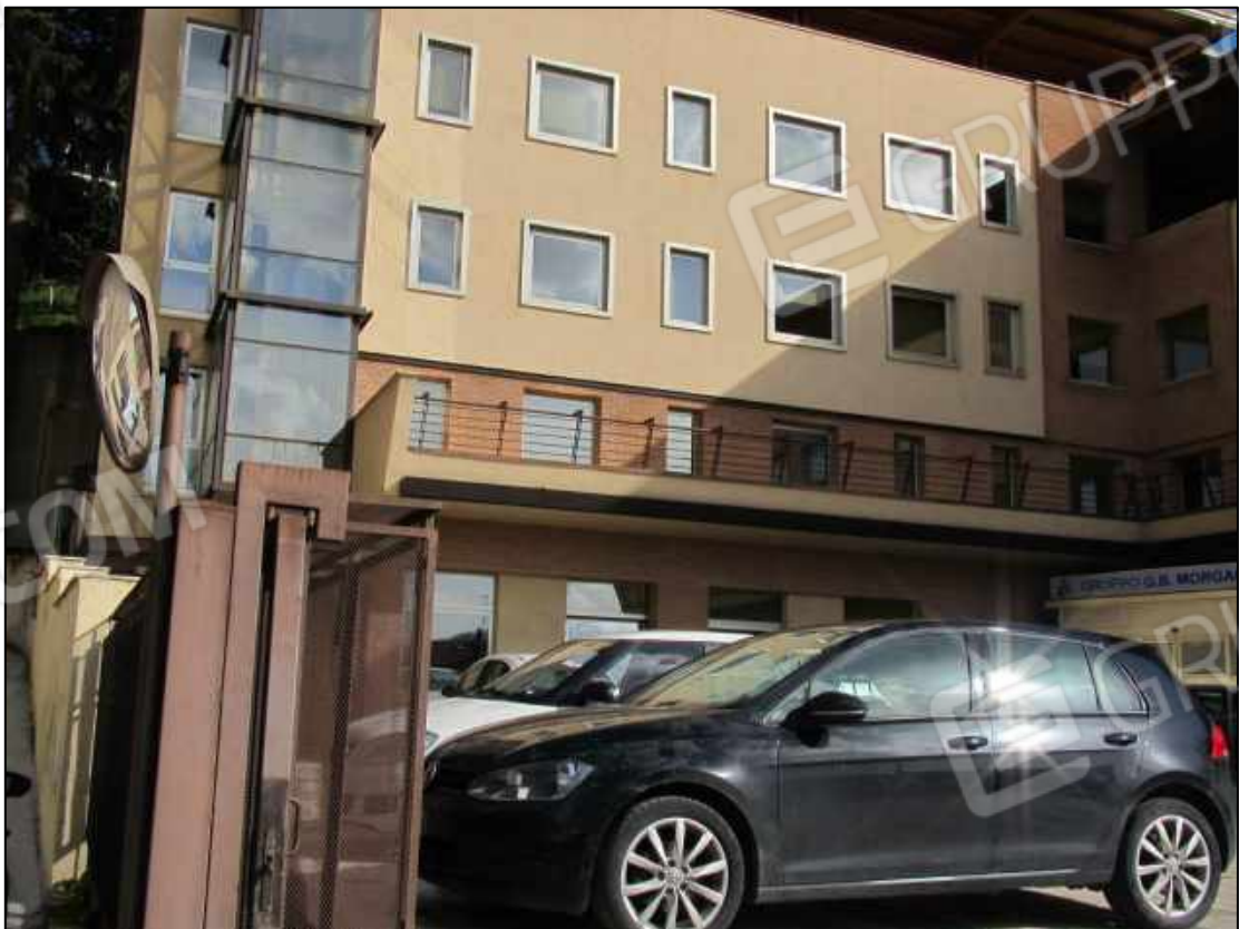
6. Ala del fabbricato a Benevento, via Avellino n. 48 (in Catasto fg. 101 p.lla 397).