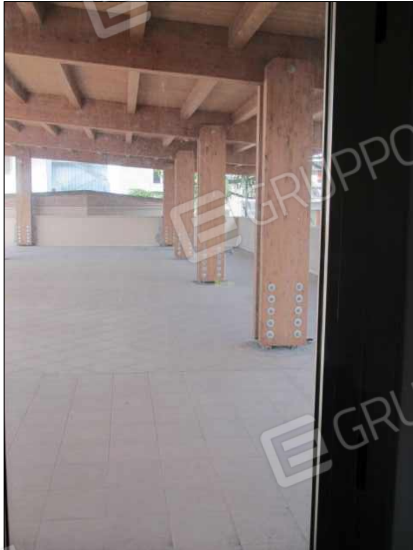
39. Portico al quarto piano del Centro diagnostico G.B. Morgagni.