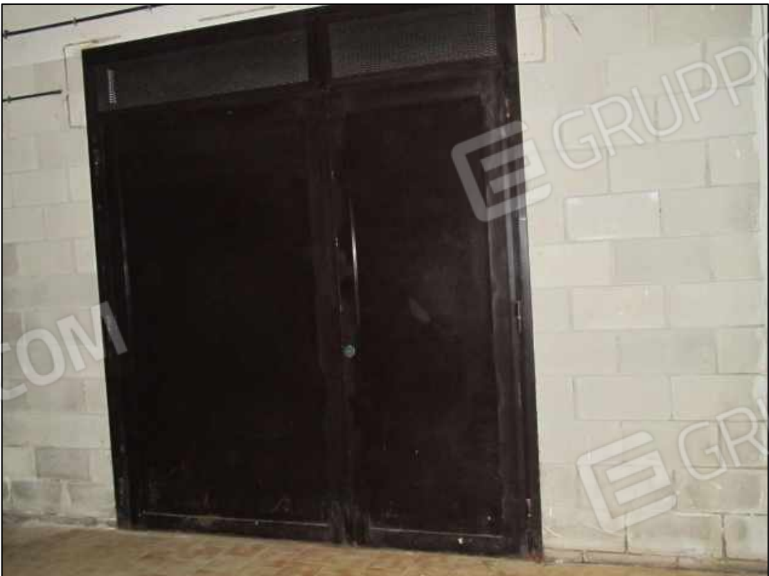
46. Porta d'ingresso al garage al piano interrato del fabbricato in Benevento, via Avellino n. 48 (fg. 101 p.lla 397 sub 10).