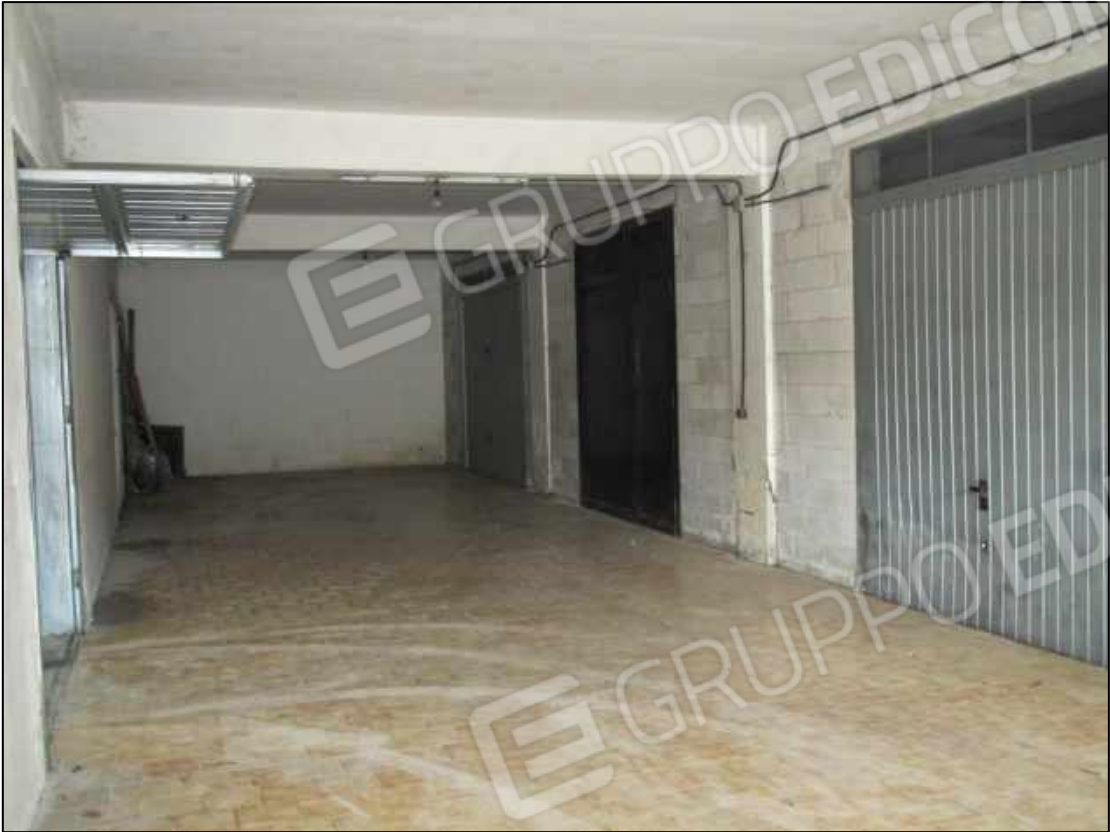
45. Spazi di manovra al piano interrato del fabbricato in Benevento, via Avellino n. 48.