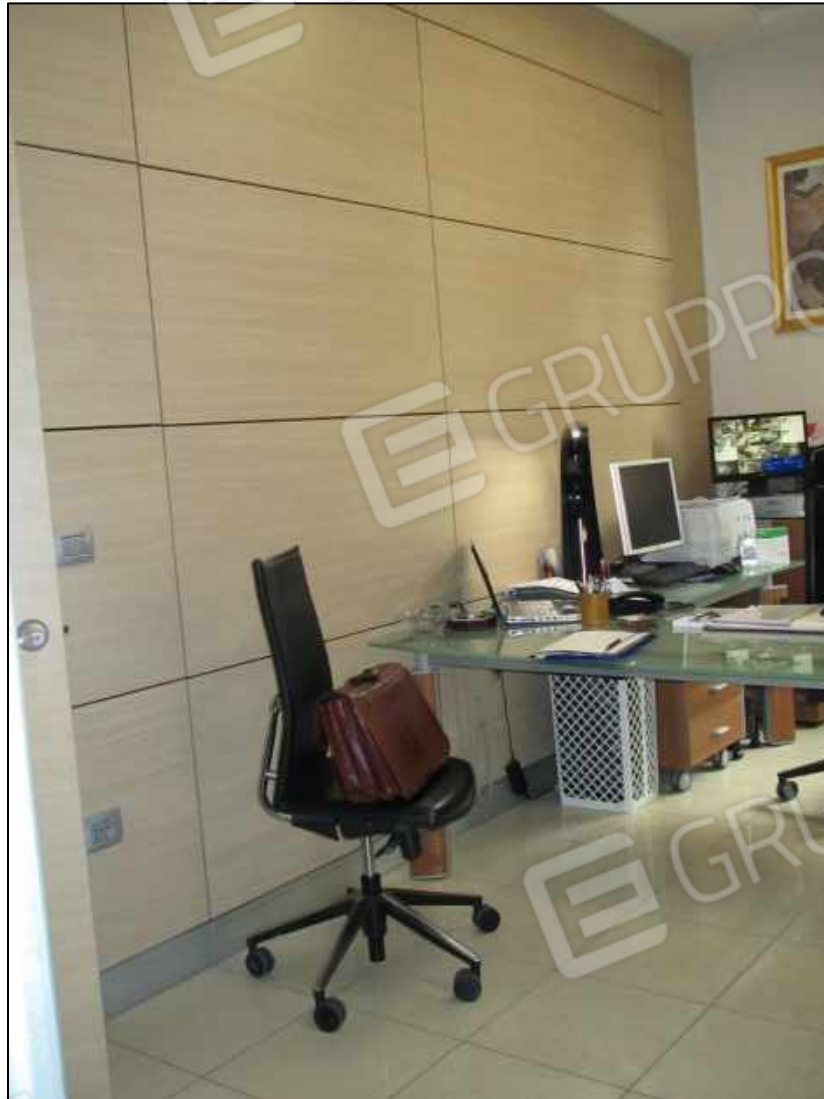
8. Un ufficio al piano terra del Centro diagnostico G.B. Morgagni in Benevento, via Avellino n. 48 (fg. 101 p.lla 397 sub 31).