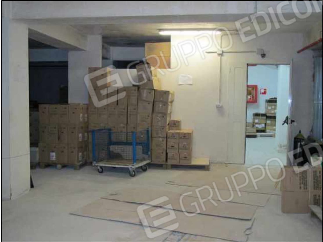
49. Locali garage al piano interrato del fabbricato in Benevento, via Avellino n. 48 (fg. 101 p.lla 397 sub 13).