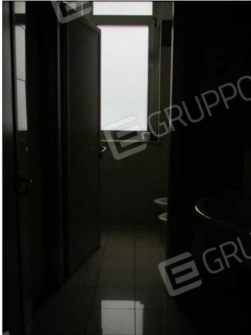
12. Servizi igienici al piano terra del Centro diagnostico (fg. 101 p.lla 397 sub 31).