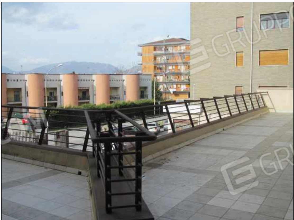
19. Terrazzo al primo piano del Centro diagnostico.