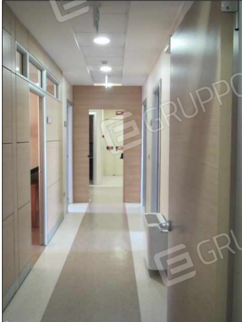
35. Corridoio a servizio degli ambulatori al terzo piano del Centro diagnostico G.B. Morgagni in Benevento, via Avellino n. 48 (fg. 101 p.lla 397 sub 34).