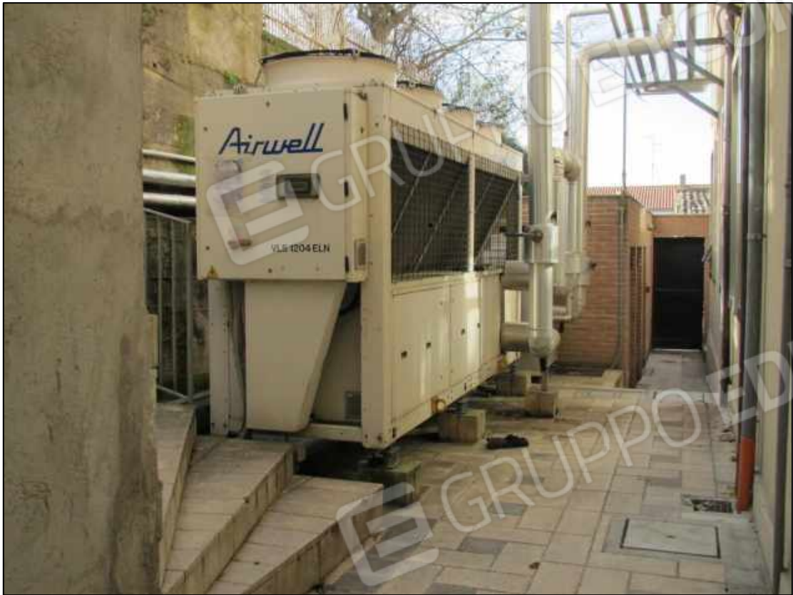
40. Spazi esterni al fabbricato in Benevento, via Avellino n. 48 (fg. 101 p.lla 397).