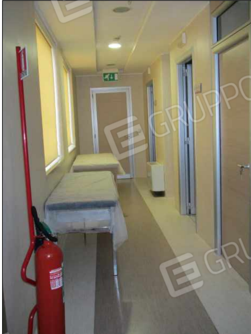
26. Corridoio al secondo piano del Centro diagnostico (fg. 101 p.lla 397 sub 34).