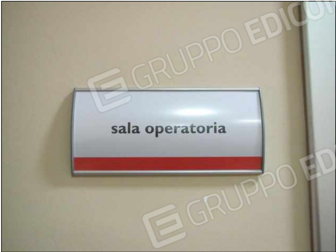
24. Cartello sala operatoria al secondo piano.