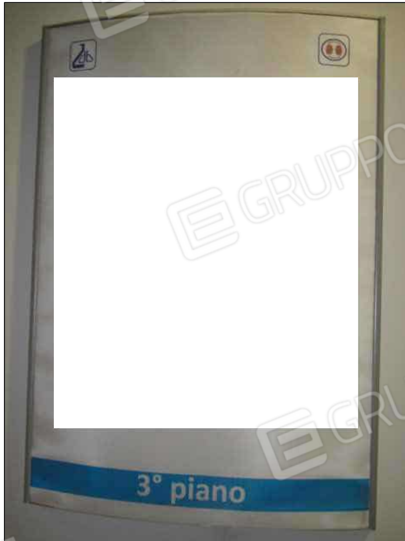
31. Insegna al terzo piano del Centro diagnostico G.B. Morgagni.