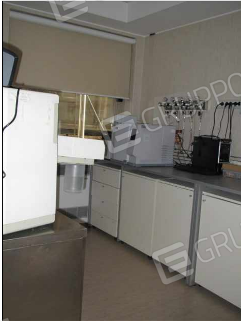
28. Ambulatorio al secondo piano del Centro diagnostico.