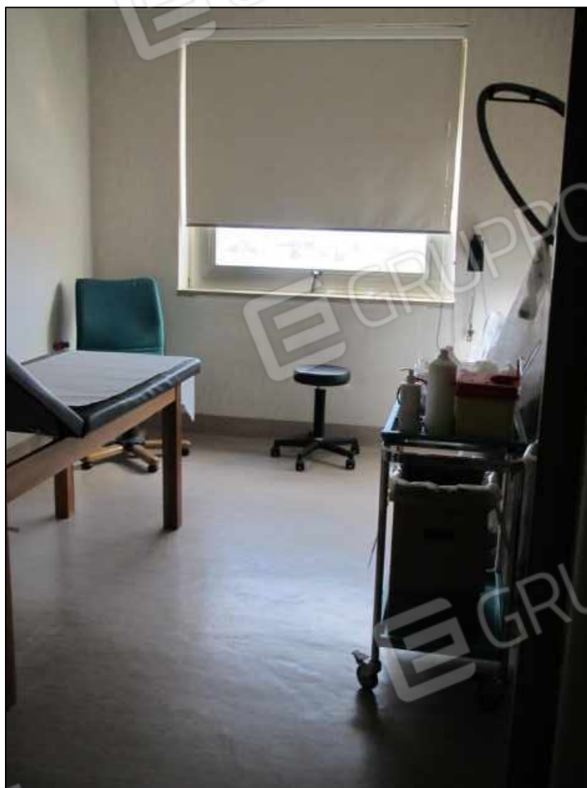
36. Un ambulatorio al terzo piano del Centro diagnostico G.B. Morgagni.