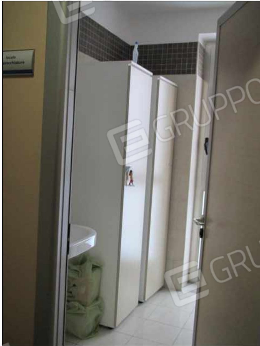
15. Servizi al primo piano del Centro diagnostico a Benevento, via Avellino n. 48. In Catasto fg. 101 p.lla 397 sub 32.