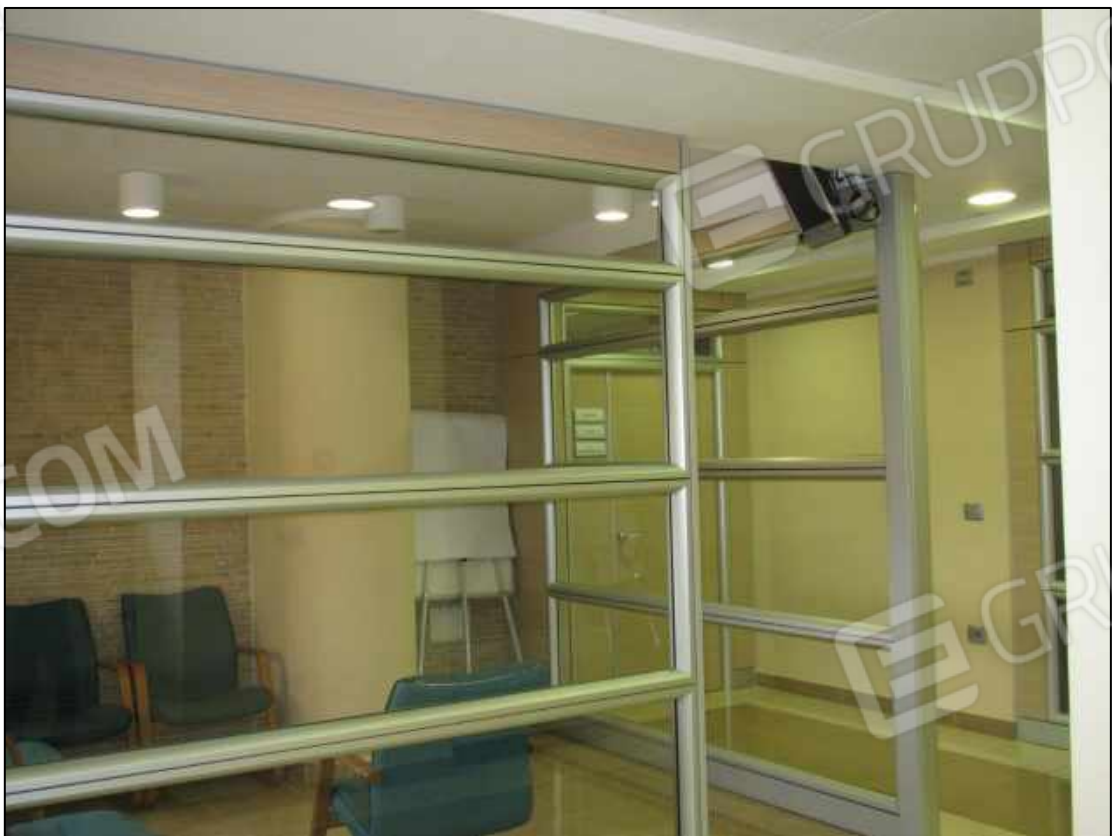
23. Sala attesa pazienti al secondo piano.