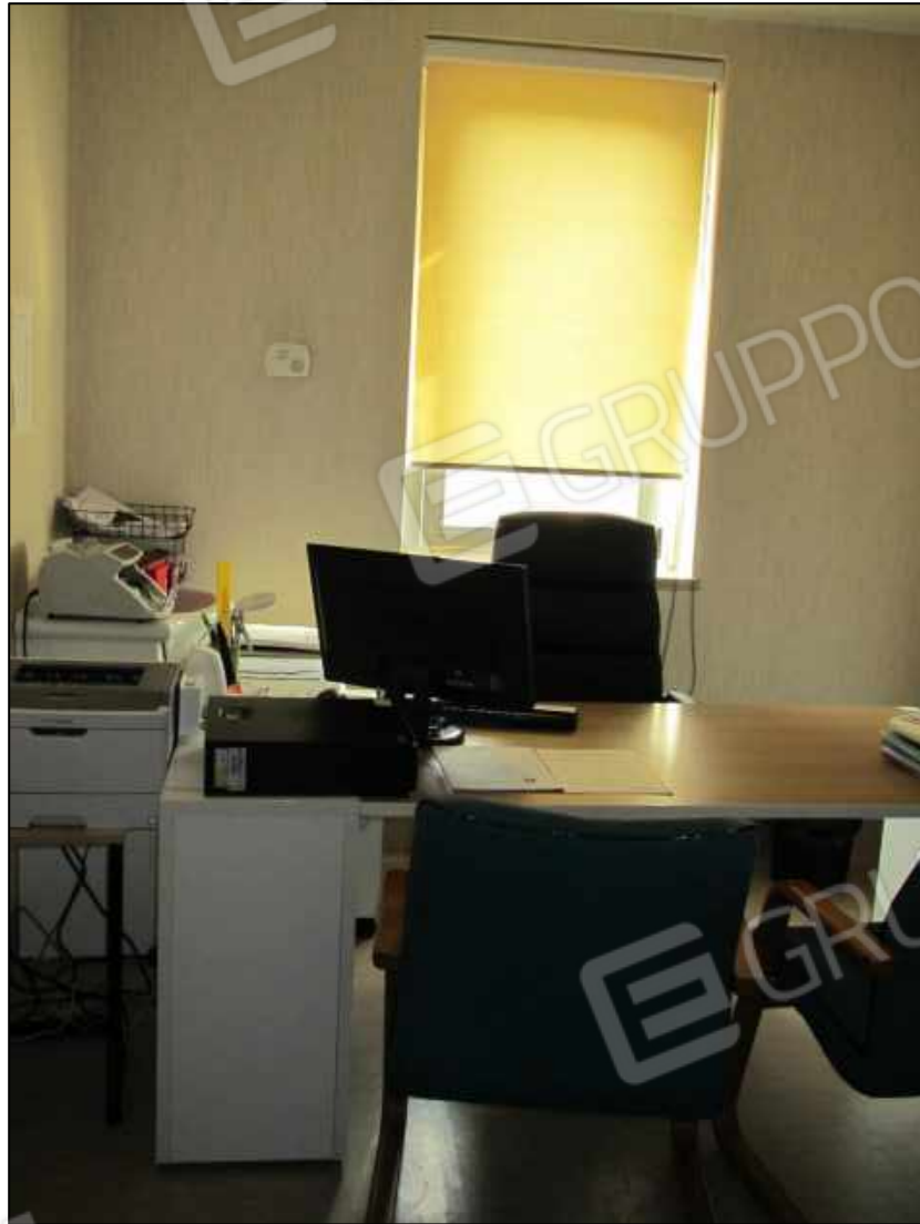
37. Ambulatorio al terzo piano.