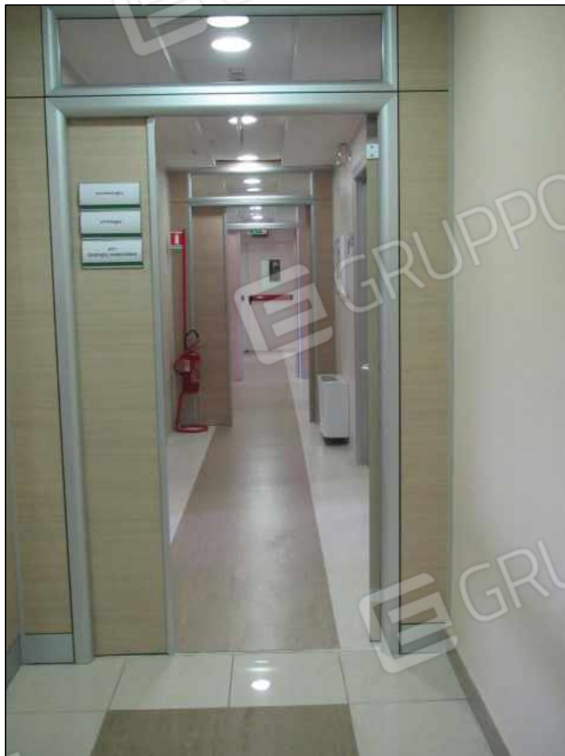
27. Accesso ad ambulatori al secondo piano del Centro diagnostico G.B. Morgagni a Benevento, via Avellino n. 48. In Catasto fg. 101 p.lla 397 sub 34.