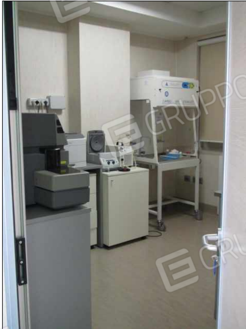
29. Ambulatorio al secondo piano del Centro diagnostico.