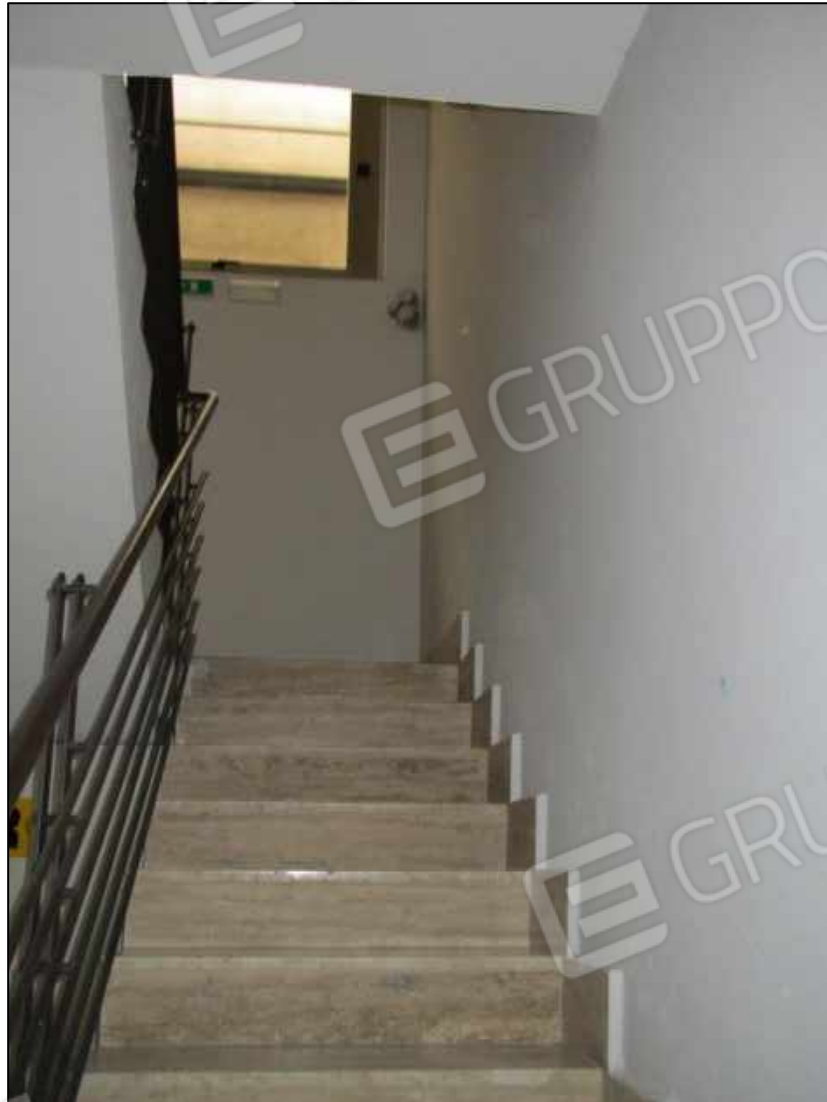
48. Rampe della scala interna che conducono al livello interrato del fabbricato in Benevento, via Avellino n. 48.