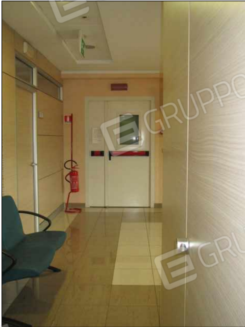
32. Ingresso e sala d'attesa al terzo piano.