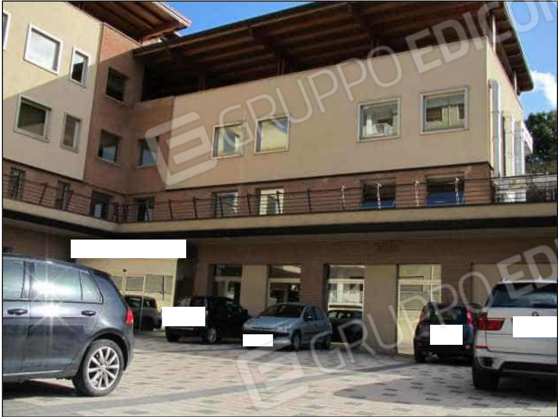
5. Un'ala del fabbricato a Benevento, via Avellino n. 48. In Catasto fg. 101 p.lla 397.