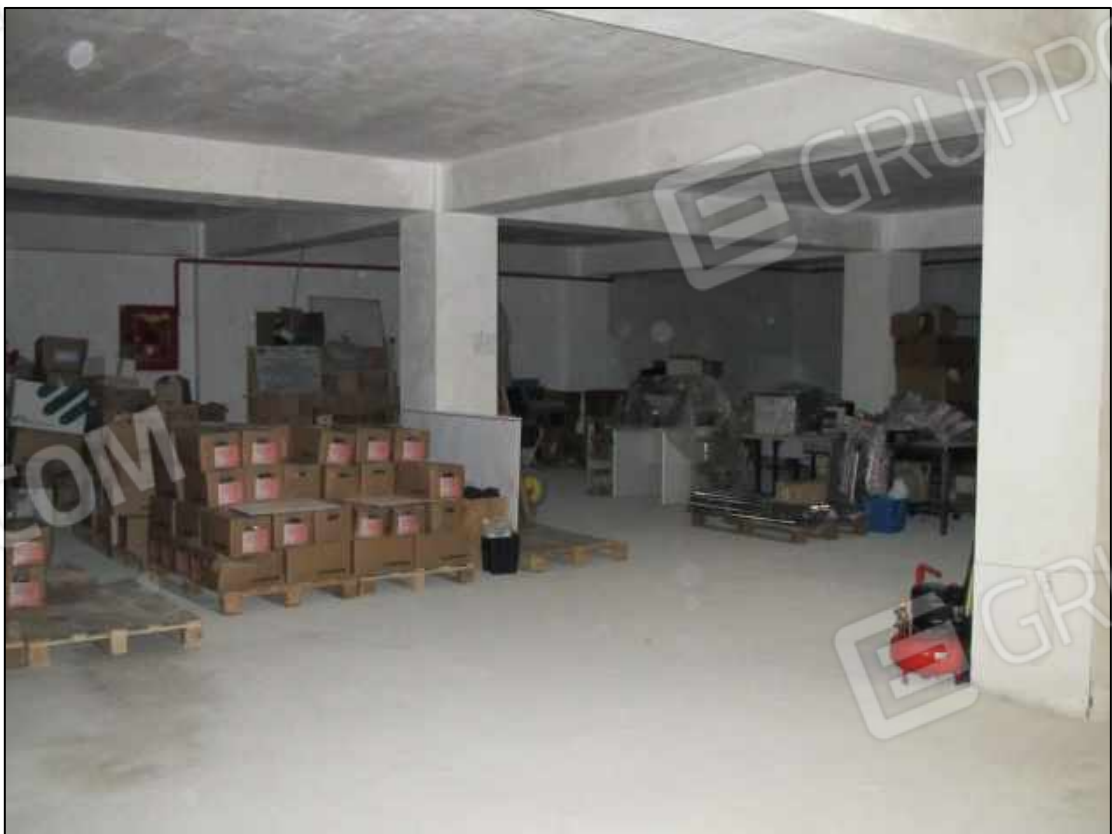
50. Garage al piano interrato (fg. 101 p.lla 397 sub 13).