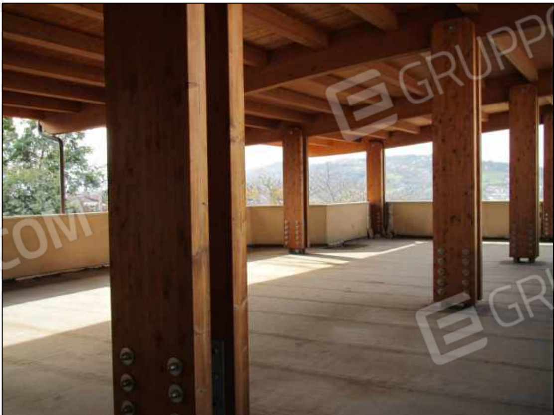
34. Copertura esterna al terzo piano del fabbricato.