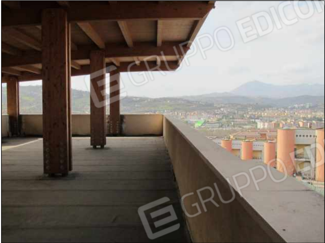
33. Copertura esterna al terzo piano del fabbricato.