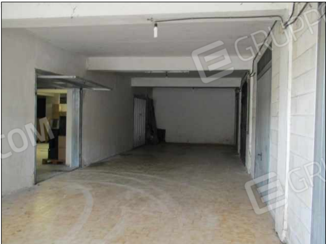
44. Spazi di manovra al piano interrato del fabbricato in Benevento, via Avellino n. 48.