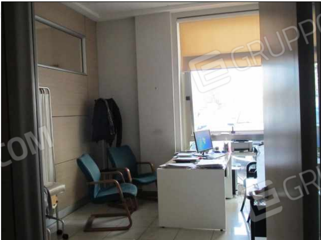
10. Un ufficio al piano terra del Centro diagnostico G.B. Morgagni in Benevento, via Avellino n. 48 (fg. 101 p.lla 397 sub 31).