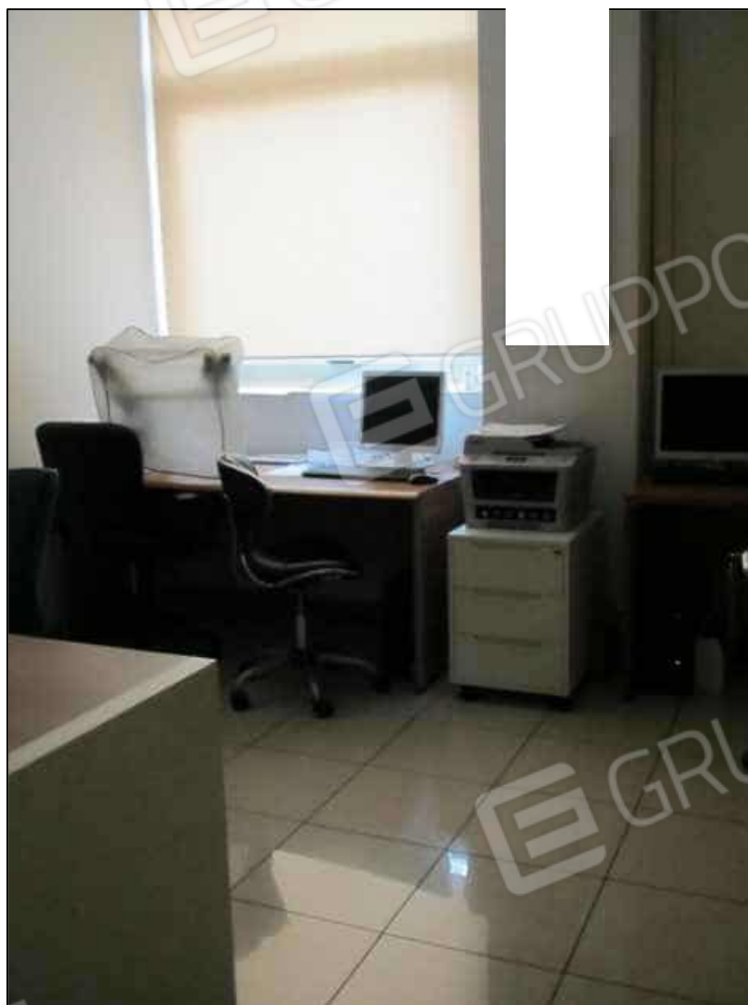
11. Un ufficio al piano terra del Centro diagnostico G.B. Morgagni in Benevento, via Avellino n. 48 (in Catasto Fabbricati fg. 101 p.lla 397 sub 31).