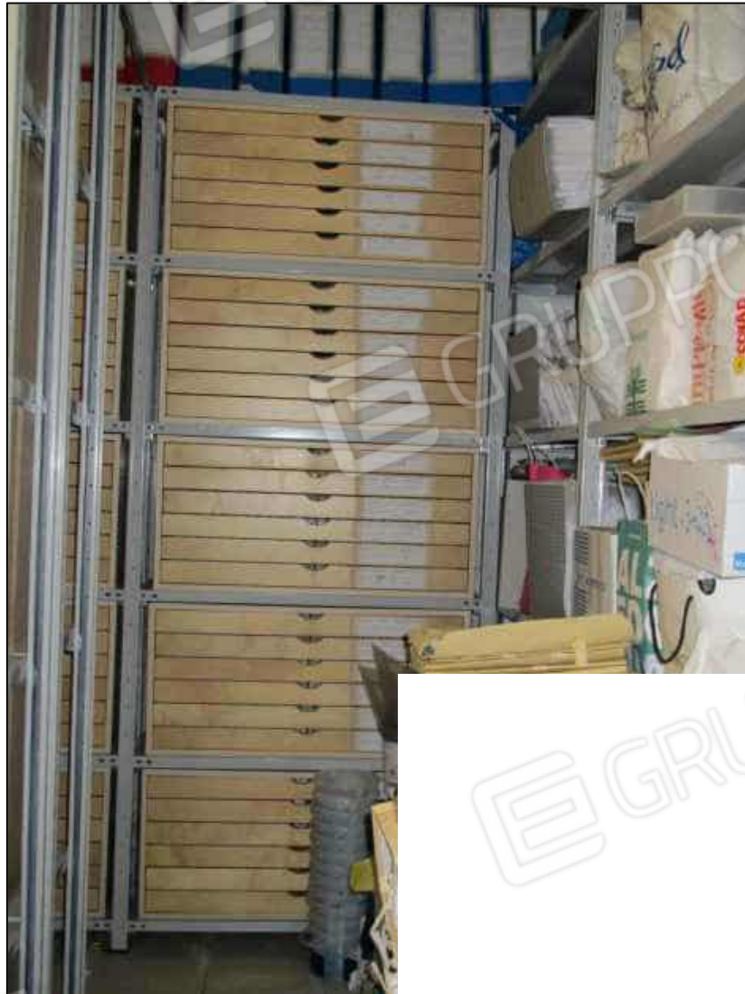
47. Interno del garage al piano interrato del fabbricato in Benevento, via Avellino n. 48 (fg. 101 p.lla 397 sub 10).