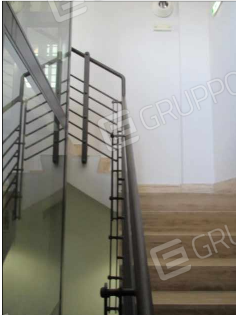
38. Rampe di scala interna al terzo livello del Centro diagnostico.