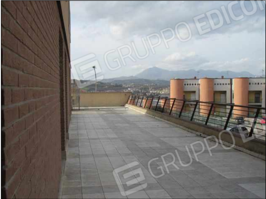
18. Terrazzo al primo piano del Centro diagnostico G.B. Morgagni a Benevento, via Avellino n. 48. In Catasto fg. 101 p.lla 397 sub 32.