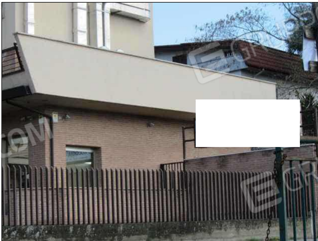
2. Insegne del Centro diagnostico G.B. Morgagni a Benevento, via Avellino n. 48.