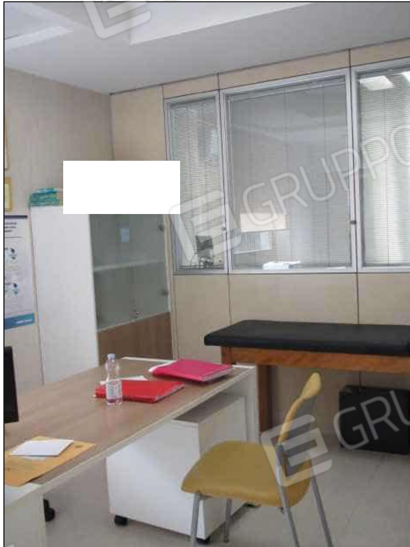
17. Ambulatorio al primo piano del Centro diagnostico (fg. 101 p.lla 397 sub 32).