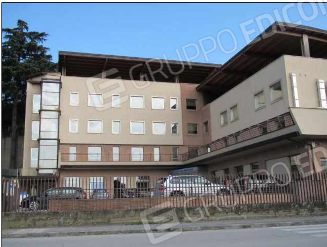
1. Fabbricato con funzioni di Centro diagnostico a Benevento, via Avellino n. 48. In Catasto fg. 101 p.lla 397.