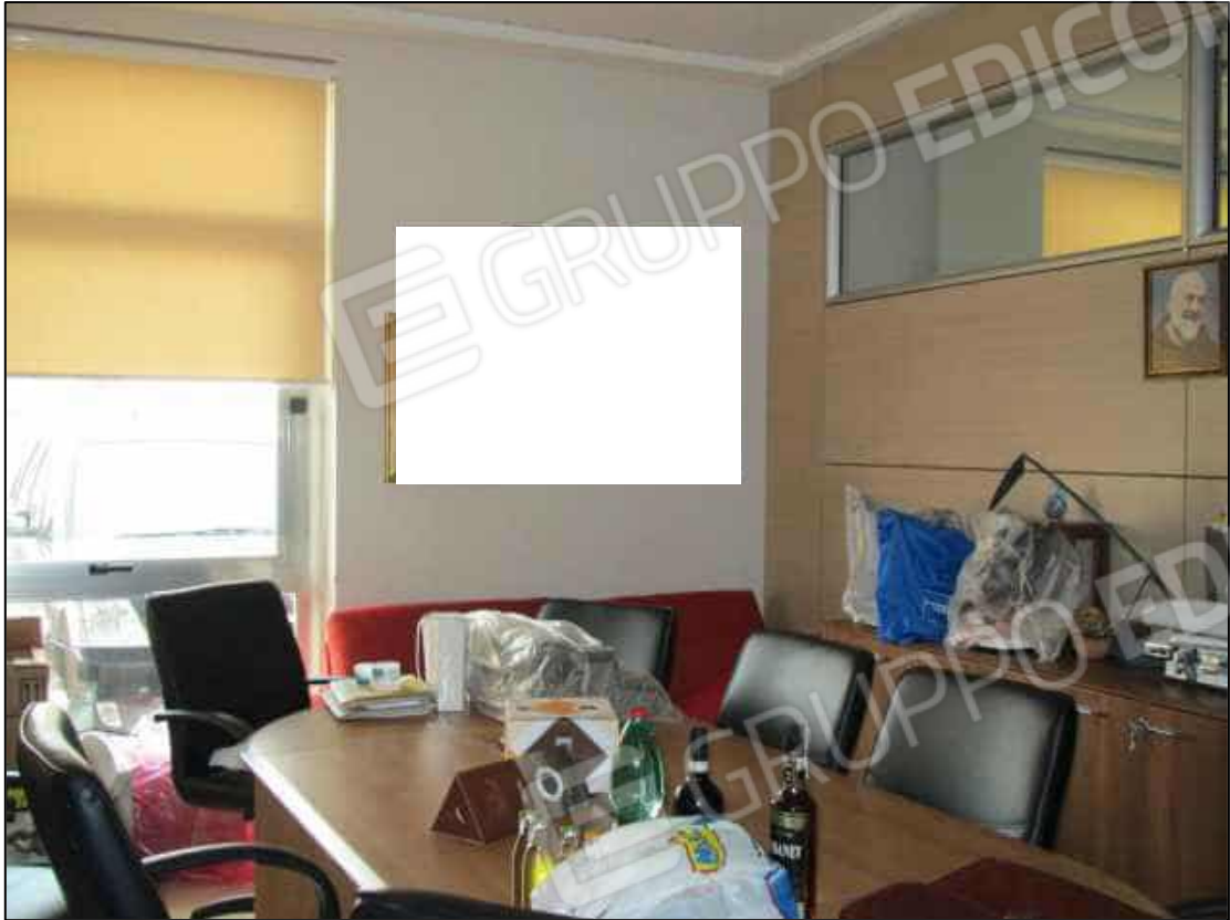
9. Sala riunioni al piano terra del fabbricato (fg. 101 p.lla 397 sub 31).