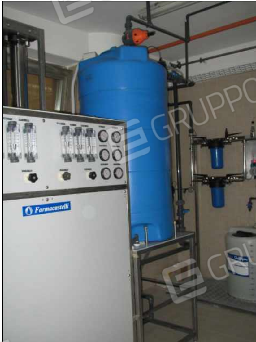
16. Locale macchinari al primo piano del Centro diagnostico G.B. Morgagni. In Catasto fg. 101 p.lla 397 sub 32.