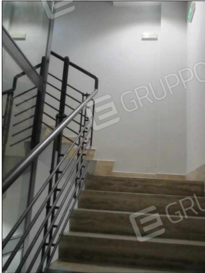
30. Scala interna di collegamento tra i piani del fabbricato a Benevento, via Avellino n. 48.