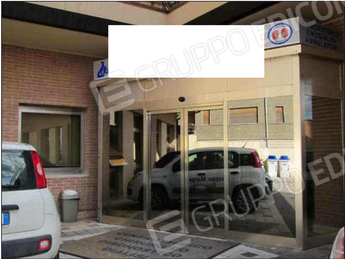
3. Ingresso al Centro diagnostico G.B. Morgagni di Benevento, via Avellino n. 48.