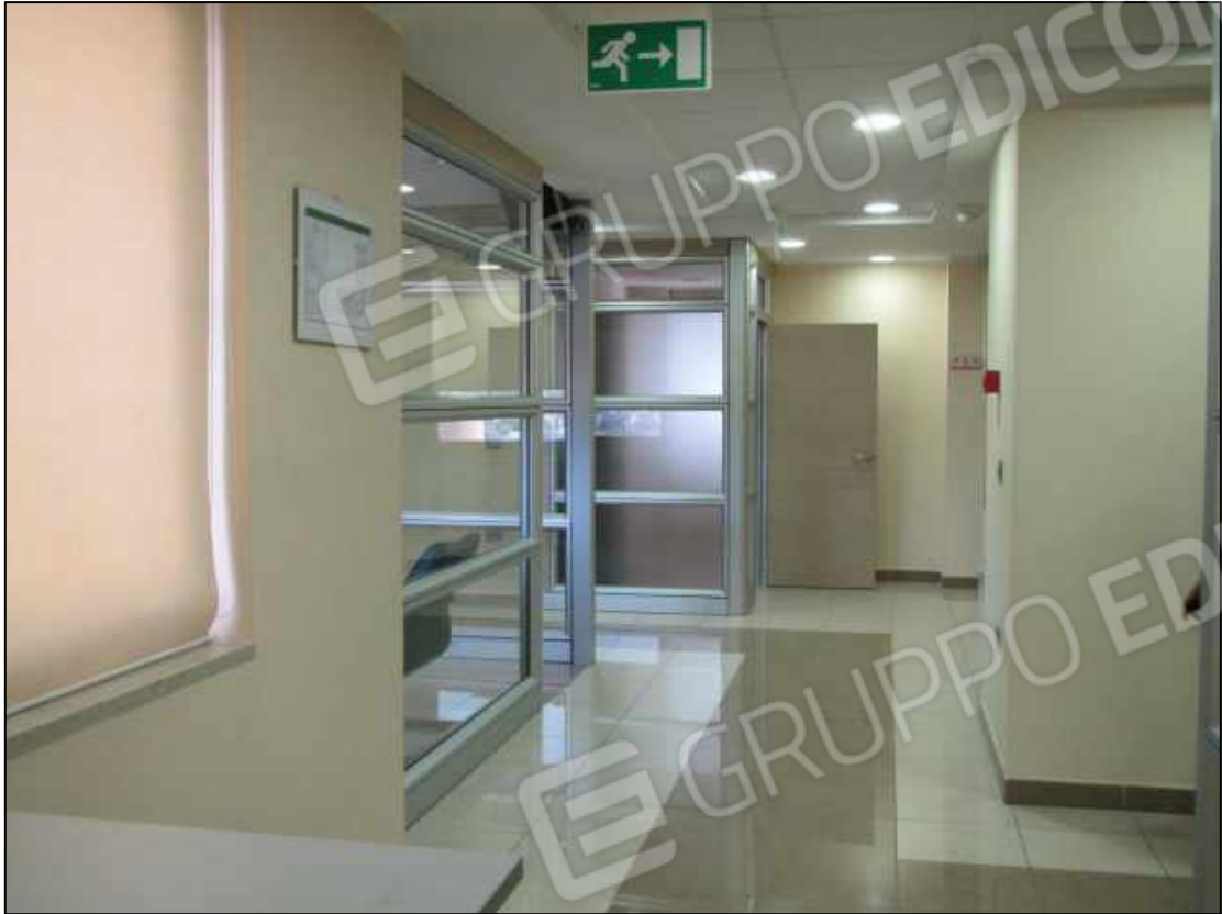
22. Ingresso, accettazione e sala attesa pazienti al secondo piano del Centro diagnostico G.B. Morgagni (fg. 101 p.lla 397 sub 34).