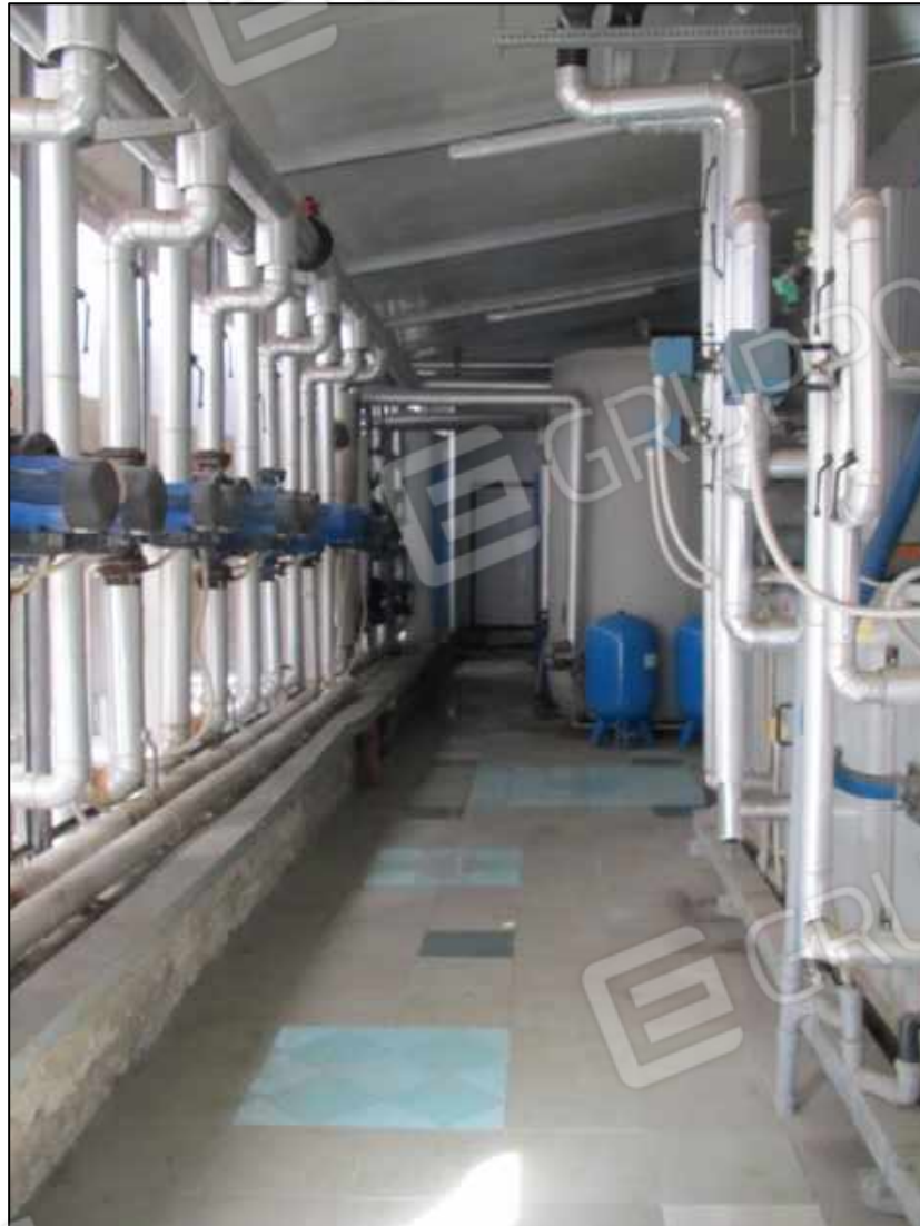
42. Macchinari a servizio del Centro diagnostico.