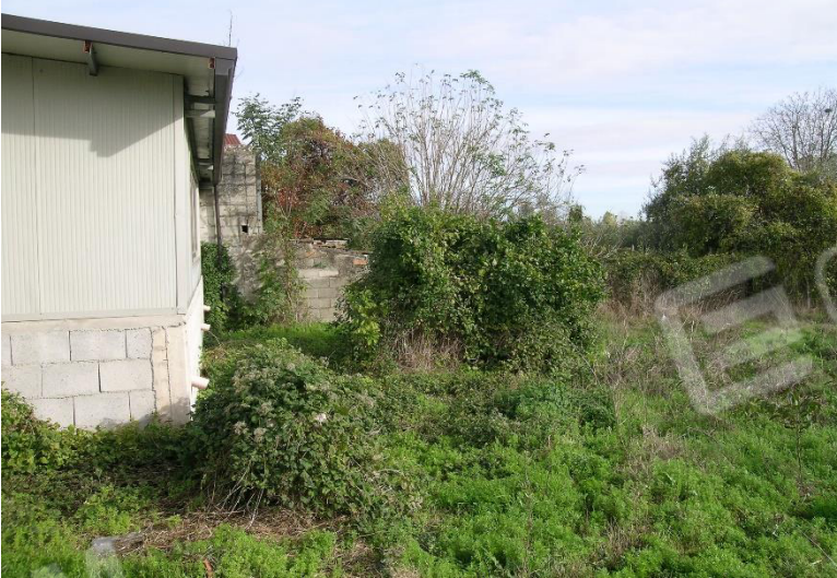
Foto 14 Corpo E Scorcio terreno Cat. Semin. Arbor foglio 23 Comune di Calvi (BN) p.la 715