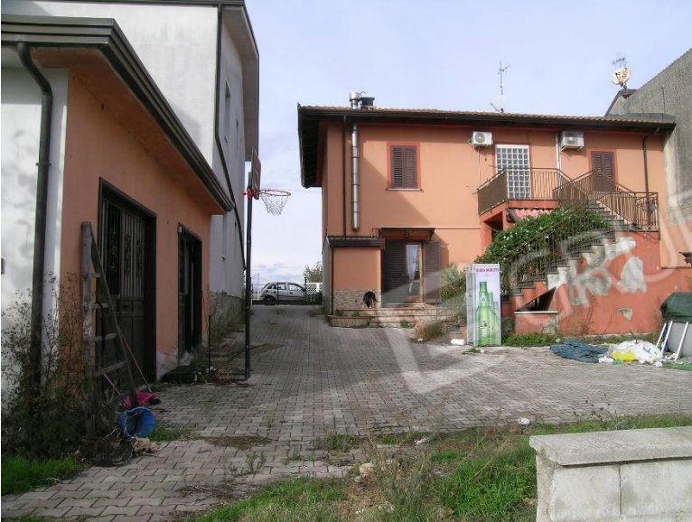
Foto 1 Corpo A Fabbricato pignorato foglio 23 Comune di Calvi (BN) p.lla 287 sub4 visto dalla corte antistante