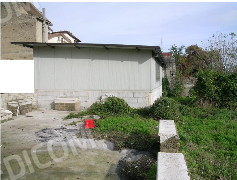
Foto 15 Manufatto ubicato sul Corpo E terreno Cat. Semin. Arbor foglio 23 Comune di Calvi (BN) p.la 715 Il manufatto non è riportato nella planimetria catastale e non assentito da alcun titolo abilitativo