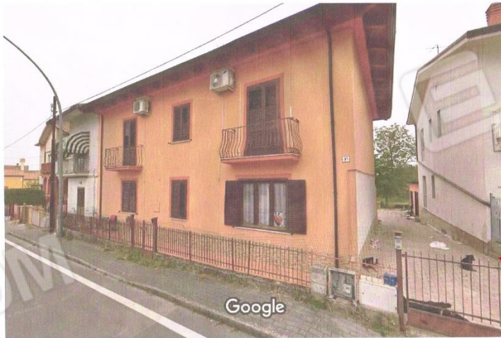
Foto 2 Corpo A Fabbricato pignorato foglio 23 Comune di Calvi (BN) p.lla 287 sub4 visto da Via La Frazia