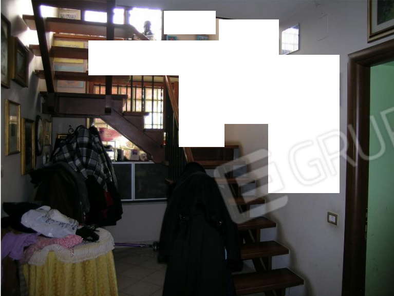
Foto 4 Interni Corpo A : disimpegno e scala piano terra che immette al piano primo