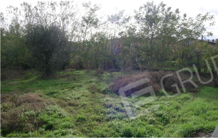
Foto 13 Corpo D Scorcio terreno Cat. Semin. Arbor foglio 23 Comune di Calvi (BN) p.lla 714