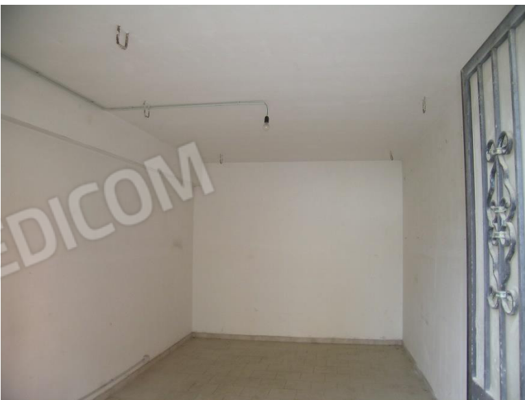
Foto 12 Interno corpo C Garage cat. C/6 foglio 23 Comune di Calvi (BN) p.lla 69 sub 7