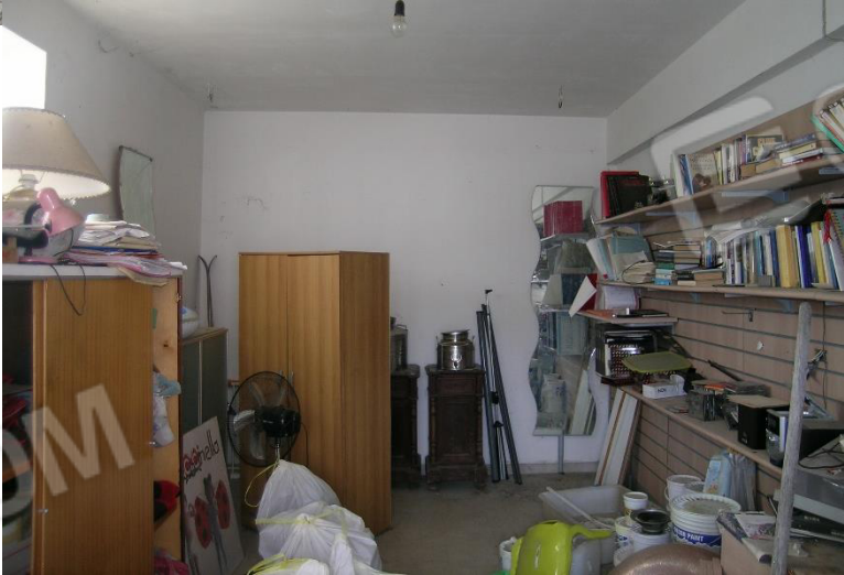
Foto 11 Interno corpo B Garage cat. C/6 foglio 23 Comune di Calvi (BN) p.lla 69 sub 8

Corpo C Garage cat C/6 foglio 23 Comune di Calvi (BN) p.lla 69 sub7