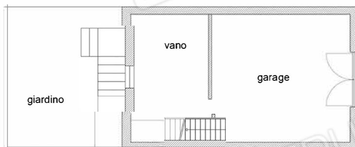
PIANTA PIANO TERRA