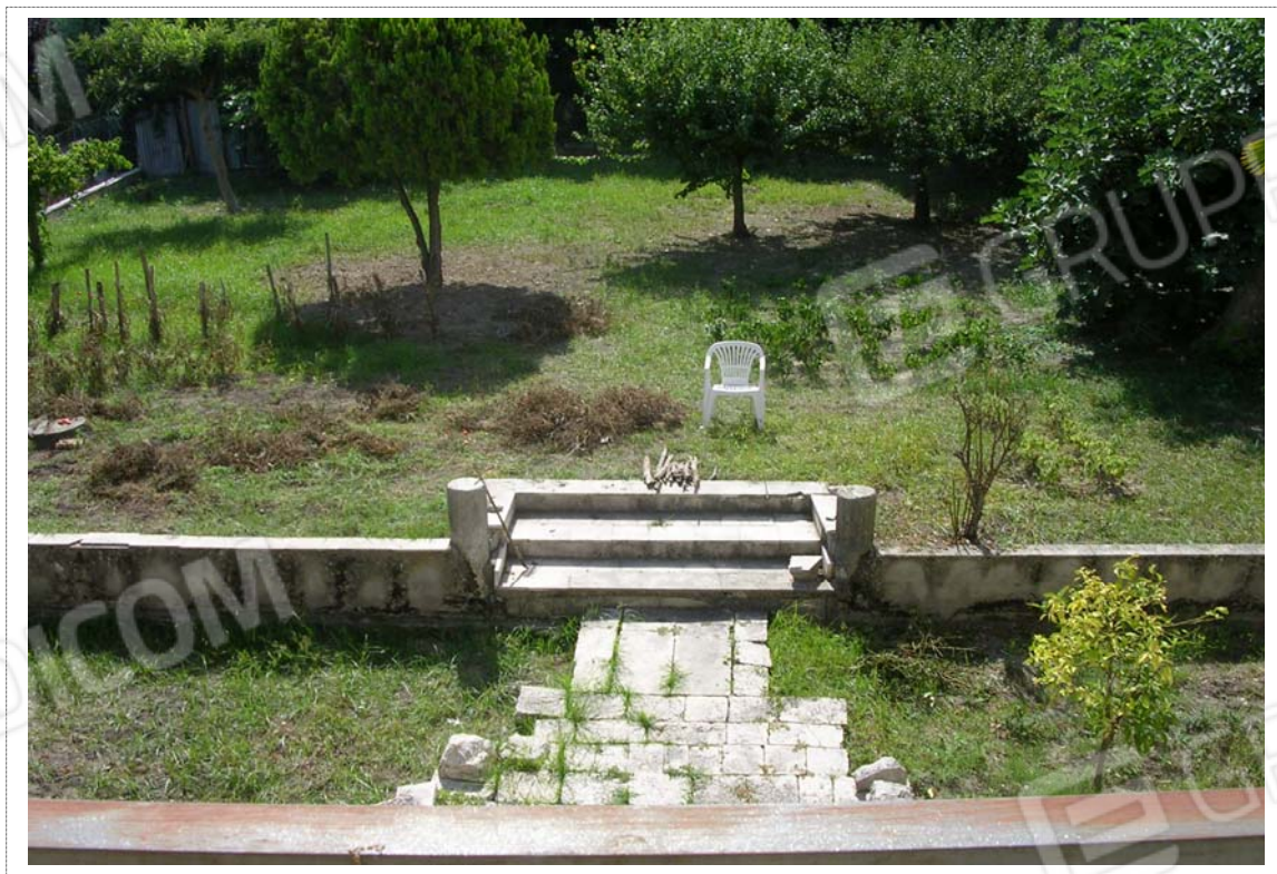
Foto n°64: Vista Terreno Fig. 23 p.lla 451 - 450;