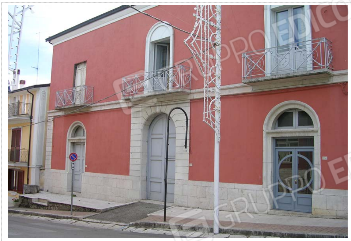
Foto n°1: Ingresso principale appartamento Fig. 23 p.lla 304/3-4;