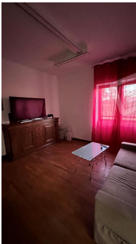
Foto 6 - Soggiorno