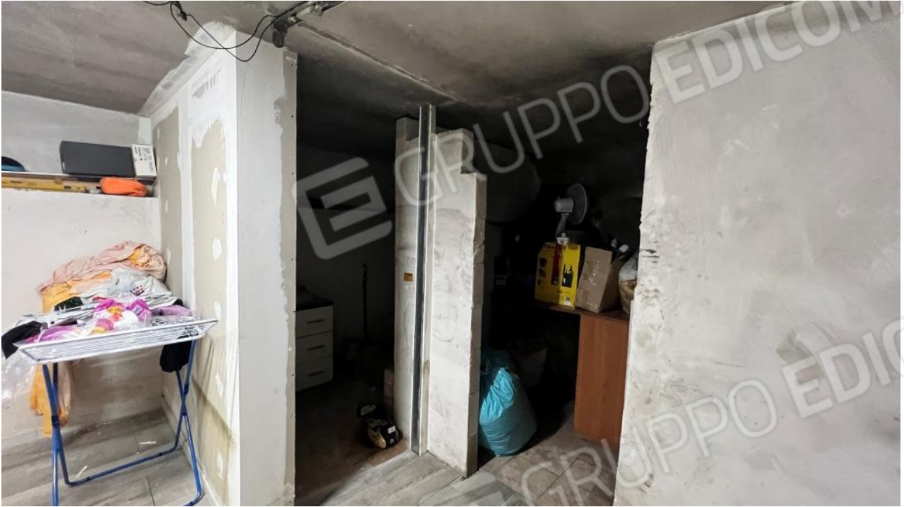
Foto 21 – Tramezzi di divisione nel secondo vano del piano interrato