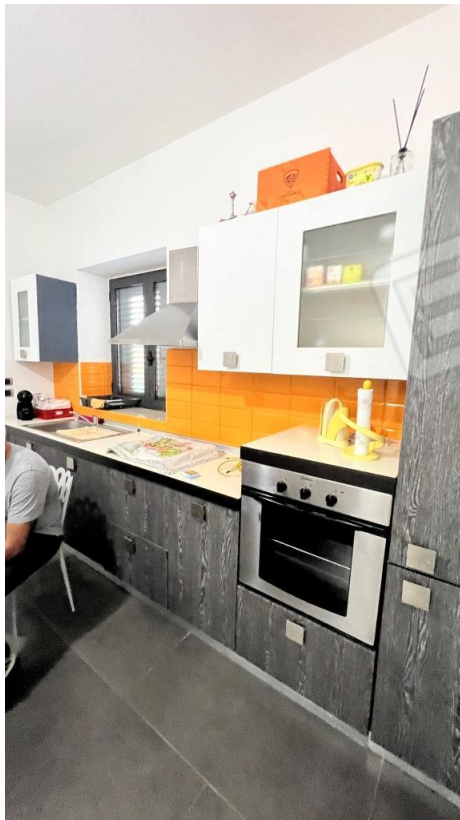
Foto 8 - Cucina