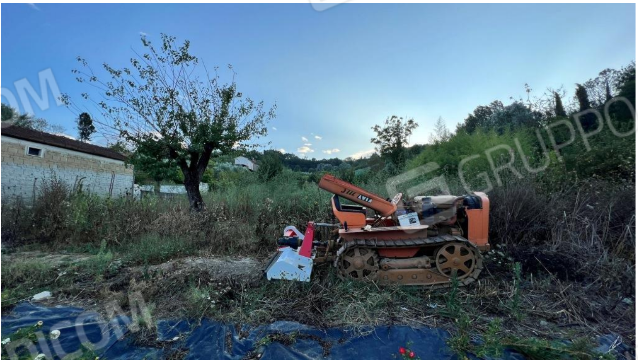
Foto 22 – Vista dell'area della particella restante nella parte posteriore dell'abitazione