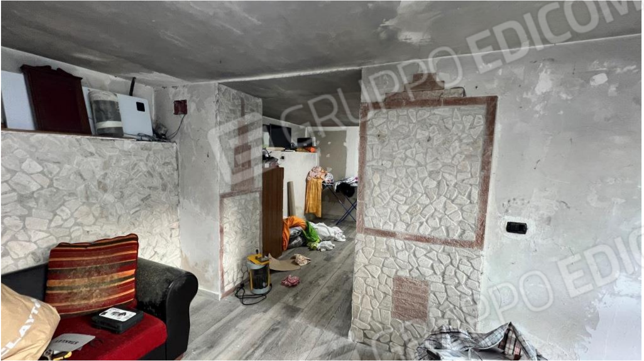
Foto 19 – Apertura interna nel vano d'ingresso per accesso ad altro vano