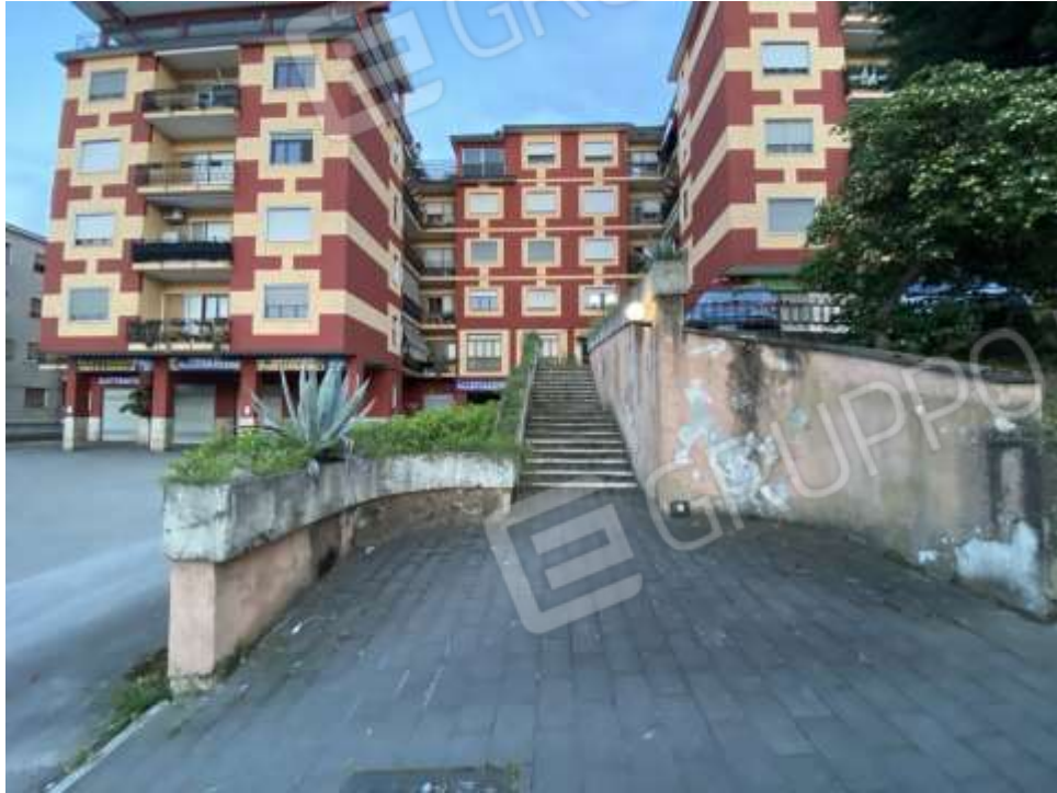
Foto n. 1 ingresso