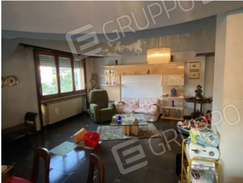
FOTO N. 7 SALONE