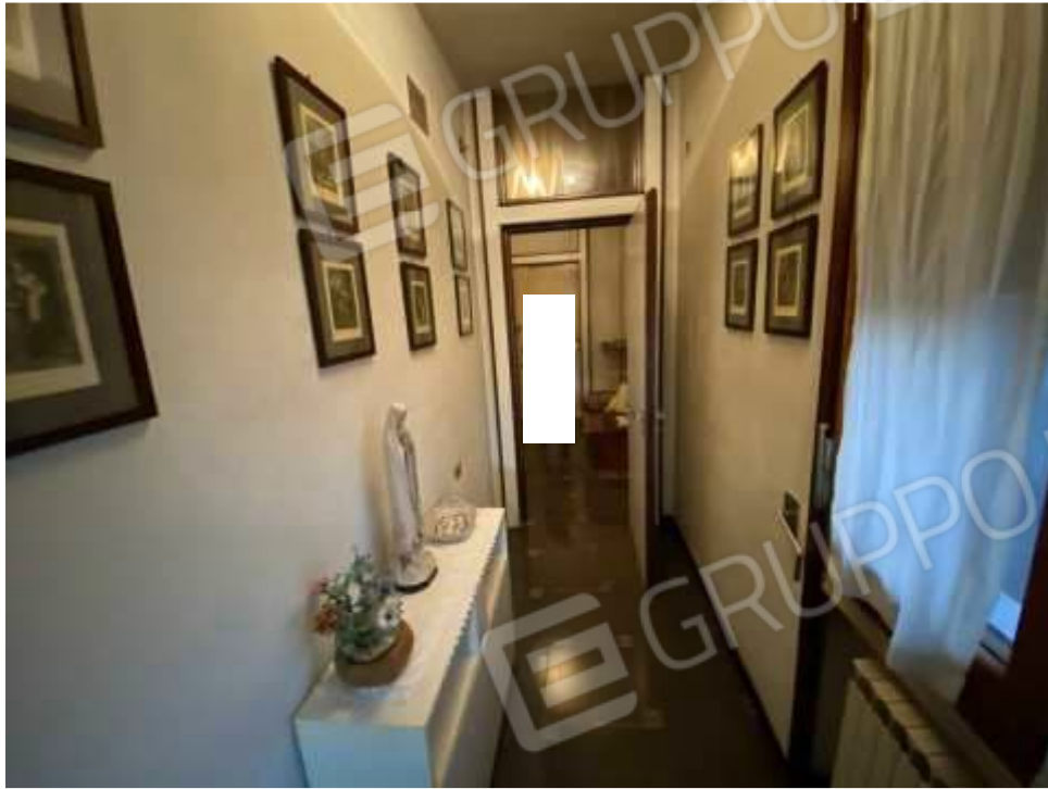
FOTO N. 3 Ingresso appartamento