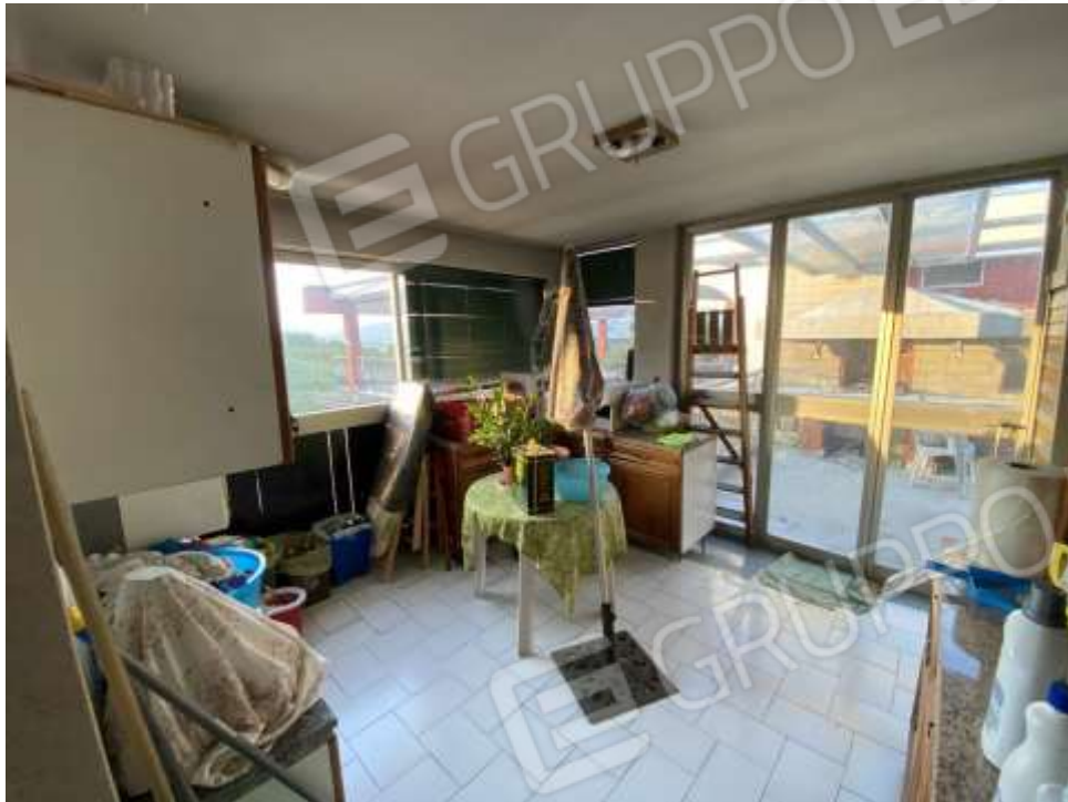
FOTO N. 9 VERANDA