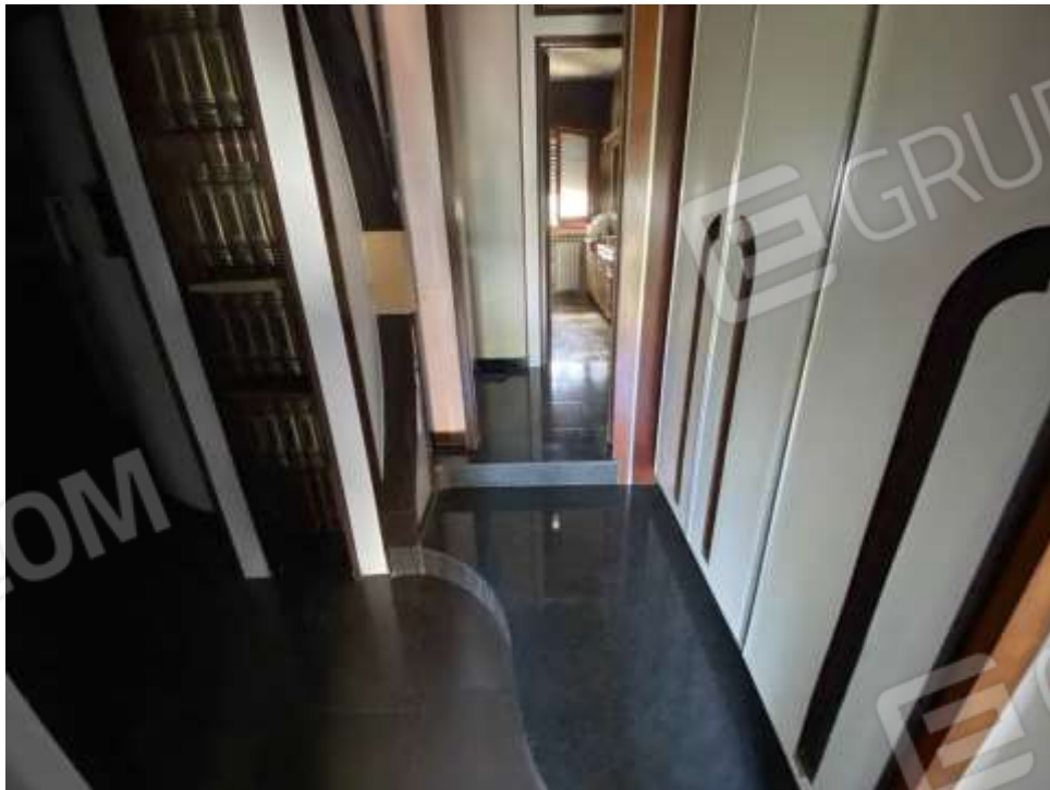
FOTO N. 10 CORRIDOIO