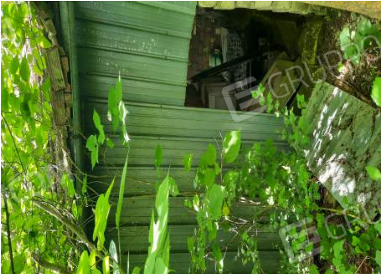
MANUFATTO FATISCENTE ADIACENTE ALL'IMMOBILE OGGETTO DI ESECUZIONE (NON OGGETTO DI VALUTAZIONE)