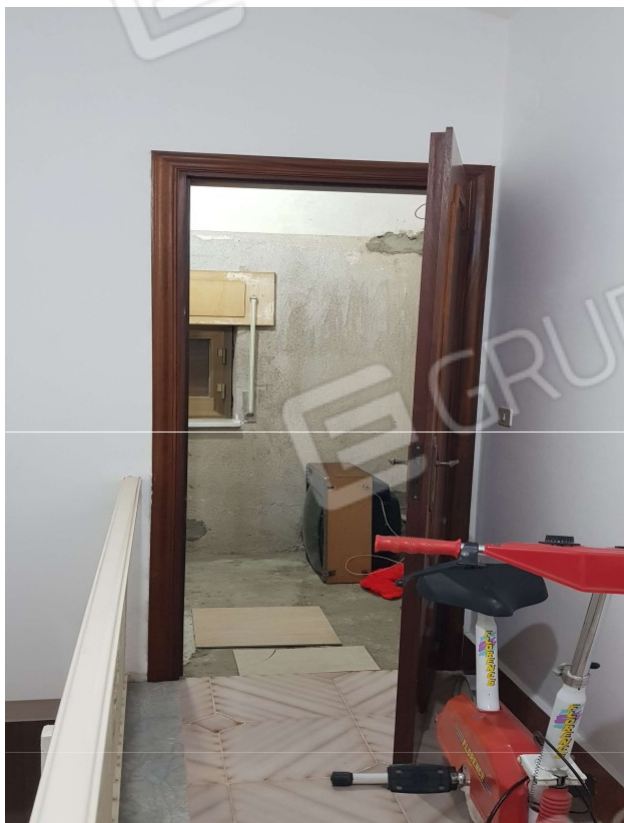
Piano Primo (sub 2) WC 1 FOTO 7