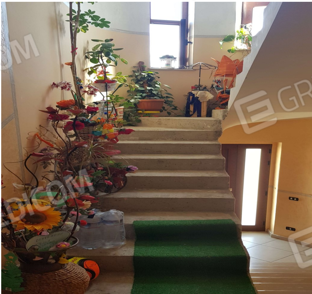
Piano terra (sub 2) vano scala