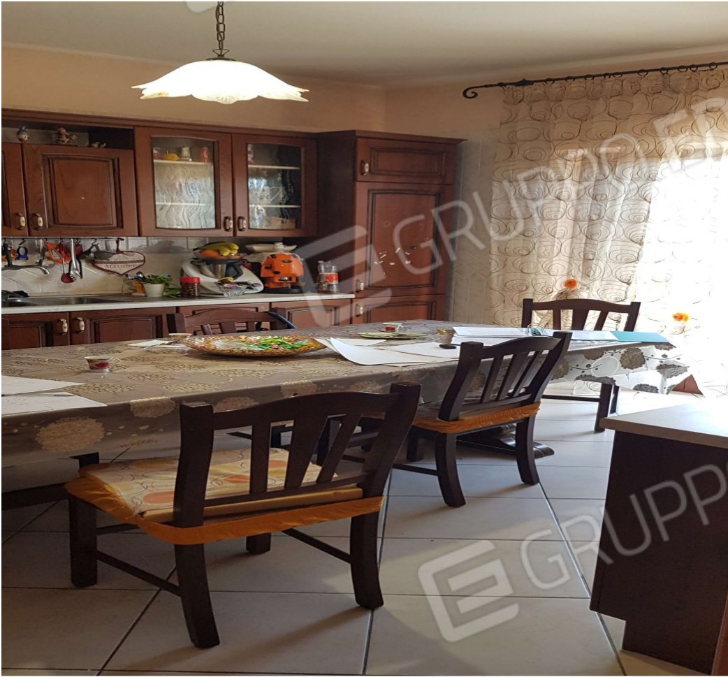
Piano terra (sub 2) Cucina