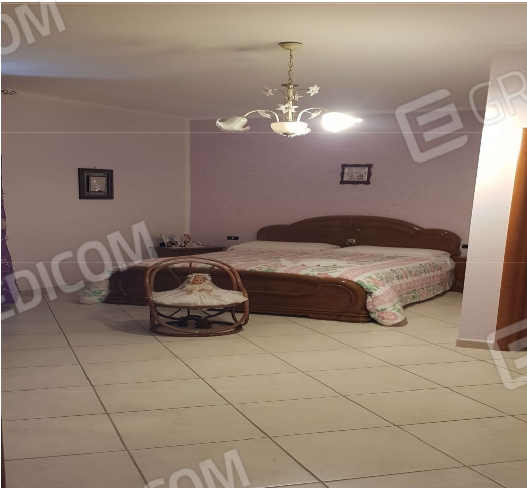
Piano terra (sub 2) Vano 5