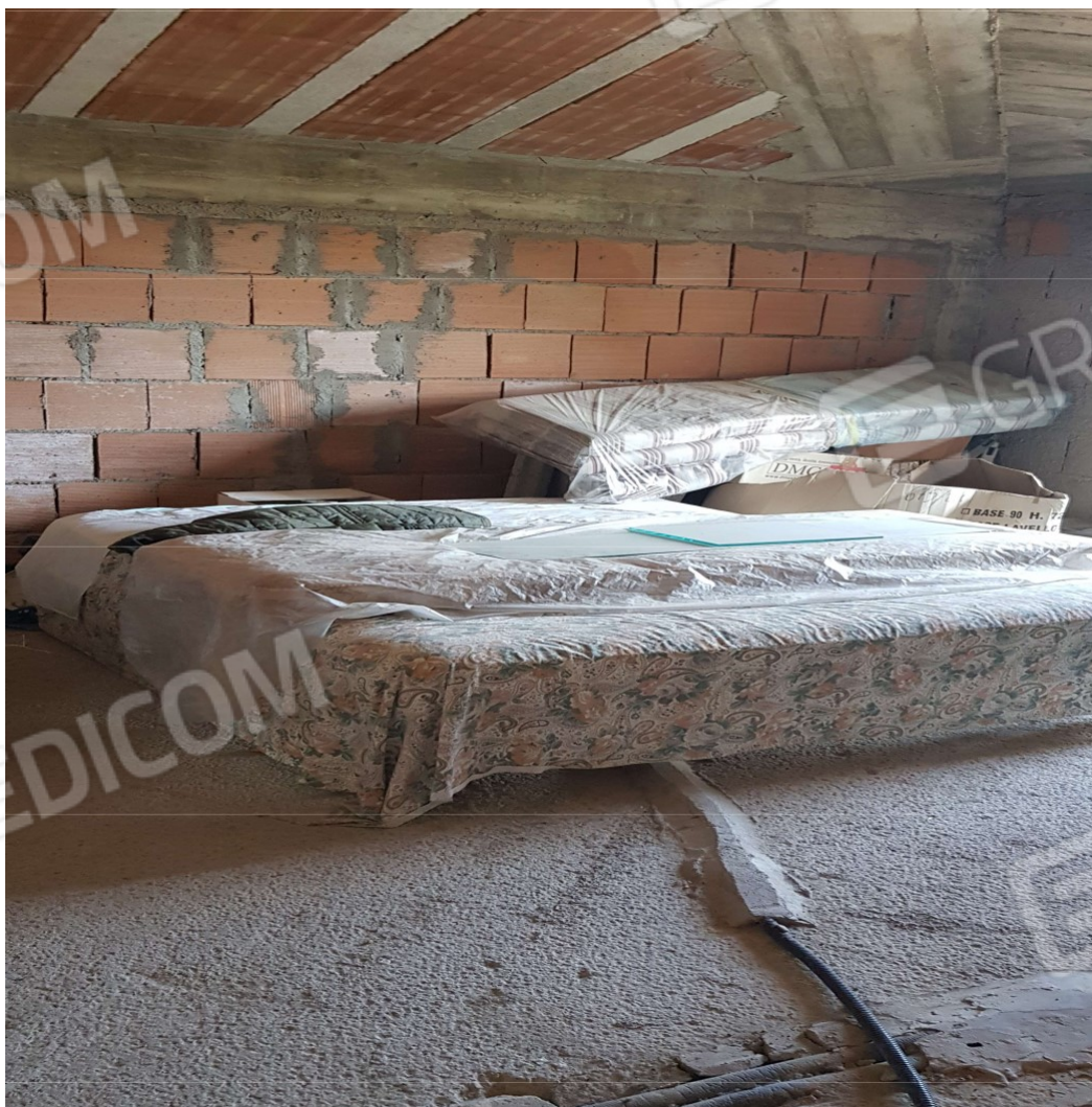
Piano Primo (sub 2) vano deposito 3