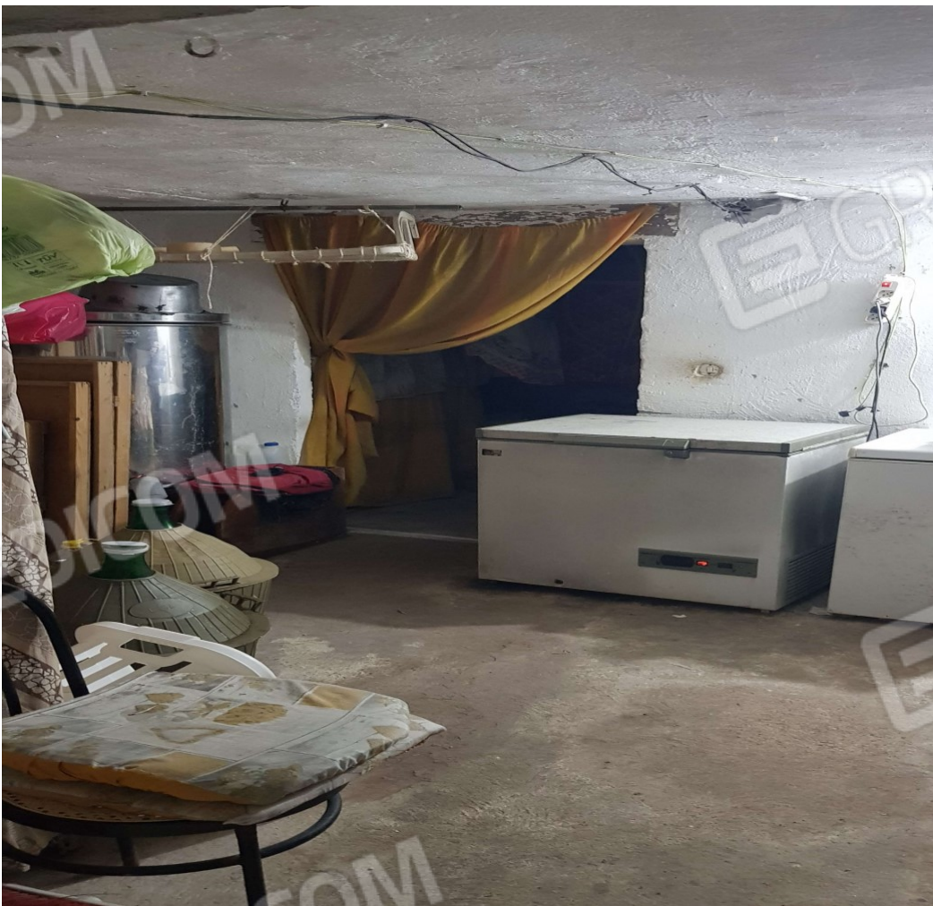
Deposito 2 FOTO 11