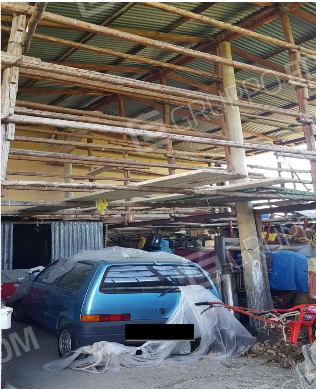
Tettoia sub 4