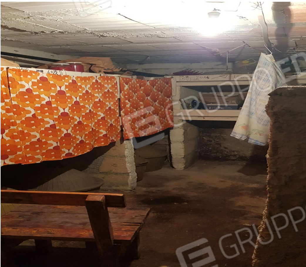
Lotto 1- Paduli (BN) DEPOSITI Fig. 19 p.lla 422 sub 3 Deposito 1