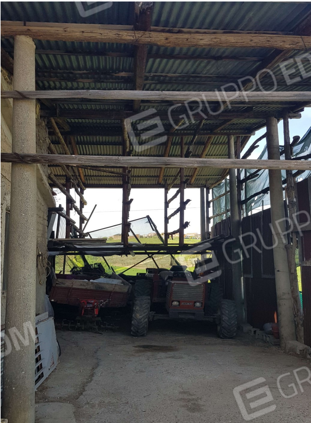
Tettoia sub 4