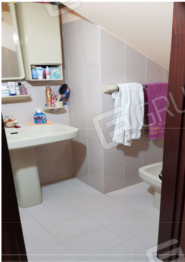
Piano terra (WC 1)