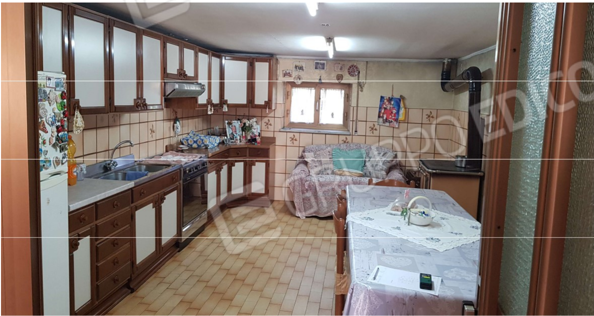
Deposito 4 adibito a cucina