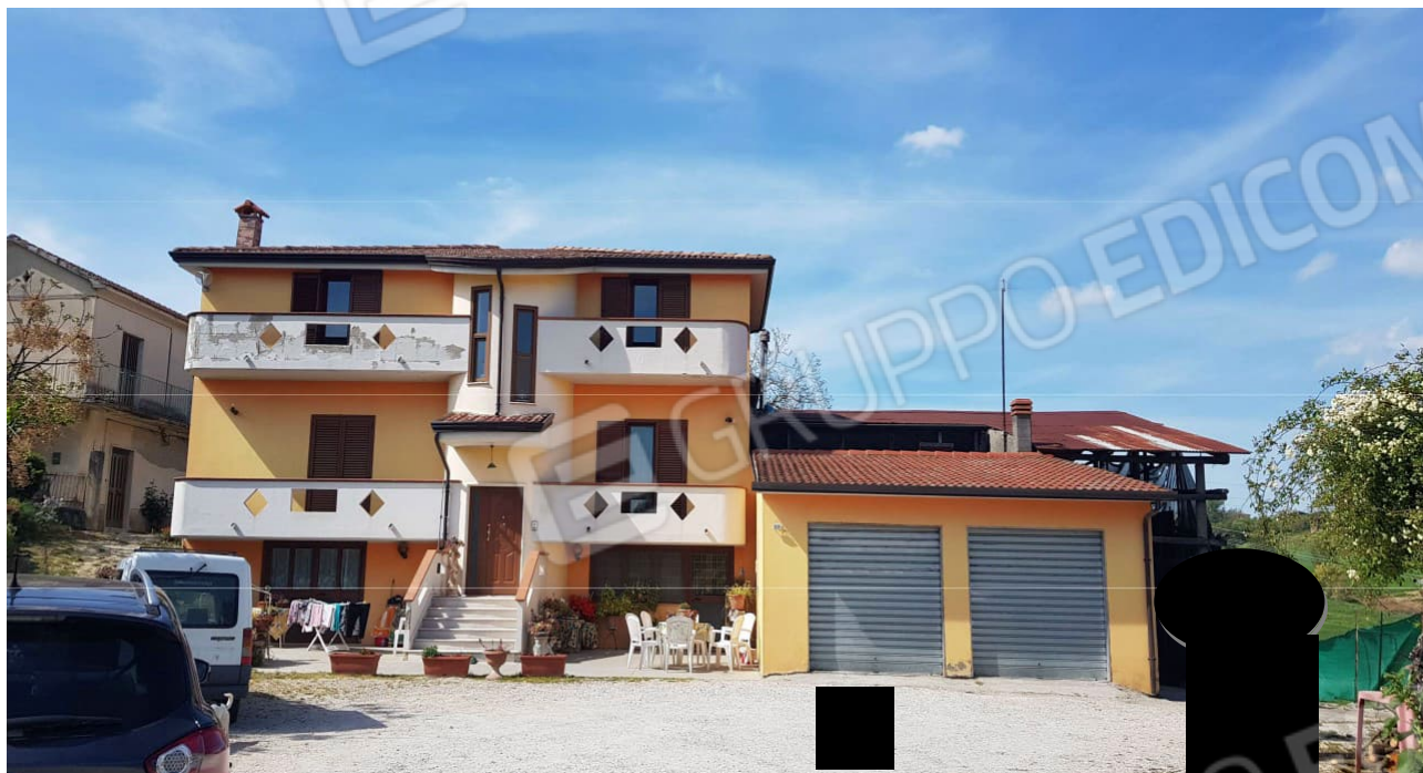
Prospetto Principale su Strada 90BIS