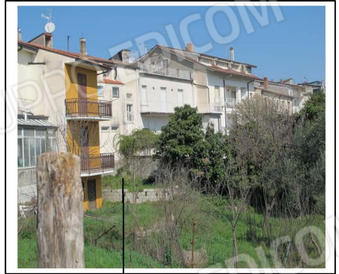
LOTTO 3 - Part.IIa 469