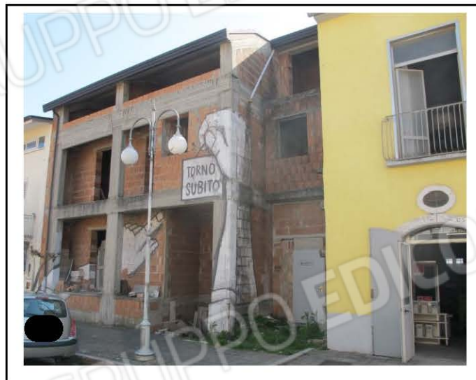
PROSPETTO PRINCIPALE – via ROMA