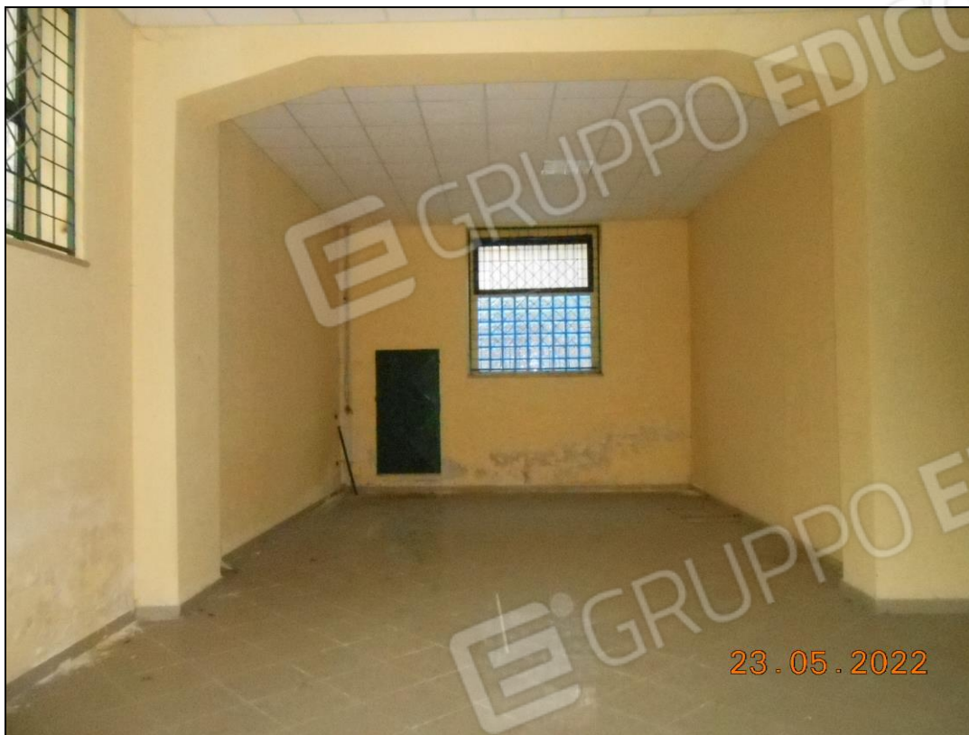
FOTO N. 15 Vista interna a P.T. dell'immobile. Si notano macchie d'umidità di risalita sulle pareti.