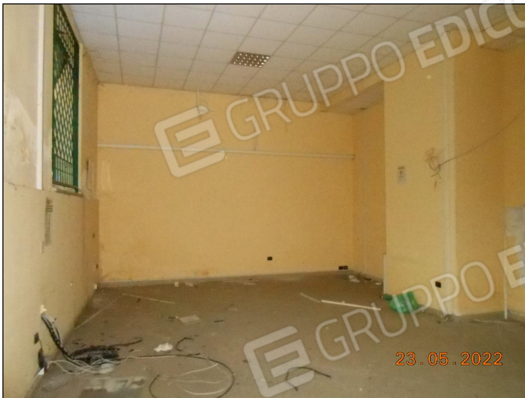
FOTO N. 21 Vista interna dei locali dell'immobile. Si notano i cavi elettrici sfilati dalle tubazioni.