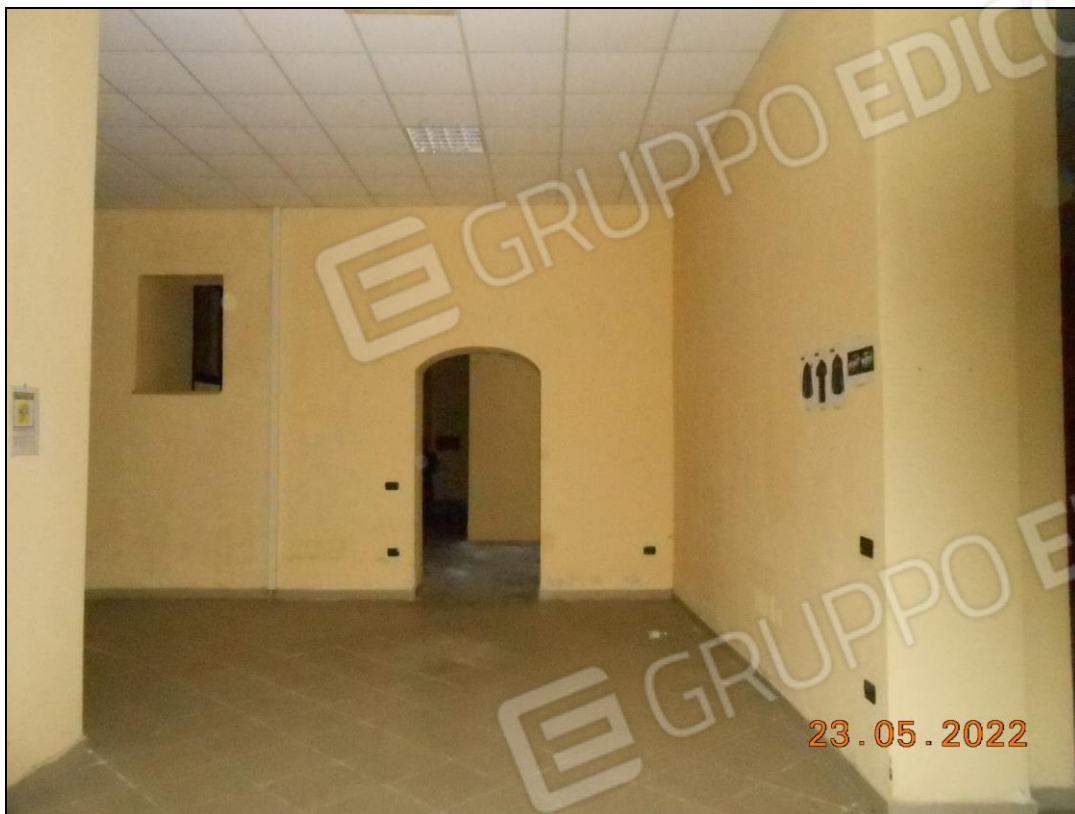
FOTO N. 17 Vista interna dei locali dell'immobile.