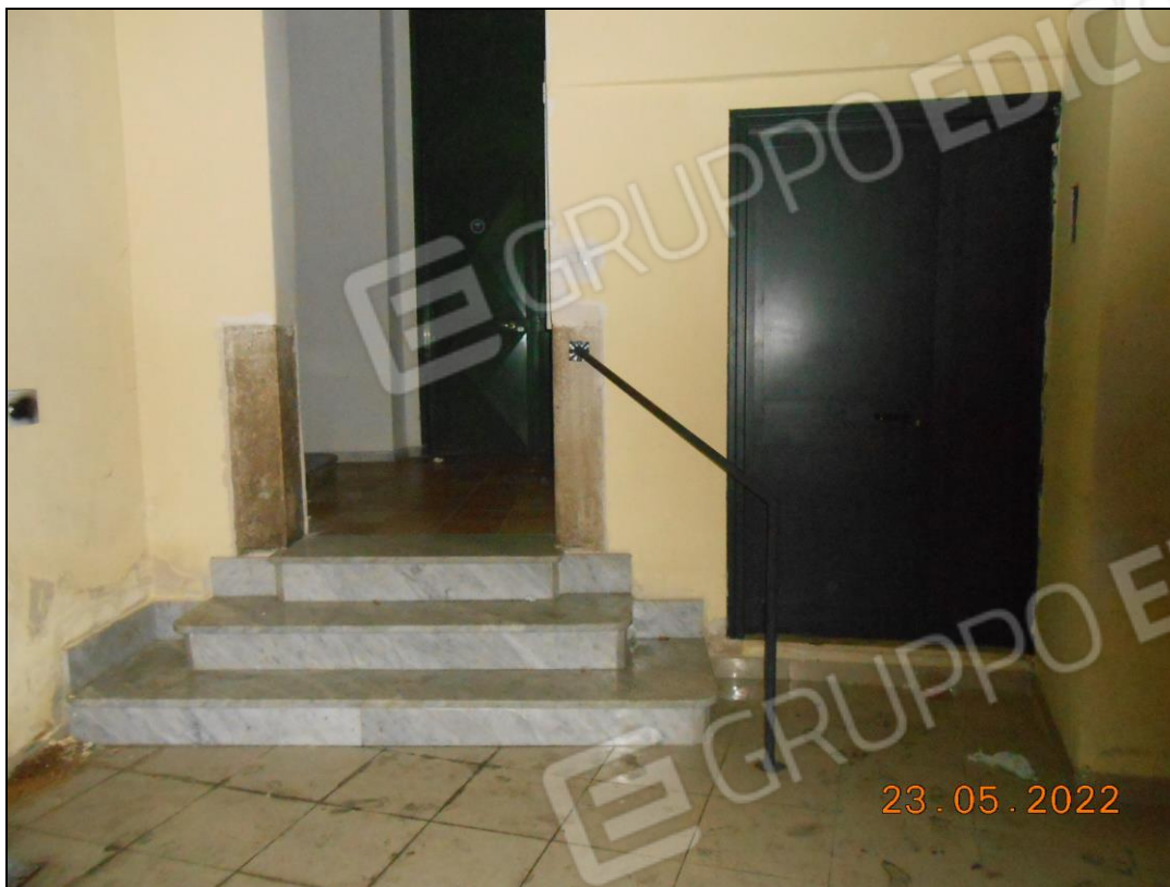
FOTO N. 11 Vista accesso alla scala condominiale.