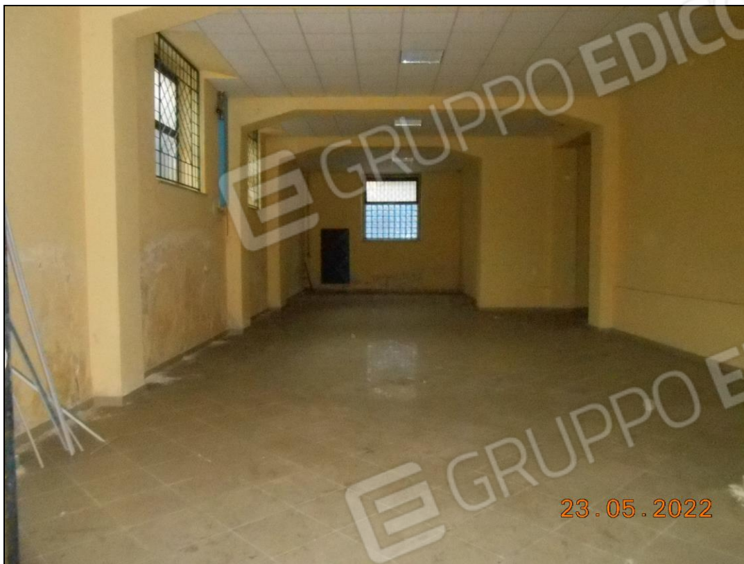
FOTO N. 13 Vista interna dei locali posteriori dell'immobile.