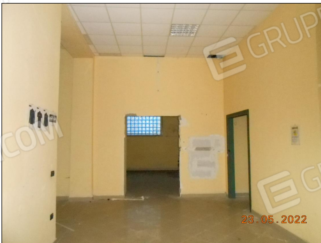
FOTO N. 18 Vista interna dei locali dell'immobile.