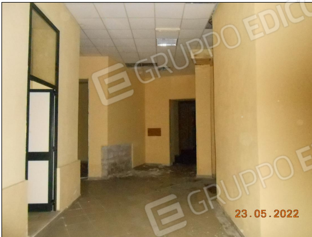
FOTO N. 31 Vista interna dei locali dell'immobile.