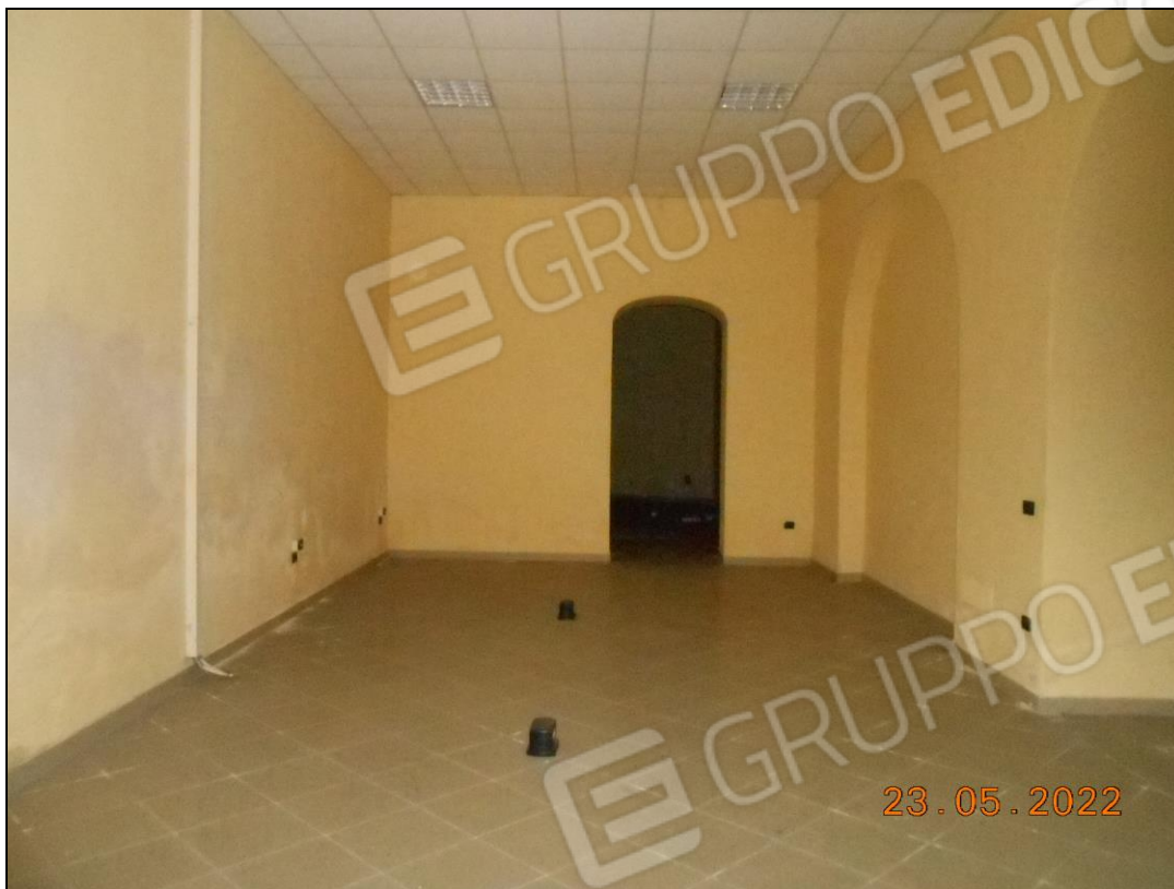
FOTO N. 25 Vista interna dei locali dell'immobile.