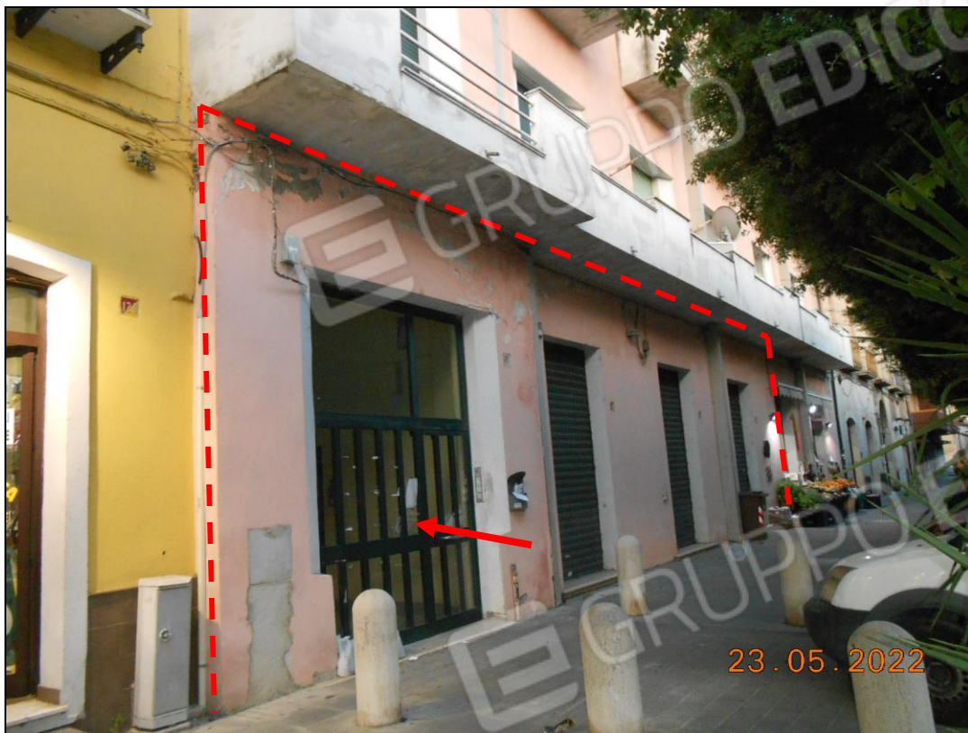
FOTO N. 01 Vista della porzione dell'immobile pignorato, contenuta nel tratteggio in rosso. Si nota l'androne di accesso.