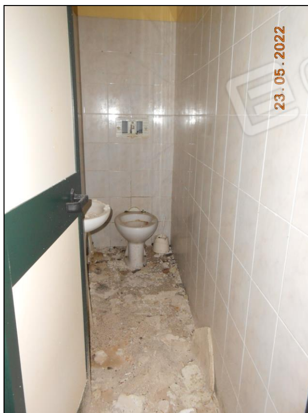
FOTO N. 36 Vista dei w.c.. Si nota lo stato di degrado.