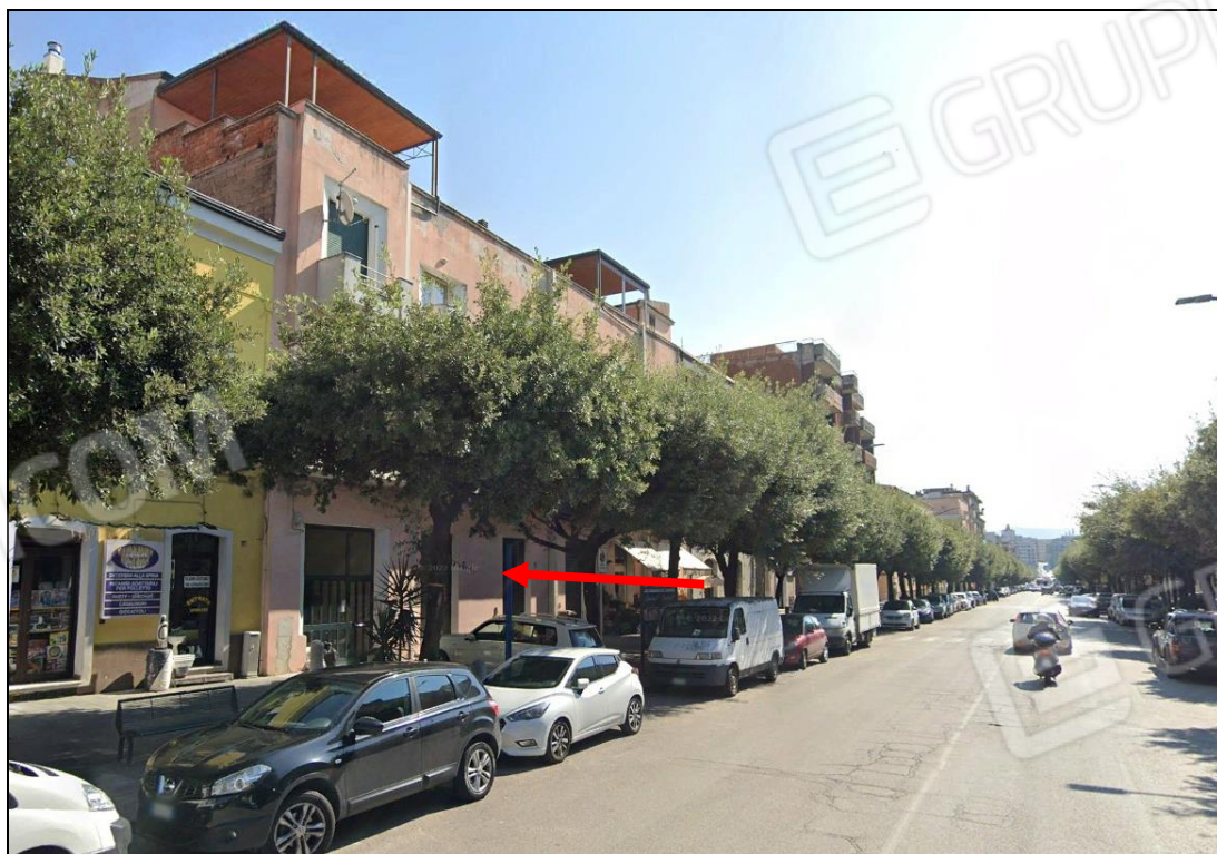
FOTO N. 04 Vista dell'immobile pignorato a piano terra del fabbricato.