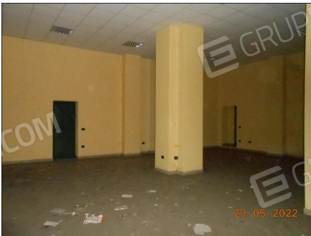
FOTO N. 48 Vista interna dell'immobile, locale prospiciente su viale Principe di Napoli.