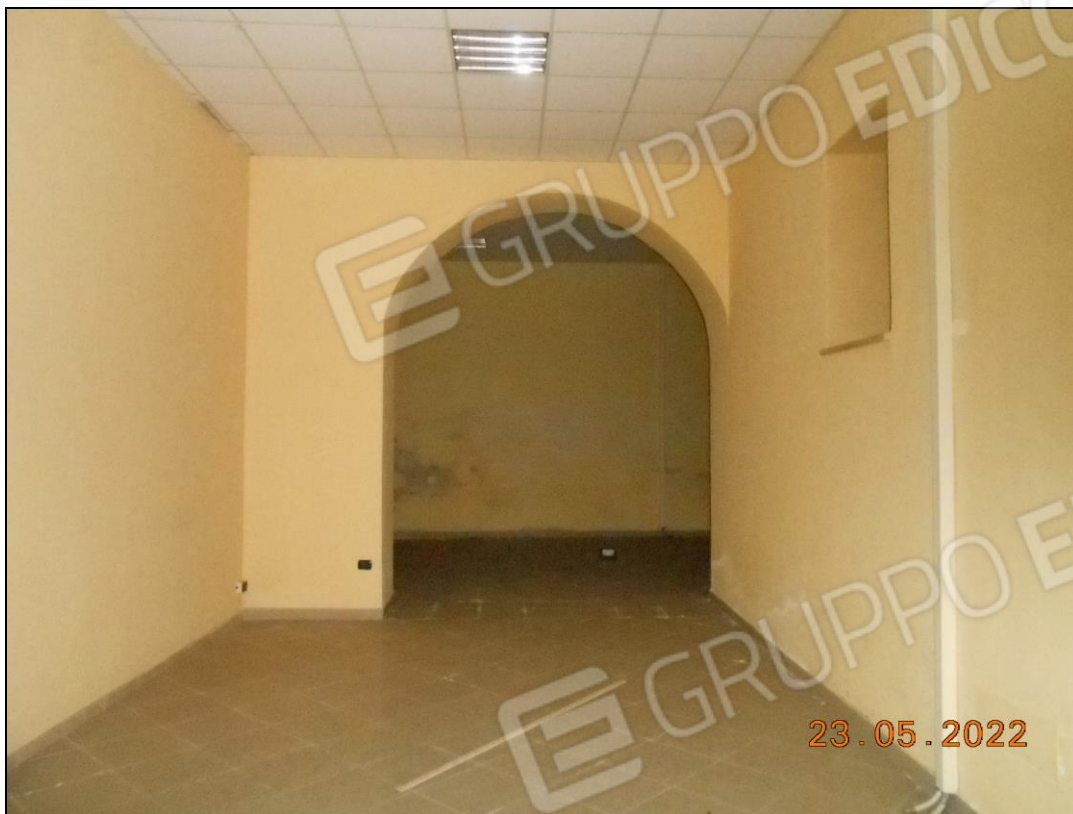
FOTO N. 19 Vista interna dei locali dell'immobile.