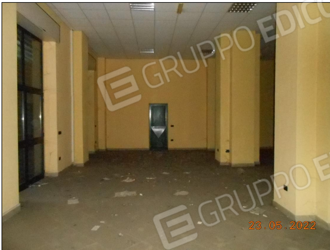
FOTO N. 47 Vista interna dell'immobile, locale prospiciente su viale Principe di Napoli.