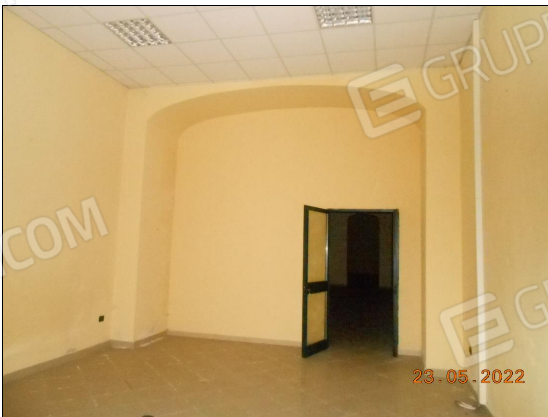
FOTO N. 28 Vista interna dei locali dell'immobile.