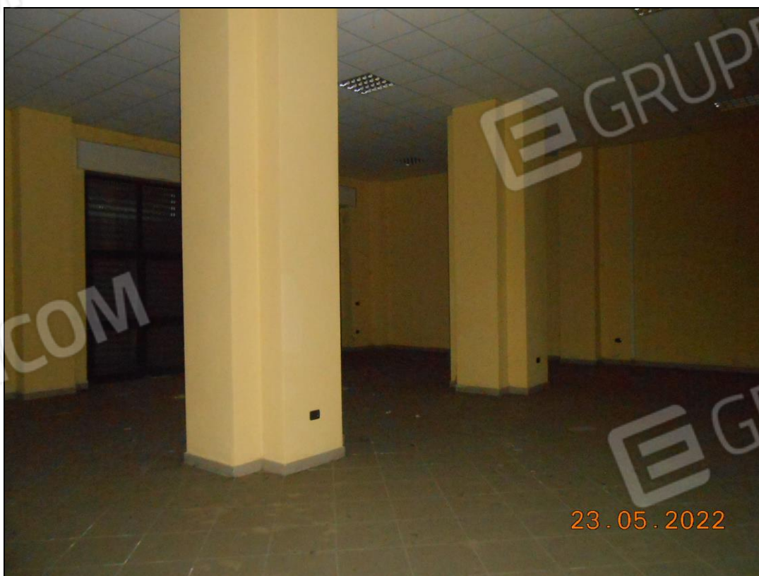
FOTO N. 46 Vista interna dell'immobile, locale prospiciente su viale Principe di Napoli.