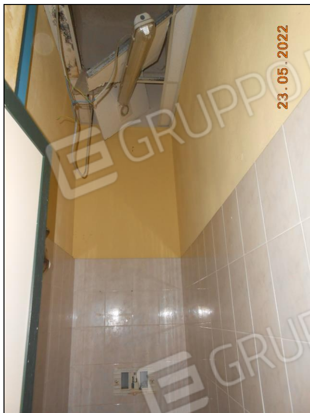
FOTO N. 37 Vista interna dell'immobile. Si nota la controsoffittatura sfondata.