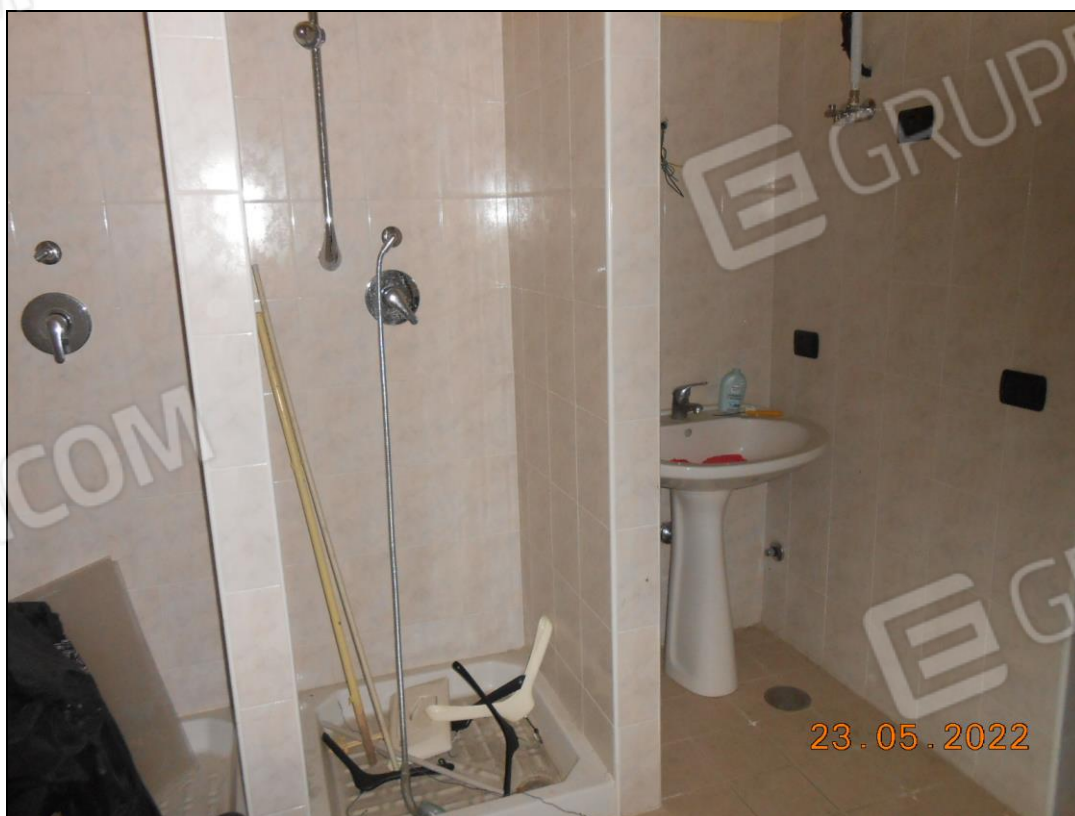
FOTO N. 34 Vista interna dei locali dell'immobile.