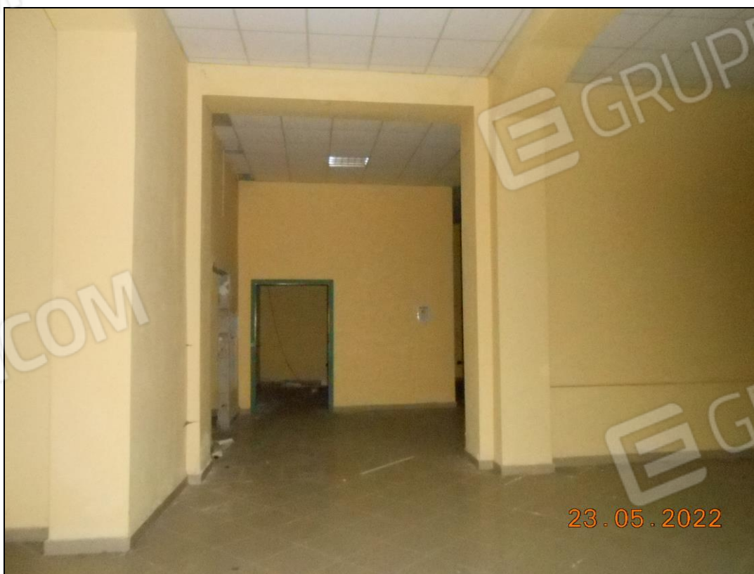
FOTO N. 16 Vista interna dei locali dell'immobile.