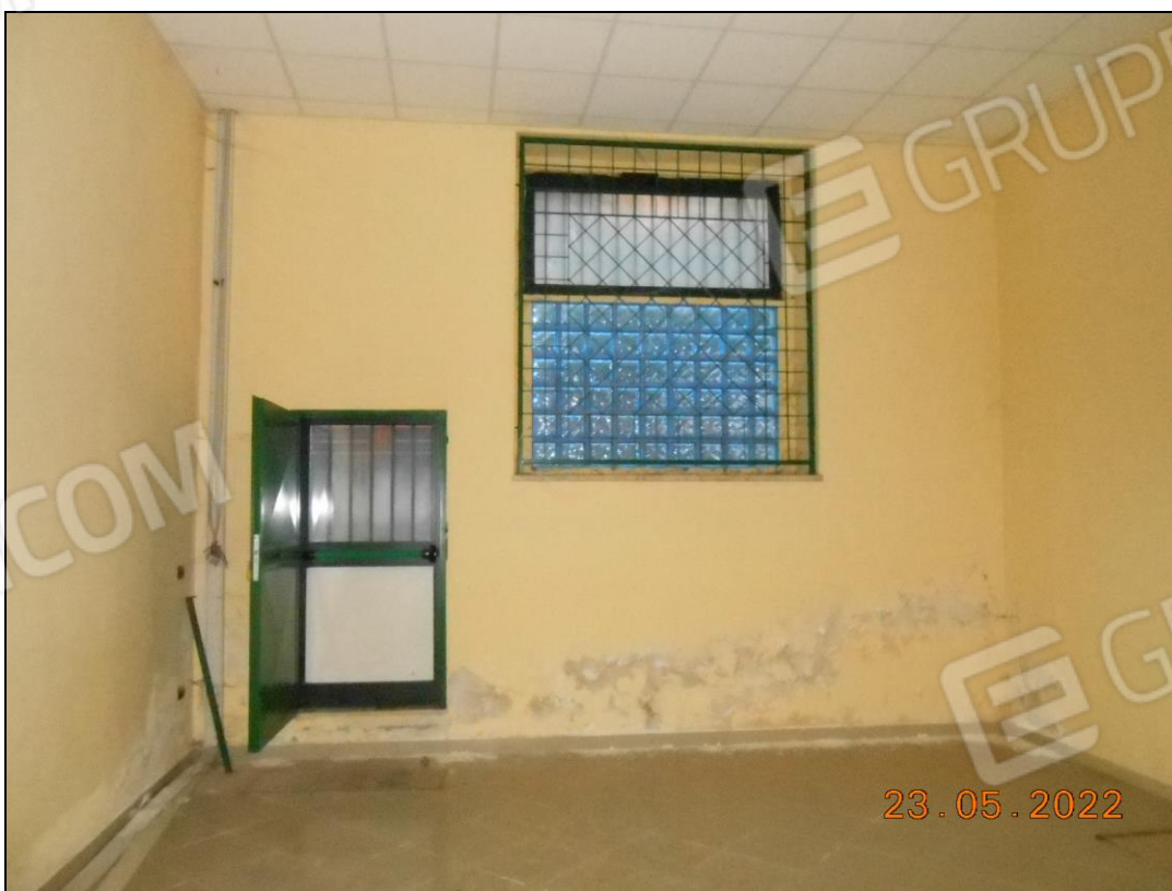
FOTO N. 50 Vista interna dell'immobile. Si nota la porta di uscita sulla corte comune p.lla 316.