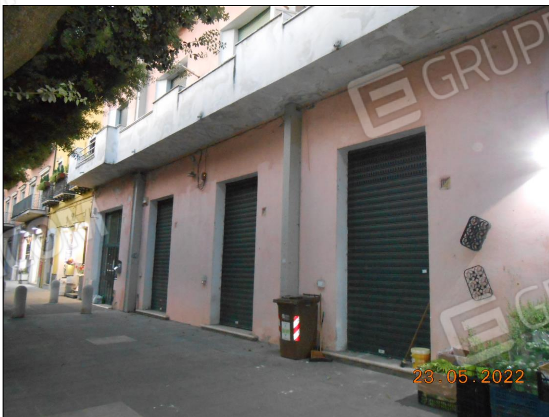
FOTO N. 02 Vista della porzione dell'immobile pignorato su viale Principe di Napoli.