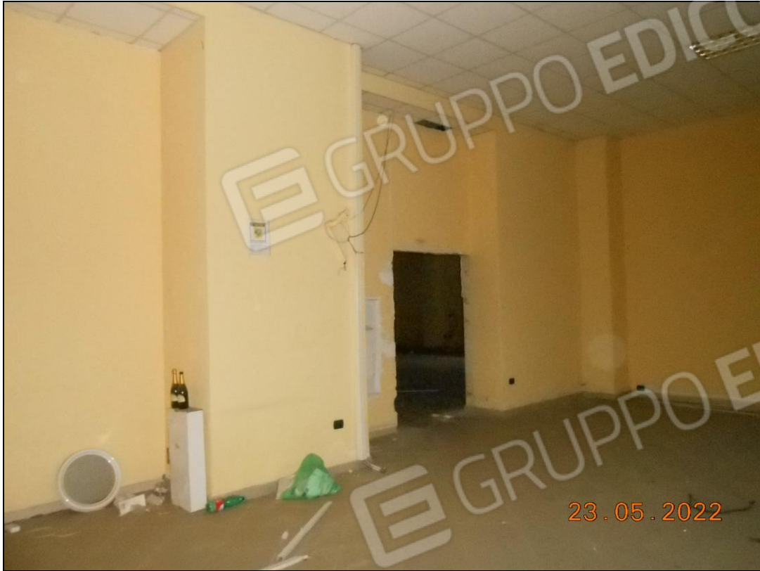
FOTO N. 23 Vista interna dei locali dell'immobile.