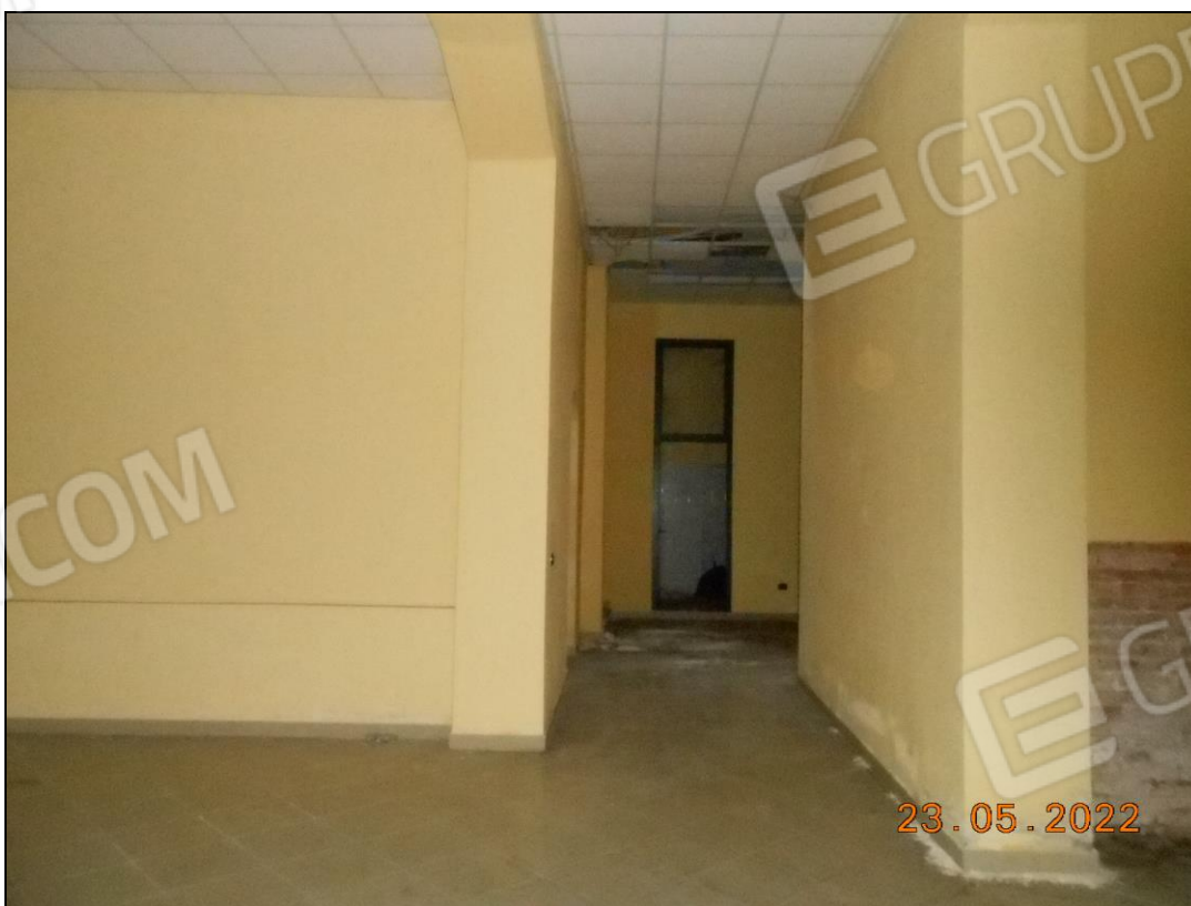
FOTO N. 14 Vista interna dei locali posteriori dell'immobile.