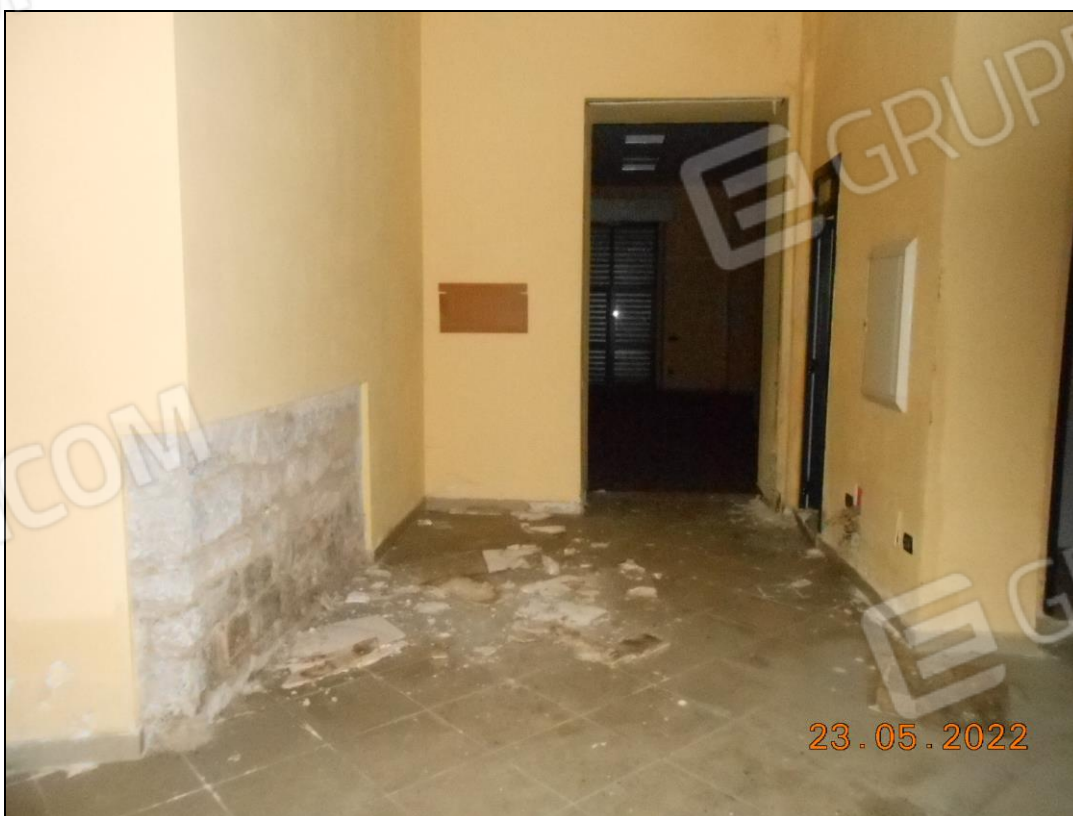
FOTO N. 44 Vista interna dell'immobile. Si notano materiali sul pavimento.