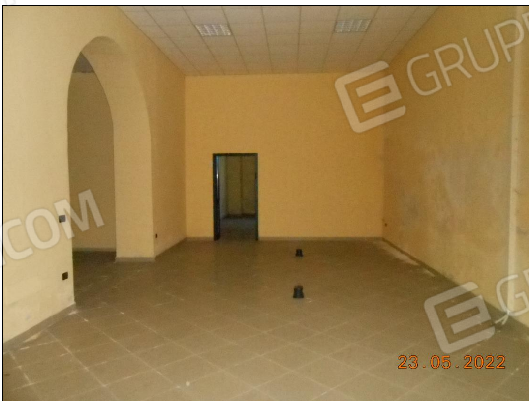
FOTO N. 26 Vista interna dei locali dell'immobile.