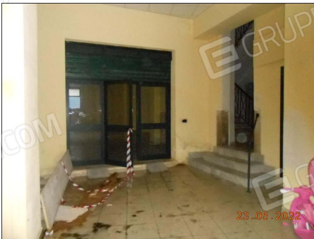
FOTO N. 10 Vista interna dell'androne. Si nota sulla destra l'accesso alla scala condominiale.