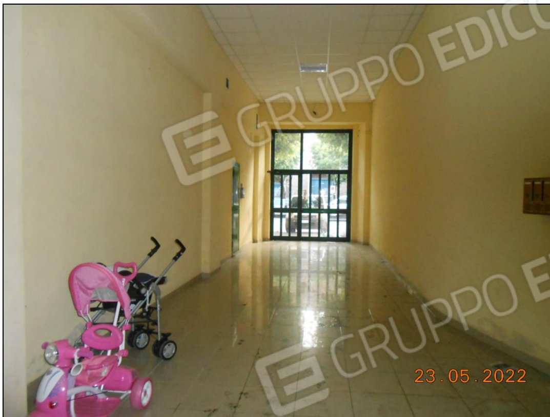
FOTO N. 07 Vista interna androne dell'immobile.