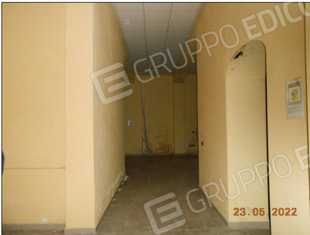
FOTO N. 29 Vista interna dei locali dell'immobile.