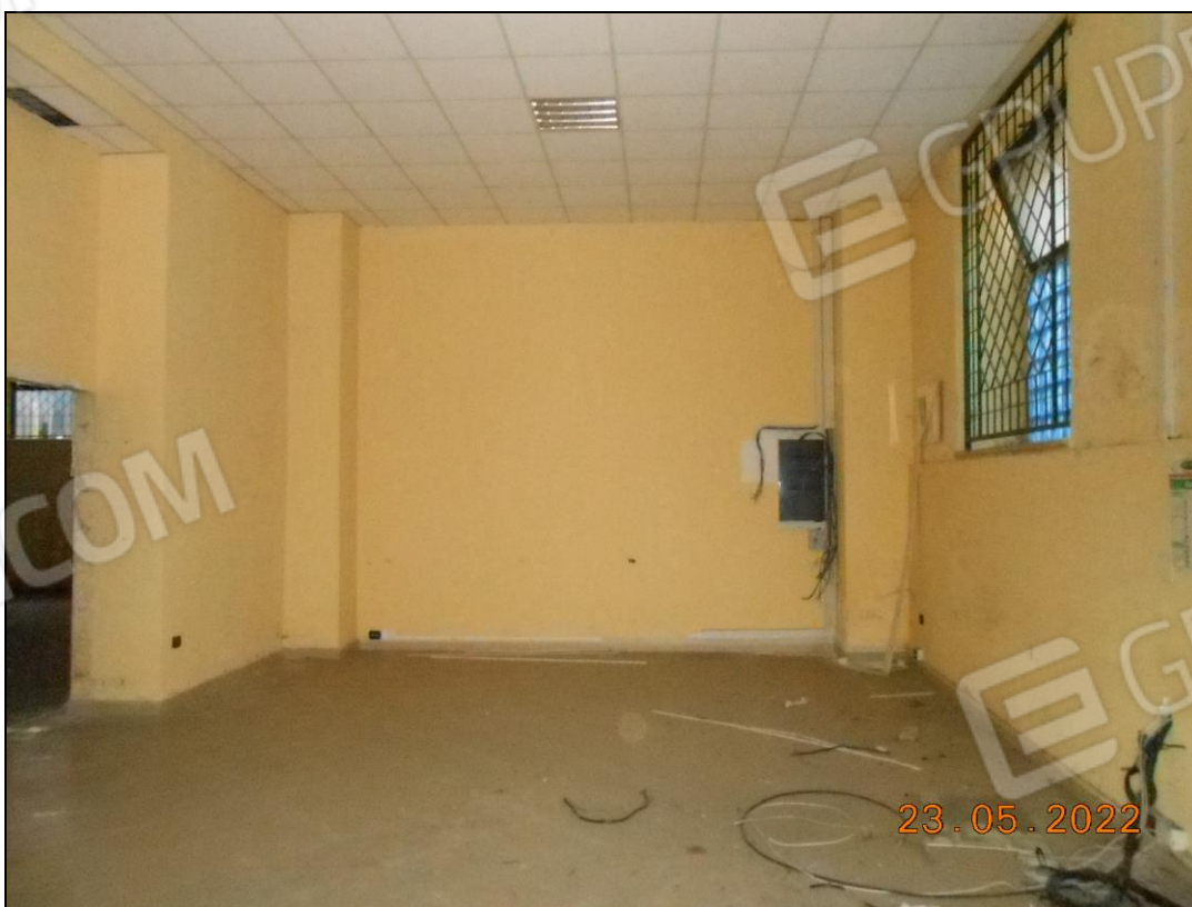
FOTO N. 22 Vista interna dei locali dell'immobile.