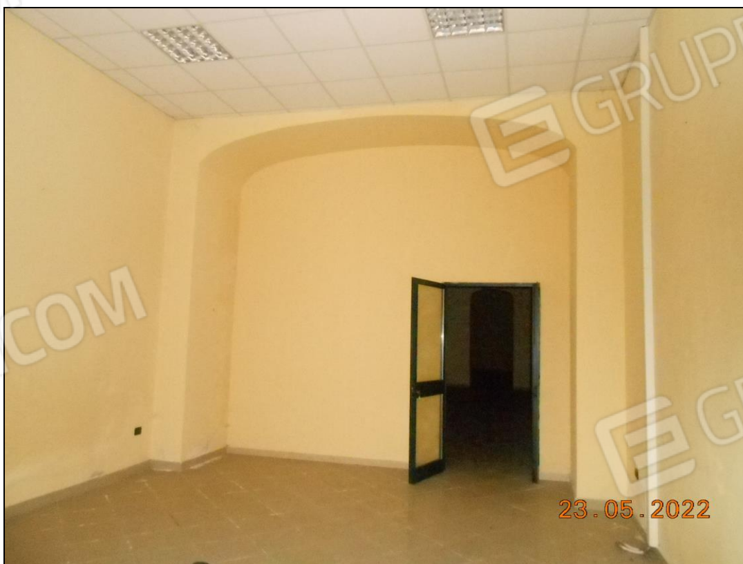
FOTO N. 42 Vista interna dell'immobile.