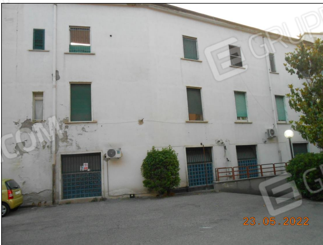
FOTO N. 52 Vista posteriore del fabbricato.