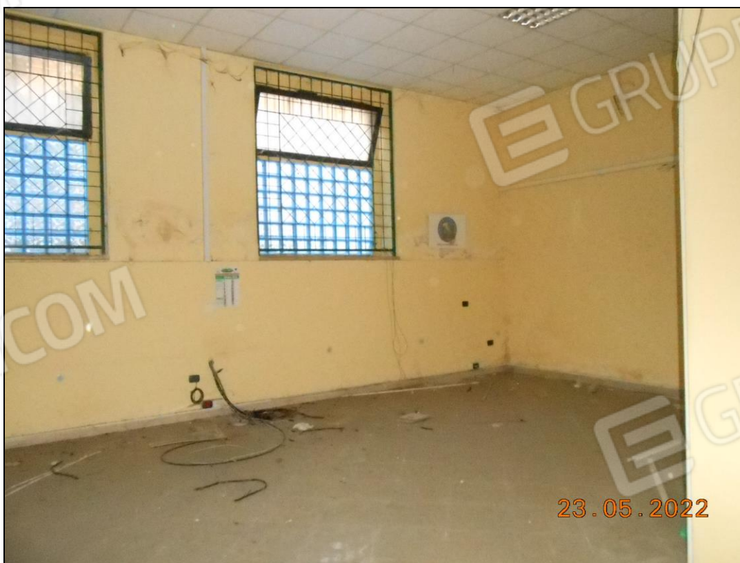
FOTO N. 20 Vista interna dei locali dell'immobile. Si notano i cavi elettrici sfilati dalle tubazioni.