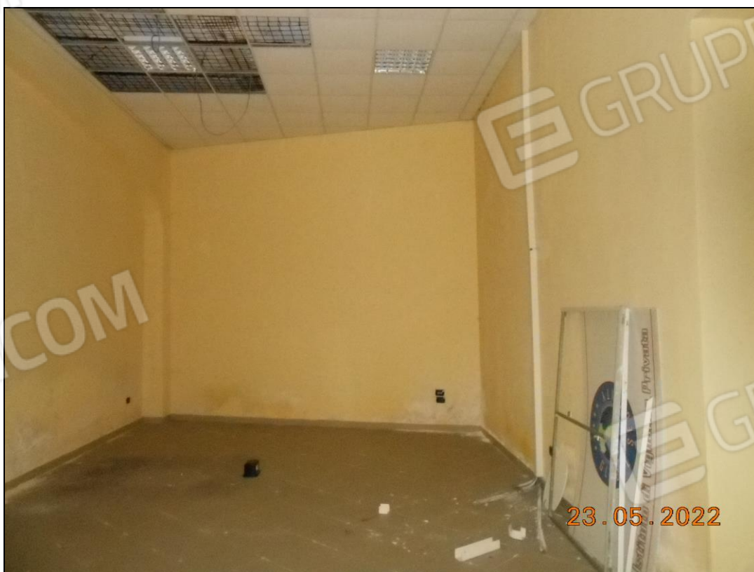
FOTO N. 40 Vista interna dell'immobile. Si notano macchie d'umidità ed efflorescenza sulle pareti.