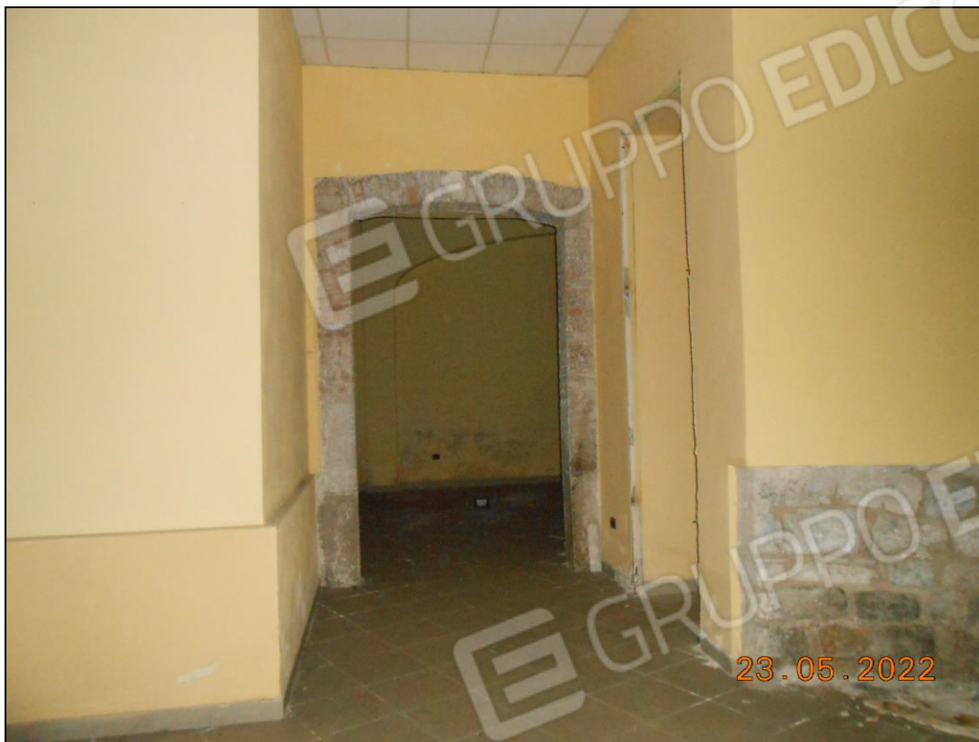
FOTO N. 39 Vista interna dell'immobile.