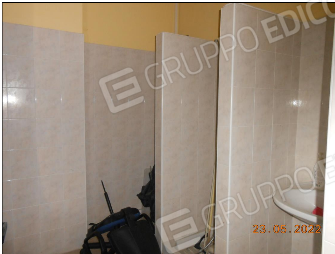
FOTO N. 33 Vista interna dei locali dell'immobile.