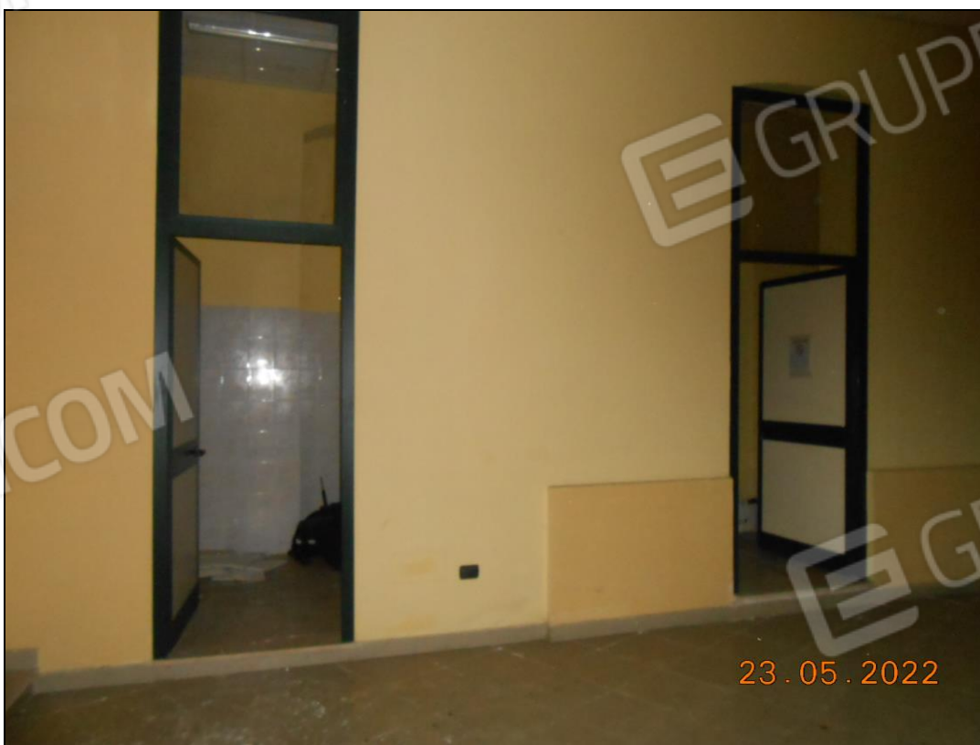
FOTO N. 32 Vista interna dei locali dell'immobile.