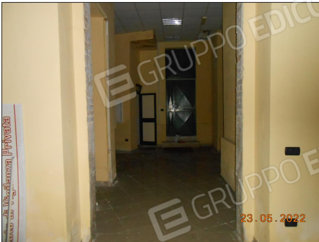
FOTO N. 43 Vista interna dell'immobile.