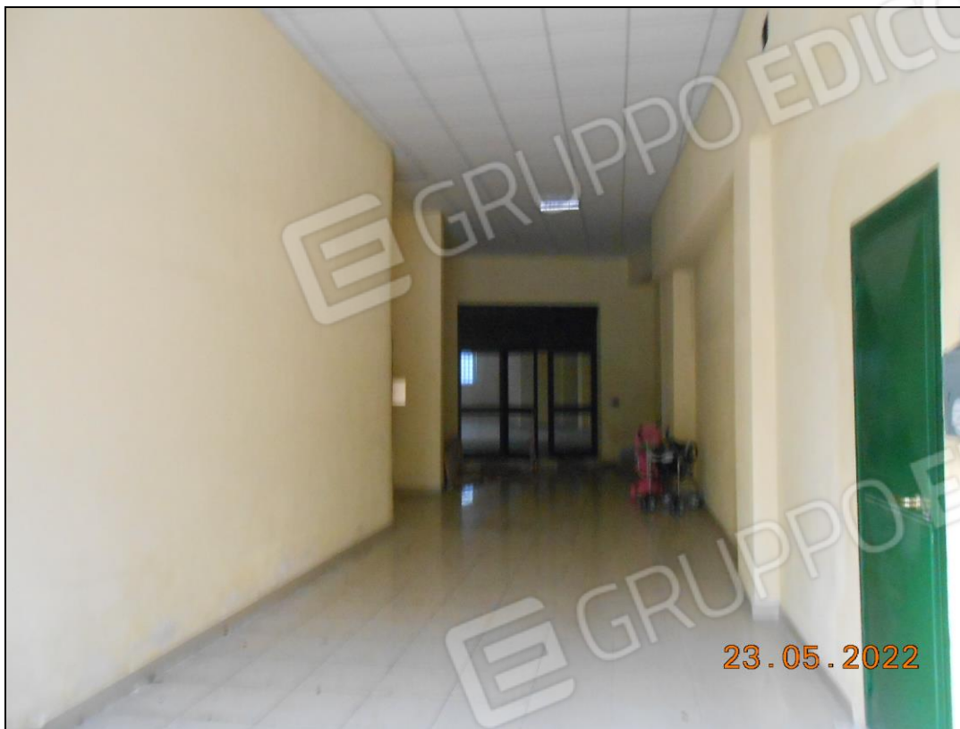
FOTO N. 09 Vista interna dell'androne con servitù di passaggio.