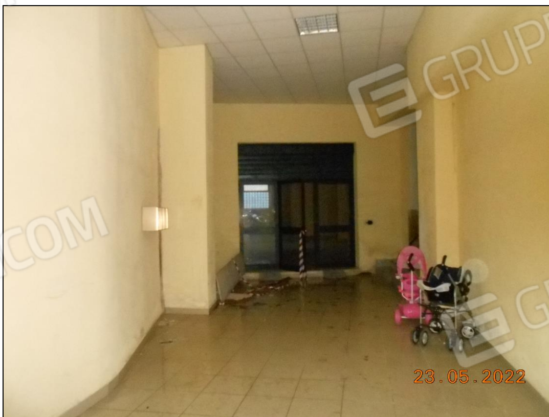
FOTO N. 08 Vista interna dell'androne con servitù di passaggio.