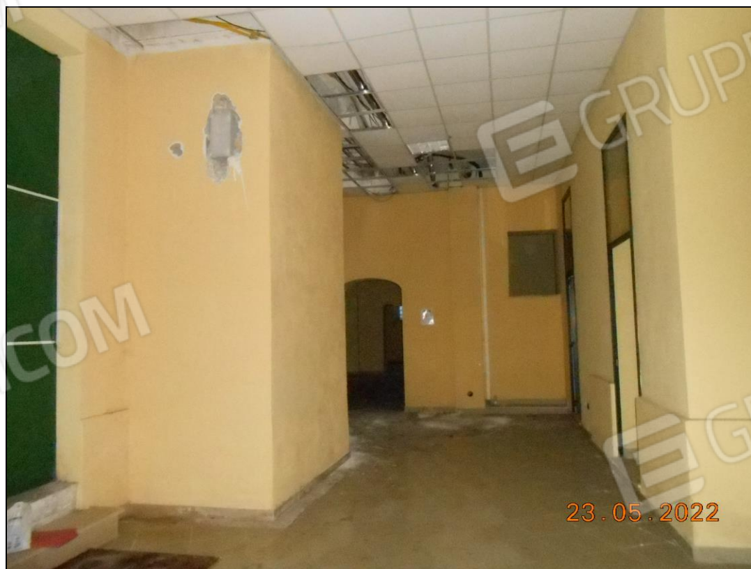
FOTO N. 38 Vista interna dell'immobile. Si notano alcuni pannelli della controsoffittatura rimossi.