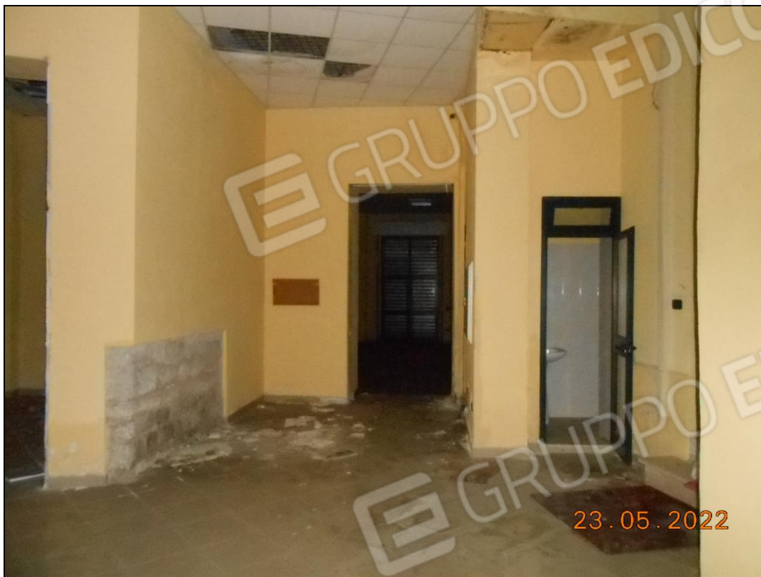
FOTO N. 35 Vista interna dei locali dell'immobile.