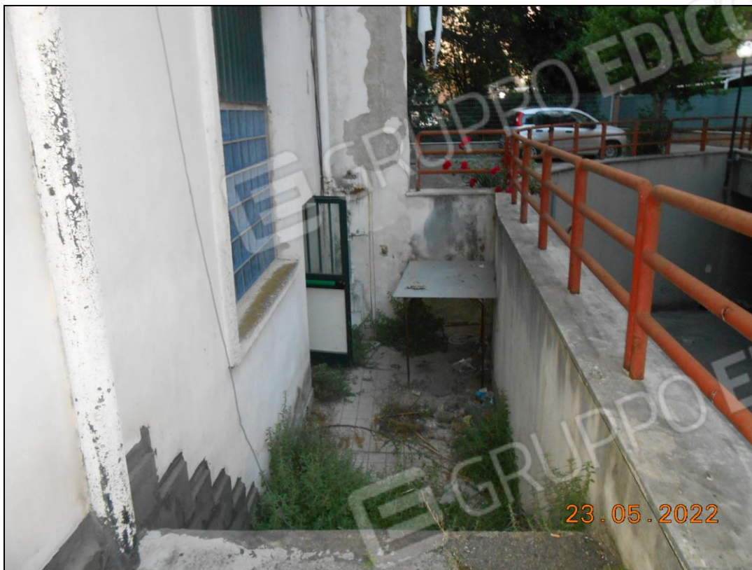
FOTO N. 51 Vista porta di accesso alla corte comune p.lla 316.