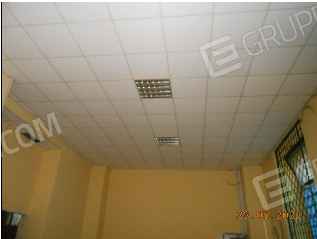
FOTO N. 24 Vista interna dei locali dell'immobile. Si nota la controsoffittatura con pannelli fonoassorbenti.