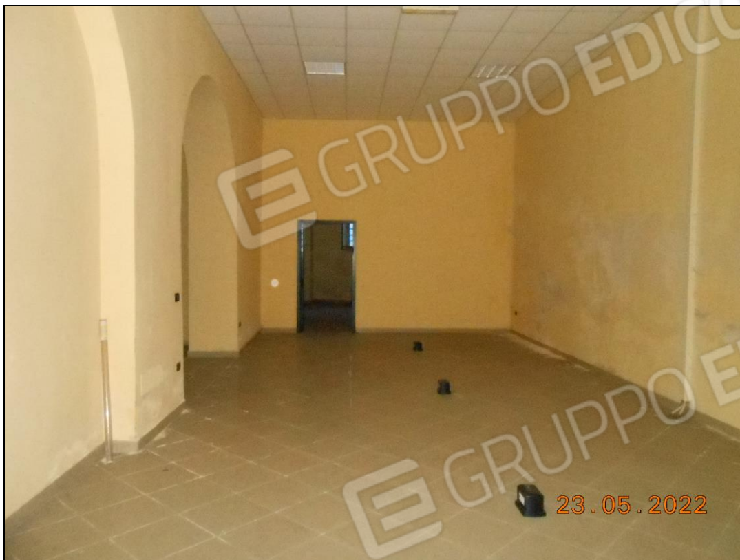
FOTO N. 41 Vista interna dell'immobile.