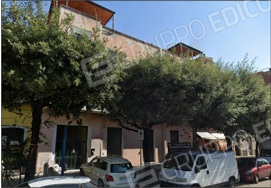
FOTO N. 05 Vista dell'immobile pignorato a piano terra del fabbricato.