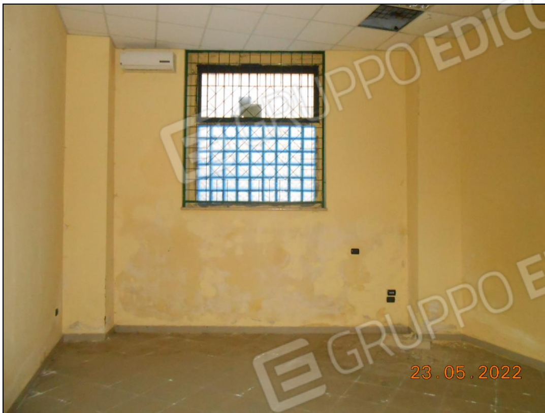
FOTO N. 27 Vista interna dei locali dell'immobile. Si nota l'umidità sulle pareti.