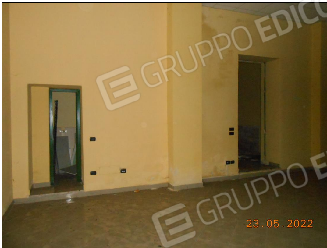
FOTO N. 49 Vista interna dell'immobile, locale prospiciente su viale Principe di Napoli.