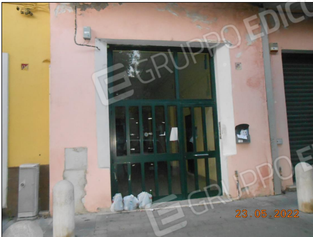
FOTO N. 03 Vista portone di accesso all'androne dell'immobile pignorato.