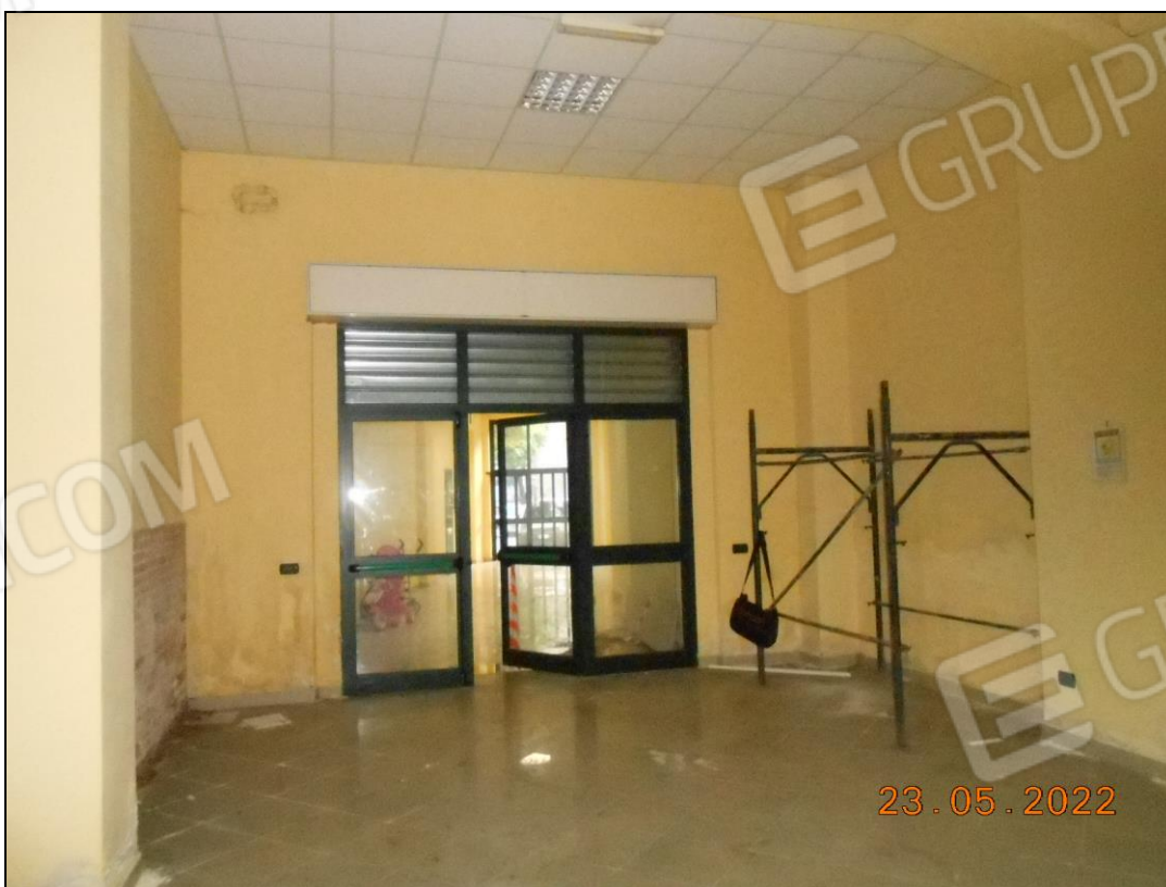
FOTO N. 12 Vista interna dei locali posteriori dell'immobile. Si notano macchie d'umidità sulle pareti.