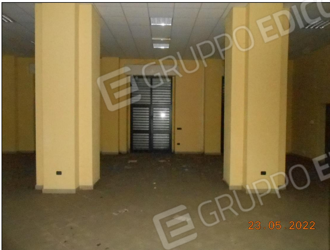
FOTO N. 45 Vista interna dell'immobile, locale prospiciente su viale Principe di Napoli.