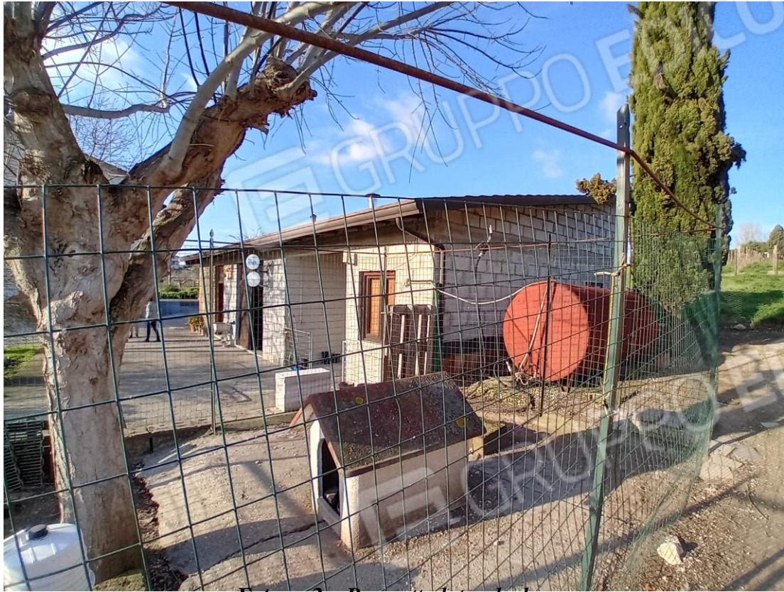
Foto n. 3 Prospetto laterale dx