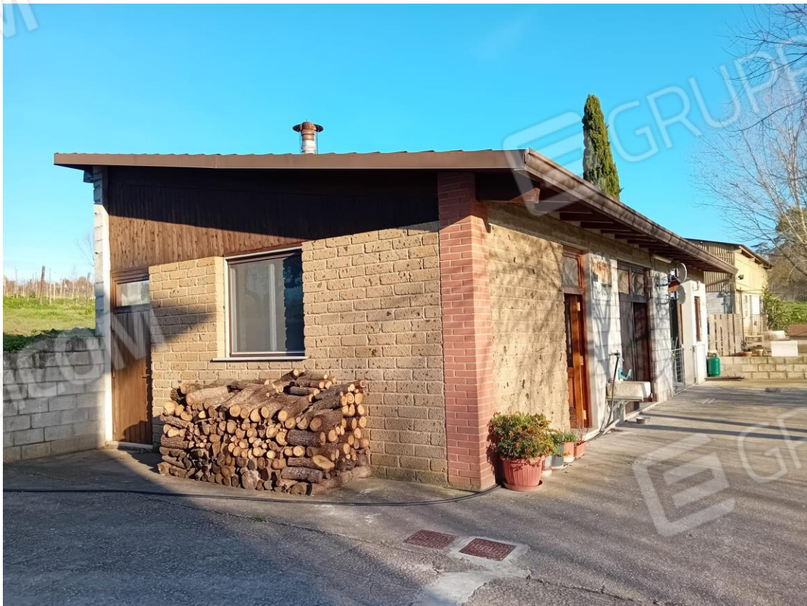
Foto n. 4 Vista complessiva