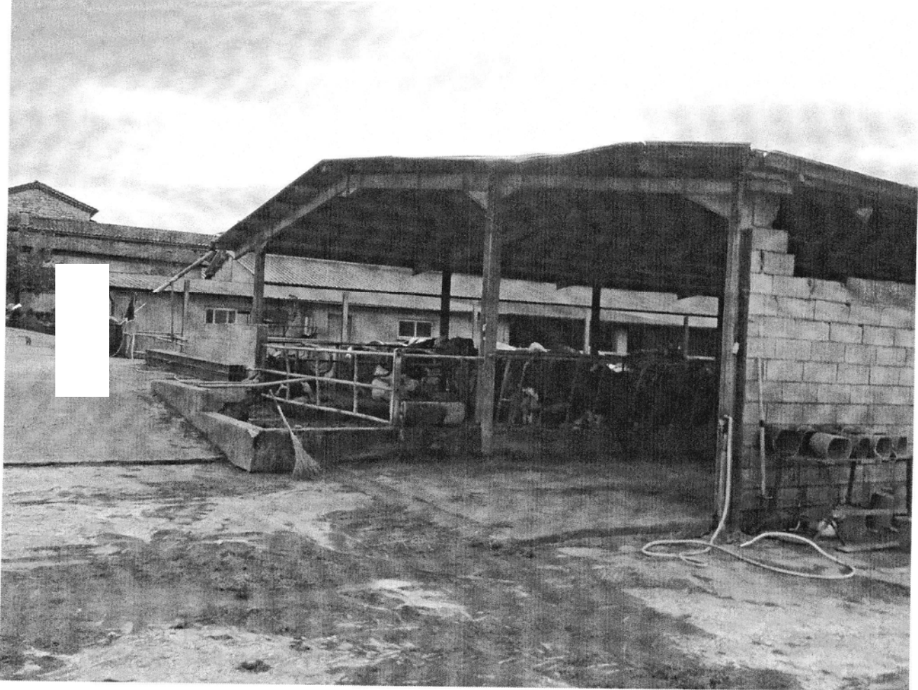
Stalla fg. 28 p.lla 267

Tel.: 082443744, cell. 3388813886-3388526420 Fax: 082443744 E-mail: aldo.intorcía@libero.it