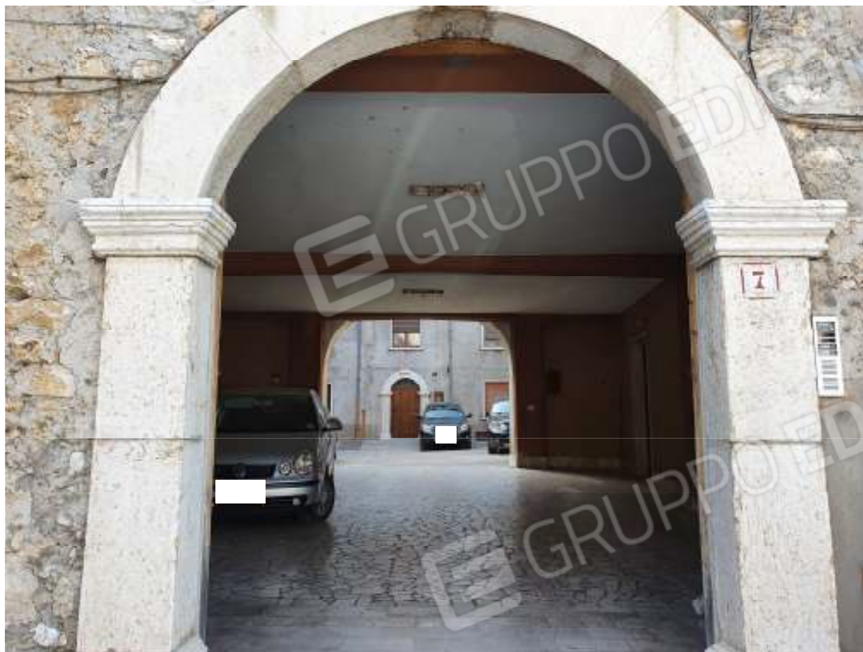
Foto n. 1: Accesso all'appartamento da via Largo Colle La Croce n. 7