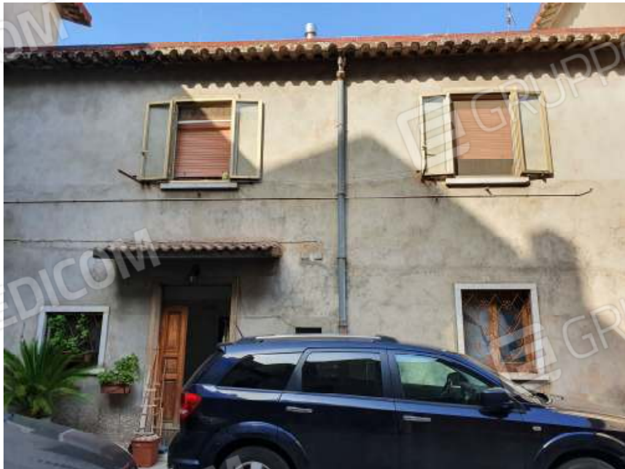
Foto n. 2: Ingresso all'appartamento al piano terra dal cortile comune – interno n. 2