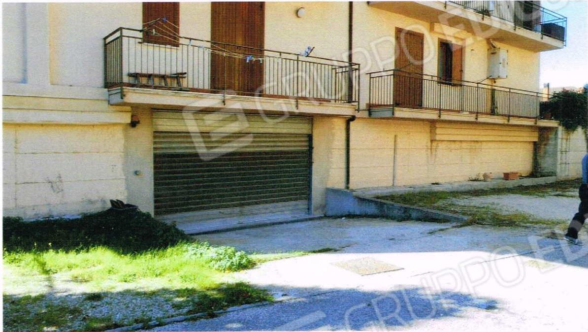
FOTO DELLA DELL'INGRESSO AL PIANO SEMINTERRATO