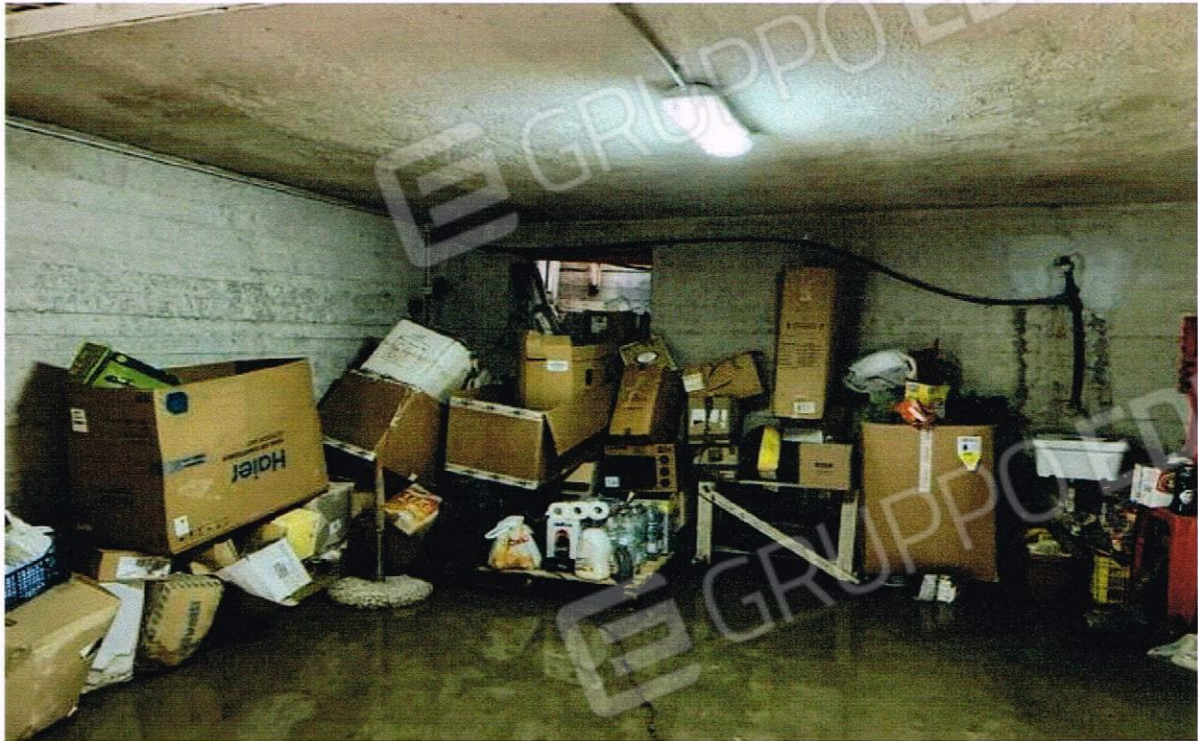
VISTA INTERNA DEL GARAGE AL PIANO SEMINTERRATO – FG. 4 P.LLA 677 SUB 4