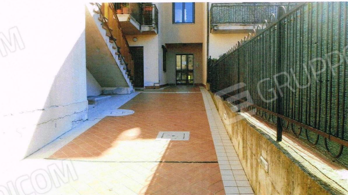
FOTO DEL VIALE CONDOMINIALE CHE CONDUCE AL PORTONE DI INGRESSO DELL'APPARTAMENTO PIGNORATO DI COLORE MARRONE SULLA SINISTRA