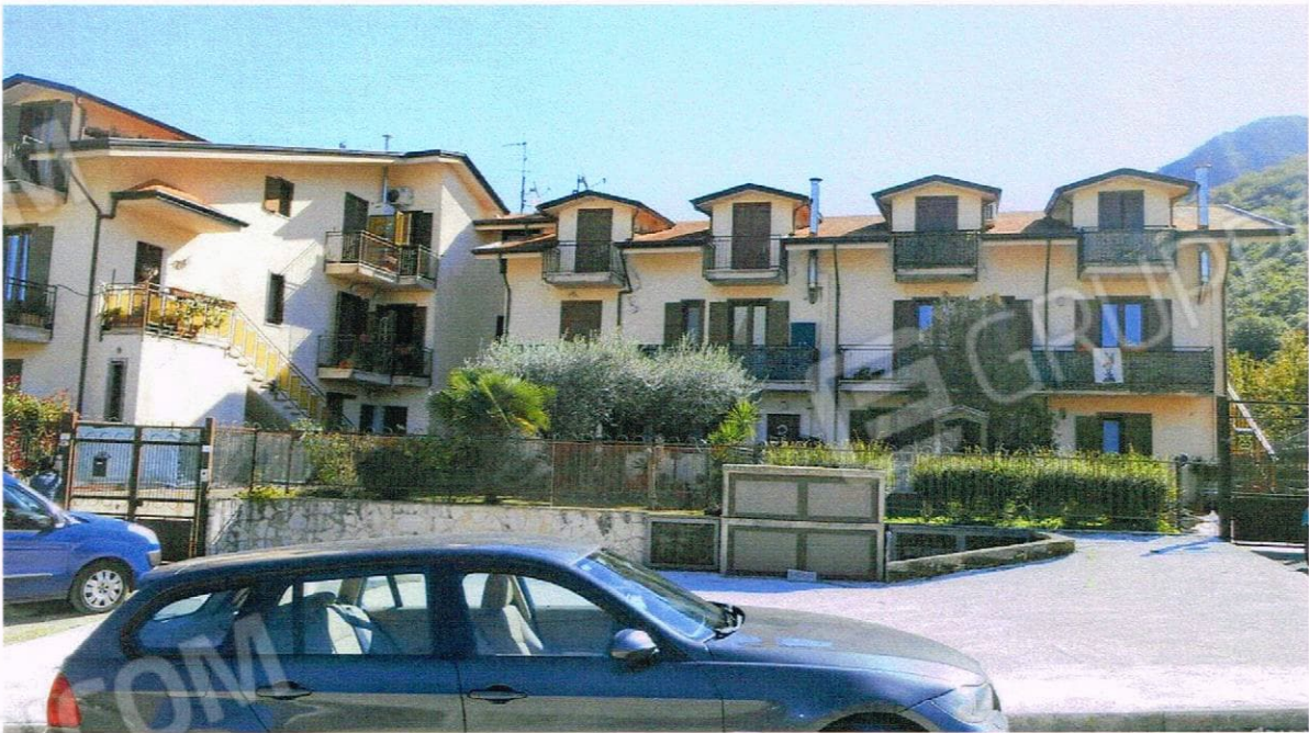
VISTA DEL CONDOMINIO PROSPETTO PRINCIPALE