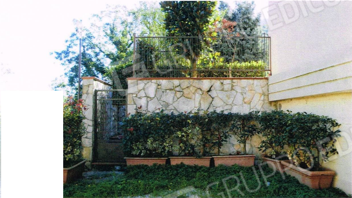
VISA DEL CANCELLETTO PRIVATO, CHE DAL PIANO DI INGRESSO AI GARAGE PORTA AL GIARDINO ANNESSO ALL'APPARTAMENTO