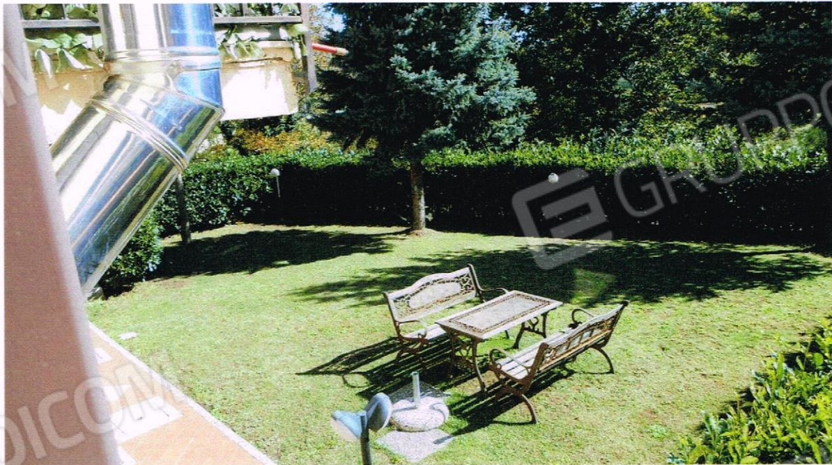
VISTA DEL GIARDINO ANNESSO ALL'APPARTAMENTO PIGNORATO