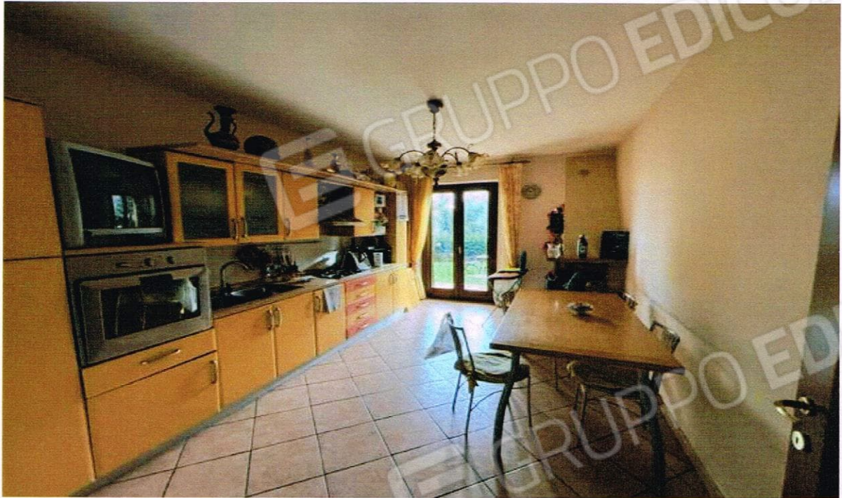
VISTA CUCINA E CAMERA DA LETTO APPARTAMENTO LOTTO N. 1 CORPO A