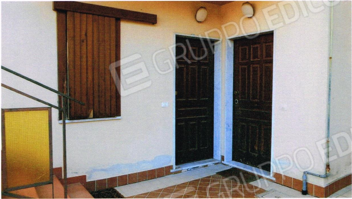
VISTA DEL PORTONE DI INGRESSO DI COLORE MARRONE ALL'APPARTAMENTO SUL LATO DESTRO