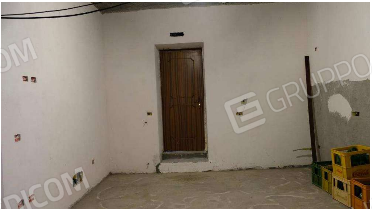
Foto 6 – Dettaglio della porta di accesso al vano soggiorno nel fabbricato ex deposito