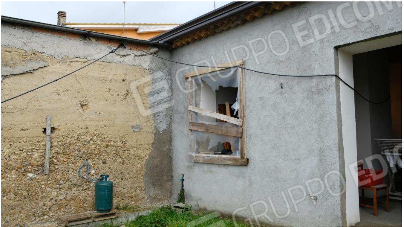
Foto 9 – Dettagli esterni nello stato rustico del fabbricato ex deposito, area del portico