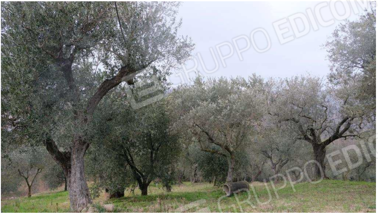
Foto 19 – Vista dell’uliveto particella 1196 ad OVEST dei fabbricati