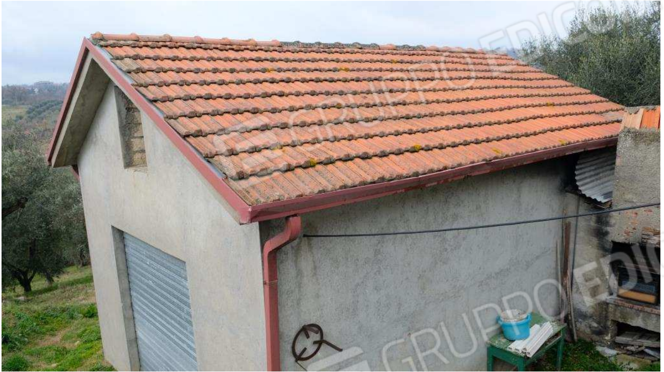
Foto 13 – Vista dell'autorimessa dal portico del fabbricato ex deposito