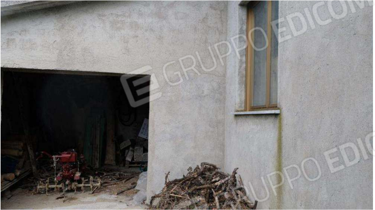
Foto 15 – Dettaglio dell'ingresso al locale più piccolo dell'autorimessa