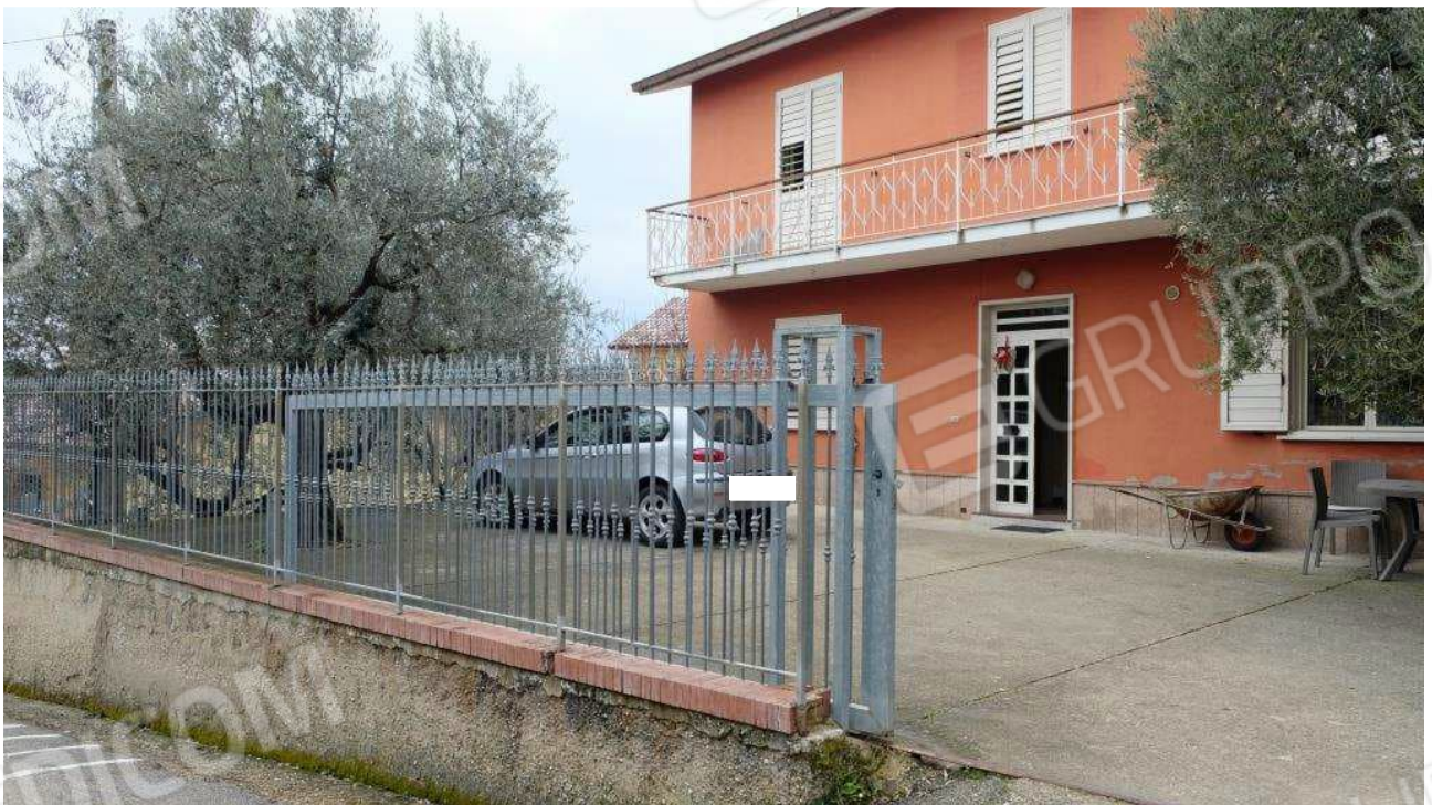
Foto 2 – Dettaglio dell'ingresso alla corte del fabbricato con cancello carraio scorrevole su rotaia e recinzione