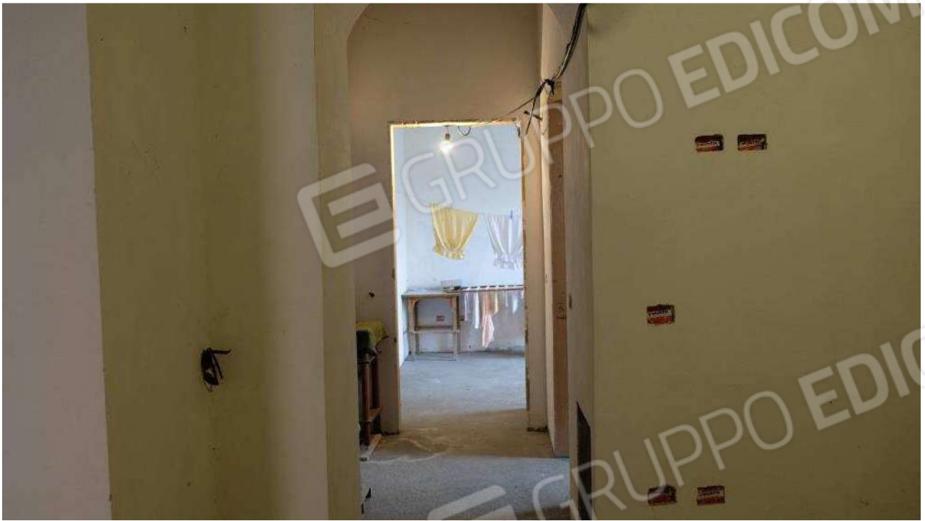
Foto 5 – Dettaglio degli interni dell'immobile ex deposito nello stato rustico