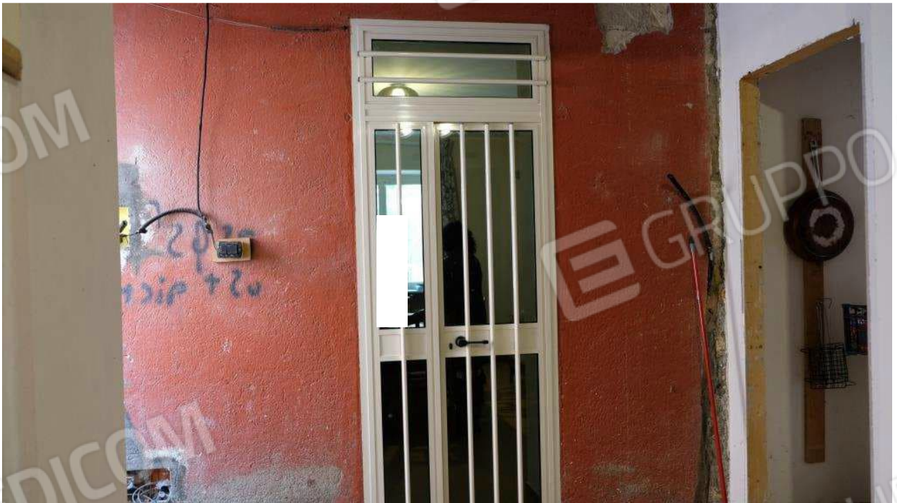
Foto 4 – Porta di accesso al corpo del fabbricato ex deposito dall'abitazione