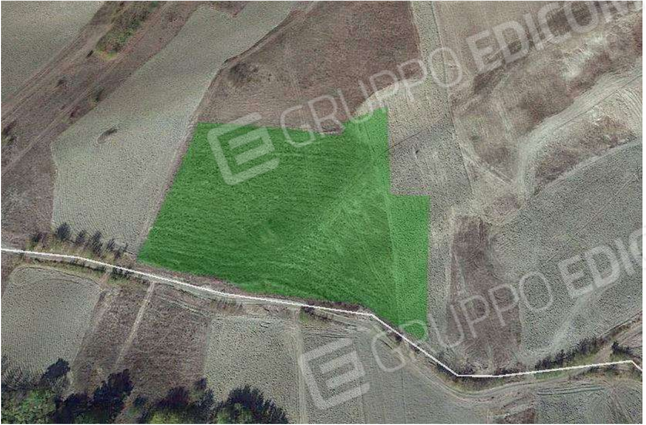
Foto 23 – Vista satellitare dell'area occupata dalle particelle pignorate del foglio 94