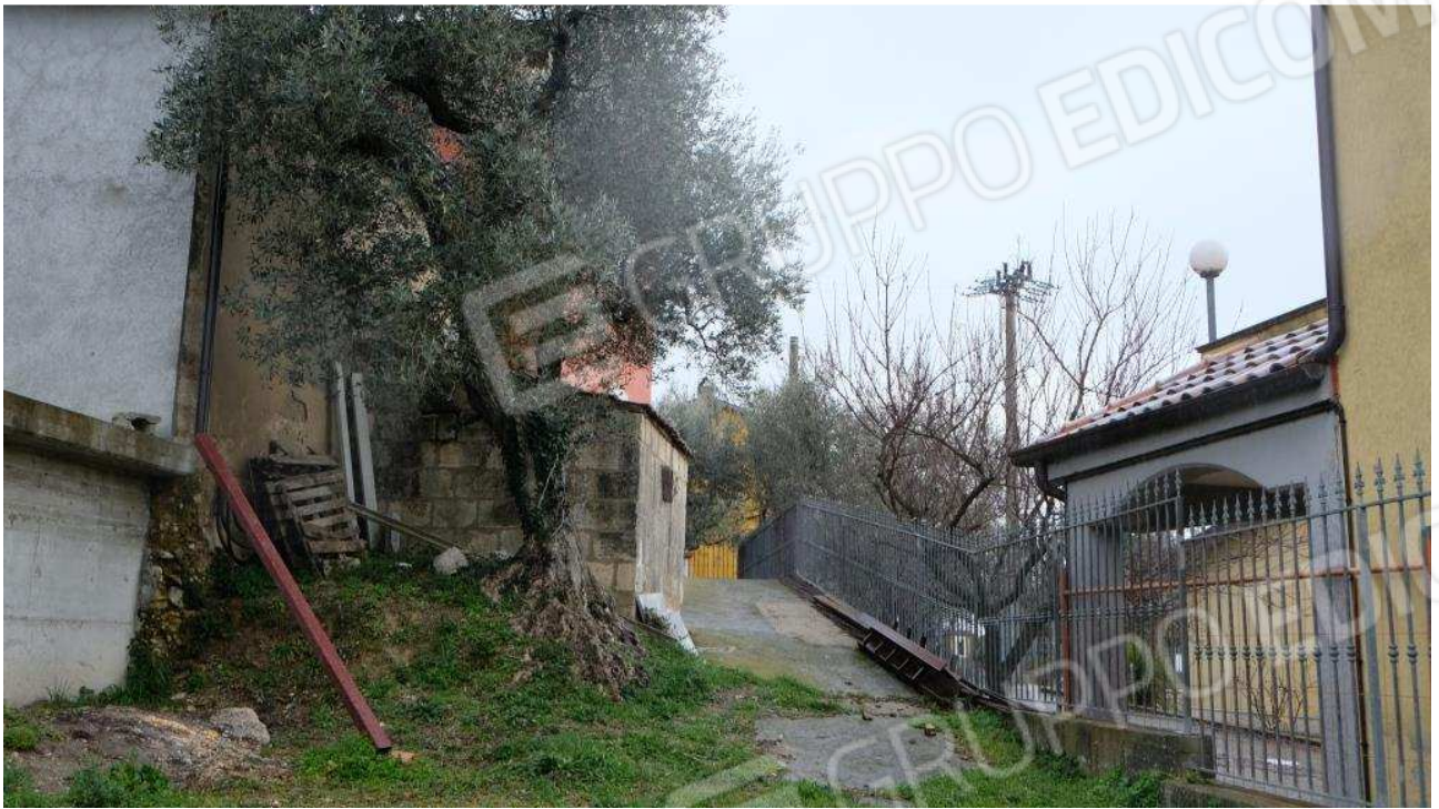
Foto 11 – Viottolo di accesso carraio alla corte interna dell'abitazione dall'area di ingresso