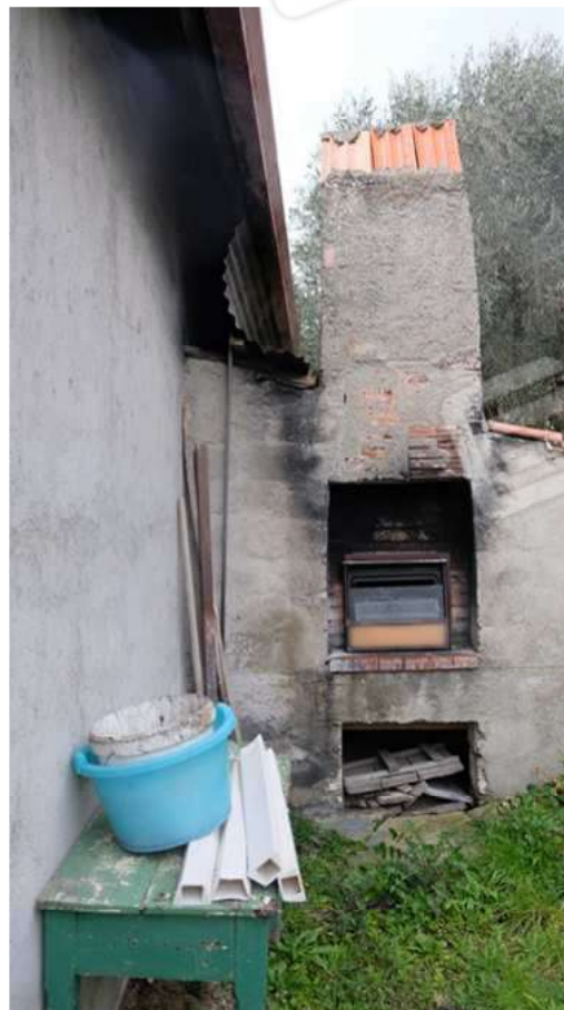
Foto 18 – Vista del forno sul lato EST del fabbricato autorimessa