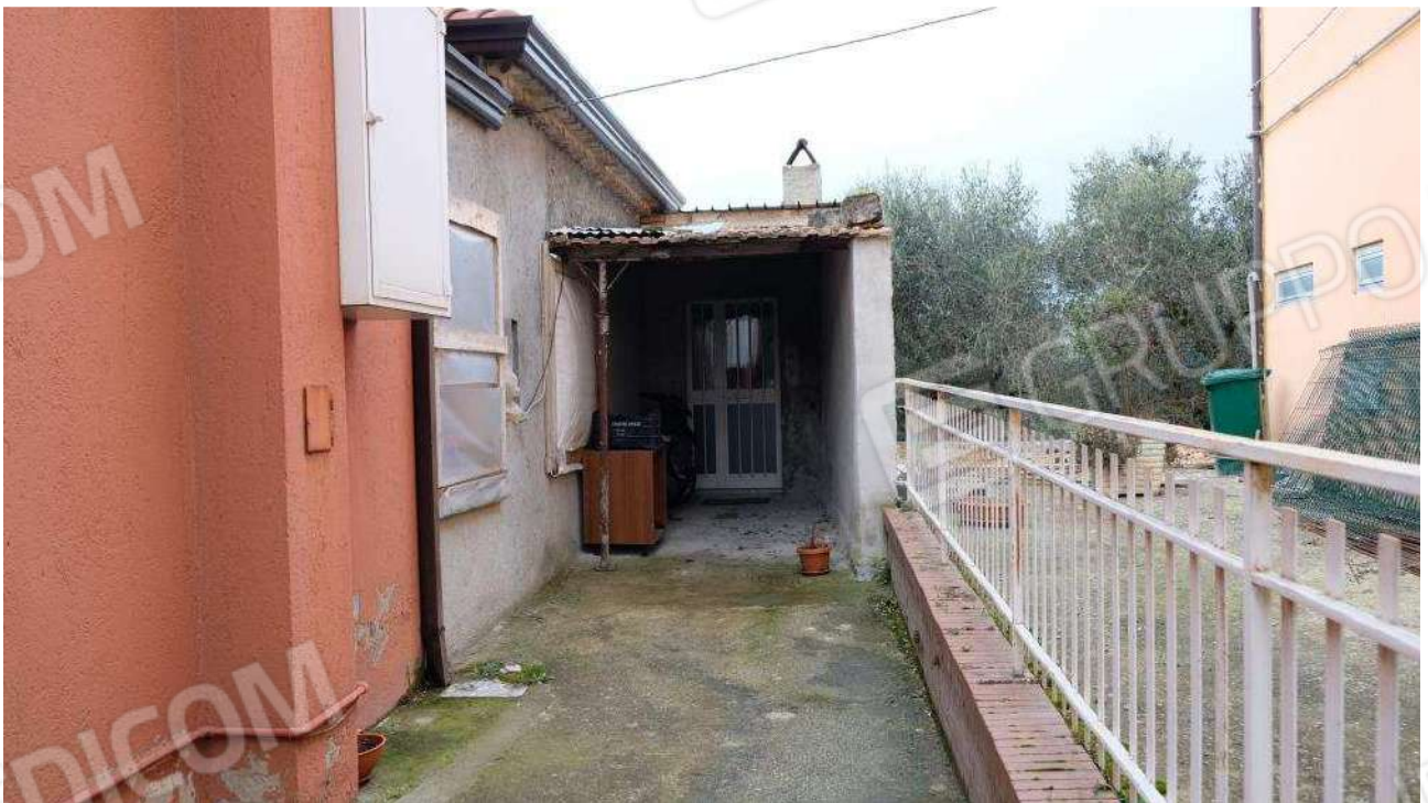
Foto 12 – Vista dell'accesso esterno al vano soggiorno dell'ex deposito dalla corte di ingresso all'abitazione