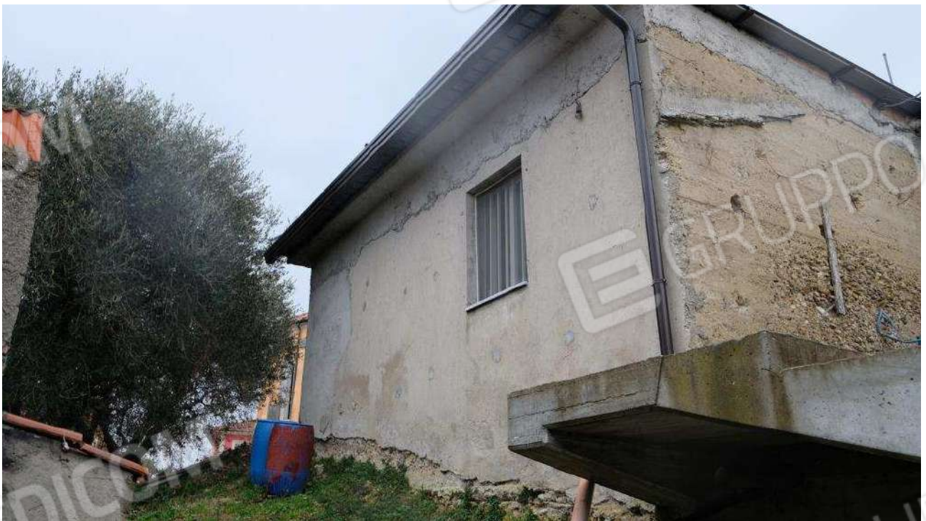
Foto 10 - Dettagli esterni nello stato rustico del fabbricato ex deposito,