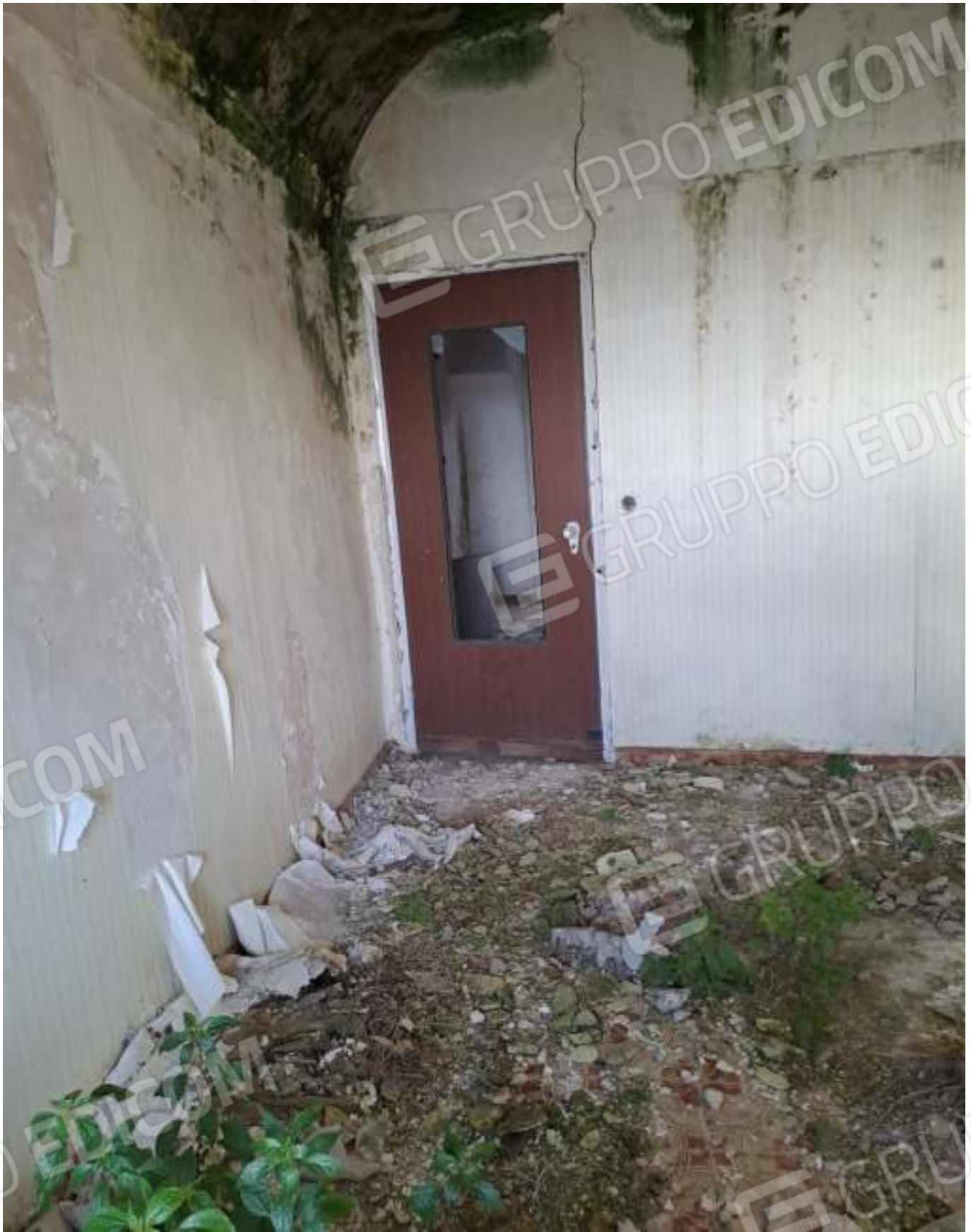
FOTO N. 6 ALTRA VISTA DEL LOCALE LETTO 2