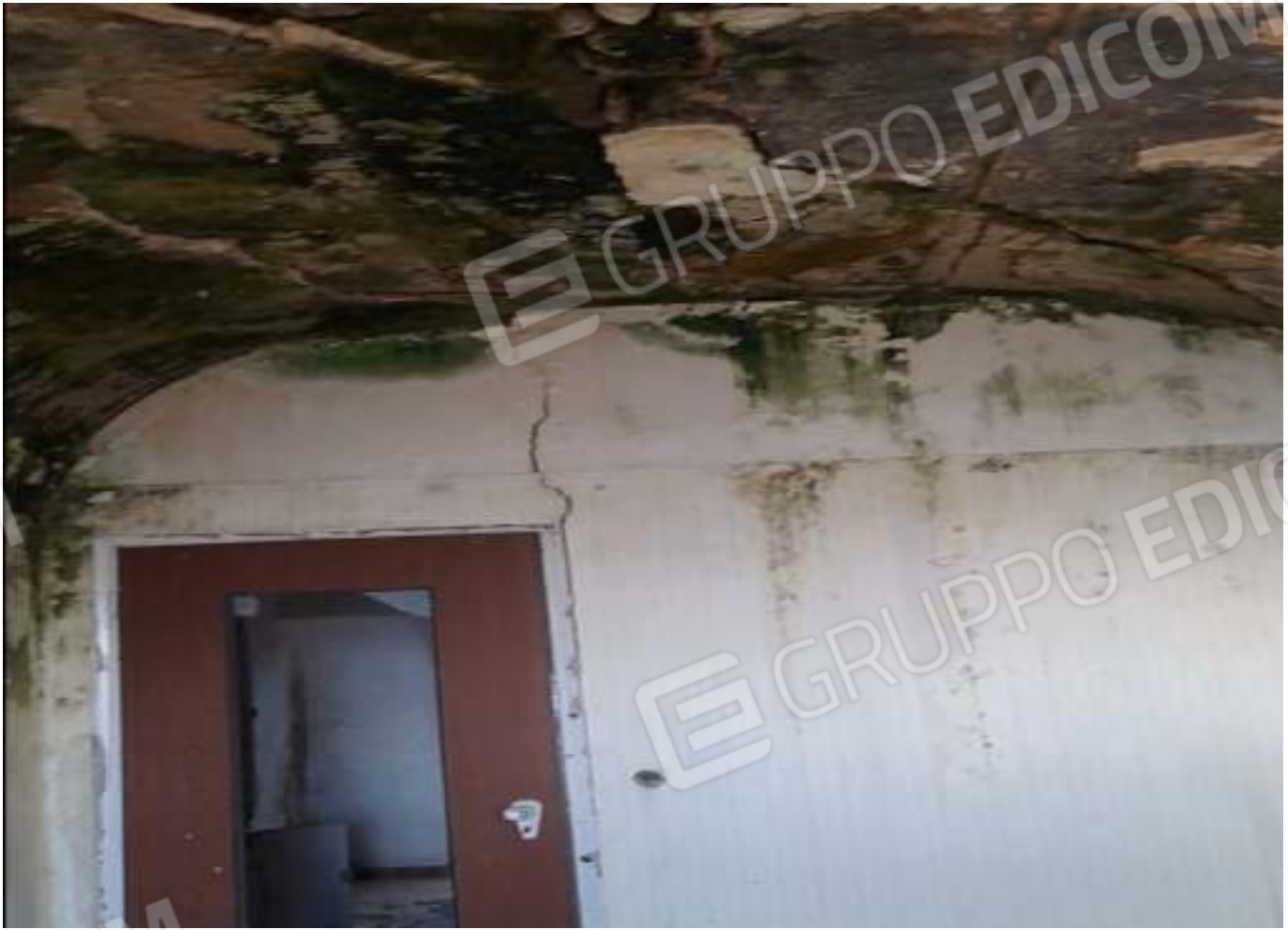
FOTO N. 13 VISTA DI PORZIONE DI VOLTA DEL LOCALE LETTO 1