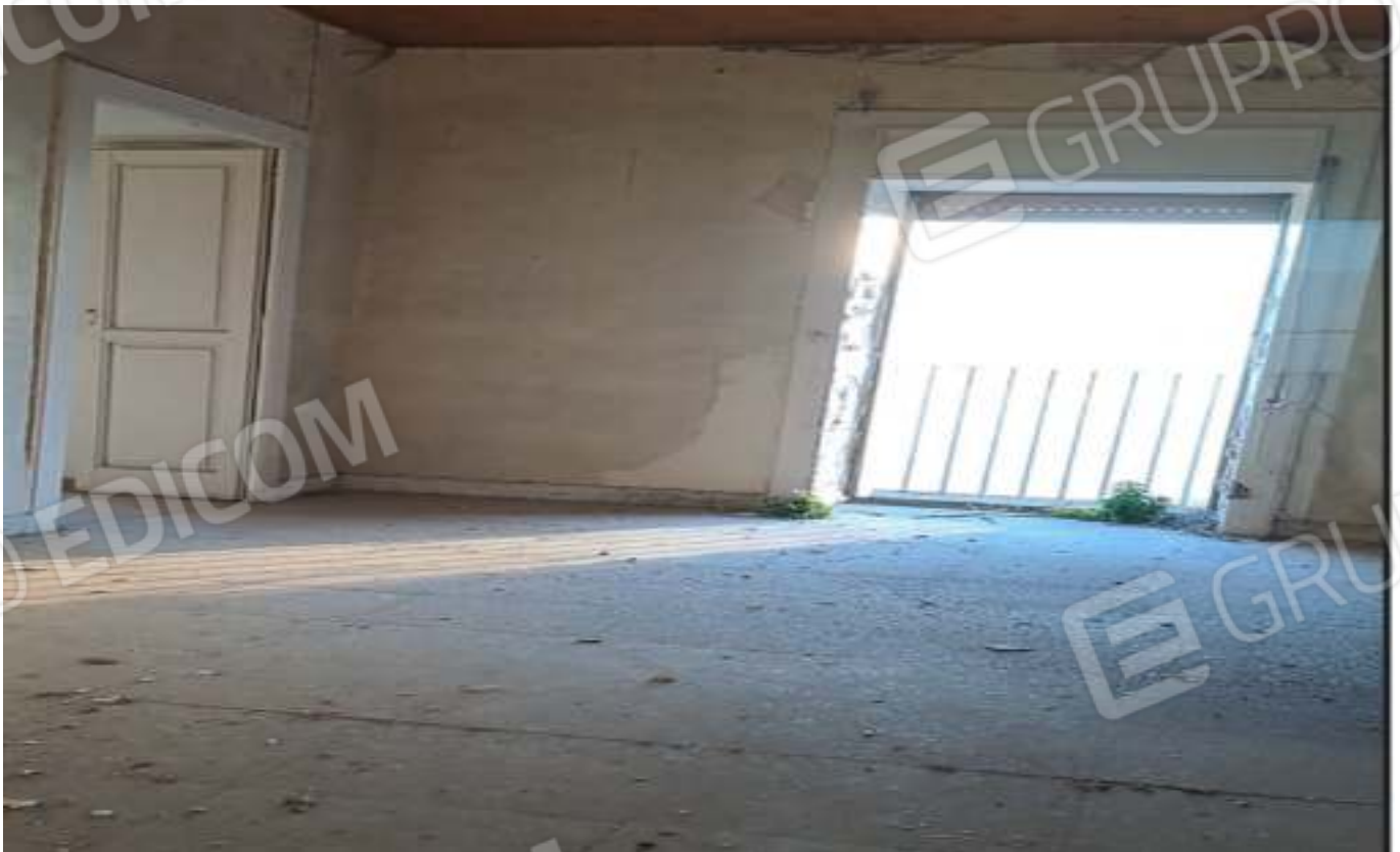
FOTO N. 12 ALTRA VISTA DEL LOCALE SOGGIORNO PRANZO