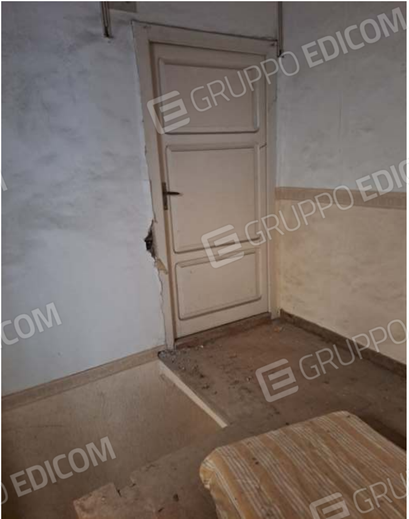
FOTO N. 3 VISTA DELLA PORTA DI ACCESSO ALLA CUCINA