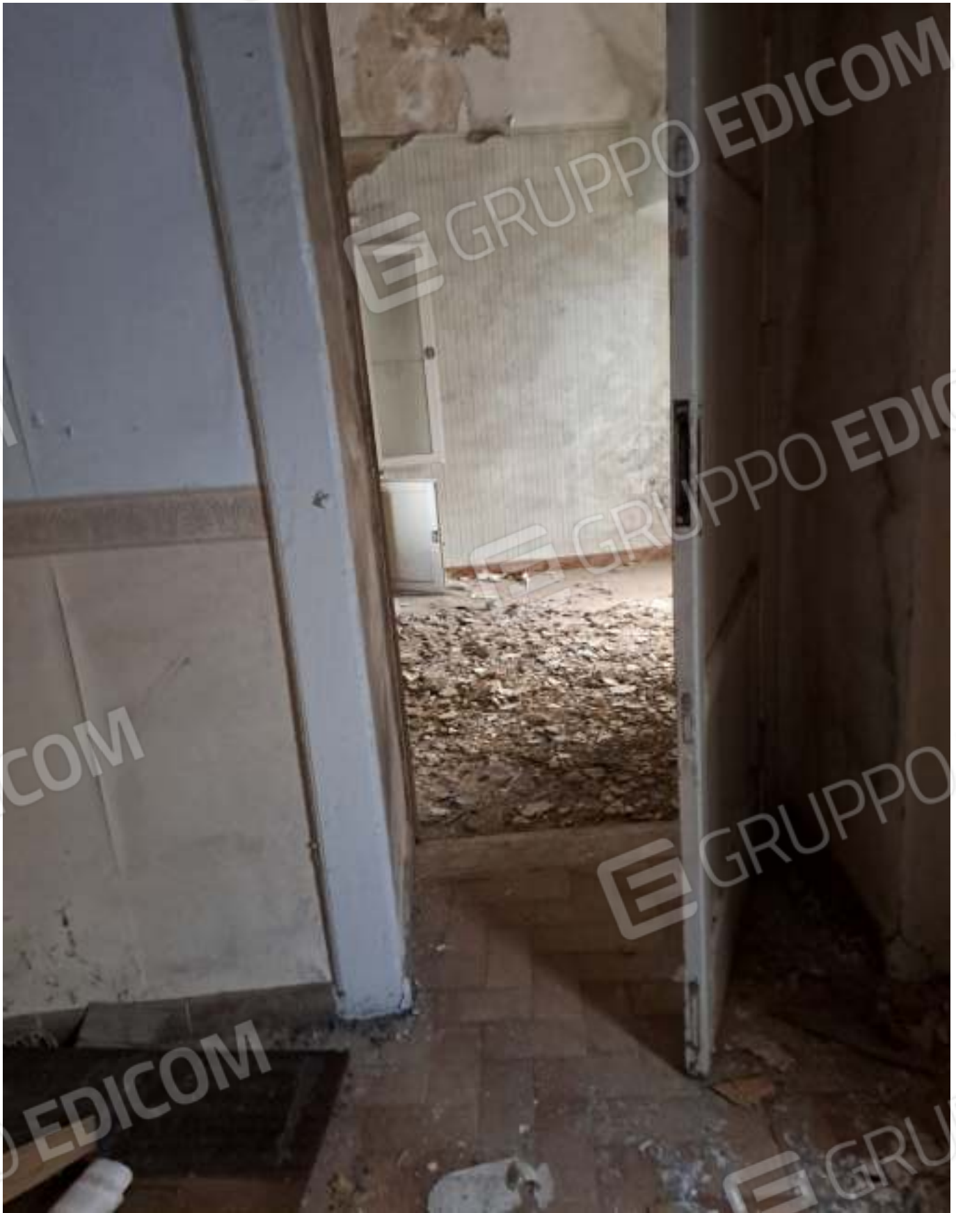
FOTO N. 4 VISTA DEL LOCALE LETTO 1