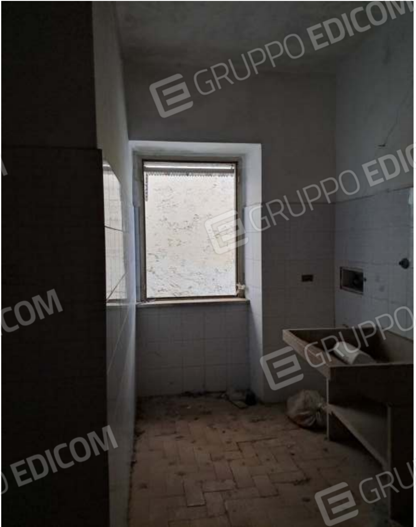
FOTO N. 8 VISTA DEL LOCALE CUCINA