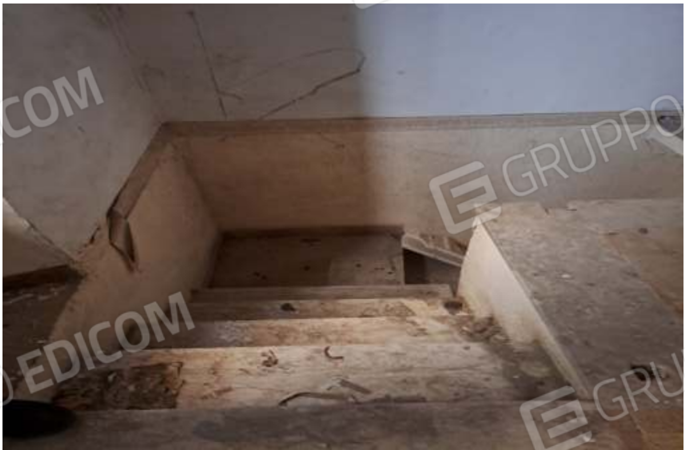
FOTO N.2 ALTRA VISTA DELLA SCALA DI ACCESSO