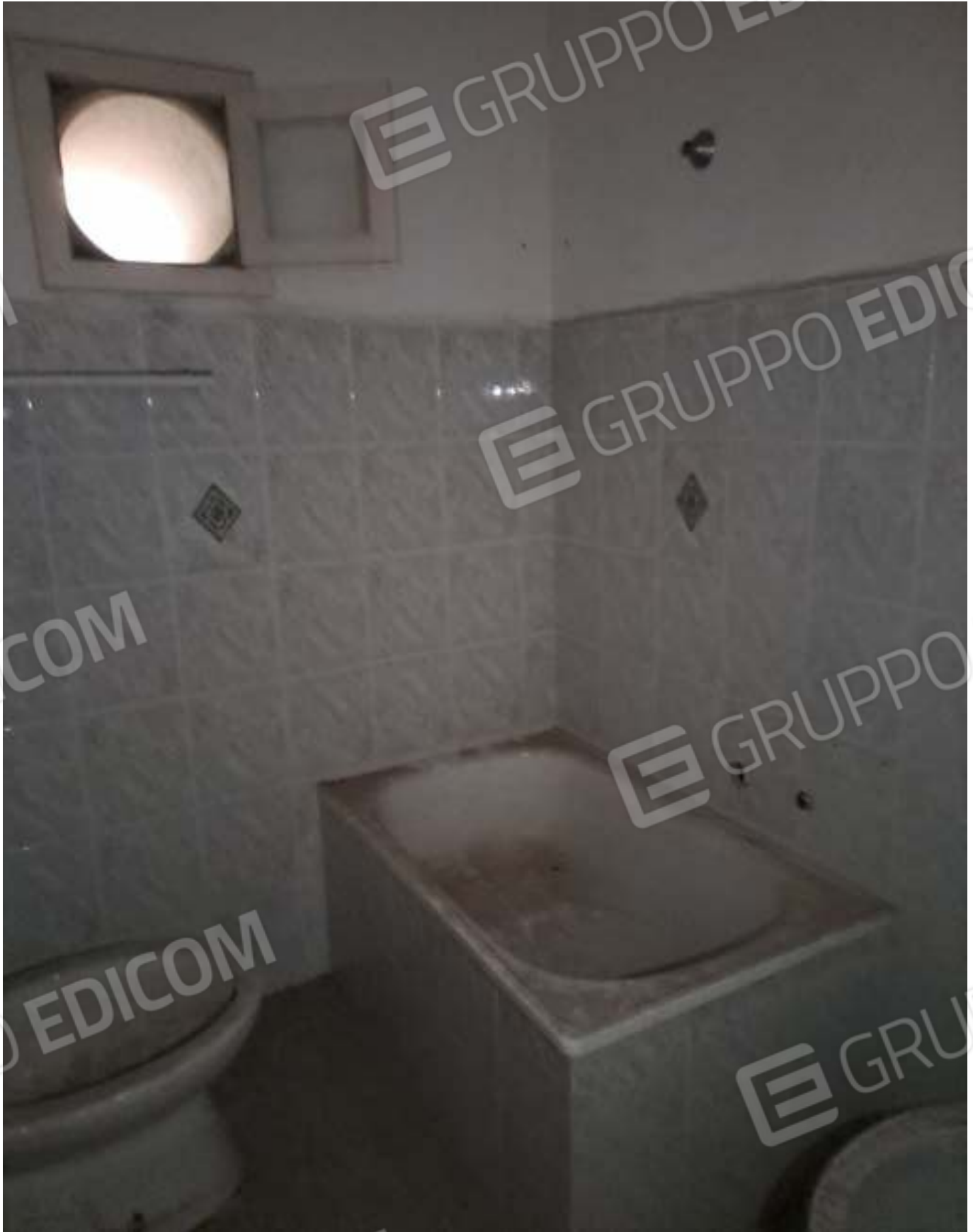
FOTO N. 10 VISTA DEL LOCALE BAGNO