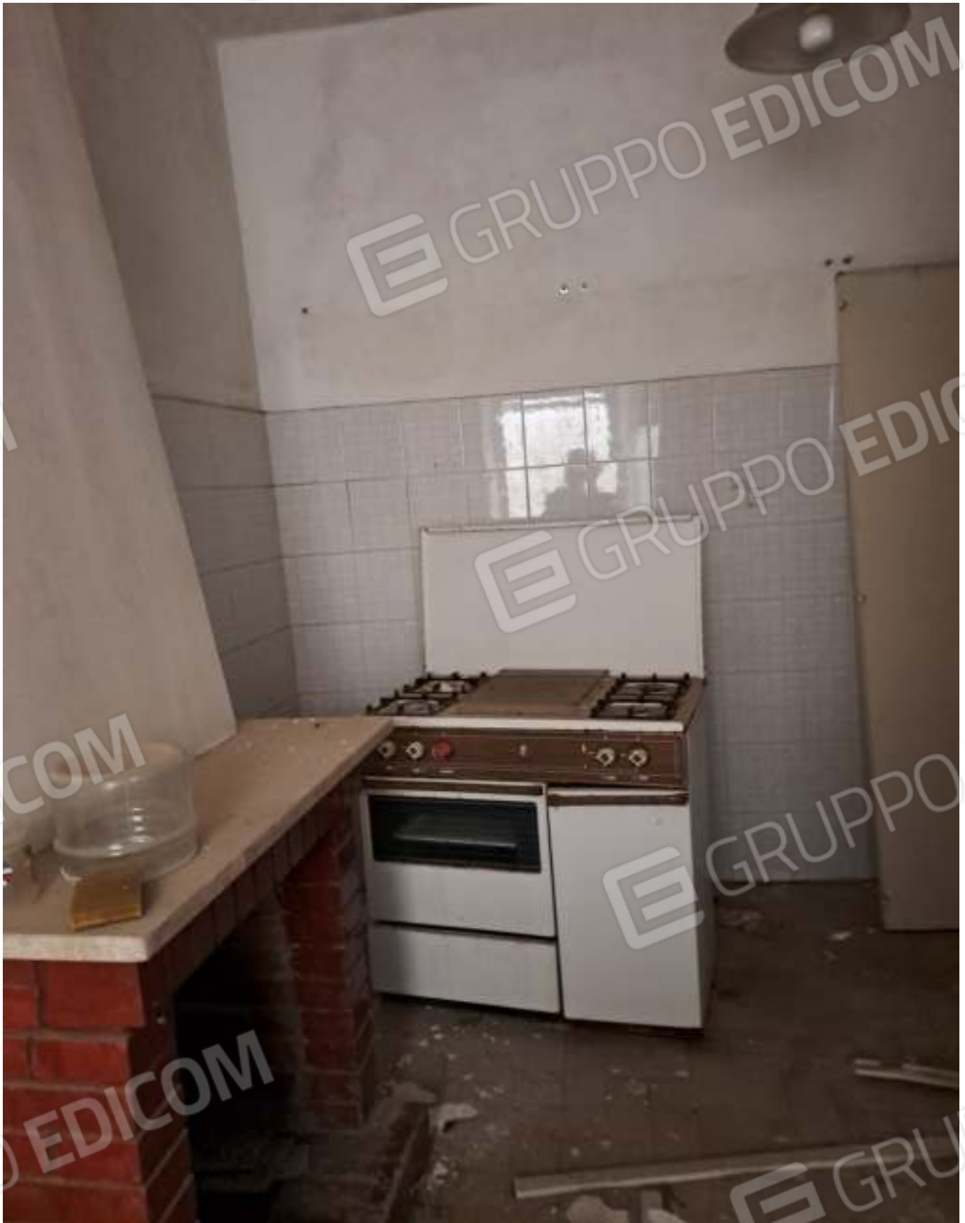
FOTO N. 9 ALTRA VISTA DEL LOCALE CUCINA