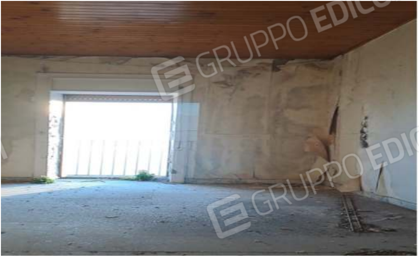
FOTO N. 11 VISTA DEL LOCALE SOGGIORNO PRANZO