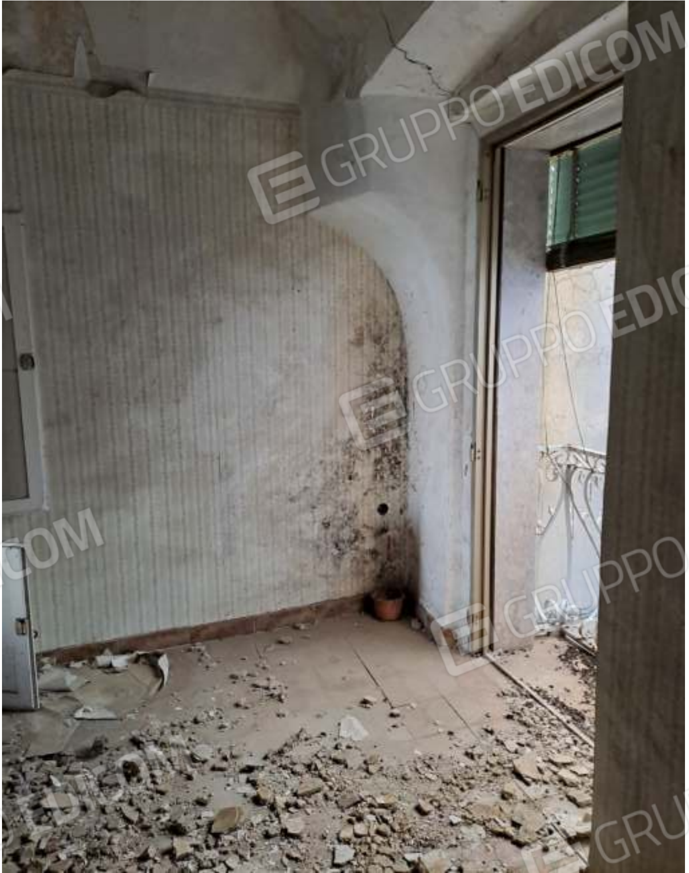
FOTO N. 5 ALTRA VISTA DEL LOCALE LETTO 1