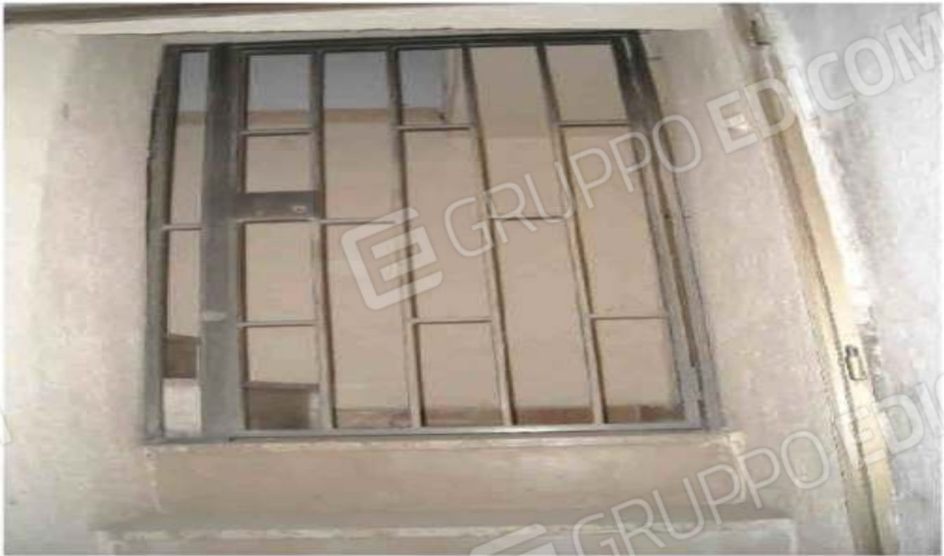
FOTO N.1 VISTA DELLA SCALA DI ACCESSO DALL'ANDRONE COMUNE