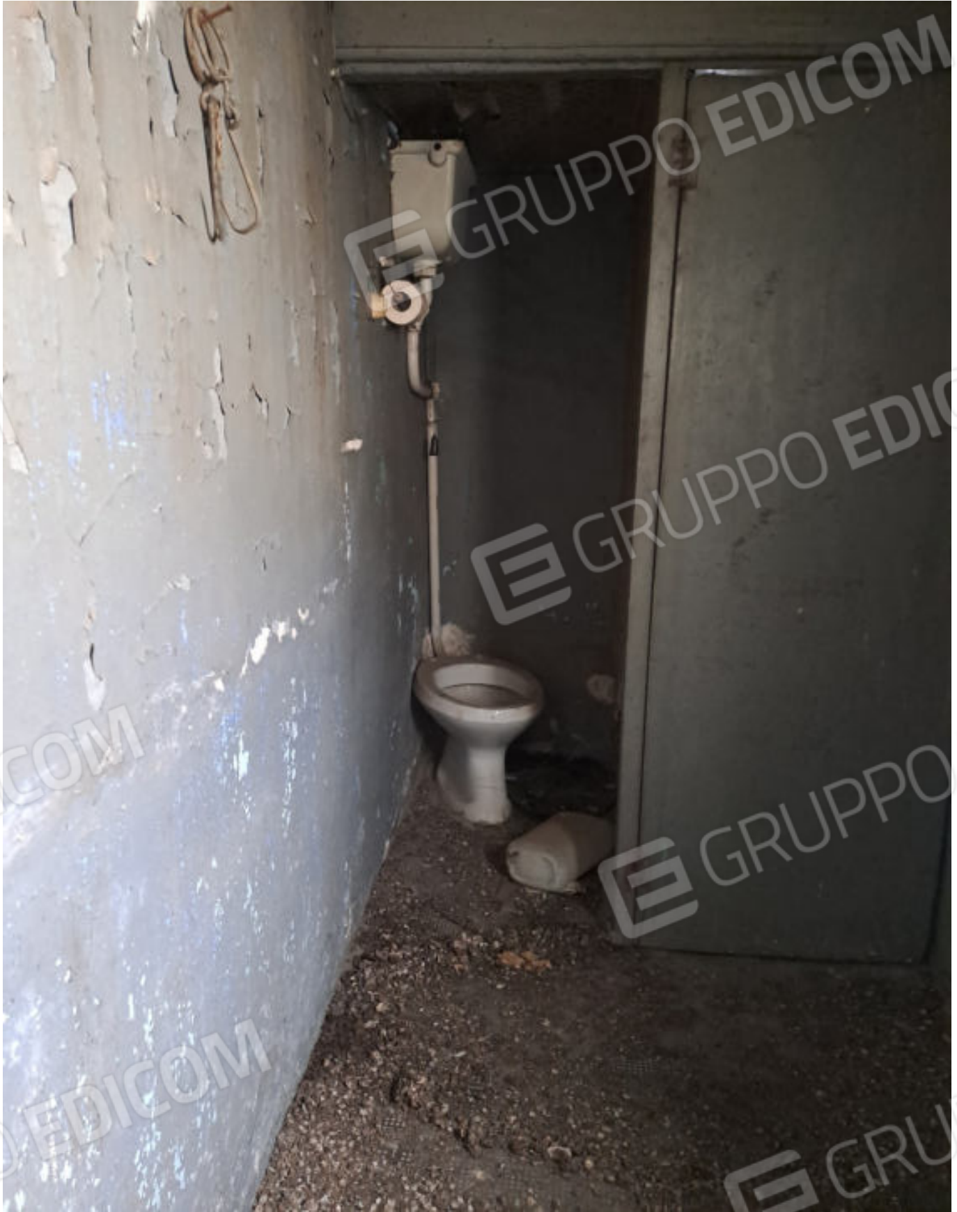
FOTO N. VISTA DEL LOCALE BAGNO UBICATO NELLA VERANDA ATTIGUA AL VANO LETTO AL SECONDO PIANO