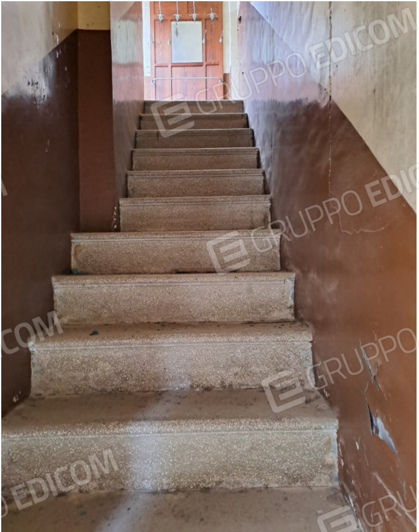
FOTO N. VISTA DELLA SCALA DI ACCESSO AL PIANO SECONDO RIPRESA DALL'INGRESSO PRINCIPALE