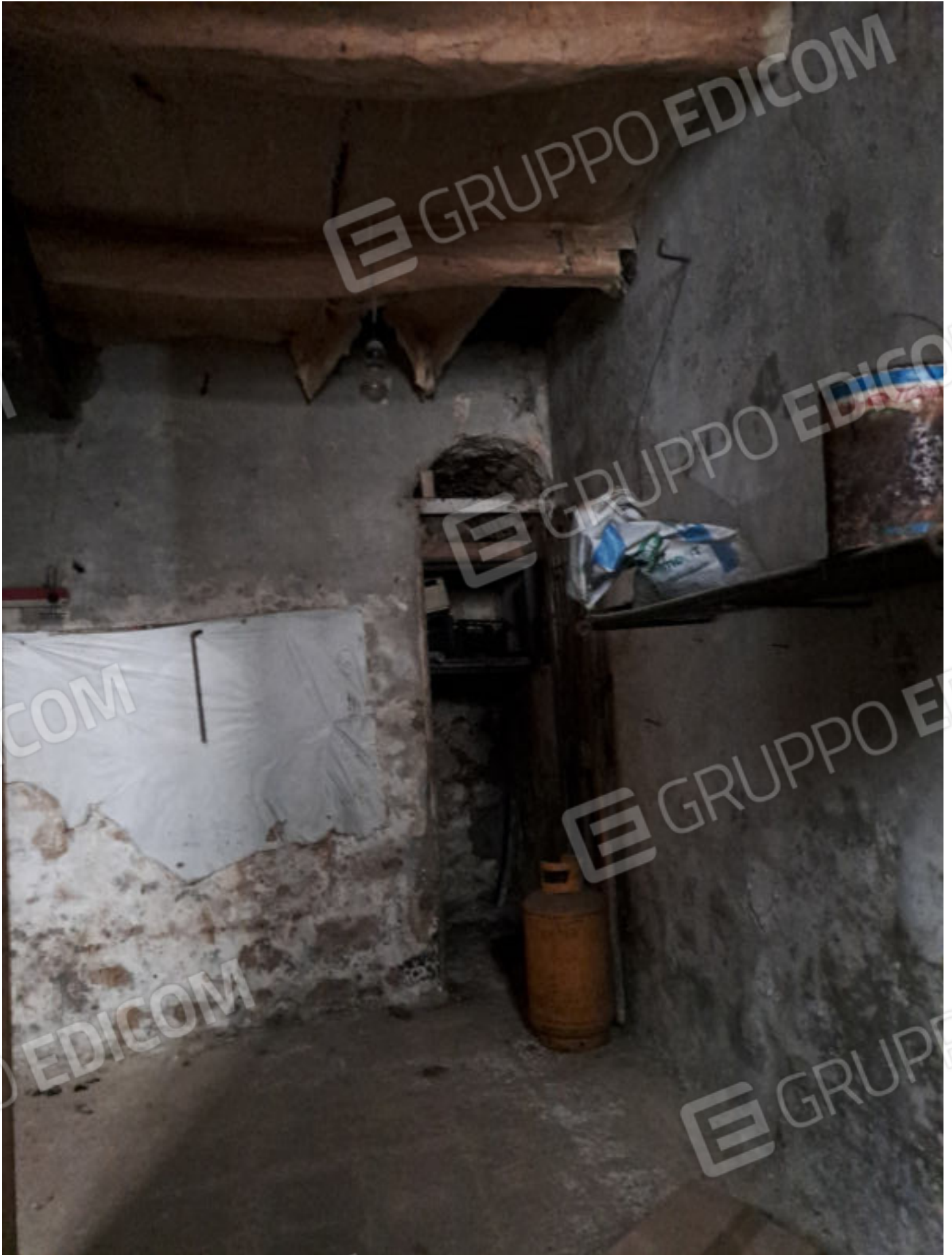
FOTO N. 3 ALTRA VISTA DEL LOCALE DEPOSITO AL PIANO TERRA