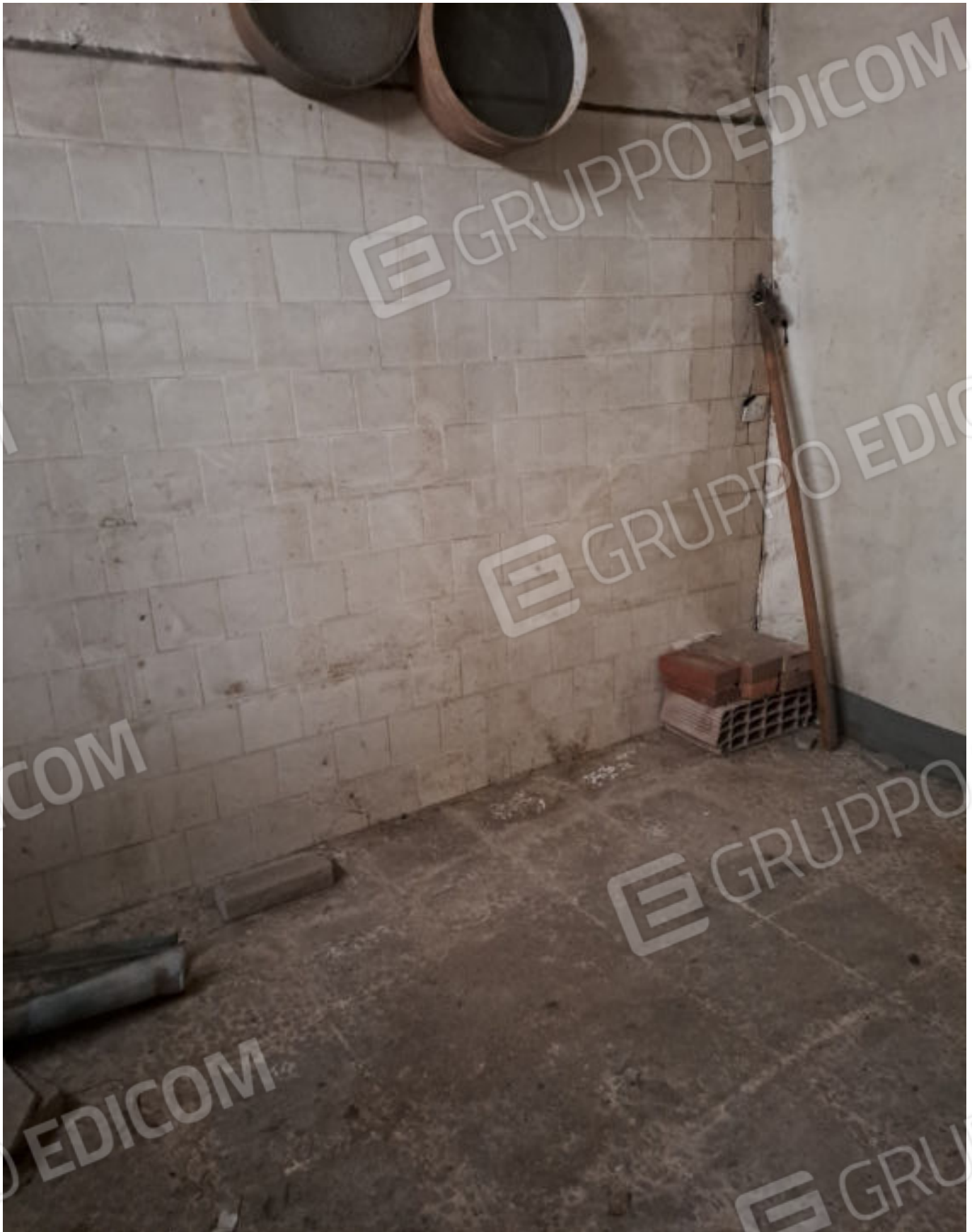
FOTO N. 2 ALTRA VISTA DEL LOCALE DEPOSITO RIPRESO DAI PRESSI DALL'INGRESSO PRINCIPALE