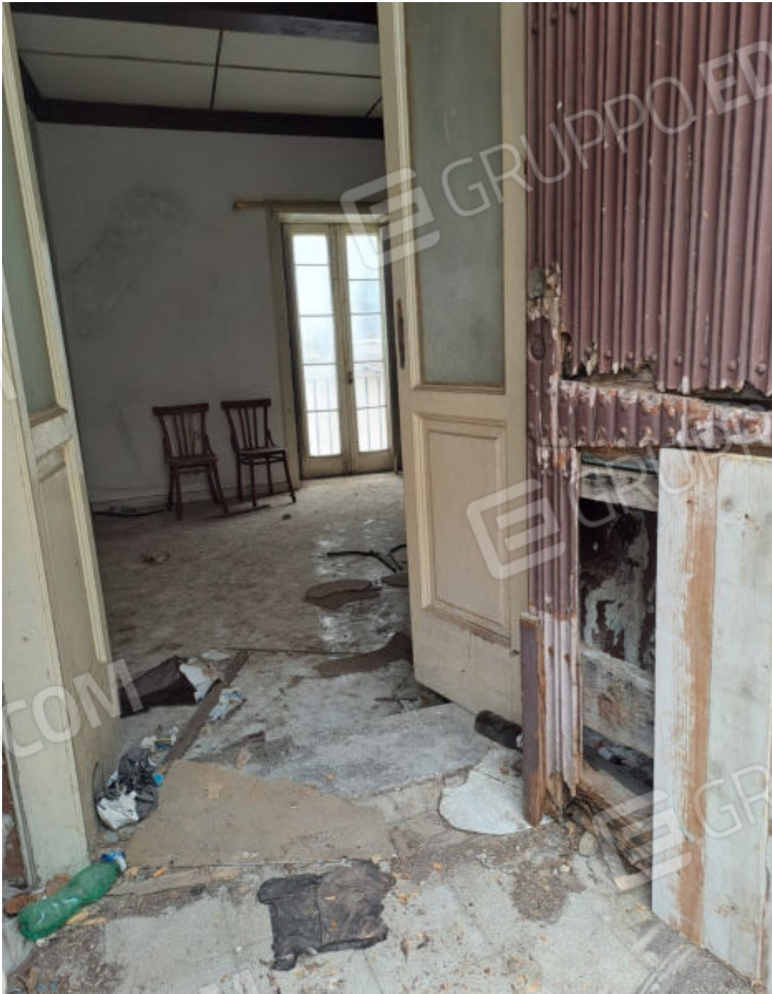
FOTO N. 4 VISTA DELL'INGRESSO PRINCIPALE E DELLO SCORCIO DEL SOGGIORNO-PRANZO AL PIANO PRIMO