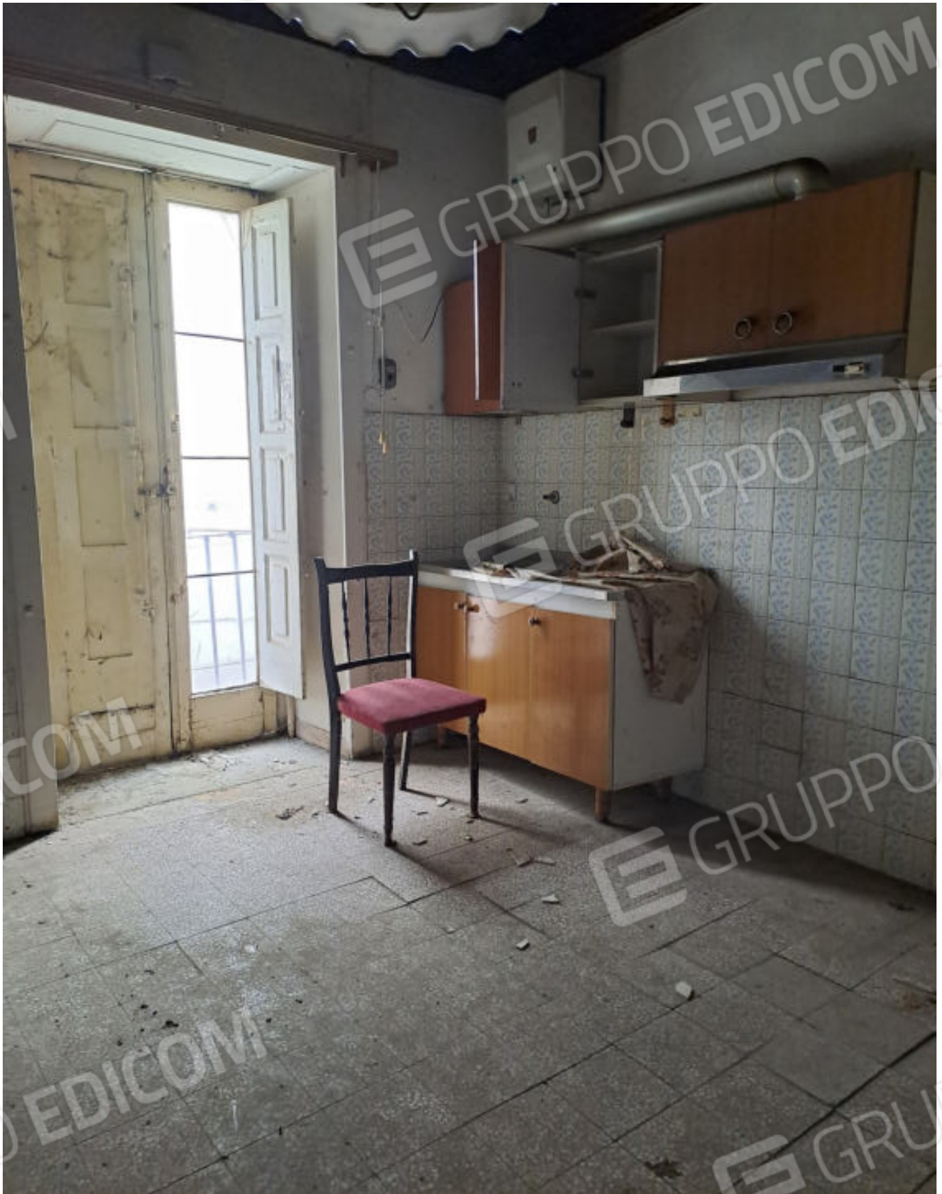
FOTO N. 6 VISTA DEL LOCALE CUCINA