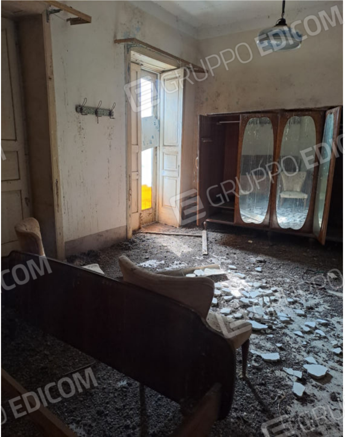
FOTO N. 11 VISTA DELL'ALTRO LOCALE LETTO UBICATO AL PIANO SECONDO