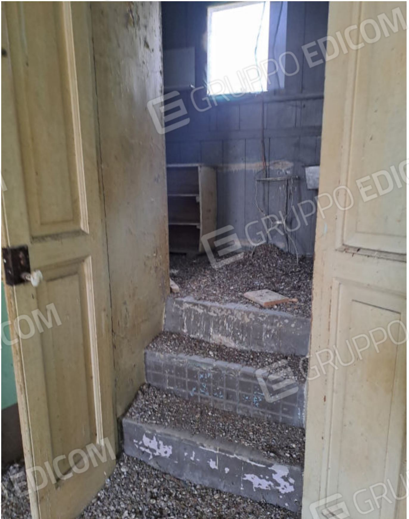
FOTO N. 1 VISTA DELL'ACCESSO E PARTE DELLA VERANDA CONTIGUA AL VANO LETTO OVE E' UBICATO IL BAGNO