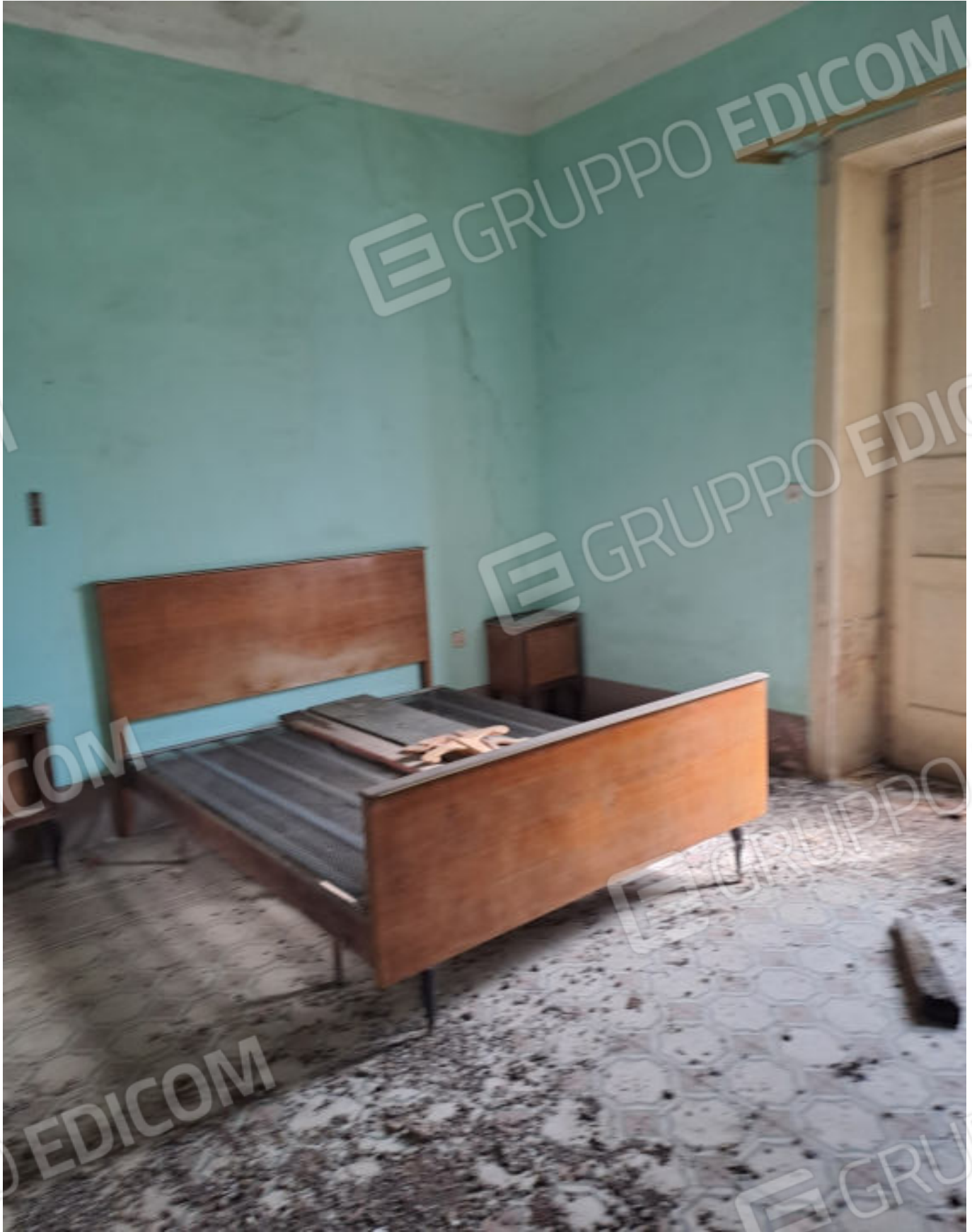
FOTO N. VISTA DEL LOCALE LETTO AL SECONDO PIANO