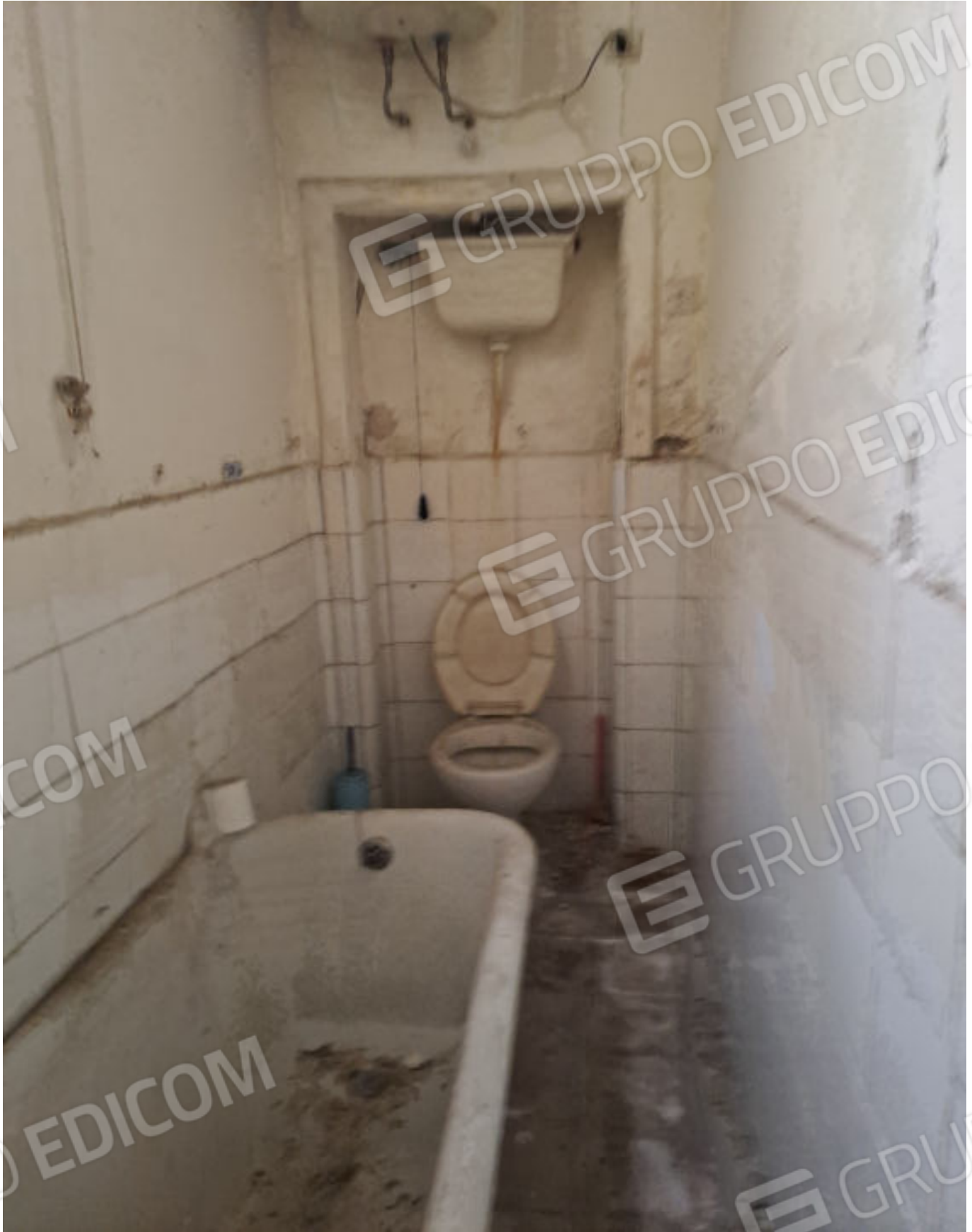
FOTO N. 7 VISTA DEL LOCALE BAGNO DEL PIANO PRIMO