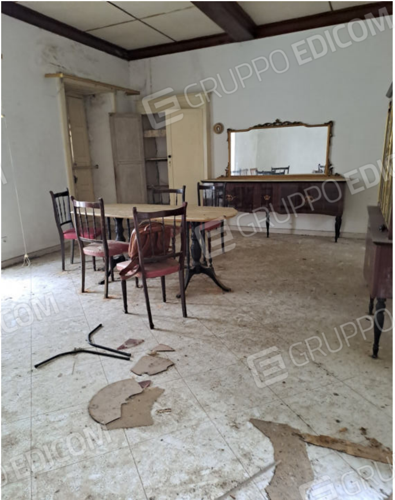
FOTO N. 5 ALTRA VISTA DEL LOCALE SOGGIORNO-PRANZO RIPRESO NEI PRESSI DELL'INGRESSO DALL'ESTERNO