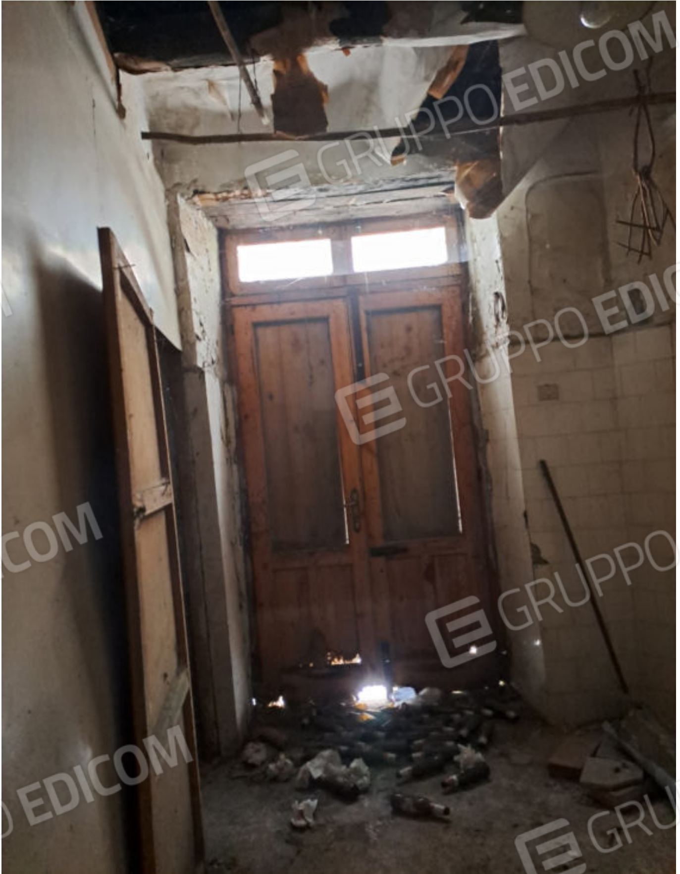
FOTO N.1 VISTA DELL'INGRESSO PRINCIPALE DEL LOCALE DEPOSITO AL PIANO TERRA