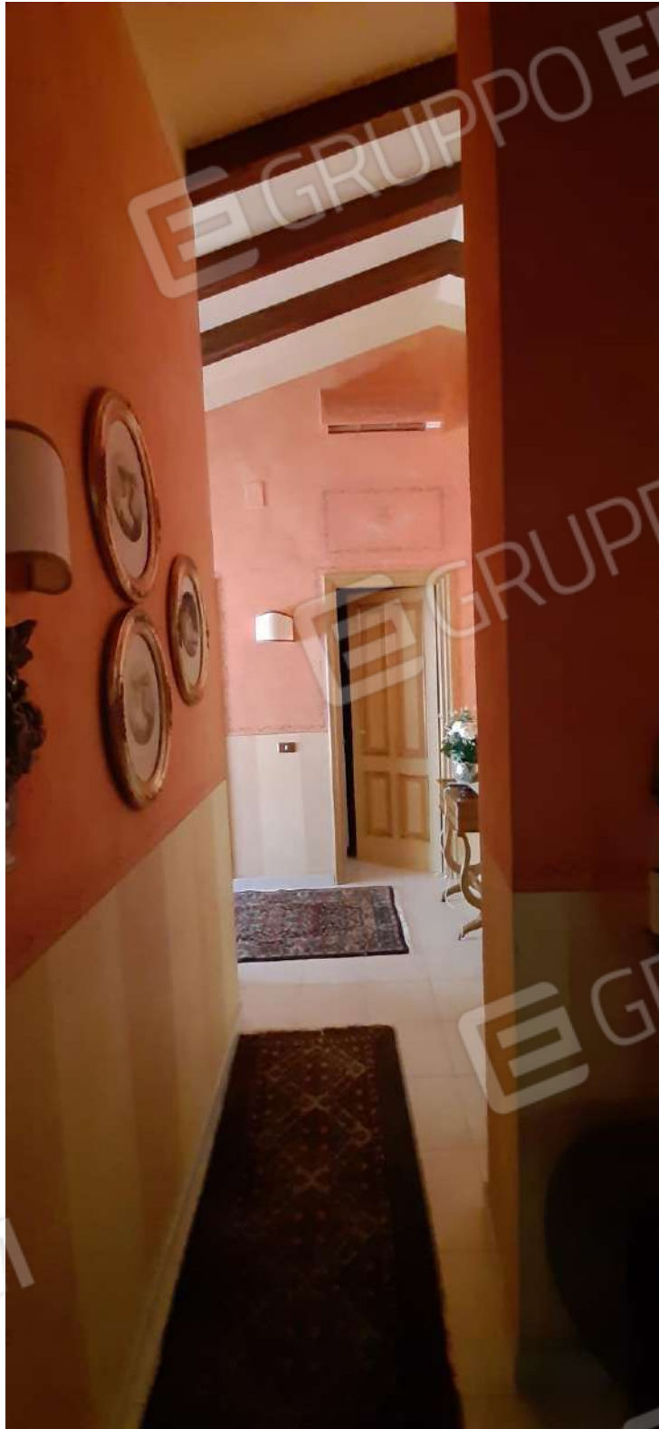
Foto n. 15 Disimpegno Piano Secondo