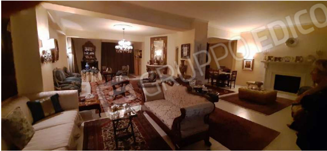
Foto n. 2__ Vista interna ingresso soggiorno PT