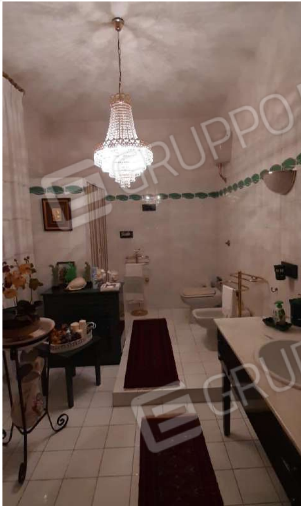
Foto n. 5__ Vista interna wc PT