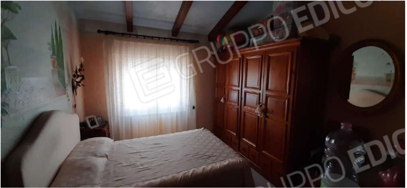
Foto n. 12__Letto 2 Piano Secondo