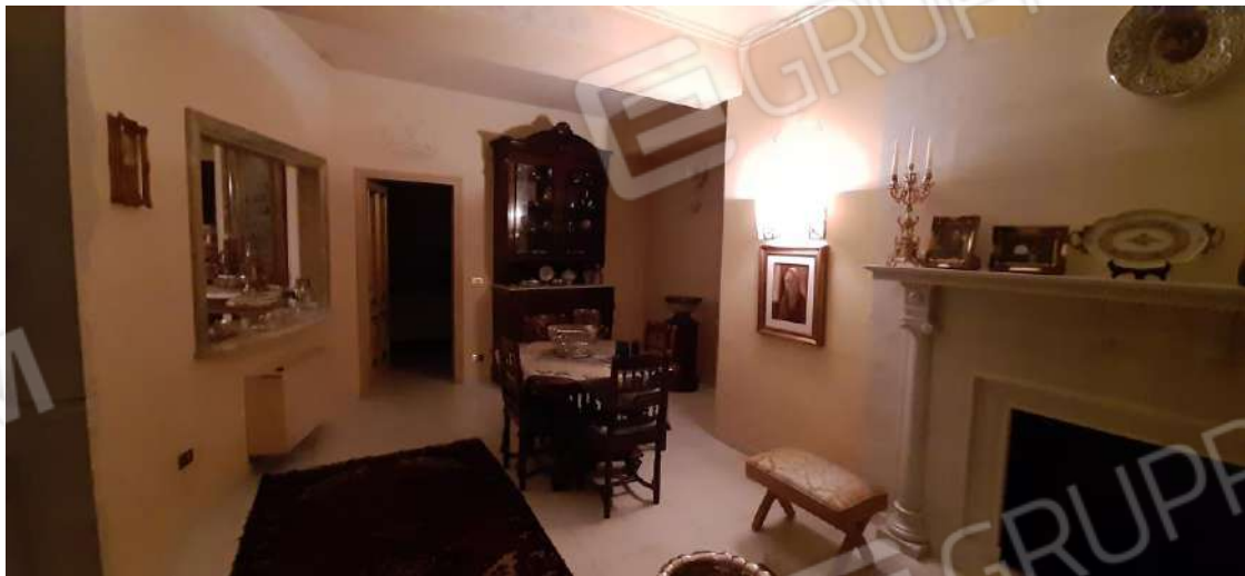
Foto n. 3__ Vista interna ingresso soggiorno PT