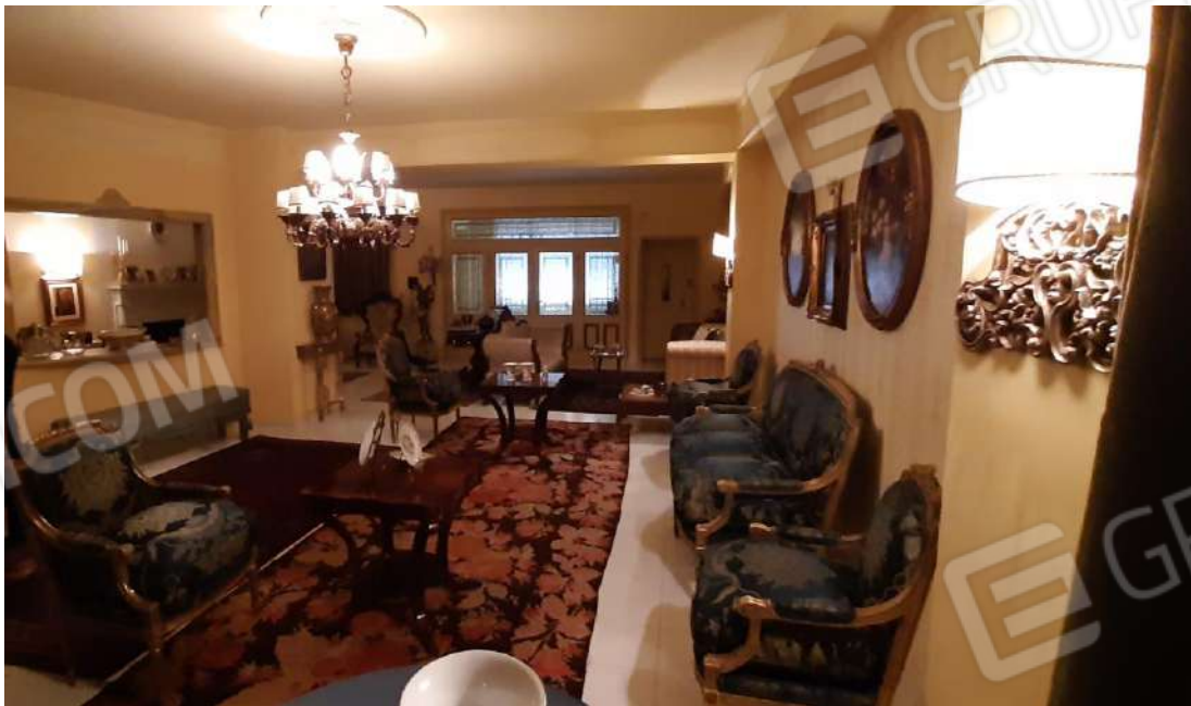
Foto n. 6__ Vista interna ingresso soggiorno Piano Terra