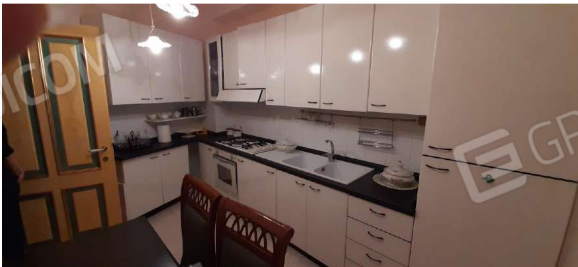
Foto n. 4__ Vista interna ingresso cucina Piano Terra