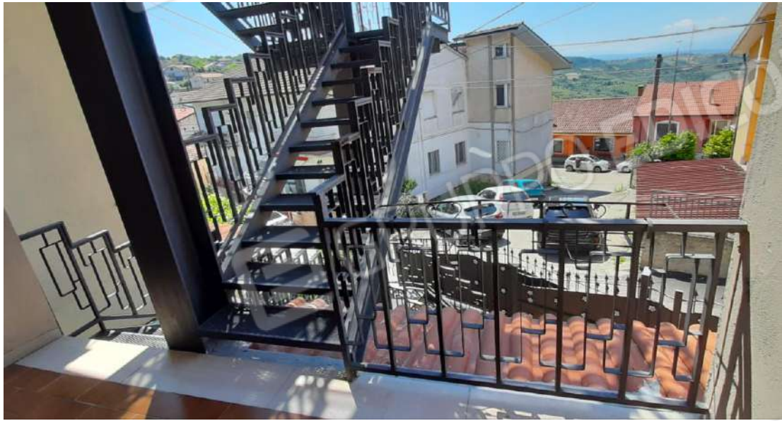
Foto n. 7__Balcone Piano Primo