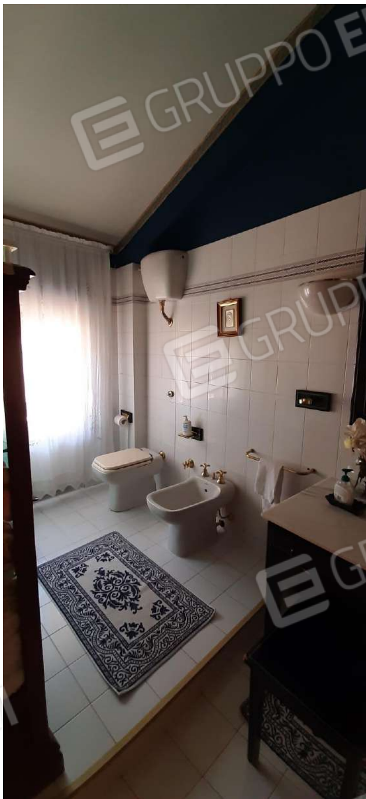
Foto n. 14__ Wc Piano Secondo