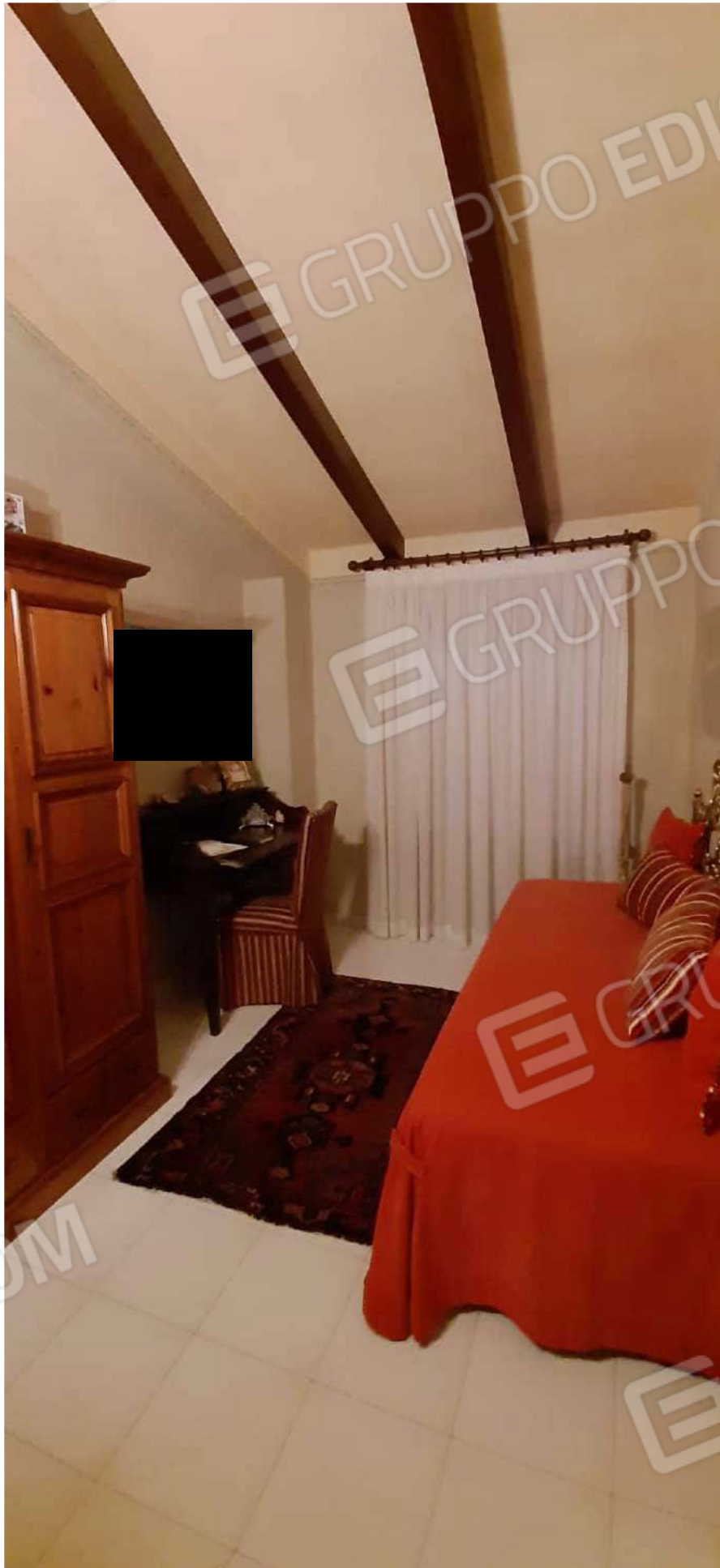
Foto n. 11__ Letto 1 Piano Secondo