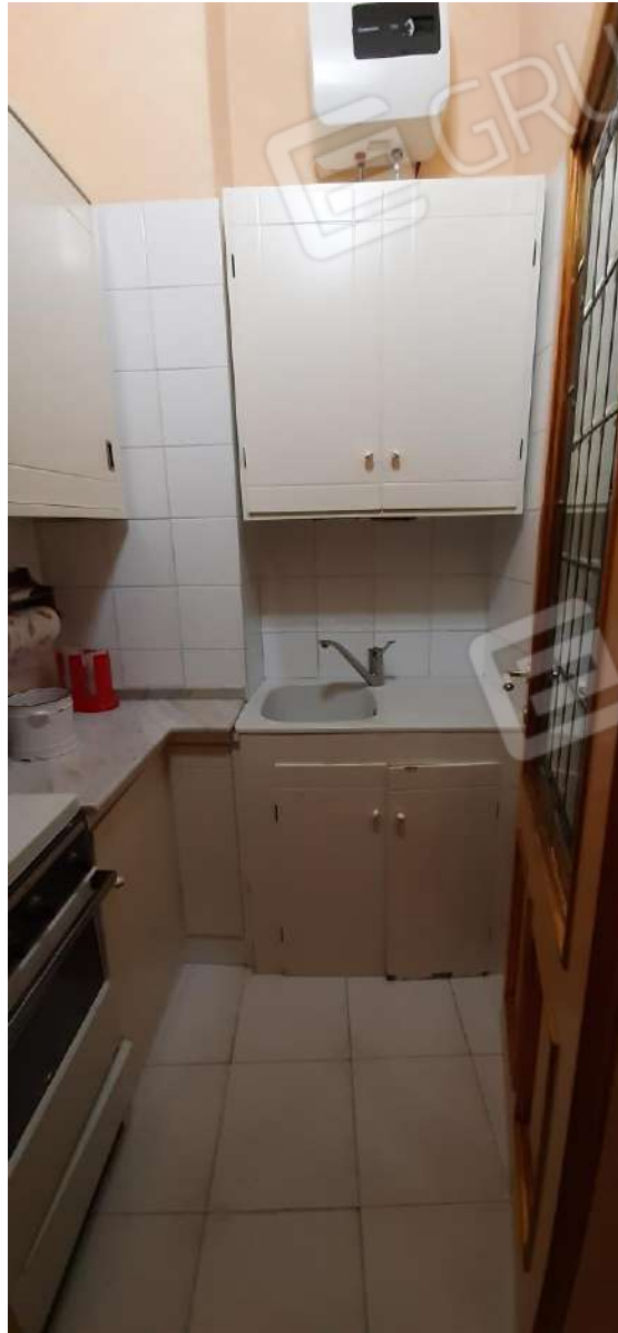
Foto n. 10__Tinello Piano Secondo