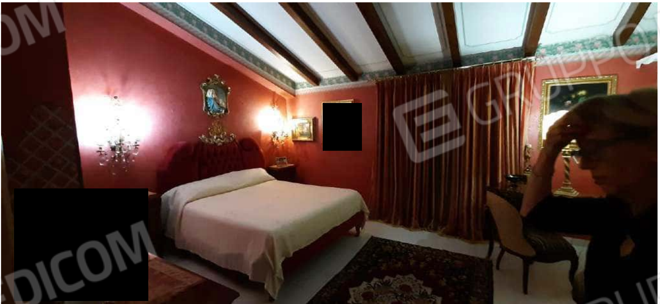
Foto n. 13__Letto 3 Piano Secondo