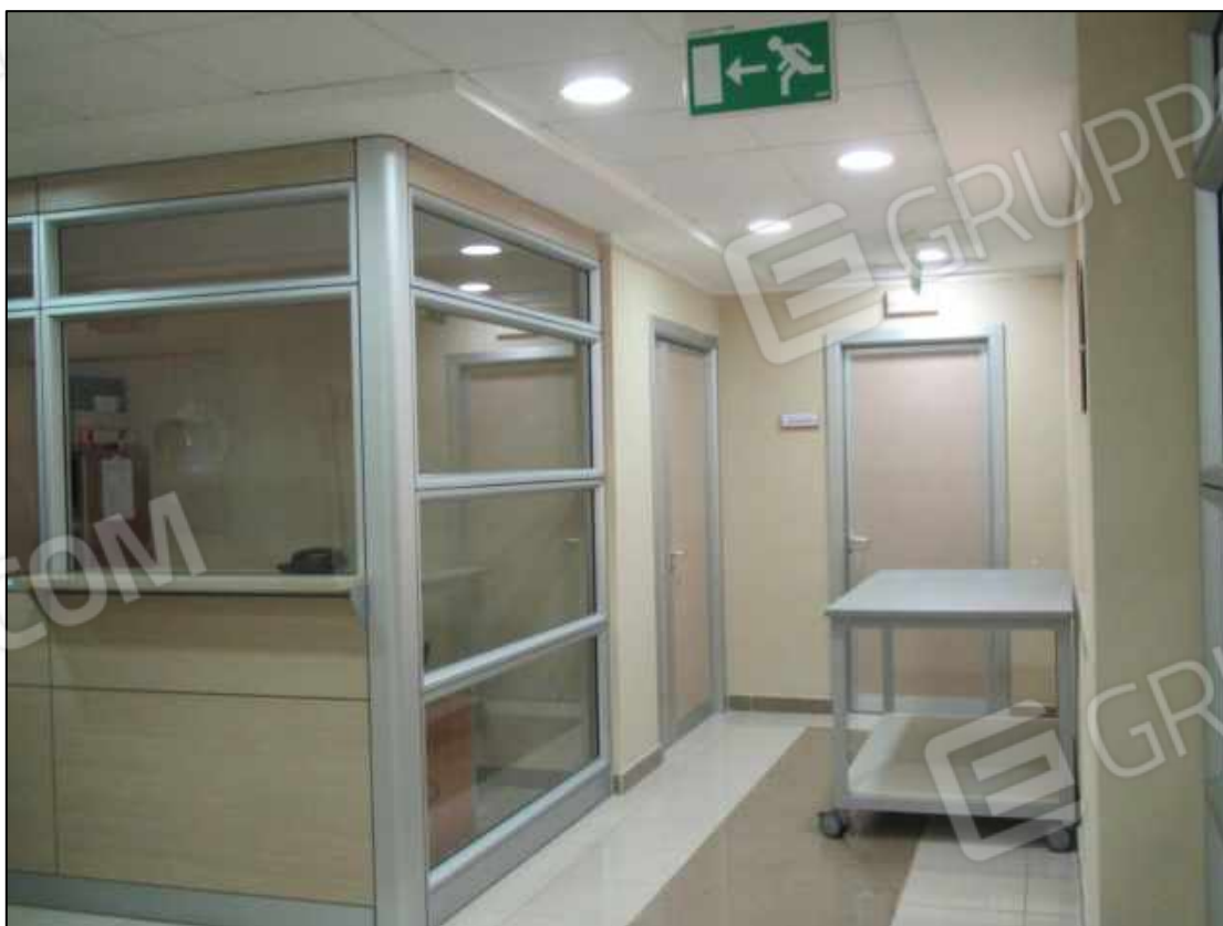
21. Ingresso e accettazione al secondo piano del Centro diagnostico G.B. Morgagni a Benevento, via Avellino n. 48. In Catasto fg. 101 p.lla 397 sub 34.