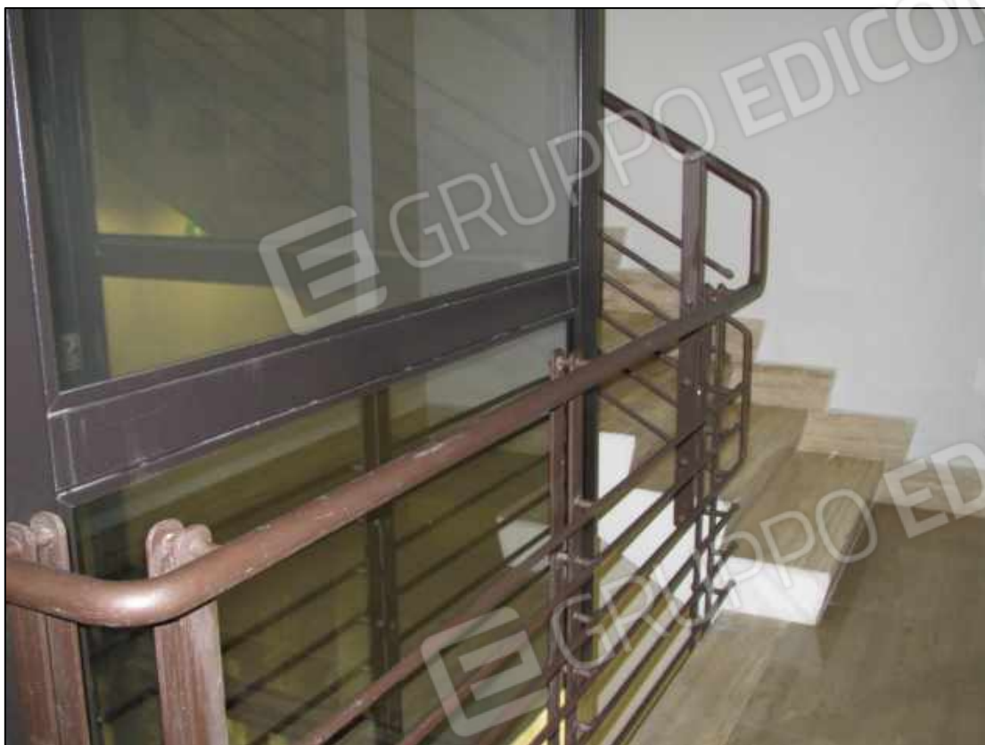
20. Pianerottolo al primo piano e scala interna di collegamento tra i livelli del fabbricato a Benevento, via Avellino n. 48.