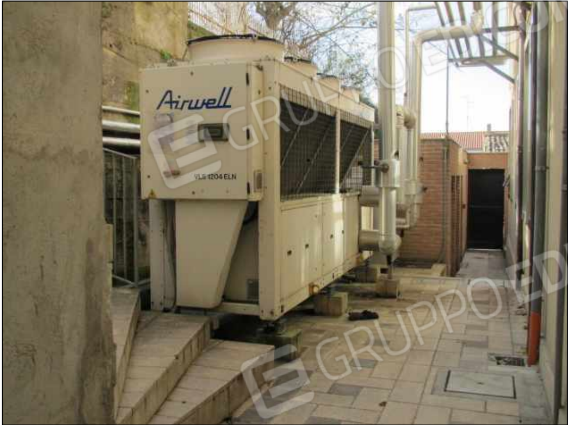
40. Spazi esterni al fabbricato in Benevento, via Avellino n. 48 (fg. 101 p.lla 397).