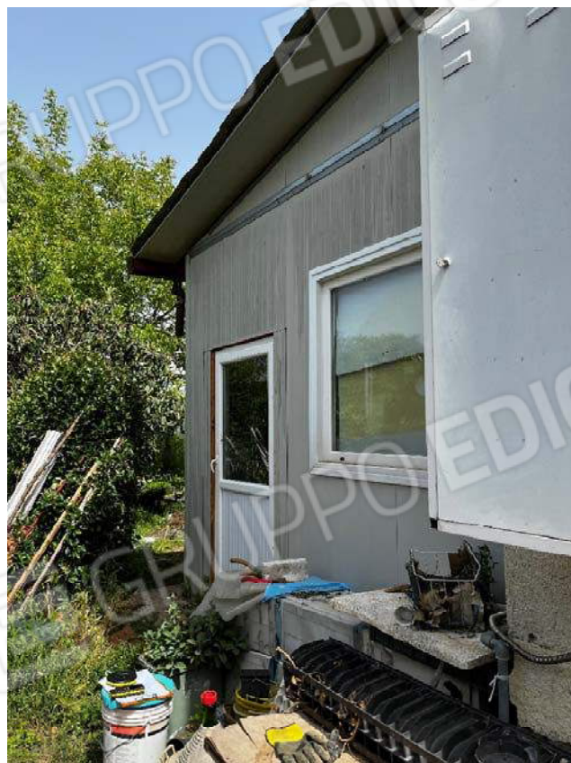
Foto n. 7: Accesso ai locali deposito sul lato posteriore del fabbricato