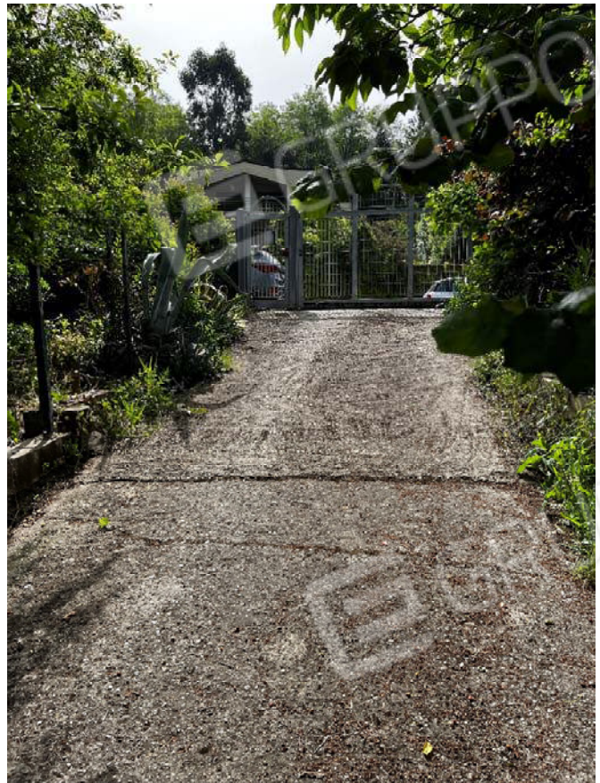
Foto n. 2: veduta della recinzione e dell'accesso lungo la strada pubblica