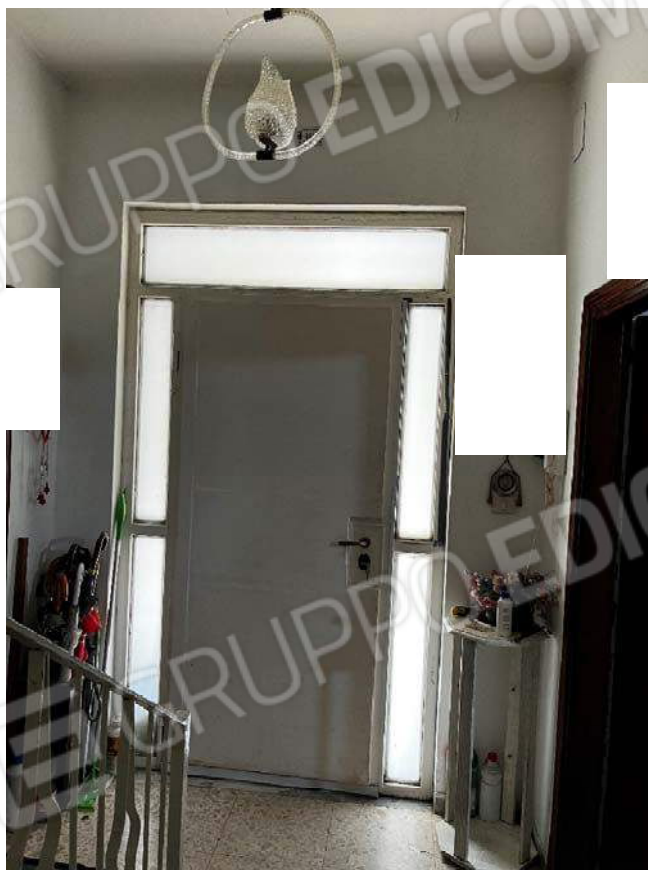
Foto n. 9: vano di entrata del fabbricato con scala di collegamento e portone di ingresso