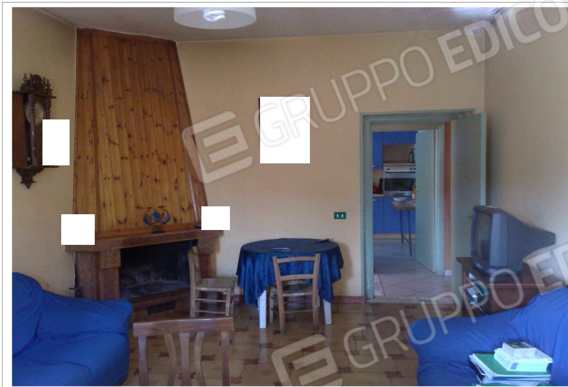
Foto n°3: Vista camera da pranzo piano primo unità immobiliare Fg. 14 p.lla n. 287;