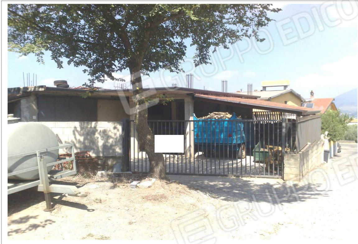
Foto n°9: Vista locale deposito unità immobiliare Fig. 14 p.lla n. 539;