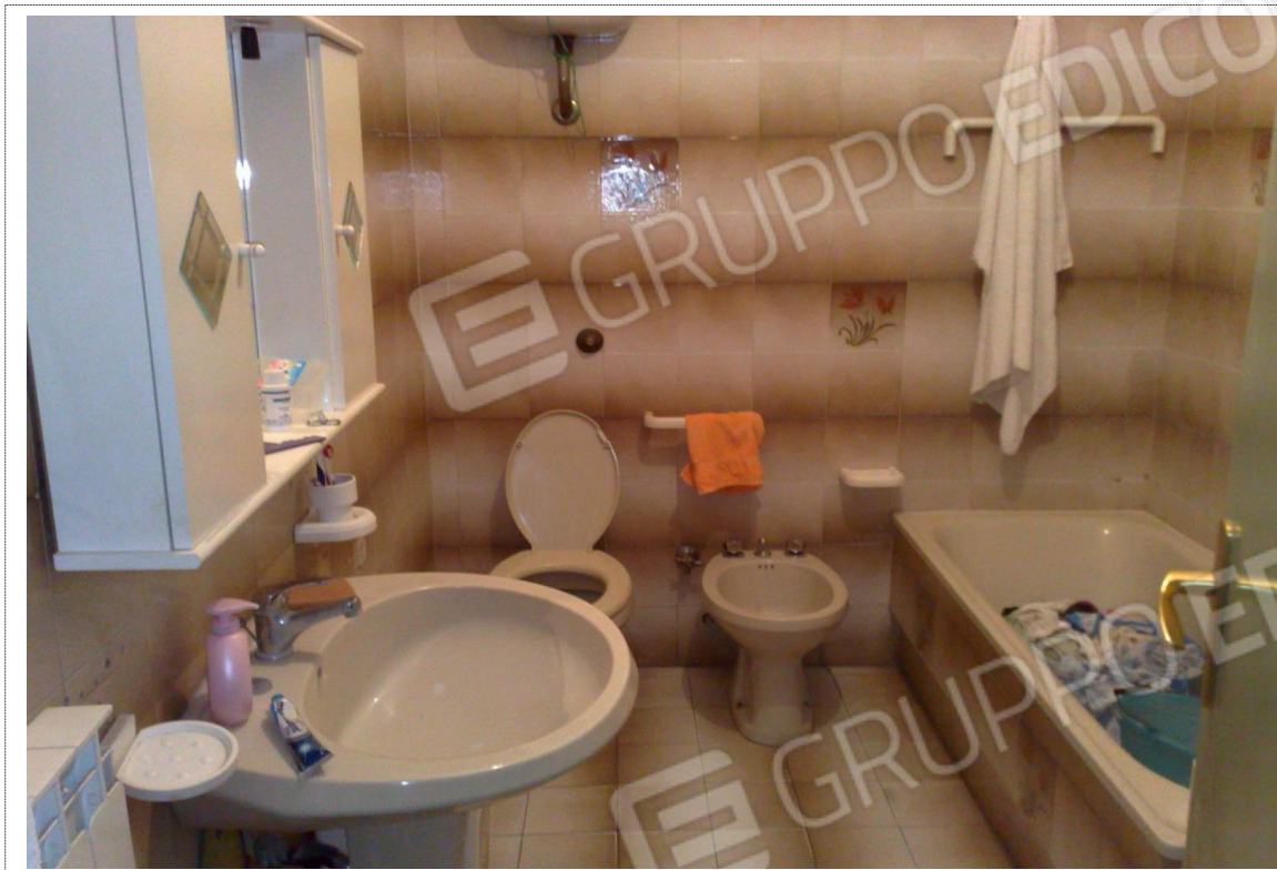
Foto n°5: Vista locale bagno piano primo unità immobiliare Fig. 14 p.lla n. 287;