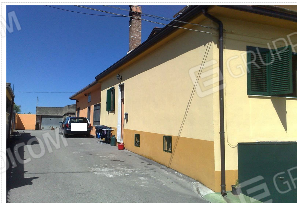
Foto n°2: Vista prospetto posteriore unità immobiliare Fig. 14 p.lla n. 287;