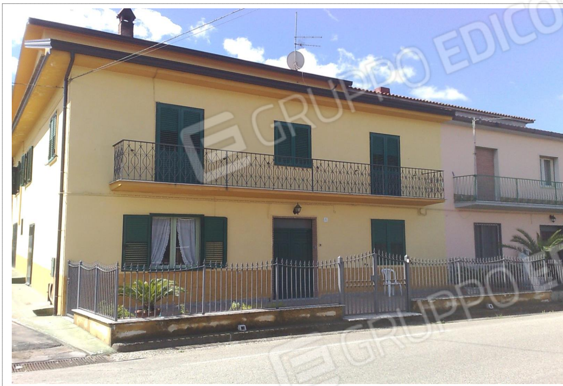
Foto n°1: Vista prospetto frontale unità immobiliare Fig. 14 p.lla n. 287;