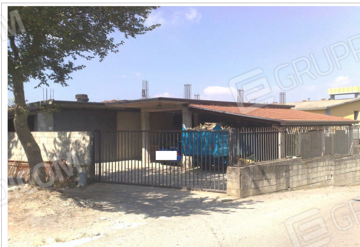
Foto n°10: Vista locale deposito unità immobiliare Fig. 14 p.lla n. 539;