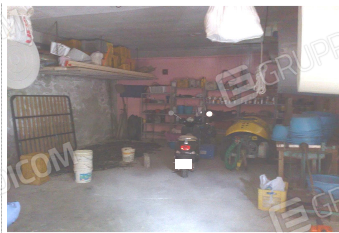
Foto n°8: Vista locale deposito unità immobiliare Fig. 14 p.lla n. 539;