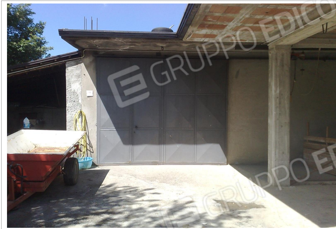
Foto n°7: Vista porta d'ingresso locale deposito unità immobiliare Fig. 14 p.lla n. 539;