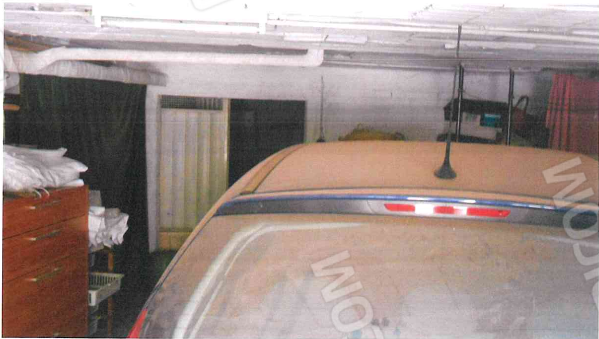
VISTA INTERNO LOTTO N. 2 CORPO B