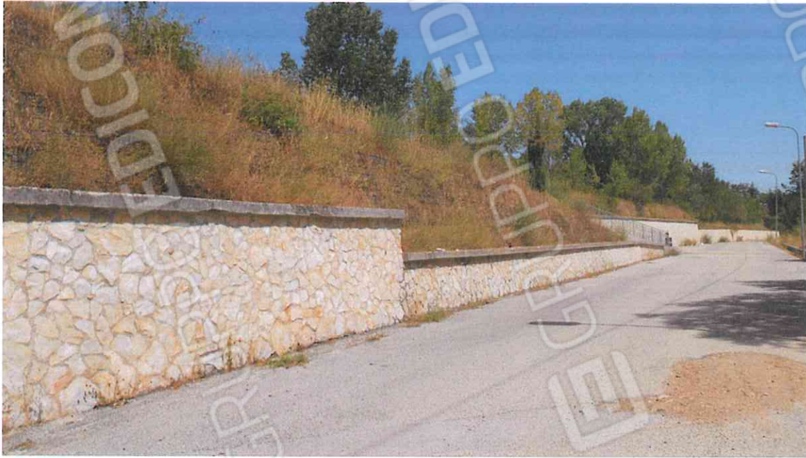
TERRENI IN VIA ADDOLORATA – LOTTO N. 9 CORPO A, CORPO B, CORPO C, CORPO D