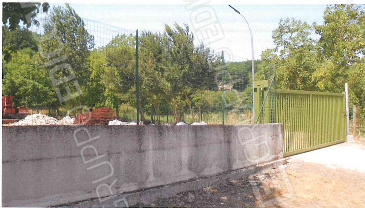
VISTA TERRENO FG. 12 P.LLA 79 CASTEL BARONIA – LOTTO N. 11 CORPO A