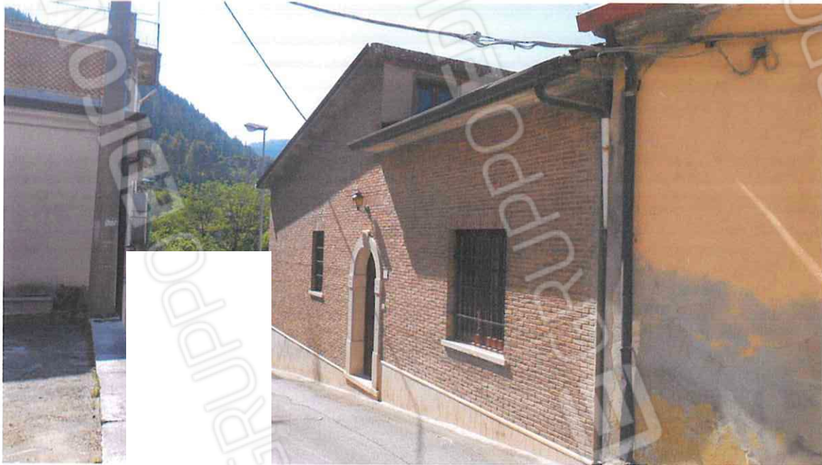
PROSPETTO PRINCIPALE E LATERALE DEL FABBRICATO IN VIA CROCE – LOTTO N. 1 CORPO A