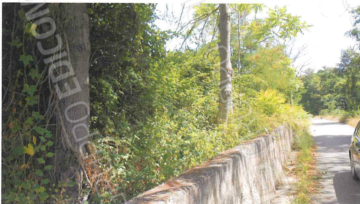
VISTA TERRENI IN VIA IMPISE – LOTTO N. 8 CORPO A, CORPO B, CORPO C, CORPO D, CORPO E, CORPO F