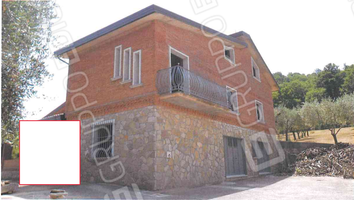
VISTA FABBRICATO IN VIA IRPINIA IN CORSO DI COSTRUZIONE – LOTTO N. 3 CORPO A