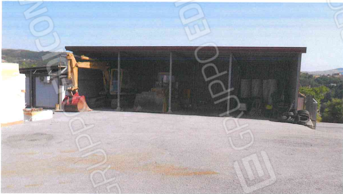
VISTA PENSILINA E CONTAINERS DA RIMUOVERE – LOTTO N. 5 CORPO A