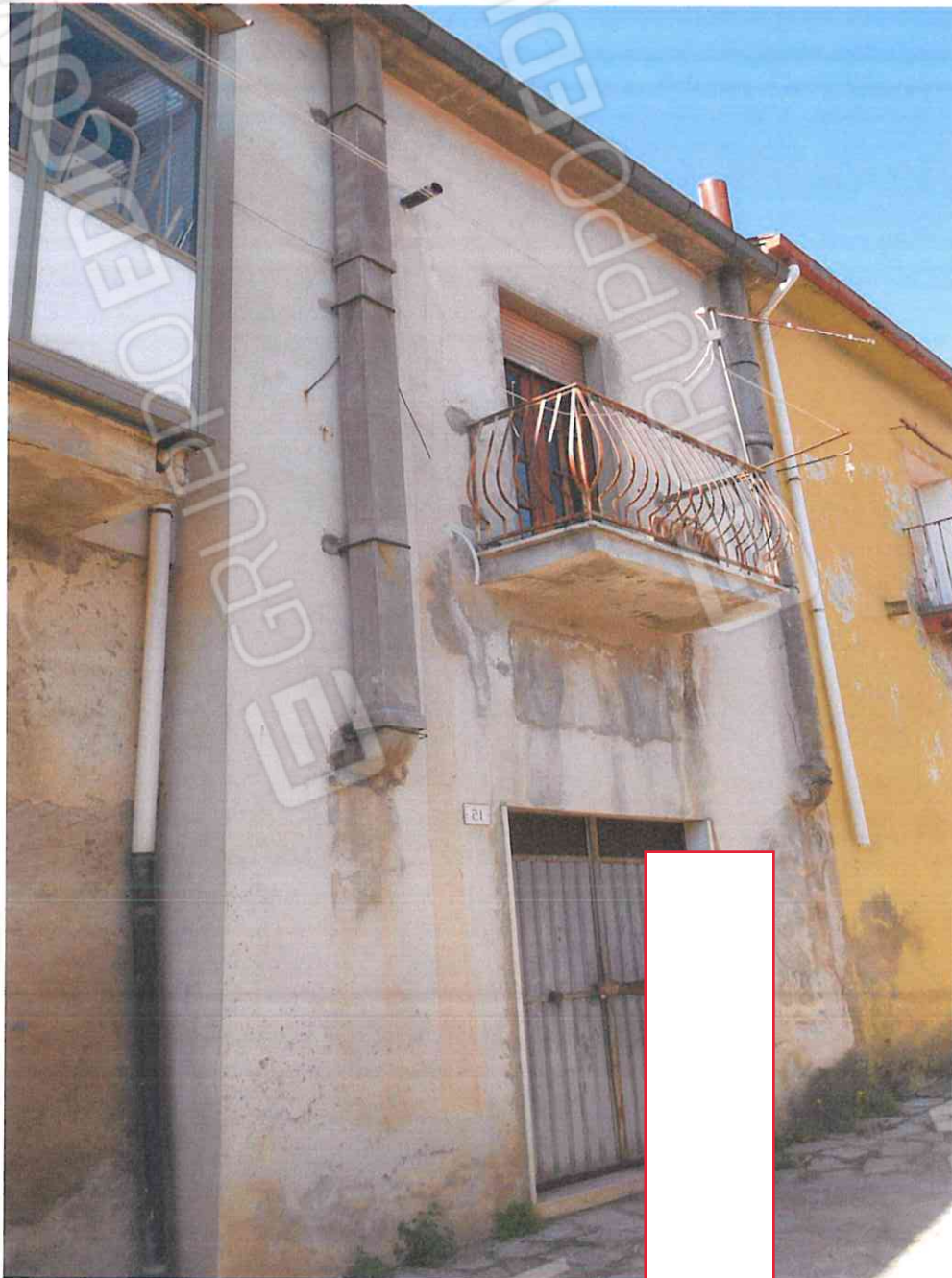
PROSPETTO PRINCIPALE PIANO TERRA DEPOSITO IN VIA CROCE – LOTTO N. 1 CORPO B