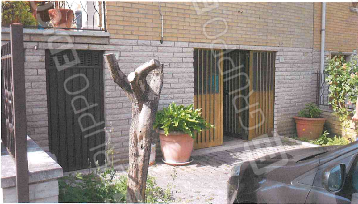
VISTA INGRESSO SU VIA BORGIO PRINCIPE DI PIEMONTE – LOTTO N. 2 CORPO B