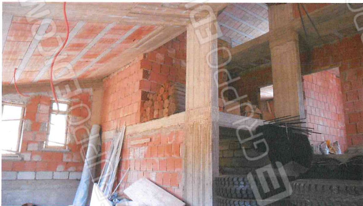
INTERNO FABBRICATO IN CORSO DI COSTRUZIONE – LOTTO N. 3 CORPO A