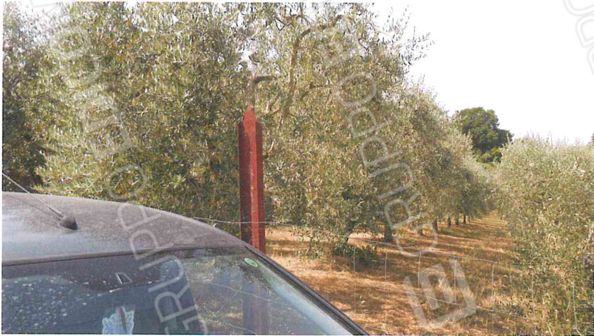
FOTO ULIVETI IN VIA IRPINIA – LOTTO N. 7 CORPO A, CORPO B, CORPO C , CORPO D