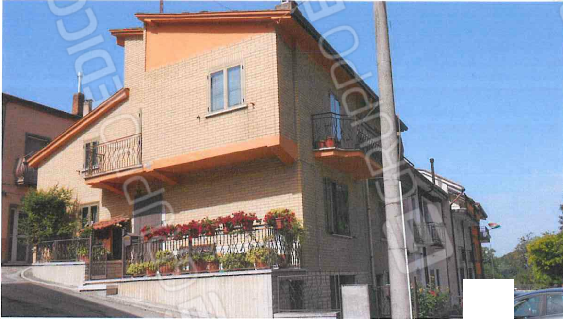
FABBRICATO IN VIA BORGO PRINCIPE DI PIEMONTE – LOTTO N. 2 - CORPO A 1° e 2° PIANO, CORPO B PIANO SEMINTERRATO