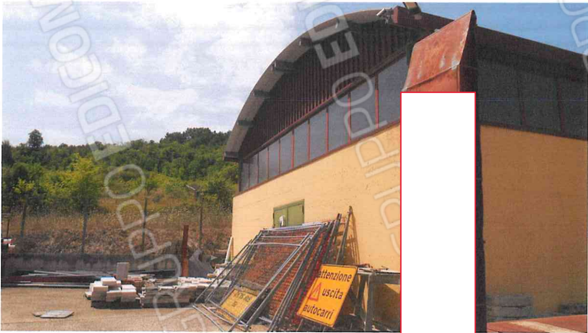
CAPANNONE IN VIA IRPINIA FG. 8 P.LLA 486 – LOTTO N. 5 CORPO A