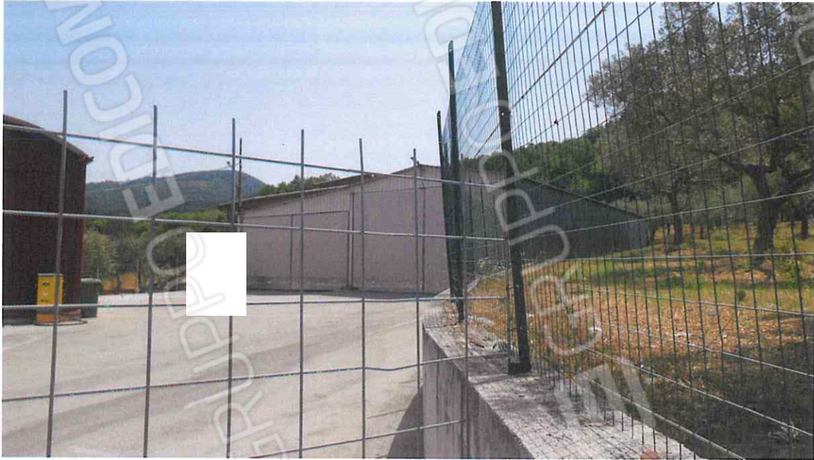
VISTA CAPANNONI DA DEMOLIRE IN VIA IRPINIA – LOTTO N. 4 CORPO A