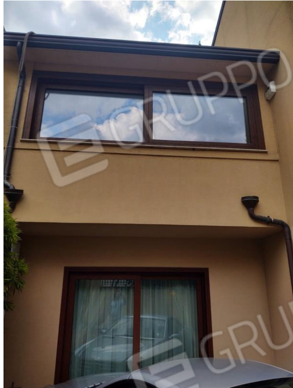
Figura 9 - terrazzo coperto primo piano - vista dall'esterno