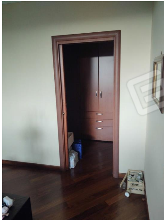
Figura 4 - Locali servizi piano interrato