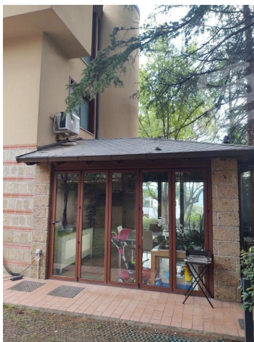
Figura 2 - Porticato chiuso non sanabile