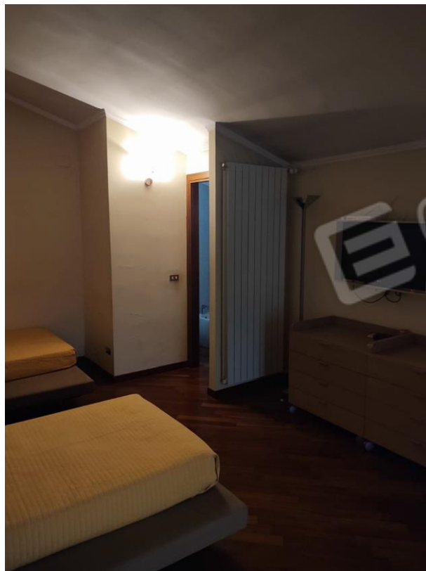
Figura 10 - Mansarda