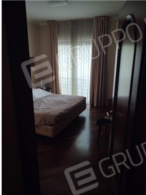
Figura 7 - camera letto piano primo