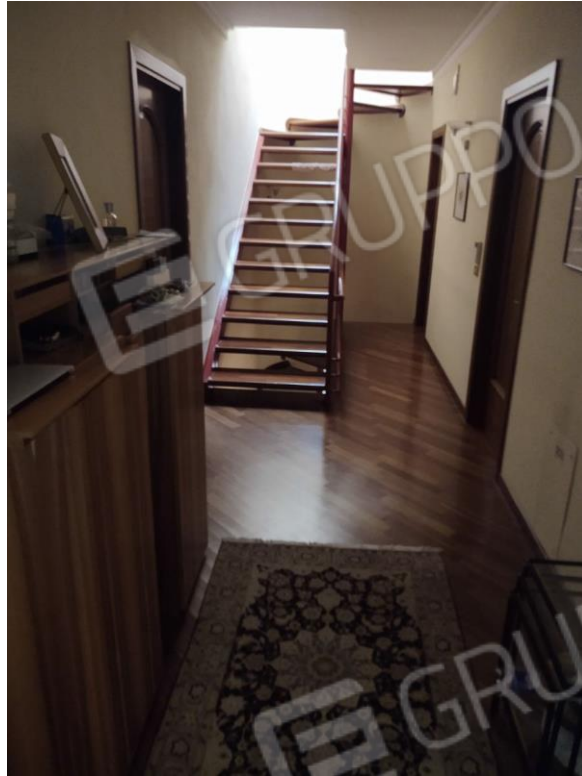
Figura 5 - zona notte piano primo