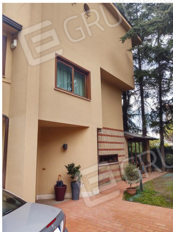
Figura 1 - Prospetto frontale - ingresso piano terra