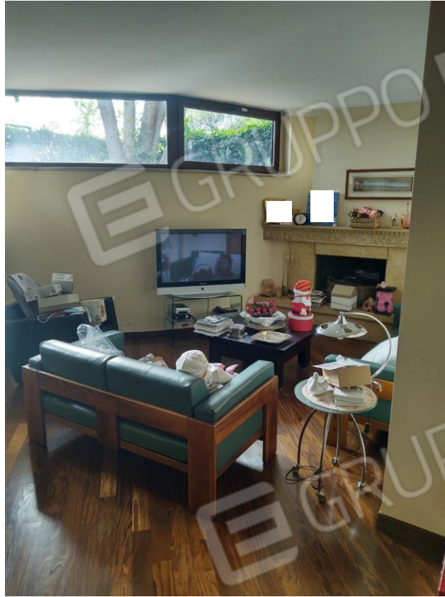
Figura 3 - Taverna piano interrato