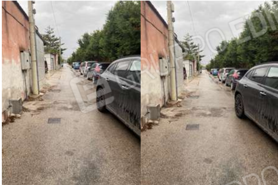
VIASTA VIA HENRI MATISSE