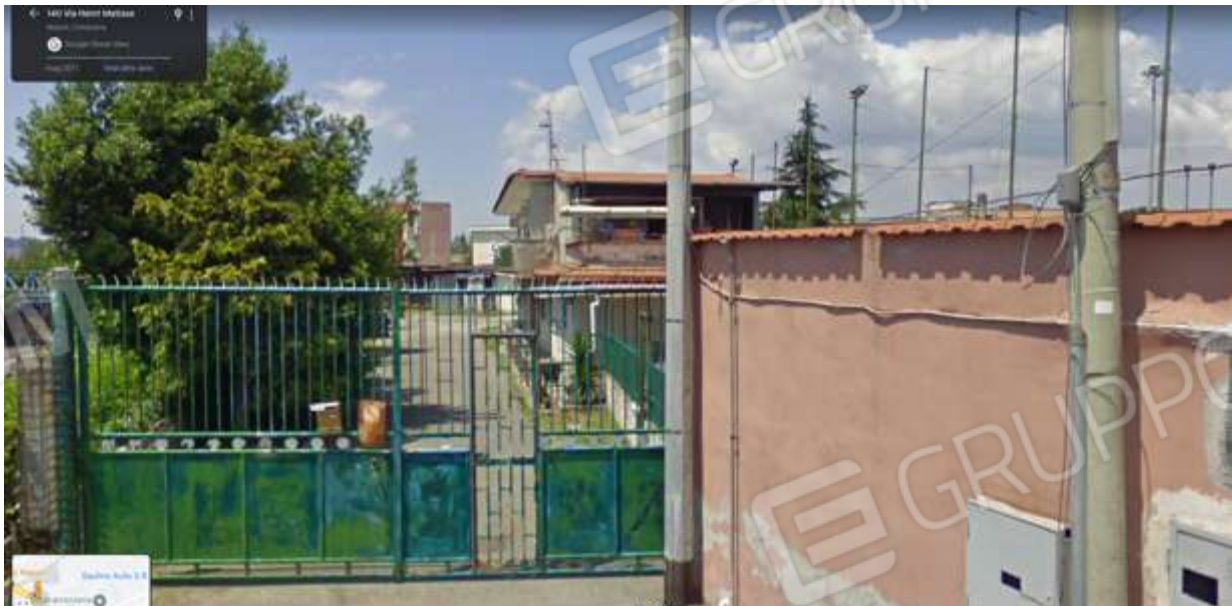
VISTA INGRESSO PEDONALE E CARRABILE